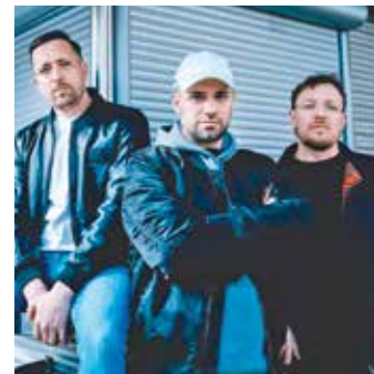
Die Antilopen Gang hat die deutsche Rap- und Hip-Hop-Szene so geprägt wie kaum eine andere Band. Im September kommen sie erstmals in die weiße Zeltstadt!

Vom 22. August bis 7. September 2025 heißt es wieder „Endlich Urlaub“ am Kemnader See. Das Zeltfestival Ruhr (ZfR) bietet ein abwechslungsreiches Programm mit Musik-, Comedy- und Kabarett-Highlights. Mit 29 von bis zu 40 Shows ist bereits über die Hälfte des Programms bestätigt. Die Antilopen Gang kommt am 5. September ans ZfR. Der unverwechselbare Humorstil voller Kampfegeist macht sie so besonders, auch die Vielfältigkeit im Sound ist einzigartig. Zuletzt begeisterten sie Fans und Presse