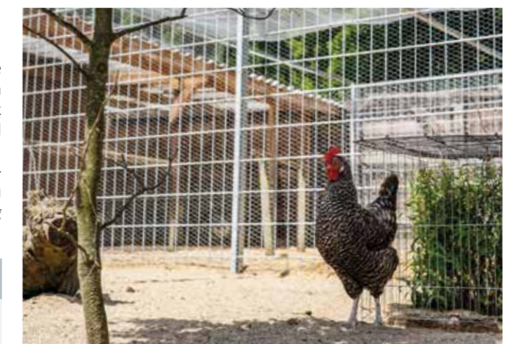
Im beliebten Streichelzoo am Hohenstein hat sich in den letzten Wochen einiges getan! Die engagierten Kollegen vom städtischen Betriebshof – Abteilung Grünflächen – waren im Einsatz, um das Gehege der gefiederten Bewohner grundlegend zu erneuern. Das alte Gehege war schon ein bisschen in die Jahre gekommen: Das Holz war verwittert, die Drähte wurden brüchig. Nun gibt's neue stabile Zäune und frische Drähte. Die 31 Hühner, Hähne, Pfauen und Co. freut es.