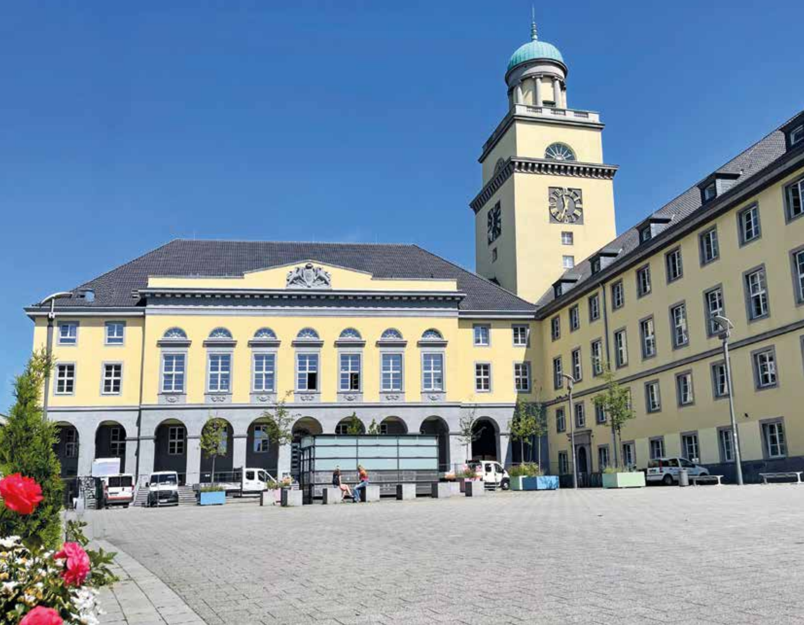
Nach Jahren des Umbaus ist das Wittener Rathaus fertig! Am 4. u. 5. Juli wird der Abschluss der Bauarbeiten mit dem Rathaus-Fest begangen. Mehr zum Umbau lesen Sie auf S. 4 + 5.

+++ 4 MONATSMAGAZINE: GESAMTAUFLAGE CA. 90.000 EXEMPLARE +++ HAUSHALTSVERTEILUNG +++ ☎ 02302 9838980 +++ WWW.IMAGE-WITTEN.DE +++