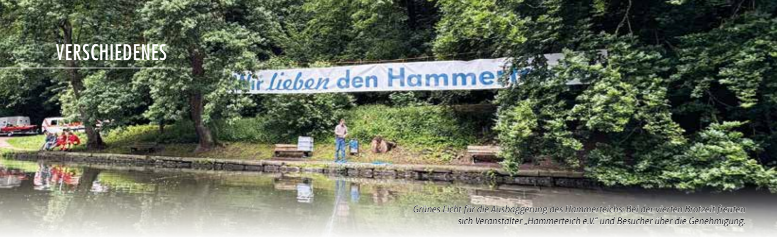
Grünes Licht für die Ausbaggerung des Hammerteichs: Bei der vierten Brotzeit freuten sich Veranstalter „Hammerteich e.V.“ und Besucher über die Genehmigung.