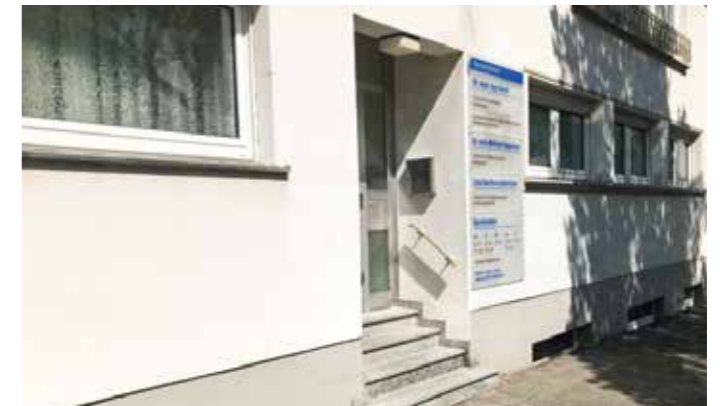
Der Hausarzt schließt seine Praxis in der Hörder Straße 343 in Stockum.

Wenn eine „Übersorgung“ vorliegt, wird der Bereich für neue Praxen gesperrt.