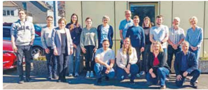
Um für die Zukunft gewappnet zu sein, tagte der Runde Tisch zum Thema „Hitzeaktionsplanung im EN-Kreis“ jetzt zum zweiten Mal.

Die Installationskosten als auch die Betriebsorganisation stellen je-