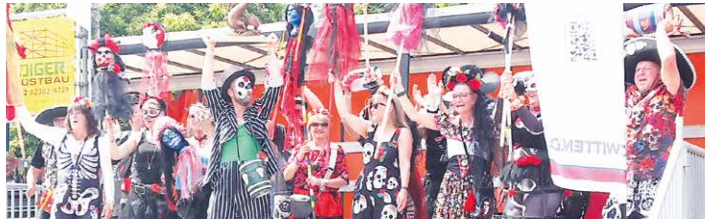
Gewinner des Kostümpreises 2024: die „Wattwürmer“. - Das diesjährige Fest war leider erst nach Drucklegung unseres Magazins.

Der 22. School Dragon Battle, der Schüler-Cup, ist am Samstag, 5. Juli!