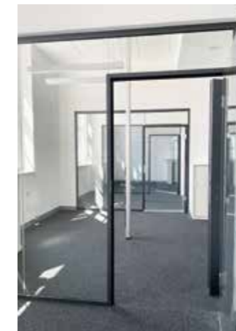
Aus vorher großen Büros inkl. Platz für Besprechungen sind nun kleinere Büroräume mit separaten Besprechungsräumen geworden, damit diese effizienter genutzt werden können. Ein elektronisches Buchungssystem organisiert die Raumbuchung nun.

Der Südflügel ist nun komplett für das Frontoffice vorgesehen. Hier findet der meiste Bürgerverkehr statt. „Digitale Strukturen, eine hohe und schnelle Servicequalität zeichnen diesen Bereich aus“, lobt Lars König. Der Nordflügel ist hauptsächlich für das Backoffice, Fraktionen, Dezernten, den Kämmerer und den Bürgermeister vorgesehen. Aber auch das Trauzimmer befindet sich im Erdgeschoss des Nordflügels. „Dieses fasst nun ca. 20 Personen und macht auch wieder Trauungen im Rathaus ohne Raummiete möglich“, erklärt König. Ca. ab August werden hier Trauungen möglich sein.