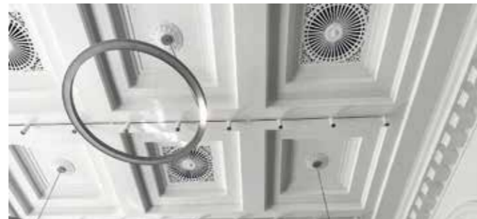
Auch Luftauslässe wurden in den Decken gefunden. Diese waren historisch mit Stuck verziert. Da diese aber nicht brandschutzkonform waren, wurden die neuen Lüftungen nun den originalen brandschutzkonform nachempfunden.