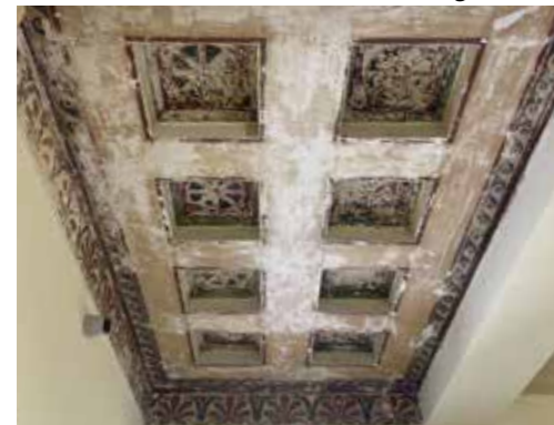
Bei den Sanierungsarbeiten wurden Deckenmalereien von 1926 freigelegt, welche nun als eine Art Schaufenster in die Vergangenheit zur Schau gestellt werden.