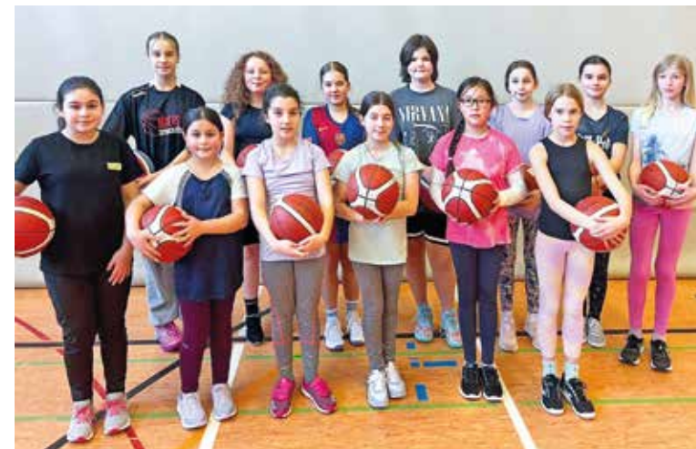
Welches Mädchen möchte Basketball lernen? Bei den Sprockhövel Miners gibt es dazu die Gelegenheit.