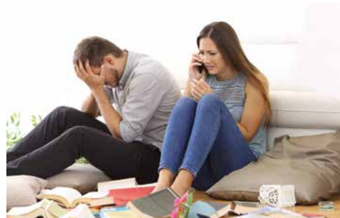
Der Schock nach einem Einbruch ist groß - umso wichtiger, dass zumindest die materiellen Schäden durch eine Versicherung abgedeckt sind.

Neben Wertgegenständen wie Schmuck, Laptops oder Smartphones deckt eine Hausratversicherung oft auch den Missbrauch gestohlener Bankkarten sowie den Diebstahl persönlicher Gegenstände am Arbeitsplatz oder im Krankenhaus ab. Viele Versicherer übernehmen zudem Schäden durch Fahrrad-Diebstahl. Für hochwertige Fahrräder, Pedelecs oder E-Bikes – die besonders oft gestohlen werden – empfiehlt sich eine spezielle Fahrradversicherung. Ein Rundumschutz, der zusätzlich Schäden durch Unfälle, Stürze oder Vandalismus abdeckt, bietet hier die beste Absicherung.