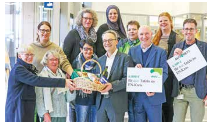
Die Vertreterinnen der Tafelläden freuen sich über die Spende der AVU und der AVU Netz.

Diese Tafelläden erhalten eine Spende: Tafelladen Gevelsberg, Tafelladen Schwelm, Der Tafelladen Ennepetal, Hattinger Tafel e.V. (Hattinger und Sprockhövel), Wetteraner Brotkorb e.V.