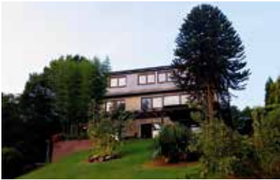
Bochum-Linden | Zweifamilienhaus mit traumhaftem Blick ins Ruhrtal | Wohnfläche: 259 m 2 , Grundstücksfläche: 3.285 m 2 , 9 Zimmer, Baujahr: 1982, Preis: 829.000€, Ölheizung, Verbrauchsausweis, Klasse C, Endenergieverbrauch: 89,8 kWh/(m 2 *a)