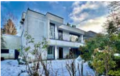
Bochum-Wiemelhausen | Zweifamilienhaus mit Einliegerwohnung und Blick ins Grüne | Wohnfläche: 270 m 2 , Grundstücksfläche: 608 m 2 , 6 Zimmer, Baujahr: 1974, Preis: 749.000€, Fernwärme, Verbrauchsausweis, Klasse E, Endenergieverbrauch: 137,8 kWh/(m 2 *a)