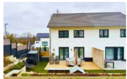
Sprockhövel | Neubau-Doppelhaushälfte: Zeitlos, attraktiv und nachhaltig | Wohnfläche: 154 m 2 , 5 Zimmer, Fußbodenheizung, Baujahr: 2020, Preis: 819.000€, Wärmepumpe, Bedarfsausweis, Klasse A, Primärenergiebedarf: 32,0 kWh/(m 2 *a)