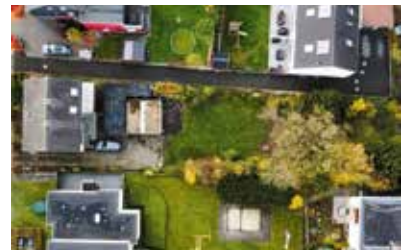
Bochum-Weitmar | Großzügiges Grundstück mit vielfältigen Bebauungsoptionen | Grundstücksfläche: 1.047 m 2 , Preis: 379.000€, fußläufig zum Ortskern Weitmar sowie dem Naherholungsgebiet, ansprechende Nachbarschaftsbebauung