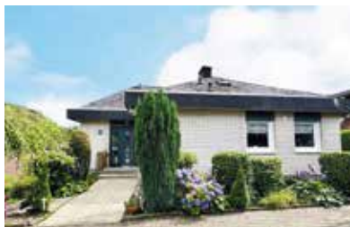
Ennepetal-Voerde | Ihr neues Zuhause: Stilvolles Wohnen mit großzügigem Traumgarten | Wohnfläche: 246 m 2 , Grundstücksfläche: 1.137 m 2 , Anzahl Zimmer: 7, Baujahr: 1976, Preis: 599.000€, Erdgas, Verbrauchsausweis, Klasse B, Endenergieverbrauch: 66,3 kWh/(m 2 *a)