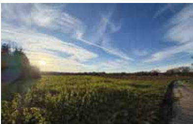
Hattingen-Niederwenigern | Exklusives Baugrundstück mit unverbaubarer Aussicht in Traumlage | Grundstücksfläche: 1.439 m 2 , Preis: 449.000€, vielfältige Nutzungsmöglichkeiten, etablierte Nachbarschaftsstruktur, gute Zuwegung