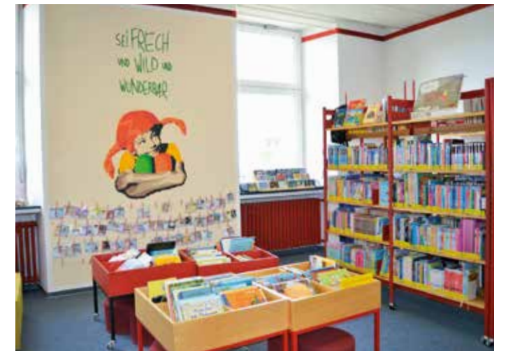
Die Stadtbücherei Sprockhövel bietet viele Aktionen für begeisterte Leser und solche, die es werden wollen.

Die Stadtbücherei Sprockhövel bietet am 25. und 27. März jeweils von 16.30 Uhr bis 18.30 Uhr einen zweitägigen Workshop für Kinder der 3. bis 5. Klasse an. Hier lernen die Teilnehmenden mit der „Tippmaus“ auf spielerische Weise die Grundlagen des schnellen und professionellen Tippens. Geleitet wird der Schnupper-Workshop von Silvia Wolko, der Gründerin von Tippmaus.de. Ihr innovatives Lernsystem zielt darauf ab, das langsame „Adler-Suchsystem“ – bei dem nur wenige Finger zum Einsatz kommen – durch effizientes 10-Finger-Tippen zu ersetzen. Dabei werden spielerisch und kindgerecht alle zehn Finger aktiviert, um flüssiger und schneller schreiben zu können. Das Beherrschen des Blindschreibens spart nicht nur Zeit, sondern erleichtert auch Hausaufgaben und Referate. Zudem fördert es eine entspannte Körperhaltung, was Verspannungen vorbeugt. „Schlechtes Tippen hemmt den Textfluss“, erklärt Silvia Wolko. „Ob bei Unterhaltungen in Chatrooms, bei einer Schreibprobe oder beim Mailen und Surfen im Internet – überall kann uns das professionelle Tippen wertvolle Zeit sparen.“ Die Teilnahme am Schnupperkurs ist kostenfrei. Die Plätze sind begrenzt. Info und Anmeldung in der Stadtbücherei, Tel. 02339 917 152 oder per E-Mail an stadtbuecherei@sprockhoevel.de .