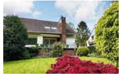
Bochum-Werne | Gepflegtes Einfamilienhaus mit Einliegerwohnung in Parkrandlage | Wohnfläche: 229 m 2 , Grundstücksfläche: 836 m 2 , 10 Zimmer, Baujahr: 1962, Preis: 625.000€, Verbrauchsausweis, Klasse H, Endenergieverbrauch: 301,8 kWh/(m 2 *a)