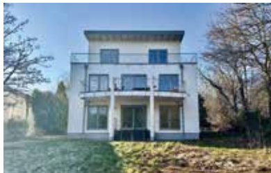
Bochum-Innenstadt | Großzügiges Einfamilienhaus mit Büroeinheit | Wohnfläche: 338 m 2 , Grundstücksfläche: 2.358 m 2 , 8 Zimmer, Baujahr: 2002, Preis: 990.000€, Ölheizung, Verbrauchsausweis, Klasse B, Endenergieverbrauch: 70,2 kWh/(m 2 *a)