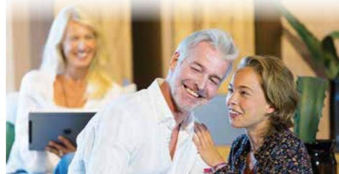
Gutes Hören ist die Grundlage für unvergessliche Familienmomente. Bei Hörminderungen empfehlen Fachleute einen Hörtest und die Beratung beim Hörakustiker.

Unser Gehör schafft die Grundlage für die Kommunikation, für das Gefühl der Zugehörigkeit und für die vielen persönlichen Augenblicke und Begegnungen. Gutes Hören ist die Grundlage für unvergessliche Momente. Doch was passiert, wenn die vertrauten Klänge plötzlich verblassen und Gespräche schwerer zu verstehen sind? Häufig werden undeutliches Verstehen oder anstrengende Gespräche auf Umgebungsgeräusche oder die Sprechweise der anderen geschoben. Doch Hörexperten wissen, dass sich hinter solchen Herausforderungen oft unerkannte Hörminderungen verbergen.