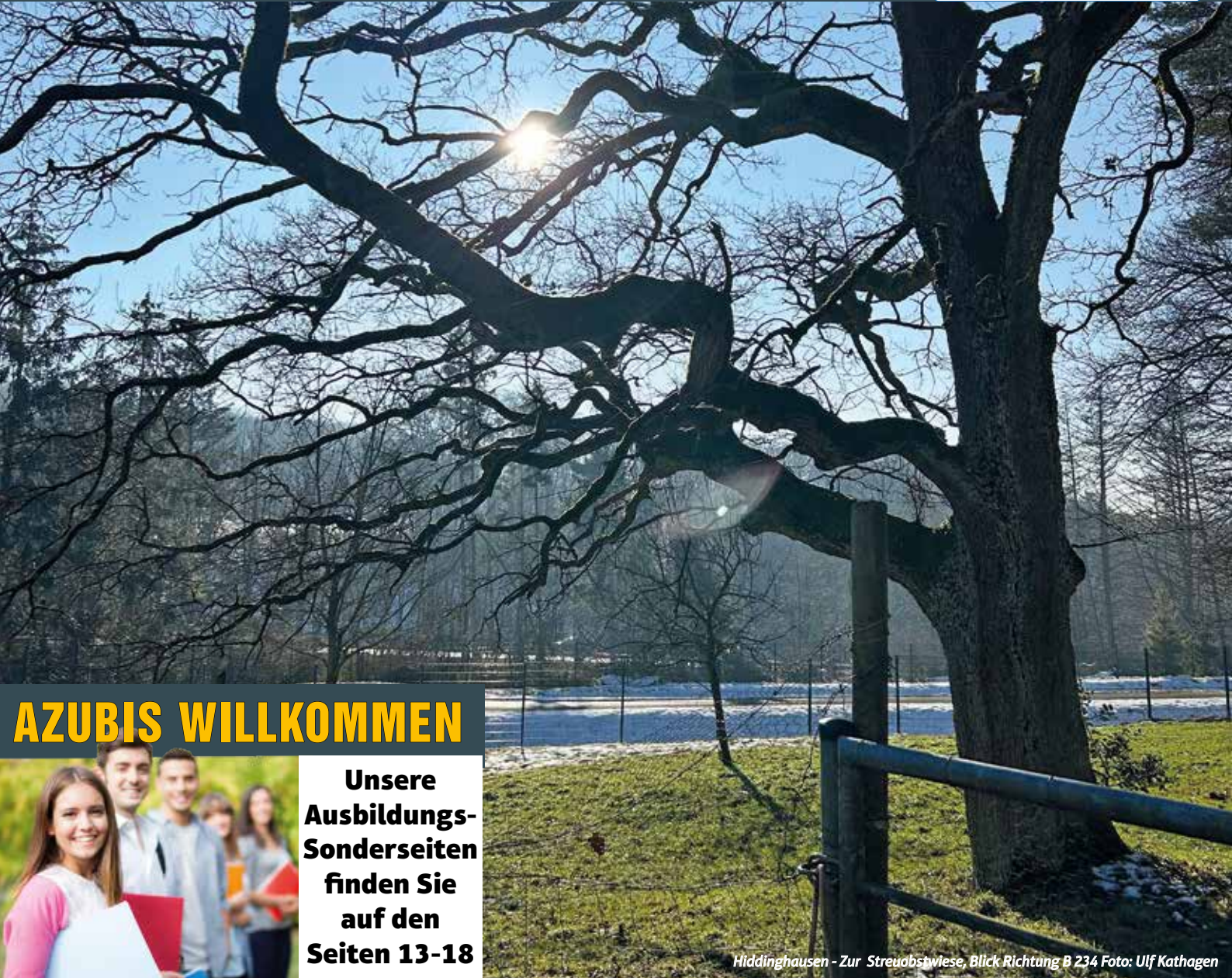
Hiddinghausen - Zur Streuobstwiese, Blick Richtung B 234