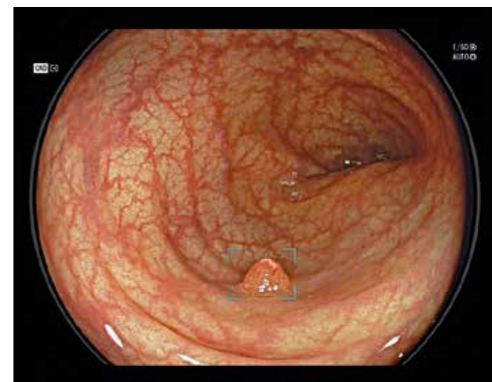
Das Foto zeigt ein mittels künstlicher Intelligenz markierten kleinen Polypen während einer Darmspiegelung.

Prof. Dr. Tromm: Die Darmspiegelung ist die Methode zur Früherkennung von Darmkrebs. Dabei wird die Darmschleimhaut mit einem flexiblen Endoskop auf Polypen und andere Auffälligkeiten untersucht. Voraussetzung ist, dass die Darmschleimhaut sehr gut gereinigt ist. Da Darmkrebs in über 95 % über die Vorstufe von Polypen entsteht, gilt der Detektion von Polypen die größte Aufmerksamkeit. Im Rahmen der Vorsorgeuntersuchungen werden bei Männern ab 50 Jahren in etwa 25 % der Fälle und bei Frauen ab 55 Jahren in 20 % der Fälle Polypen entdeckt. Es hat sich gezeigt, dass in den über 20 Jahren, in denen Vorsorge-Coloskopie in Deutschland durchgeführt wird, die Rate an Darmkrebs zu erkranken bzw. zu versterben um über 30 % reduziert werden konnte.