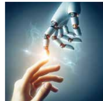
Mit einem Verstorbenen chatten und ihn in der virtuellen Welt als Avatar treffen? Möglich ist dies dank der Künstlichen Intelligenz.

Trauernde erhoffen sich durch Avatare und Chatbots ein (letztes) Gespräch oder ein Wiedersehen zur persönlichen Verarbeitung ihrer Trauer. Es gibt sogar Unternehmen, die damit werben, den Trauerprozess quasi zu überspringen, weil man sich von dem geliebten