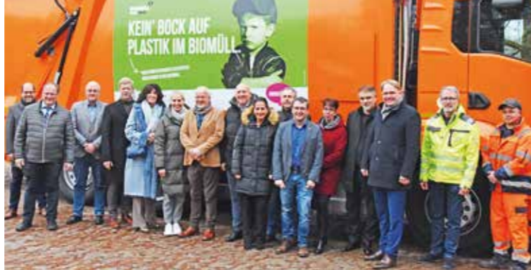
Zehn Beteiligte – ein Ziel: Kreis und Städte werben gemeinsam und gut abgestimmt für weniger Plastik im Biomüll. Zum Auftakt machen die Bürgermeisterinnen und Bürgermeister sowie der Landrat und Vertreter der technischen Betriebe auf den Start der Kampagne aufmerksam.