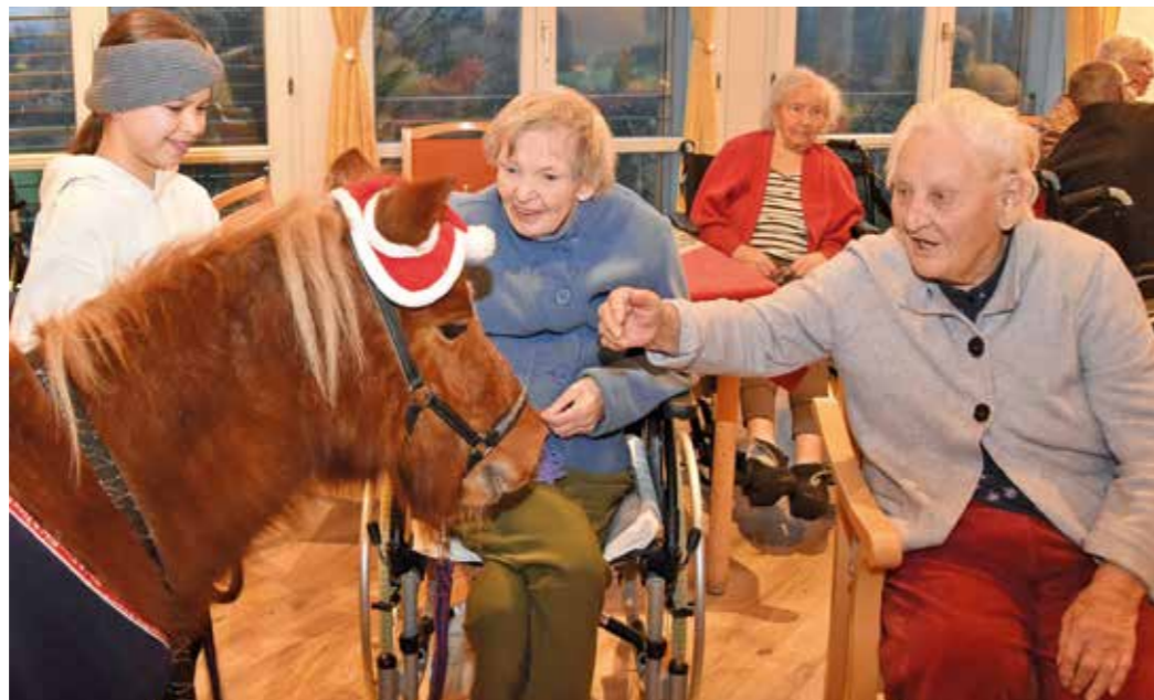
Ein Pony im Speisesaal vom Haus am Quell - das gibt es nicht alle Tage. Die Bewohner jedenfalls hatten sichtlich Spaß am Streicheln von Willi und Ben.