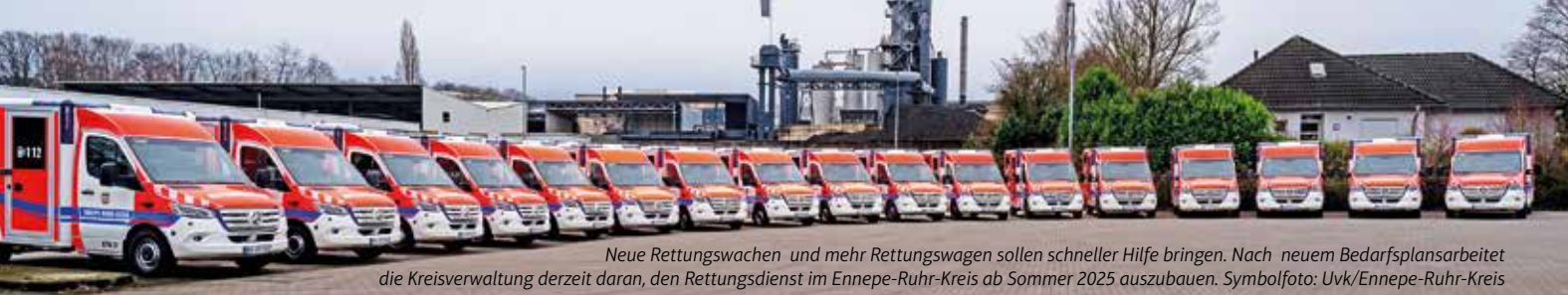
Neue Rettungswagen und mehr Rettungswagen sollen schneller Hilfe bringen. Nach neuem Bedarfsplan arbeitet die Kreisverwaltung derzeit daran, den Rettungsdienst im Ennepe-Ruhr-Kreis ab Sommer 2025 auszubauen.