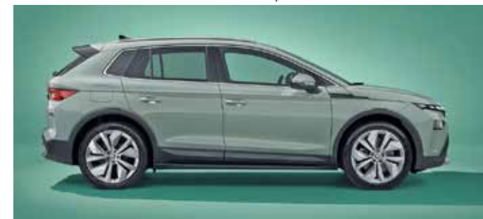
Skoda Elroq, Fotos: Autoren-Union Mobilität/Skoda

Natürlich bringt auch der Elroq die von Skoda bekannten Simply-Clever-Ideen mit. Angefangen beim in die Fahrertür integrierten Regenschirm bis hin zum Eiskratzer, der sich jetzt an der Innenseite der Heckklappe befindet, um nur einige zu nennen. Neu hinzugekommen ist beim Elroq ein Netz an der Unterseite der Gepäckraumabdeckung. Eine einfache, aber pfiffige Lösung, da sich dort das Ladekabel einfach verstauen lässt und selbst auf der vollbepackten Urlaubsreise immer griffbereit zur Hand liegt. Ein kleiner Stauraum unter der Motorhaube (Frunk) fehlt dagegen.