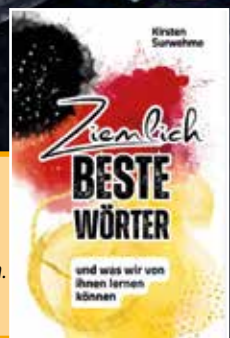
Image verlost drei kleine Bücher von Kirsten Surwehne für alle Sprachliebhaber und solche, die es werden möchten. Lesen Sie mehr auf Seite 21