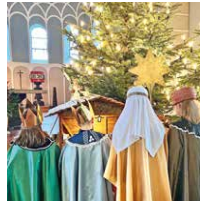
Sternsinger in Welper.

1959 wurde die Aktion Sternsingen erstmals gestartet. Kinder haben bundesweit alleine bei der letzten Aktion im Januar 2024 rund 46 Millionen Euro für benachteiligte und Not leidende Kinder in Afrika, Lateinamerika, Asien, Ozeanien und Osteuropa gesammelt. In diesem Jahr sind die Beispielregionen die Turkana im Norden Kenias und Kolumbien. In der Turkana haben Kinder kaum Zugang zu Schulen oder medizinischer Versorgung. Wetterextreme sorgen dafür, dass der Teller häufig leer bleibt. Die Partnerorganisation des Kindermissionswerks macht sich für die Kinderrechte auf Gesundheit, Ernährung und Bildung stark und betreibt unter anderem Schulen. In Kolumbien setzt sich der Sternsinger-Projektpartner für die Rechte von Kindern auf Schutz, Bildung und Mitbestimmung ein. Weitere Infos: www.sternsinger.de/sternsingen .