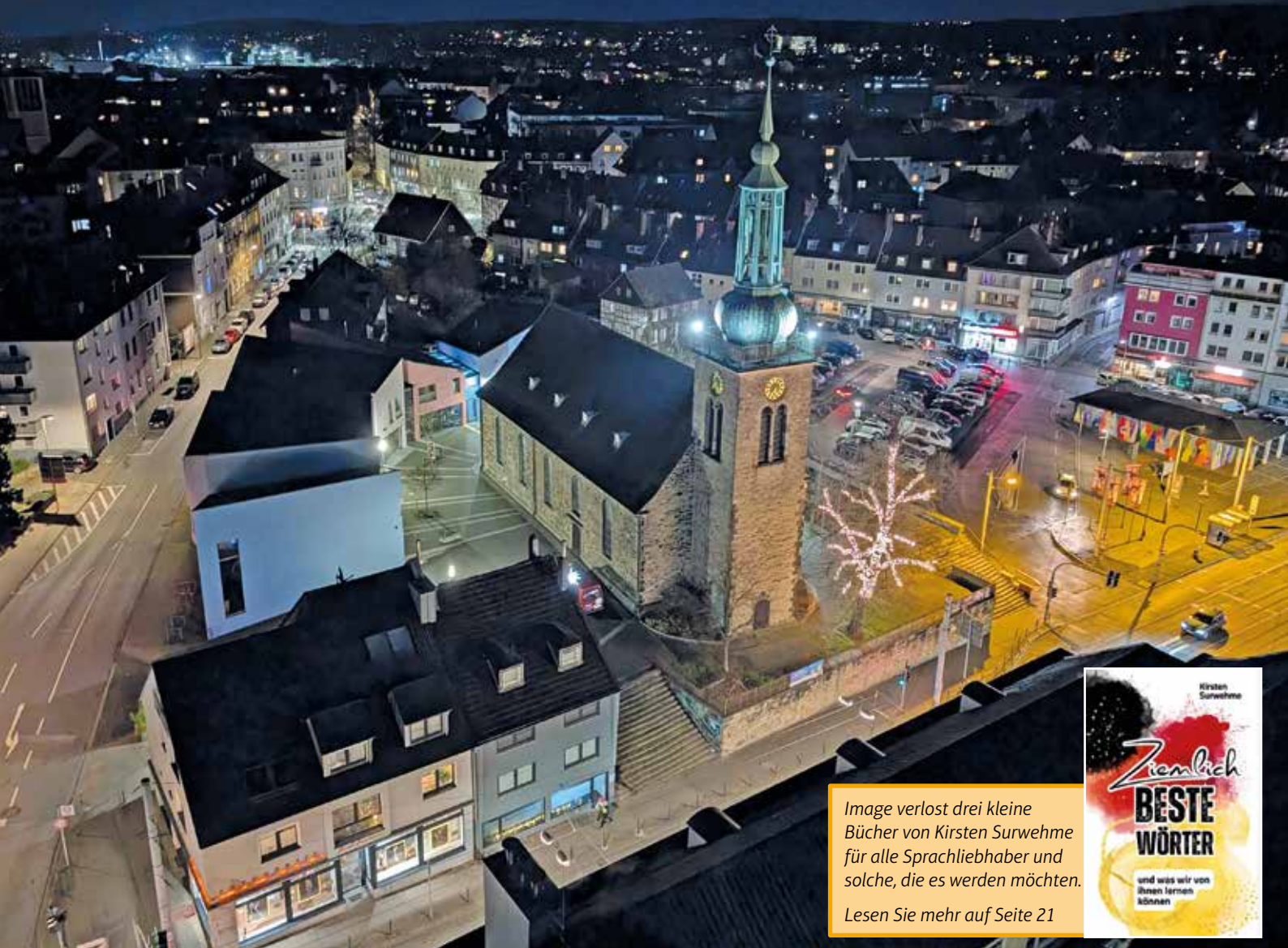
Blick vom Rathausturm auf die weihnachtlich angestrahlte Johanniskirche.

+++ 4 MONATSMAGAZINE: GESAMTAUFLAGE CA. 90.000 EXEMPLARE +++ HAUSHALTSVERTEILUNG +++ ☎ 02302 9838980 +++ WWW.IMAGE-WITTEN.DE +++