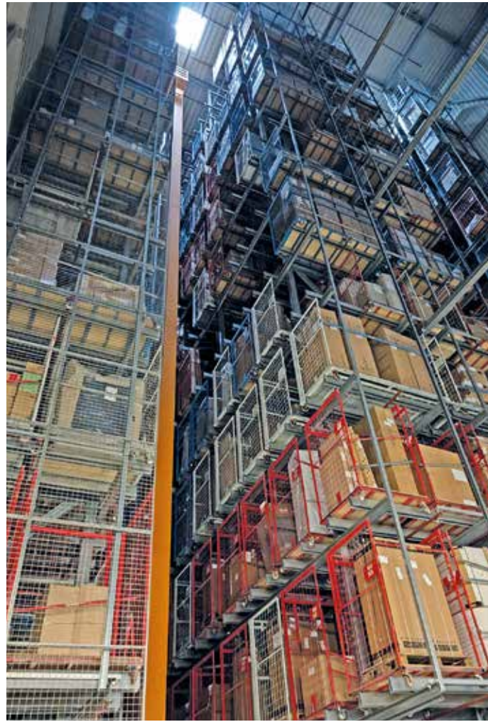
Einen interessanten Einblick in das Hochregallager des Einrichtungshauses Ostermann ermöglichte eine vom Stadtmarketing organisierte Besichtigungstour.

„Jetzt um 11 Uhr ist es ein bisschen ruhiger, aber trotzdem werden Sie ein paar Fahrzeuge hin- und herfahren sehen“, versprach Mohamed El Bouch, bevor sich die Besucher eine Warnweste überzogen und nach einer Sicherheitsunterweisung auf den Weg ins Innere des Hochregallagers machten. Rund 100 Mitarbeiter sind dort, aufgeteilt auf zwei Schichten, beschäftigt. Interessant zu sehen, dass die einzelnen Waren in der Kommissionier-Anlage noch von Menschenhand in genormte Behälter gepackt werden, danach aber der Computer die weitere Einlagerung bestimmt. Um Störungen zu vermeiden, werden die Behälter vorab hinsichtlich Gewicht und Maße geprüft. „Links und rechts in den Gängen haben die Behälter nur 8 cm Spielraum“, so der