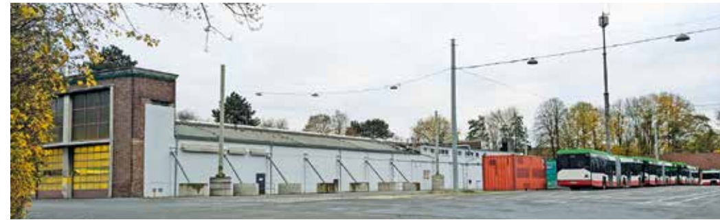
Die Tage des Busstandortes mit integrierter Werkstatt der BOGESTRA in Witten sind gezählt. 200 Mitarbeiter wechseln an andere Standorte.

Jetzt ist es offiziell: Die BOGESTRA wird ihren Standort an der Crengeldanzstraße in der nächsten Zeit schließen. Betroffen sind rund 200 Mitarbeiter in der Werkstatt und im Fahrdienst. Glück im Unglück: alle Mitarbeiter, die derzeit im Busbetrieb in Witten arbeiten, werden zukünftig an andere Standorte der BOGESTRA wechseln. Damit werden auch 90 Jahre BOGESTRA in Witten Geschichte werden.