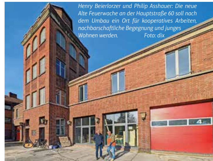
Henry Beierlorzer und Philip Asshauer: Die neue Alte Feuerwache an der Hauptstraße 60 soll nach dem Umbau ein Ort für kooperatives Arbeiten, nachbarschaftliche Begegnung und junges Wohnen werden.

Die Frage, ob das Gebäude unter Denkmalschutz stand, verneint Henry Beierlorzer: „Aber eigentlich haben wir Denkmalpflege betrieben, weil wir alles, was im Laufe der Jahre hinzugefügt wurde, wieder zurückgebaut haben.“ Der Turm wurde 1929 zusammen mit den Mannschaftsräumen gebaut und in den 60er Jahren aufgestockt. Als Erinnerung an die lange Feuerwehr-Vergangenheit des Gebäudes bleibt deshalb auch der Schlauch-Turm erhalten. Um den Blick hoch in den Turm zu ermöglichen wird noch eine Glasplatte in die Decke des Erdgeschosses eingebaut.