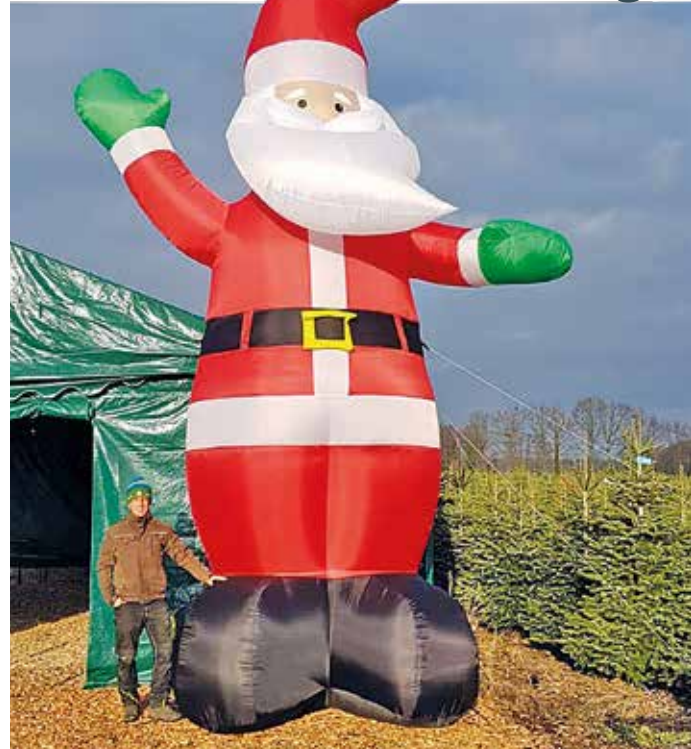
Der sechs Meter großer Weihnachtsmann weist den Weg