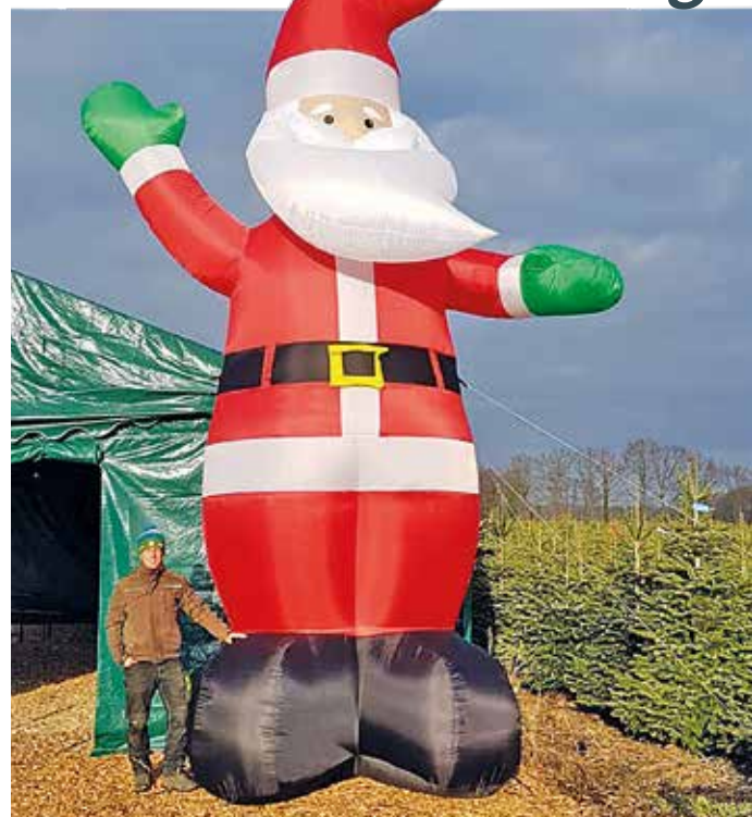
Der sechs Meter großer Weihnachtsmann weist den Weg.