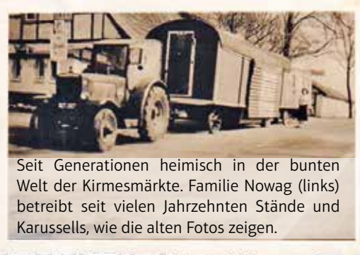
Seit Generationen heimisch in der bunten Welt der Kirmesmärkte. Familie Nowag (links) betreibt seit vielen Jahrzehnten Stände und Karussells, wie die alten Fotos zeigen.

Image: Offensichtlich fühlen Sie sich sehr wohl in Witten!