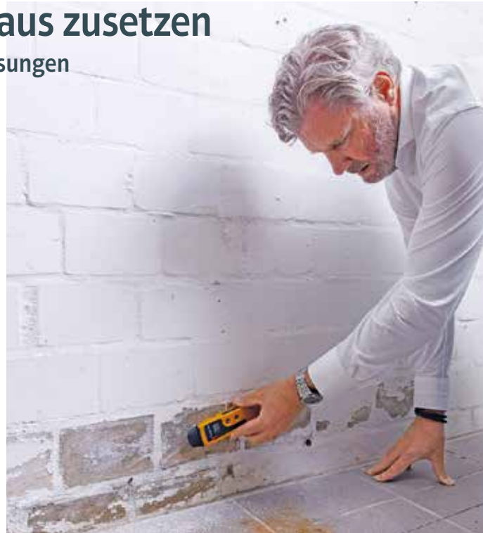
Für Probleme gibt es auch Lösungen.