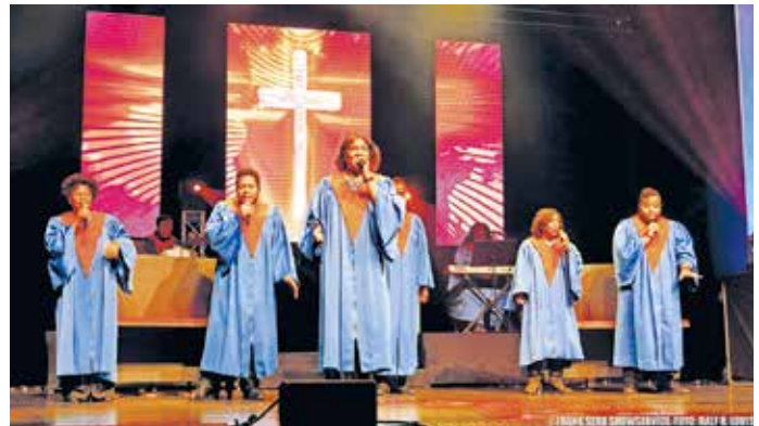
The Original USA Gospel Singers & Band

Die Volksbühne Witten startet am 2. Dezember um 20 Uhr mit einer Gospelshow in die Vorweihnachtszeit und präsentieren die Original USA Gospel Singers mit Live-Band. Die afroamerikanische Gruppe bringt dem Publikum das ursprüngliche Gefühl der schwarzen Gospelkultur authentisch nahe und erzählt deren Geschichte – von der Entstehung bis zur heutigen Zeit, von Mahalia Jackson bis James Cleveland. Das Ensemble bietet ausgewählte Spitzensänger, hervorragende Solisten und Musiker in einem zweistündigen Programm.