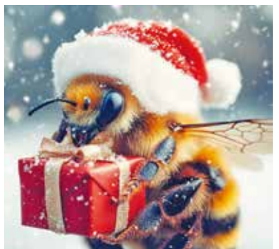
Bild KI generiert