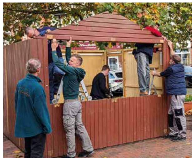
Die Vorbereitungen für die nächste Glühweinsaison vom 30.11. bis 4.1. in Herbede laufen auf Hochtouren. Viele Ehrenamtler bauen bereits den beliebten Glühweinstand eingangs der Meesmannstraße auf.