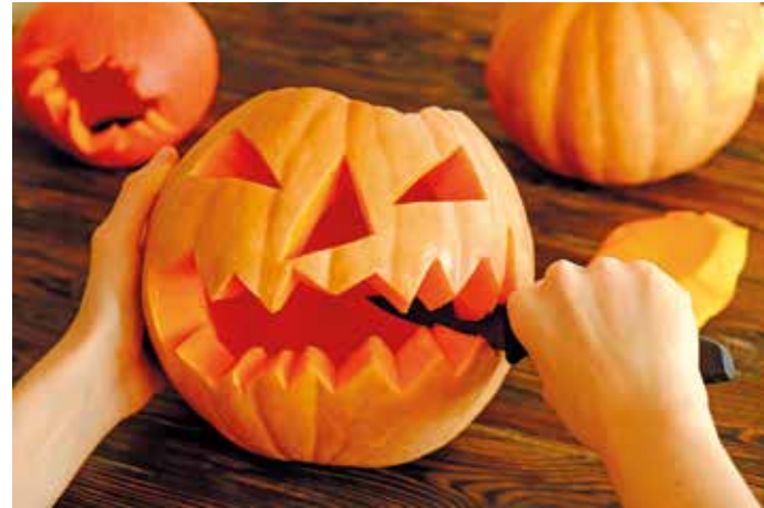
15 Paletten Kürbisse, die die Familie Grütter geordert hatten, fanden ihre Abnehmer!

Wie auch in den vergangenen Jahren fand auch in diesem Jahr wieder eine große „Kürbis-Schnitz-Aktion“ Ende November im Edeka Grütter Markt statt. Zahlreiche Kinder, begleitet von Eltern oder Großeltern, konnten unter Anleitung sich ihren Kürbis schnitzen und gestalten, lediglich der Kürbis und das Schnitzwerkzeug mussten gekauft werden. Über 100 Kinder waren in diesem Jahr zur Kürbis-Schnitz-Aktion gekommen und hatten viel Spaß daran, sich ihr eigenes Kürbisgesicht zu gestalten.