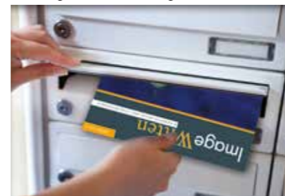
Image wird durch einen professionellen Zustelldienst kostenlos ver- teilt. Die Zustellung erfolgt durch einen vertraglich gebundenen Part- ner mit fest angestellten, ortskundigen Zustellern. So erreicht Image ca. 90 % der Haushalte im jeweiligen Verteilgebiet bis auf Werbe- verweigerer und Einzelgehöfte. Diese Verteilung bietet eine gezielte

Leseransprache und es entstehen keine Streuver- luste.