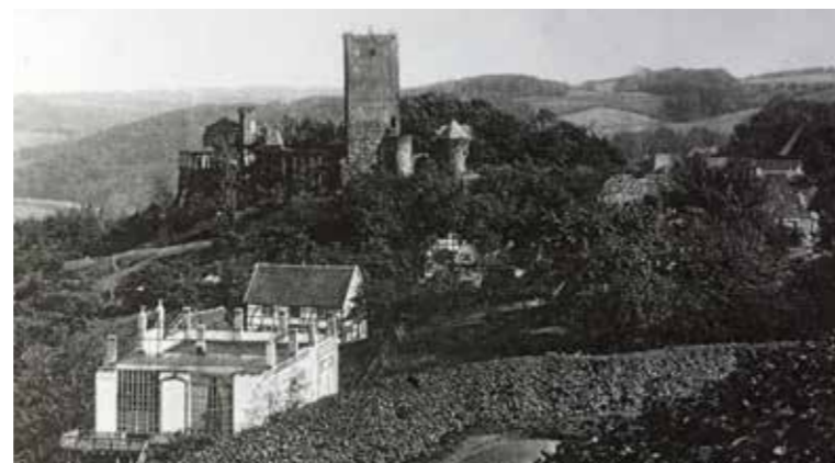
Das sogenannte „Atelier-Haus“ in Blankenstein (vorne links). Der Kunstmaler kaufte sich das Grundstück 1905.