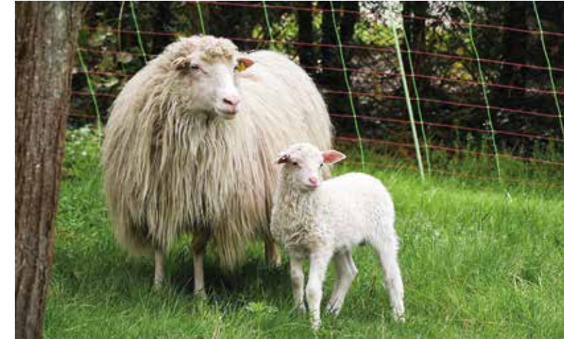
Moorschnucken sind eine sehr seltene Schafrasse. Sie stehen auf der Roten Liste der Gesellschaft zur Erhaltung alter und gefährdeter Haustierrassen.

Sie übrigens, dass Moorschnucken sich durch ihre enorme Agilität und Leichtigkeit selbstständig aus Moorlöchern befreien können? Zwei weitere weibliche Tiere für Haldor kamen dann zusätzlich aus einer anderen Herde und Tippi aus unserer eigenen Herde kam noch dazu. Bei ihr war der Inzest-Koeffizient so niedrig, dass sie bedenkenlos in den sogenannten Anpaarungsplan aufgenommen werden konnte. Wir waren alle gespannt, was passieren würde.“