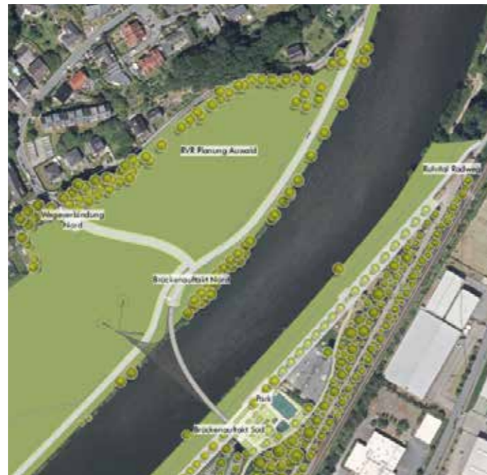
Der Plan und die Ansicht zeigen die neue Brücke, die die Hattinger Hüttenseite mit Winz-Baaker verbindet.

Der Entwurf sieht eine Kombination zwischen Schrägkabel- und Hängebücke vor. Zwischen Minigolfplatz und Skateranlage an der Ruhr nahe dem Hüttengelände soll es in einem geschwungenen Bogen auf die Winz-Baaker-Seite gehen. Dort soll die Brücke in einem Auwald enden. Auwälder sind dynamische, durch regelmäßige Hochwasser beeinflusste Waldgesellschaften an Flussufern. Eine umfassende ökologische Aufwertung und Extensivierung von Freiflächen ist in Zusammenarbeit mit dem RVR als Flächeneigentümer aber auf beiden Seiten der Ruhr vorgesehen. Neben Baumpflanzungen und Aufforstungen soll es eine naturnahe Promenade mit Wasserzugängen und Aufenthaltsbereichen geben. Die Bauzeit wird nach dem Spatenstich im IGA-Jahr anschließend auf etwa ein bis 1 1/2 Jahren geschätzt – je nach Wetterlage. Von Dr. Anja Pielorz