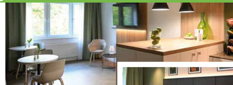
Raum zur Begegnung bieten auf der Wahlleistungsstation N7 neben einem großen Speiseraum auch gemütliche Lounges.

Die Verzahnung mit teilstationären und stationären Angeboten bleibt ein zentrales Element. Eine Besonderheit ist die Organisation der Stationen. Nicht allein die Diagnose entscheidet, sondern die jeweilige Lebensphase. Junge Erwachsene, Menschen in der Lebensmitte und Patient:innen im