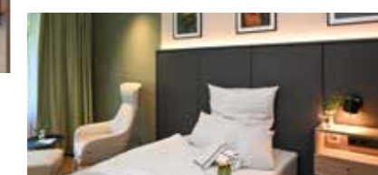
19 komfortable Einbettzimmer und drei Zweibettzimmer wurden mit der neuen Wahlleistungsstation N7 neu geschaffen.

höheren Lebensalter werden auf entsprechend ausgerichteten Stationen betreut. Dieser Ansatz berücksichtigt unterschiedliche Bedürfnisse und Lebensrealitäten und erleichtert den Austausch untereinander. Auch die räumlichen Bedingungen wurden erweitert. Mit der neuen Wahlleistungsstation N7 ist ein zusätzlicher Bereich entstanden, der therapeutische Angebote in einem besonders ruhigen und exklusiven Rahmen bündelt. „Heilung braucht neben fachlicher Kompetenz auch ein Umfeld, das Orientierung gibt und Rückzug ermöglicht“, so Dr. Kis.