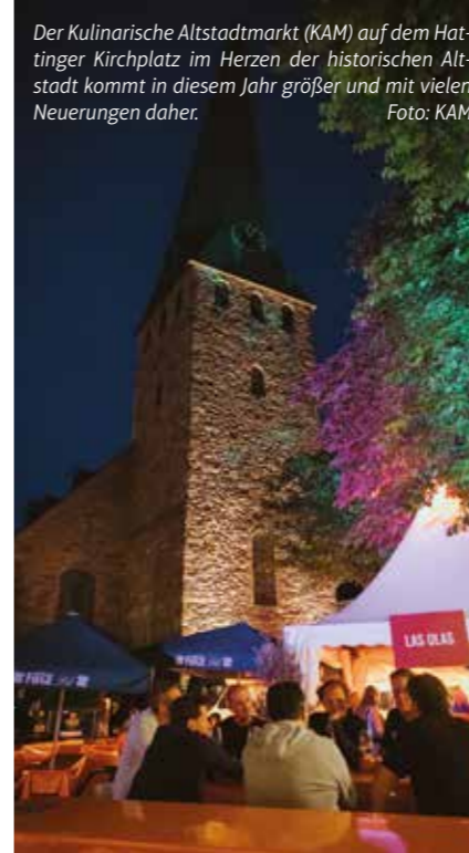
Der Kulinarische Altstadtmarkt (KAM) auf dem Hattinger Kirchplatz im Herzen der historischen Altstadt kommt in diesem Jahr größer und mit vielen Neuerungen daher.

Unterstützung für die heimischen Betriebe gibt es übrigens auch bei trinkgut Uhe in Hattingen: Beim Kauf von 1Kg MAYOLA Kaffee gibt es zwischen dem 15. und 22. Juni 25 Prozent MEHR dazu. Von Dr. Anja Pielorz