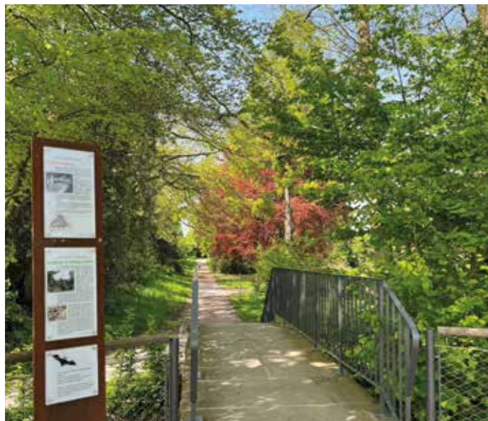
Der Gethmannsche Garten in Blankenstein. Zur Internationalen Gartenausstellung (IGA) 2027 wird er aufgehübscht. Hier der Schneckengang. Foto oben: Blick vom Belvedere.