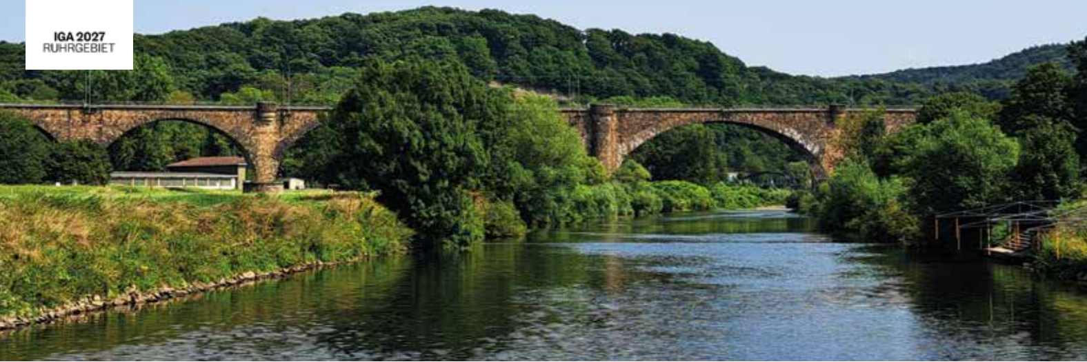
Flusslandschaft Mittleres Ruhrgebiet: Die Ruhr und ihr Tal gehören touristisch zu den Highlights, die gerade im Sommer für Schiffs- und Radtouren sehr beliebt sind. Wer mit der „Schwalbe“ unterwegs ist, kann auf einer romantischen Bootstour das Viadukt in Witten bewundern. Die geplante Ruhrbrücke in Hattingen wird eine weitere Aufwertung des Tourismus in der Region mit sich bringen.