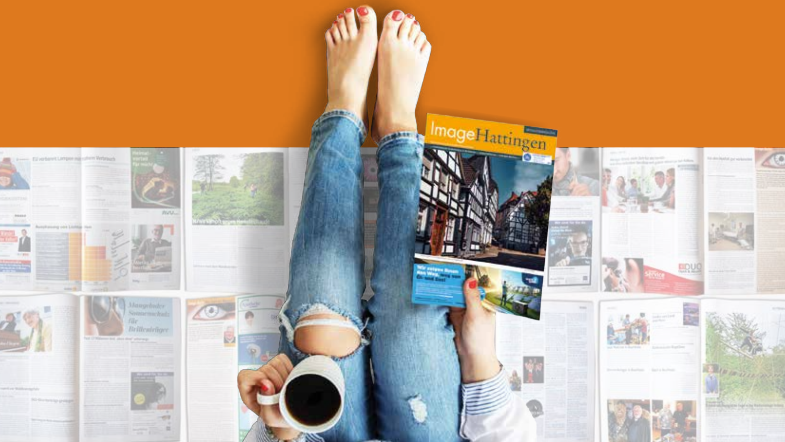
IMAGE IMMER GUT INFORMIERT