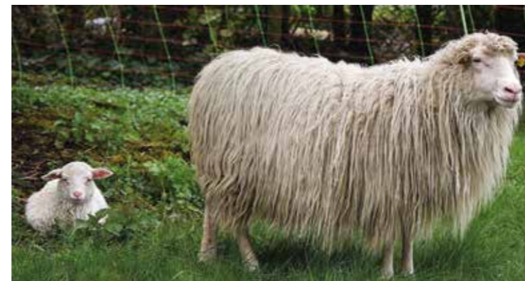
Matti mit Mama Tippi. Und ein Blick in den Lämmchen-Kindergarten.

Jetzt gibt es Neuigkeiten von dem Moorschnucken-Bock. Er wurde zum ersten Mal Papa! „Wir haben im Herbst 2025 für Haldor drei Mädels nördlich von Bremen abgeholt – quasi buchstäblich aus dem Moor“, berichtet Burkhardt Pfläging die Vorgeschichte und ergänzt: „Wussten