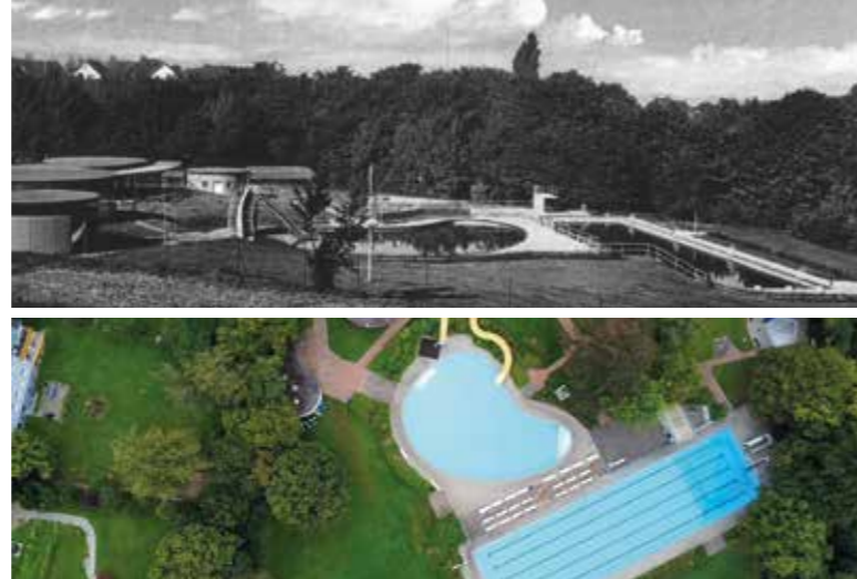
Das Freibad in Welper. Die parkähnliche Anlage, das nierenförmige Nichtschwimmerbecken und die geschwungenen Formen der Umkleidehäuschen: Das originalgetreue Bad aus den 50er-Jahren ist eine Rarität und steht seit November 2004 wegen seiner Architektur unter Denkmalschutz.