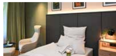
19 komfortable Einbettzimmer und drei Zweibettzimmer wurden mit der neuen Wahlleistungsstation N7 neu geschaffen.

höheren Lebensalter werden auf entsprechend ausgerichteten Stationen betreut. Dieser Ansatz berücksichtigt unterschiedliche Bedürfnisse und Lebensrealitäten und erleichtert den Austausch untereinander. Auch die räumlichen Bedingungen wurden erweitert. Mit der neuen Wahlleistungsstation N7 ist ein zusätzlicher Bereich entstanden, der therapeutische Angebote in einem besonders ruhigen und exklusiven Rahmen bündelt. „Heilung braucht neben fachlicher Kompetenz auch ein Umfeld, das Orientierung gibt und Rückzug ermöglicht“, so Dr. Kis.