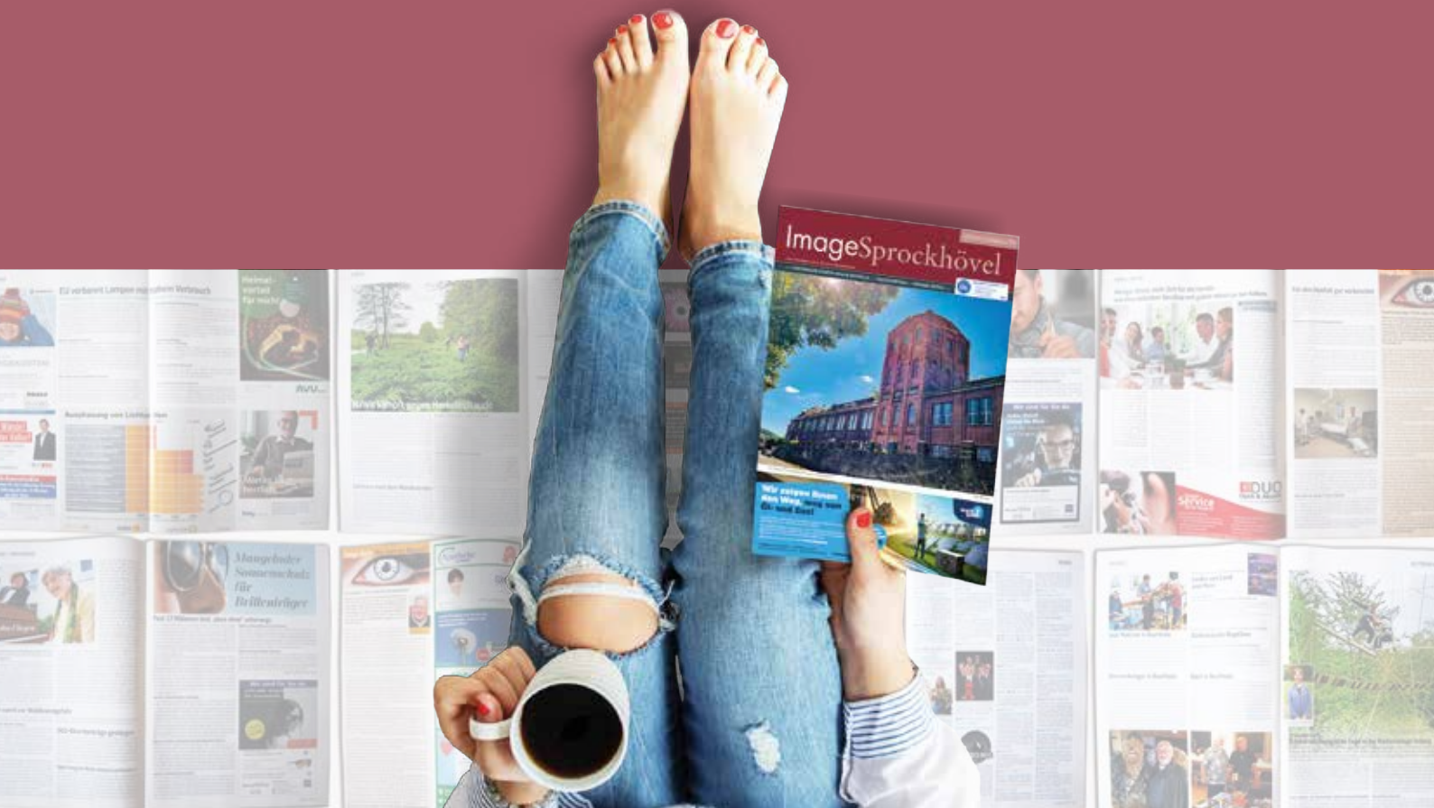
IMAGE IMMER GUT INFORMIERT