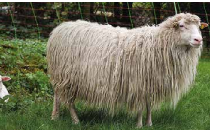
Matti mit Mama Tippi. Und ein Blick in den Lämmchen-Kindergarten.