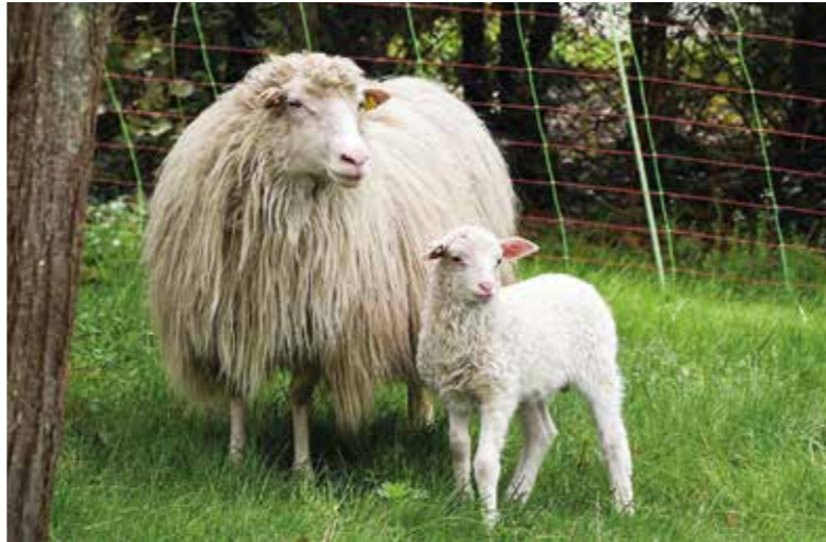
Moorschnucken sind eine sehr seltene Schafrasse. Sie stehen auf der Roten Liste der Gesellschaft zur Erhaltung alter und gefährdeter Haustierrassen.