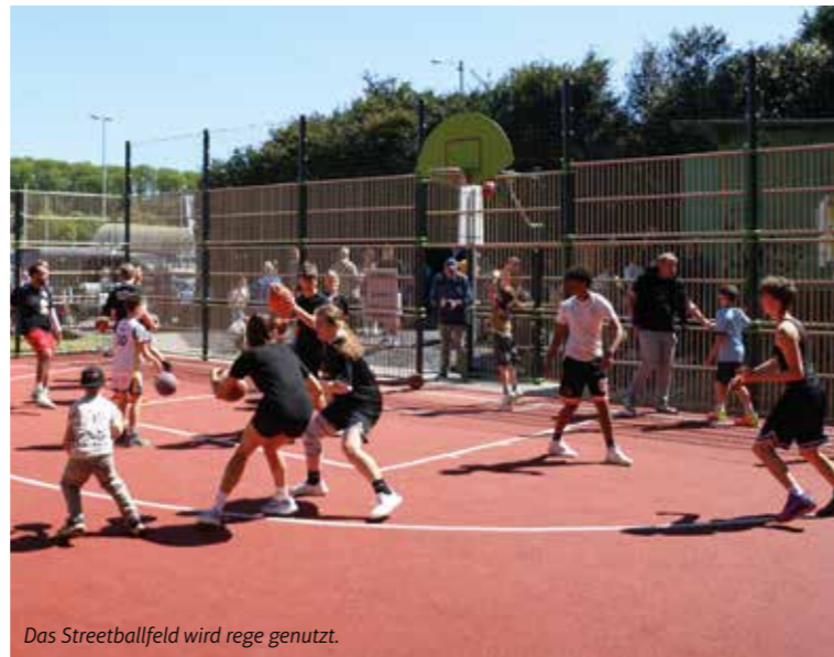
Das Streetballfeld wird rege genutzt.