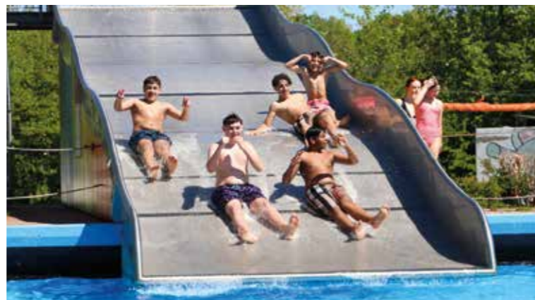
Die breite Rutsche ins Nichtschwimmerbecken ist äußerst beliebt (hier rutschen für unser Foto ausnahmsweise fünf Kinder nebeneinander, sonst sind nur zwei erlaubt).