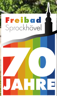
Siebzig Jahre Freibad Sprockhövel: Am 1. Mai startet die Jubiläumssaison. Was das Freibad zu bieten hat und wie alles angefangen hat, lesen Sie in dieser Ausgabe auf Seite sechs!