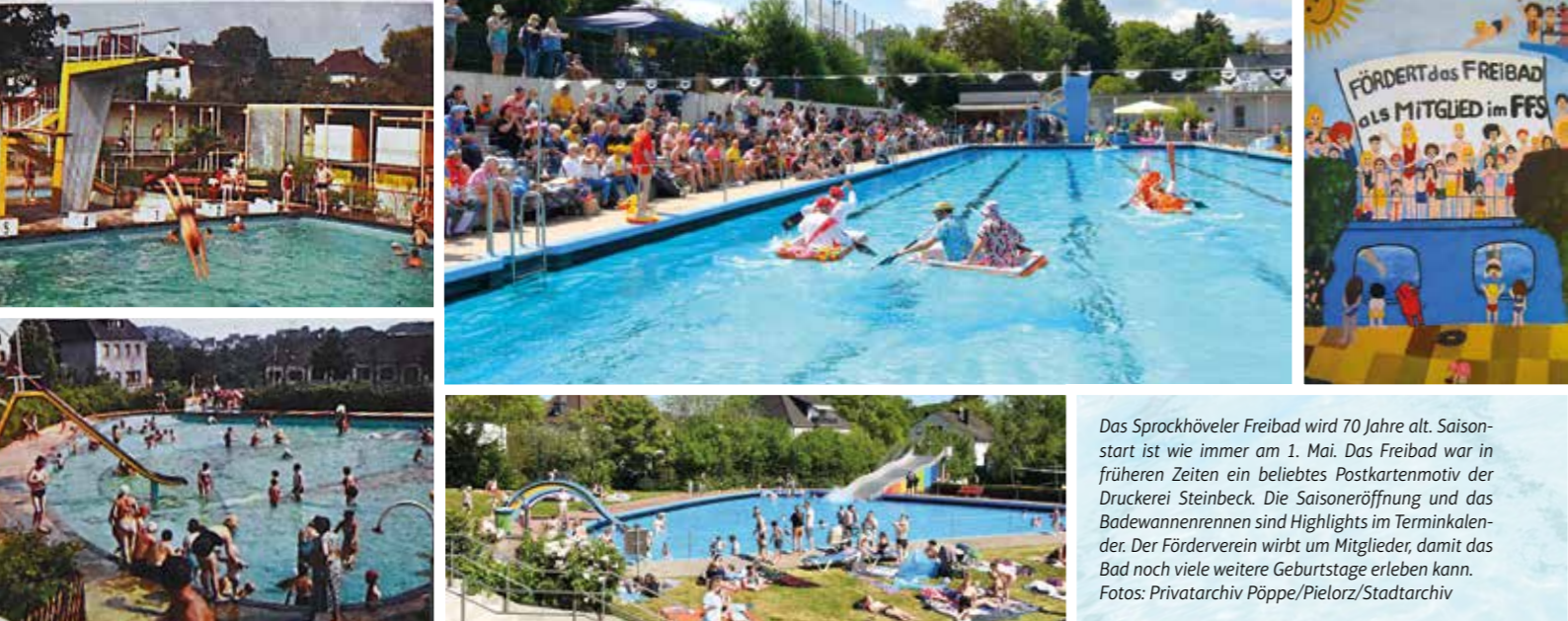
Das Sprockhöveler Freibad wird 70 Jahre alt. Saisonstart ist wie immer am 1. Mai. Das Freibad war in früheren Zeiten ein beliebtes Postkartenmotiv der Druckerei Steinbeck. Die Saisonöffnung und das Badewannenrennen sind Highlights im Terminkalender. Der Förderverein wirbt um Mitglieder, damit das Bad noch viele weitere Geburtstage erleben kann.