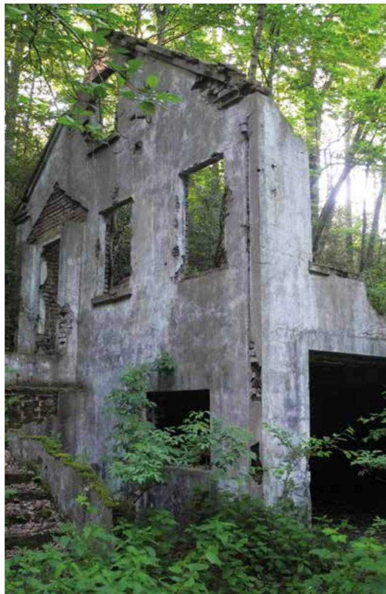
Sämtliche Gebäudereste der Zeche Elisabethenglück sind Bestandteil des Pleßbachweges des AK Sprockhövel. Der Stollen, der ebenfalls Bestandteil des Pleßbachweges ist, ist auch heute noch befahrbar.

Auf der Homepage vom Sprockhöveler Heimat- und Geschichtsverein finden sich viele interessante Details und auch die Broschüren zu den Bergbauwanderwegen: www.hgv-sprockhoevel.de .