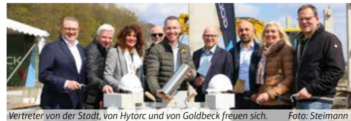
Vertreter von der Stadt, von Hytorc und von Goldbeck freuen sich.

Hydraulikprodukthersteller hat im April den Grundstein gelegt und wächst weiter