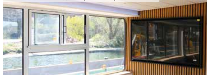
Die Fenster sind nun doppelt verglast und es gibt einen Monitor.

Eigentlich sollte die MS Schwalbe am 28. März wieder auf die Ruhr ausfahren. Doch daraus wurde nichts, weil seitens der Bezirksregierung noch an einer Fischtreppe gearbeitet wird – und diese Arbeiten haben sich sehr nach hinten verzögert. Unabhängig davon ist das beliebte kleine Schiff in seinem Inneren saniert worden und erstrahlt in neuer Optik. IMAGE hat einen Blick in die renovierten Räumlichkeiten geworfen. An der Schleuse auf der Ruhr sind immer noch Steinberge aufgeschüttet, damit Bagger für die Arbeiten an der Fischtreppe auf die Insel gelangen können. Durch ein wenig Hochwasser im März ist das Rückhaltebecken umgeklappt, wodurch viele Steine in die Fahrinne der Schwalbe reingeflossen sind und die Ausfahrt unmöglich machten. Das Problem konnte bis Mitte April noch nicht behoben werden. Auch, wenn die Schwalbe noch länger nicht für die öffentlichen Rundfahrten ablegen kann, sind bereits erste Fahrten gebucht, nämlich Charterfahrten. So konnte das Schiff, das bis 150 Personen freigegeben ist, zuletzt schon für eine lange im Voraus ausgebuchte Schlagerparty genutzt werden oder für anstehende Hochzeiten.