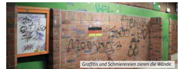
Graffitis und Schmierereien zieren die Wände.