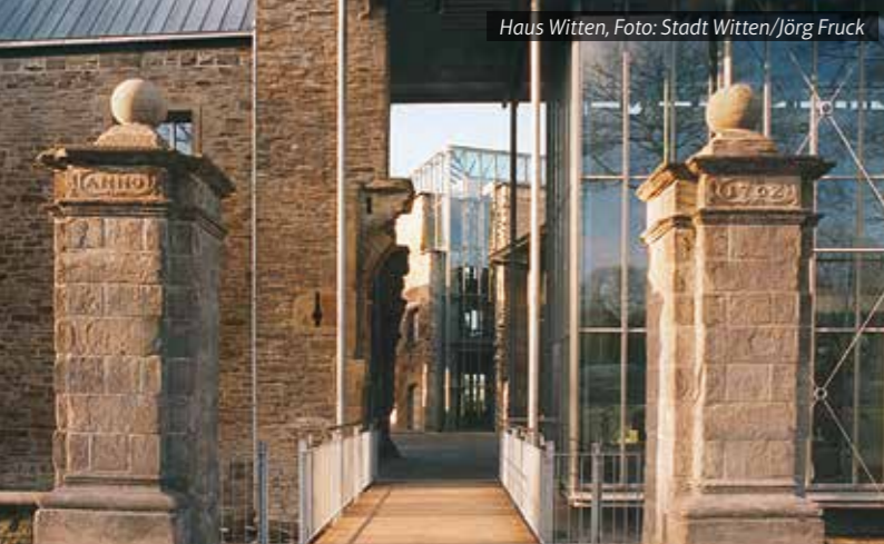
Haus Witten, Foto: Stadt Witten/Jörg Fruck