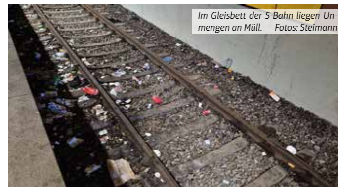
Im Gleisbett der S-Bahn liegen Unmengen an Müll.

Bereich zwei: Geruch. In diesem Punkt gibt es recht wenig zu beanstanden. Der typisch urige Geruch in Bahnunterführungen liegt auch in Hattingen in der Luft, aber recht dezent. Denn die Luft steht aufgrund des Durchzuges nicht lange. Es gab beim IMAGE-Besuch am Gleis im hinteren Bereich an zwei Stellen Urinspuren – so etwas ist ebenfalls im VRR-Report vermerkt. Der Geruch war allerdings kaum wahrnehmbar. Oberirdisch am Aufzug gab es großflächig Urinspuren.