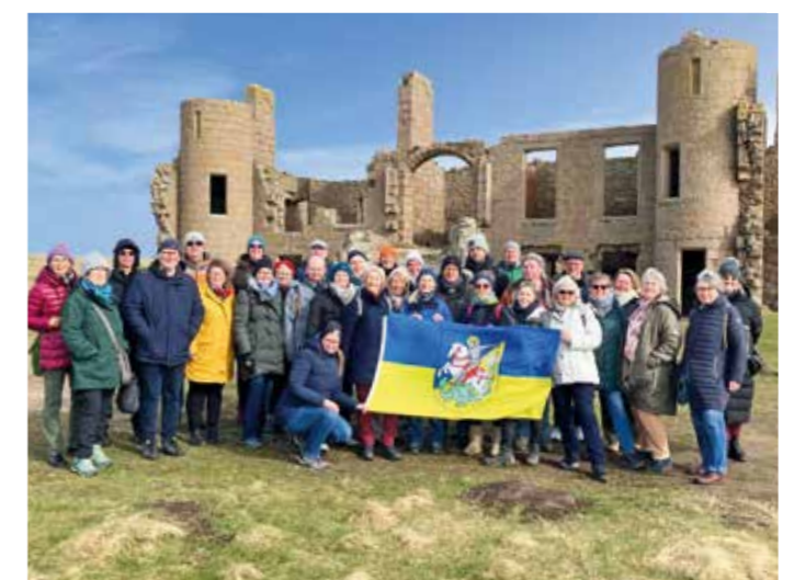
Die Gruppe am New Slains Castle.