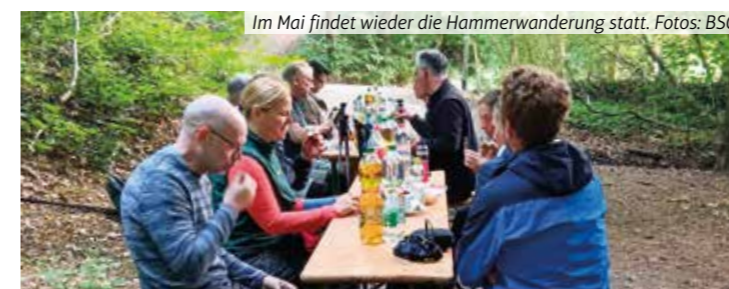
Im Mai findet wieder die Hammerwanderung statt.