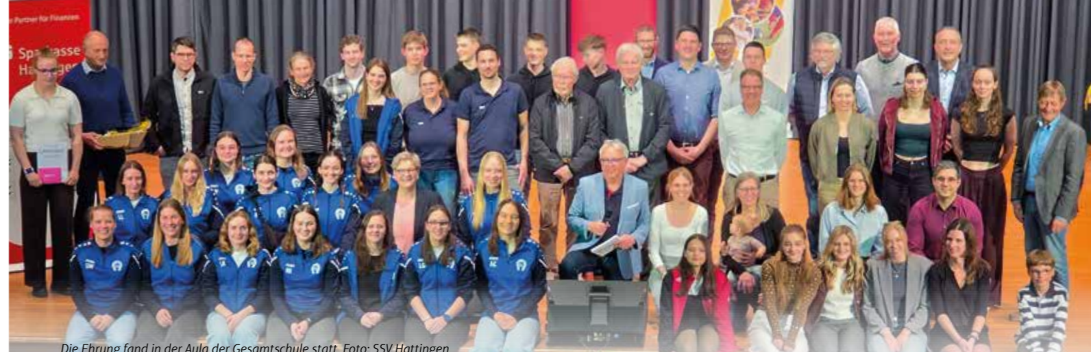
Die Ehrung fand in der Aula der Gesamtschule statt.