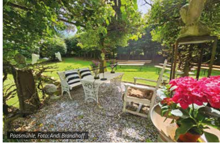
Paasmühle, Foto: Andi Brandhoff