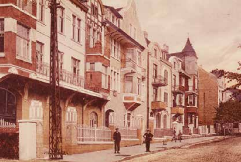
Hätten Sie die Bredenscheider Straße erkannt? Das Foto datiert etwa 1930 und zeigt die untere Straße in Richtung Sprockhövel. Am rechten Bildrand befindet sich die frühere Gaststätte Kirchmeier.

Wer heute auf der Bredenscheider Straße nach Hattingen fährt oder von dort Richtung Sprockhövel unterwegs ist, sieht in unmittelbarer Nähe zur Innenstadt links und rechts prächtige Villen aus längst vergangenen Zeiten. Wobei – nicht alle sind prächtig anzusehen. Der Zahn der Zeit nagt an den einst so wunderschönen Jugendstil-Villen des gehobenen Bürgertums.