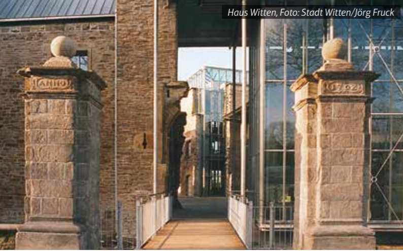
Haus Witten, Foto: Stadt Witten/Jörg Fruck