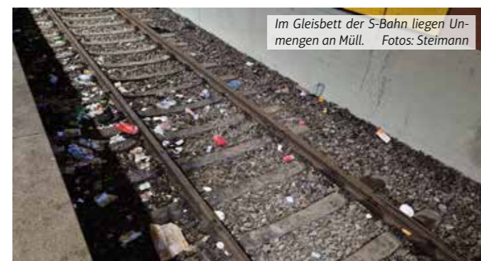
Im Gleisbett der S-Bahn liegen Unmengen an Müll.

Bereich zwei: Geruch. In diesem Punkt gibt es recht wenig zu beanstanden. Der typisch urige Geruch in Bahnunterführungen liegt auch in Hattingen in der Luft, aber recht dezent. Denn die Luft steht aufgrund des Durchzuges nicht lange. Es gab beim IMAGE-Besuch am Gleis im hinteren Bereich an zwei Stellen Urinspuren – so etwas ist ebenfalls im VRR-Report vermerkt. Der Geruch war allerdings kaum wahrnehmbar. Oberirdisch am Aufzug gab es großflächig Urinspuren.