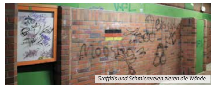
Graffitis und Schmierereien zieren die Wände.