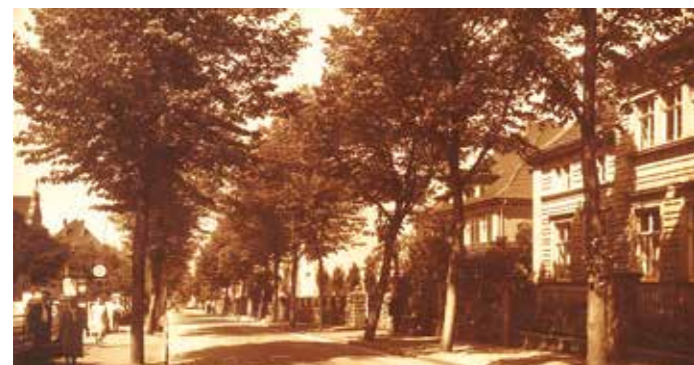
So schön sah die Sprockhöveler Straße (heute Bredenscheider Straße) einmal aus. Der Blick auf dem Foto links zeigt in Richtung Hattingen. Rechts ist das Gebäude der damaligen Volkshochschule erkennbar, es steht noch heute. Hier lebte damals das Hattinger Bürgertum, unter anderem die Familien Hundt (Verlagshaus) und Urias (Kaufhaus). Gegenüber der Volkshochschule befinden sich auch die Stadtvillen, in denen früher Musikschule und Stadtbücherei untergebracht waren. Das Foto rechts zeigt die Villa Wilke mit der Hausnummer 8. Das historische Foto datiert um 1910, die Villa um 2010.