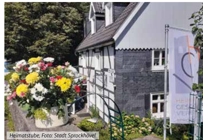
Heimatstube, Foto: Stadt Sprockhövel

Sprockhövel: Heimatstube Niedersprockhövel (75 Euro). Generelle Zusatzkosten außerhalb des Standesamtes: 66 Euro.