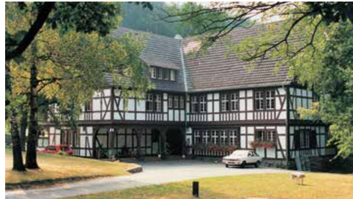
Links das Haus Bredenscheid in Hattingen. Seit 2022 beherbergt das Haus geflüchtete Menschen. Die Stadt Hattingen hat den Mietvertrag mit der Bredenscheid gGmbH mit Wirkung zum 30. Juni gekündigt, weil die Zuweisung Geflüchteter deutlich zurückgegangen ist und es ausreichende freie Kapazitäten in städtischen Unterbringungseinrichtungen gibt. Rechts im Foto das Steinenhaus. Mit Wirkung zum 1.11.2025 hatte die Stadt Hattingen 2024 den ehemaligen Swingerclub für angeblich 800.000 Euro gekauft, um dort rund sechzig Geflüchtete nach einem Umbau unterzubringen. Weder Umbau noch Unterbringung haben bis heute stattgefunden. Das Gebäude steht dauerhaft leer, kostet aber trotzdem.