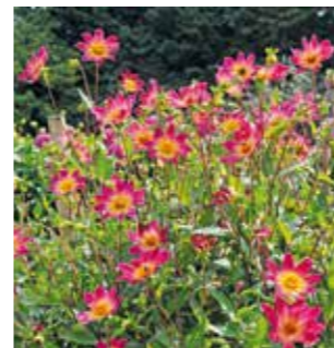
Dahlien sind nicht winterhart und dürfen erst ab Mitte Mai in den Garten.