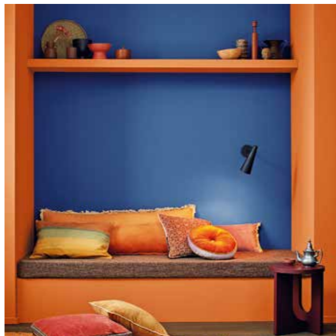
Die aufregende Kombination von Nachtblau und Kupferorange aus der Alpina-pure-farben-Kollektion setzt diese Sitznische besonders kontrastreich in Szene.

Ein charmant zurückhaltendes Pastellorange harmonisiert etwa gut mit einem auffälligen, reizvollen Rhabarberrot, das die Blicke auf sich zieht. Nachtblau und Kupferorange sind eine spannende Kombination, die auch einen eher nüchternen Raum wie den Flur besonders