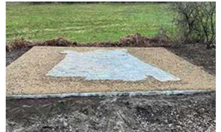
Teile der Rippelwand aus dem Steinbruch Weuste an der Glückauf-Fahrradtrasse

Vorab aufkommende Fragen können per E-Mail unter Steinbruchweuste@web.de direkt an die S und S Immobilien GmbH gestellt werden.