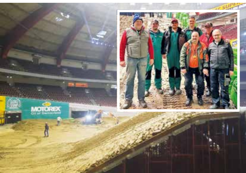
Die Helfer vom MSC Sprockhövel