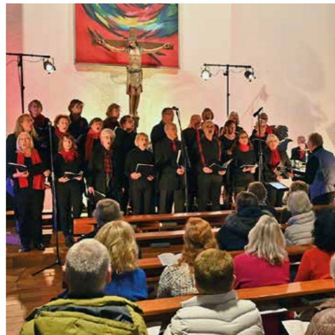
Würden sich über viele neue Stimmen freuen: die Gruppe „sacro pop“.

Nach dem Jubiläumsgottesdienst im März gibt es einen Empfang im Gemeindeheim an der von-Galen-Straße. Chorproben finden jeweils freitags um 19.30 Uhr im kath. Gemeindeheim St. Januarius in Sprockhövel statt. Infos auf der Homepage unter www.sacro-pop.de ; Kontakt per Mail unter imdialog@sacro-pop.de .