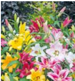
Lilien bringen Eleganz in den Sommergarten.