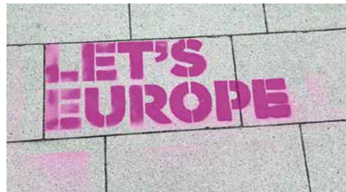
Die Kampagne „Let’s Europe“ will zu Demokratie und zur Europawahl aufrufen.