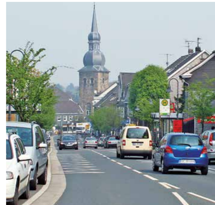
Viele Sprockhöveler wünschen sich vor allem mehr Aufenthaltsqualität in den beiden Ortszentren. In Niedersprockhövel werden die Planungen nach der Freigabe der Umgehungsstraße in die heiße Phase gehen. Dann wird die Hauptstraße umgewidmet zu einer Kommunalstraße. Das eröffnet weitere Möglichkeiten der Planung, wie verkehrsberuhigt die Einkaufsmeile dann werden soll. Ein Vorbild könnte die Mittelstraße in Gevelsberg sein. Dort ist zwar noch Raum für das Auto vorgesehen, allerdings nur eingeschränkt und mit Schrittgeschwindigkeit.

Die Konzeption einer „Marke Sprockhövel“ ist Teil des Bundesförderprogramms „Zukunftsfähige Innenstädte und Zentren“, in dessen Rahmen das Projekt „Zukunftsperspektive Niedersprockhövel – neue Strategien für ein resilientes & l(i)ebenswertes Ortsteilzentrum“ bewilligt wurde.