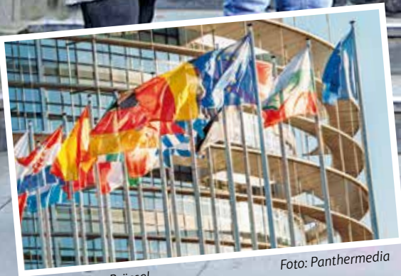
Parlament in Brüssel