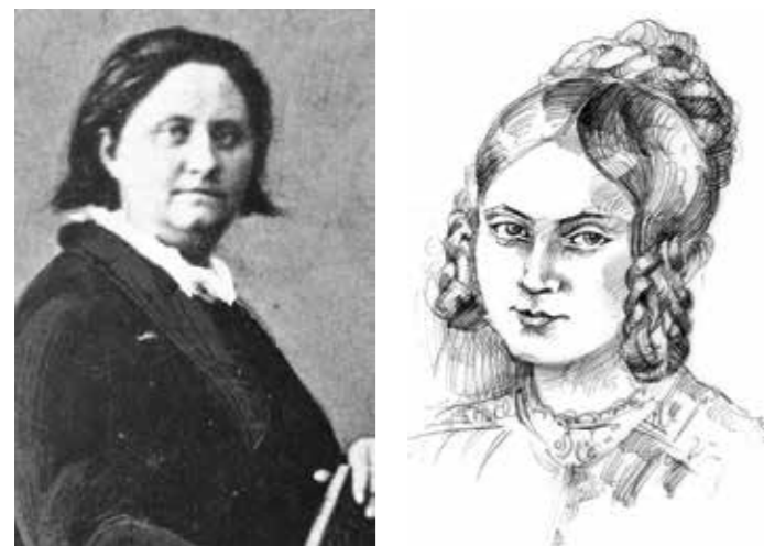
Mathilde Franziska Anneke: Die bekannte Flechtfrisur trug sie später nicht mehr.

Die Städte Hattingen und Sprockhövel suchen Menschen, die sich für Gleichstellung einsetzen