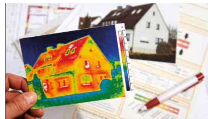
Über schlecht gedämmte Dachflächen geht viel wertvolle Heizenergie verloren. Dadurch werden sowohl das Klima als auch der Geldbeutel der Bewohner belastet. Wie groß das individuelle Einsparpotenzial ist, zeigen durchdachte Online-Tools mit wenigen Klicks im Internet.

Oft wird gezögert, weil Betroffene weder ein Gefühl für die Kosten noch für das mögliche Einsparpotenzial haben. Was viele nicht wissen: Es gibt Online-Tools, die bequem und schnell Antwort auf diese Fragen liefern. So bietet der Dämmsparrechner von Ursa privaten Hausbesitzern eine erste Orientierung über Kosten und Nutzen einer verbesserten Wärmedämmung. Für die Berechnung reichen wenige Werte wie das Baujahr der Immobilie, die Quadratmeterzahl der Wohnräume im Steildach und die Art des Heizsystems. Schon nach wenigen Klicks wird für Eigenheimbesitzer der Nutzen einer Dämmmaßnahme sichtbar: Die Online-Anwendung zeigt, welche Einsparmöglichkeiten an Energie, Heizkosten und CO 2 -Emissionen die Dämmung bietet. Eigenheimbesitzer erfahren, welche Dämm Lösungen für sie in Frage kommen und wann sich die Materialkosten amortisieren. Die Werte direkt vor Augen zu haben, ist für viele dann Grund genug, das erste weiterführende Gespräch mit dem Fachhandwerk vor Ort zu führen, um künftig deutlich weniger Heizkosten zahlen zu müssen. Der hilfreiche Rechner zur Wärmedämmung findet sich online unter www.dämmsparrechner.de . Hier gibt es auch viele weitere Infos rund um das Dämmen des Eigenheims. txn