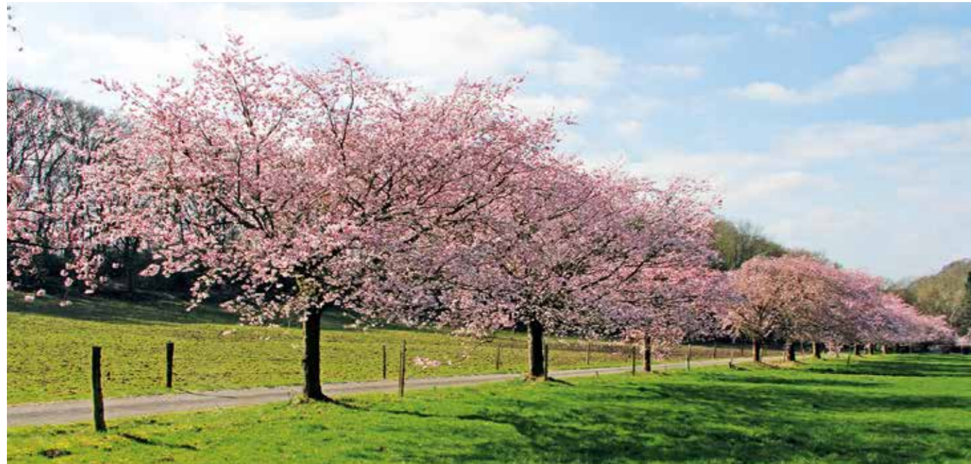
Wenn die Natur im Frühling erwacht, zieht es viele Menschen zum Wandern in die Natur.