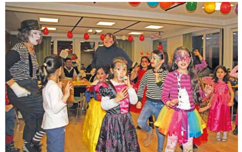
Foto: Eine der vielen Aktionen des Cafés Miteinander.