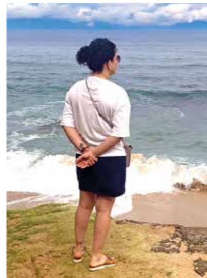
Dem Rauschen des Meeres lauschen, die Bergluft einatmen oder einfach in Balkonien die Füße hochlegen - Urlaub kann man auf verschiedene Arten machen, aber immer gilt: Je mehr Urlaub, desto besser!

Für viele Arbeitnehmer sind Brückentage ein wahrer Segen, um die wohlverdiente Auszeit vom stressigen Berufsalltag zu genießen. Daher lohnt es sich, rechtzeitig einen Blick auf den Kalender des Jahres 2024 zu werfen, um die Brückentage in NRW optimal zu nutzen. Mit der richtigen Planung können Sie Ihr Urlaubskonto deutlich aufstocken und sich auf eine erholsame Zeit freuen.