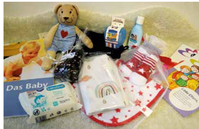
Inhalt der Babybegrüßungstasche.

Das Jugendamt der Stadt Sprockhövel hat mit dem Deutschen Kinderschutzbund Hattingen/Sprockhövel den „Babybegrüßungsbesuch“ ins Leben gerufen. Während des Besuchs wird für alle Neugeborenen in der Stadt eine Babybegrüßungstasche überreicht, in der sich kleine Geschenke von unterschiedlichen Sponsoren, wie auch viele wertvolle Informationen für Familien mit Neugeborenen befinden. Diese Taschen werden vom Jugendamt zusammengestellt, vom Kinderschutzbund an die frischgebackenen Eltern verteilt und sollen den Neugeborenen zugutekommen. Aktuell befinden sich unter anderem ein kleines Stofftier, Söckchen, ein Lätzchen und ein Spucktuch in dieser Tasche. Wer sein Baby ab dem 1. Oktober 2023 bekommen und Interesse an der Babybegrüßungstasche hat, kann sich bei Frau Riesop, Jugendamt der Stadt Sprockhövel, unter der Telefonnummer 02339 917-333 melden. Ein gemeinsamer Termin mit dem Kinderschutzbund Hattingen/Sprockhövel wird im Anschluss vereinbart.