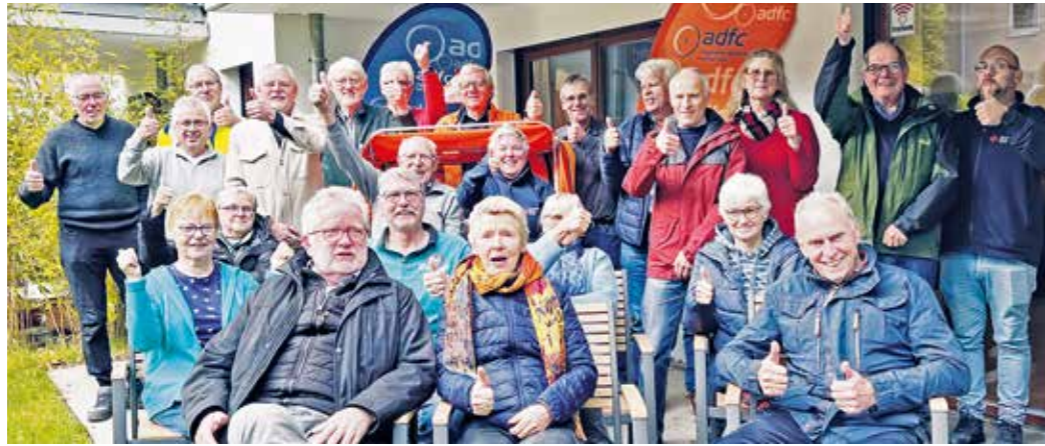
Rikscha-Teams qualifizieren sich als Ersthelfer. Spaß bei der ernsthaften Sache war aber auch dabei.

Unter dem Leitwort „Mut zur Hoffnung“ steht die diesjährige Adventssammlung von Caritas und Diakonie in Nordrhein-Westfalen bis 9. Dezember. Auch in der Pfarrei St. Peter und Paul Hattingen werden Ehrenamtliche der Pfarrcaritas Spendenaufrufe unter die Hattinger bringen. In den katholischen Gemeinden vor Ort und durch die Caritas Ruhr-Mitte mit ihren Diensten und Einrichtungen in Hattingen werden Betroffene unterstützt. Die Hälfte der Erträge der Adventssammlung steht der Pfarrcaritas vor Ort zur Verfügung. Die andere Hälfte der Spenden erhalten die Orts Caritasverbände und der Diözesan-Caritasverband für ihre Hilfs- und Unterstützungsprojekte.