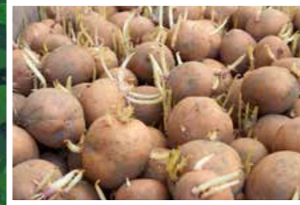
Damit wir die Kartoffeln einpflanzen konnten, haben wir sie vorgekeimt lassen.