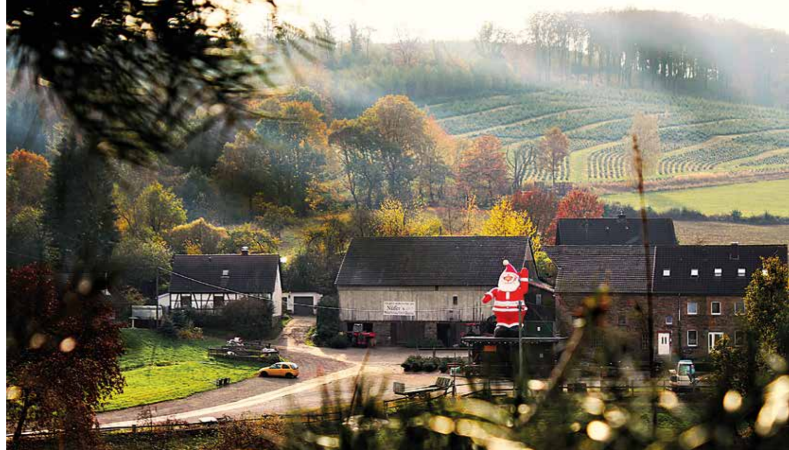
Der Hof der Familie Nüfer in der Elfringhauser Schweiz, in der Porbecke 10. An den Adventswochenenden hat die Glühweinhütte von 10 bis 18 Uhr geöffnet. Parallel kann man in „Nüfer's Deele“ nach Geschenkartikeln, Dekoration, Advents- und Weihnachtsgeschenken und vielen weiteren (selbstgemachten) Kleinigkeiten stöbern. Ein großer roter Nikolaus weist den Besuchern den richtigen Weg. Alle Schonungen sind seit Ende November geöffnet und vom Hof fußläufig zu erreichen. Zum Selbersägen hat die Schonung „Am Wasserturm 88“ mit großer Auswahl geöffnet. Bollerwagen und Sägen gibt es leihweise und durch eine Umgestaltung der Verkaufsräume gibt es noch mehr Parkmöglichkeiten.

BEIDE: In einer quirligen Innenstadt, die allen Generationen Spaß macht. Das wird gut. anja