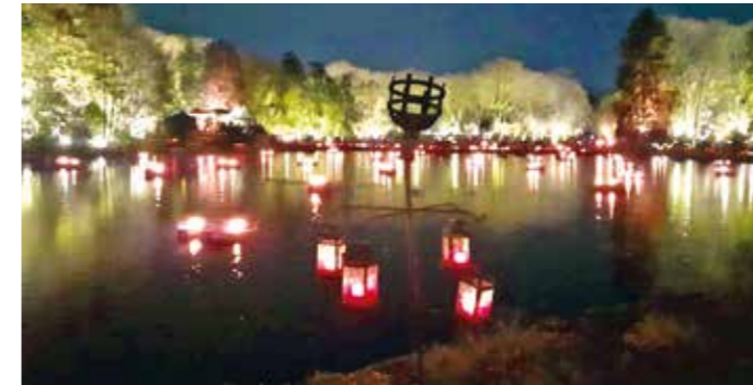
Der Freudenbaupark in Dortmund ist dank des Lichterfests bis zum 7. Januar hell erleuchtet.

Hier können Sie nach dem Fest noch bummeln