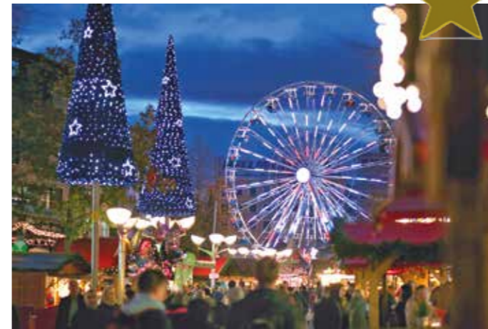
In Duisburg dreht sich das Riesenrad auf dem Weihnachtsmarkt auch nach dem 24. Dezember noch weiter.

Wer vom Weihnachtsmarkttrubel einfach nicht genug bekommt und auch nach dem Heiligen Abend Lust auf Glühwein und Weihnachtsstimmung hat, kann sich bis zum 30. Dezember auf den Weg nach Essen machen. Im Stadtteil Steele bietet der kleine, aber feine Weihnachtsmarkt alles, was das festlich gestimmte Herz begehrt. Auch eine kleine Konzertbühne steht bereit, auf der es Comedyevents, Konzerte und Kindertheater zu bestaunen gibt. Weitere Infos gibt es unter www.wir-fuer-steele.de .