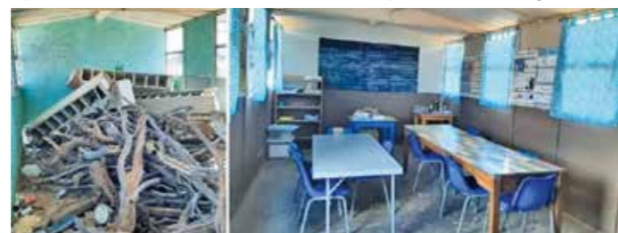
Vorher - nachher: mit Hilfe des Vereins werden Gemeinschafts-, Schul- und Wohnräume hergerichtet.