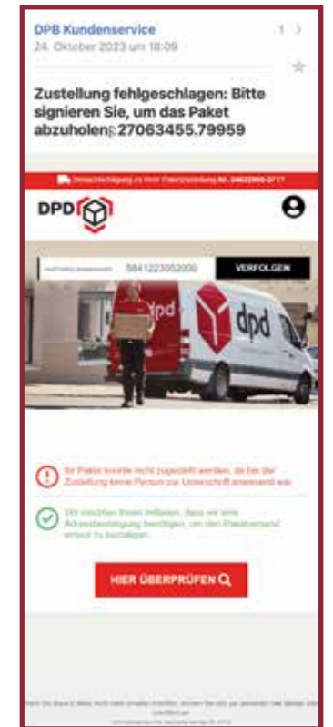
Diese Mail ist von Betrügern versendet worden. Der Absender, die auffällige Betreffzeile mit Sonderzeichen, das falsche Logo, drei verschiedene Sendungsnummern, die Aufforderung einen Link zu klicken und persönliche Daten herauszugeben sowie das eigenartige Impressum weisen darauf hin.

sollte, steht weiter unten. Und auch das Impressum deutet klar auf eine Fake-Mail hin. Hier stehen nämlich nicht die üblichen Informationen, sondern nicht einmal ein korrekter Satz: „Wenn Sie diese E-Mails nicht mehr erhalten möchten, können Sie sich per abmelden hier klicken oder schriftlich an 1070 Montgomery Rd, Altamonte Springs, FL 32714.“ Und nicht einmal wird in der Mail mein Name, andere persönliche Daten oder der Absender erwähnt, wie es in einer echten DPD-Mail der Fall wäre. Tipp: Wenn Sie in Mails zum Klicken eines Links aufgefordert werden, überprüfen Sie genau, ob die Mail für Sie bestimmt ist (Erwarten Sie überhaupt gerade ein Paket?) und wirklich von einem seriösen Anbieter stammt. Die Mailadresse ist ein guter Indikator. Generell gilt: Lieber einen Link ungeklickt lassen und beim Versanddienstleister direkt telefonisch oder per Mail erkundigen, was es damit auf sich hat. Dafür die Nummer bzw. Mailadresse der offiziellen Seite benutzen und niemals Angaben aus der verdächtigen Mail. nxs