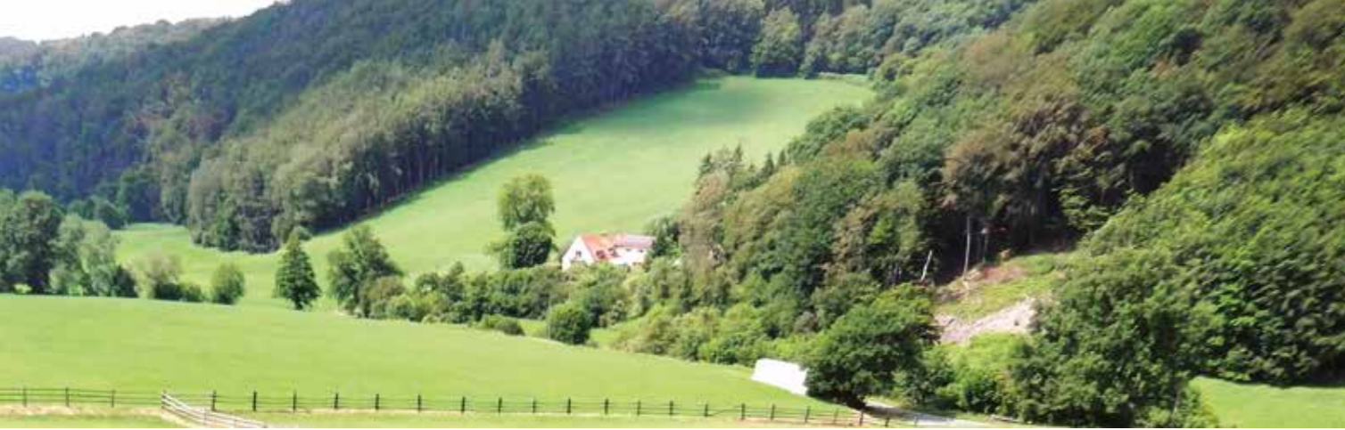
Winzermark und Elfringhauser Schweiz - hier geht's ländlich zu. Und in vergangenen Zeiten war das genau das, was eine Diebesbande brauchte.