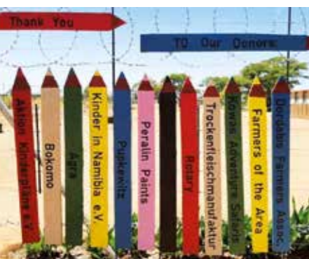
Dank an die Sponsoren: Auch für den Verein „Kinder in Namibia“ wurde eine Buntstift-Zaunlatte aufgestellt.