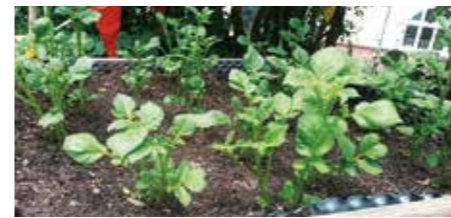
Hurra! Die Kartoffelpflanzen wachsen.

Die Kinder der Villa Regenbogen bringen viele unterschiedliche Herkunftssprachen mit. Daher hat sich die Einrichtung Kommunikation und Spracherwerb im Rahmen eines sozialen Miteinanders zum Schwerpunkt gesetzt. Gleichzeitig eint die Kinder ein großes Interesse für die Natur. So entstand die Idee, ein Sprachprojekt rund um das Thema „Garten“ ins Leben zu rufen. Erzieherinnen und Kinder haben das Projekt „Mit dem KinderGARTEN erblüht unsere Sprache“ – gefördert von der Gelsenwasser-Stiftung - mit viel Begeisterung und Kreativität gestaltet. Das Projekt war eine wunderbare Möglichkeit, die Sprachentwicklung der Kinder auf spielerische und interaktive Weise zu fördern.