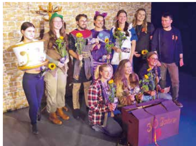
Ensemble des Multiversums