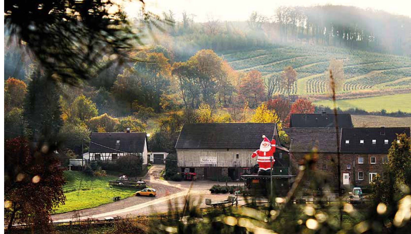
Der Hof der Familie Nüfer in der Elfringhauser Schweiz, in der Porbecke 10. An den Adventswochenenden hat die Glühweinhütte von 10 bis 18 Uhr geöffnet. Parallel kann man in „Nüfer's Deele“ nach Geschenkartikeln, Dekoration, Advents- und Weihnachtsgeschenken und vielen weiteren (selbstgemachten) Kleinigkeiten stöbern. Ein großer roter Nikolaus weist den Besuchern den richtigen Weg. Alle Schonungen sind seit Ende November geöffnet und vom Hof fußläufig zu erreichen. Zum Selbersägen hat die Schonung „Am Wasserturm 88“ mit großer Auswahl geöffnet. Bollerwagen und Sägen gibt es leihweise und durch eine Umgestaltung der Verkaufsräume gibt es noch mehr Parkmöglichkeiten.

BEIDE: In einer quirligen Innenstadt, die allen Generationen Spaß macht. Das wird gut. anja