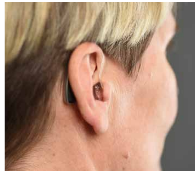
Hörsysteme können dafür sorgen, dass Menschen mit Hörverlust „geistig auf der Höhe“ bleiben.

Je älter man wird, desto mehr lässt das Hörvermögen nach. Gleichzeitig nehmen die sogenannten „kognitiven Fähigkeiten“ ab. Dieser Sammelbegriff umfasst wichtige Dinge, wie zum Beispiel Aufmerksamkeit, Erinnerungsvermögen, Konzentration, die räumliche Vorstellungskraft. Das sind Grundlagen des menschlichen Denkens. Diese kognitiven Fähigkeiten sind wichtig, um den Alltag zu gestalten. Forscher empfehlen daher, dass ältere Menschen grundsätzlich ihre kognitiven Fähigkeiten nutzen und trainieren sollten, um so auch ihr Sprachverstehen zu verbessern. Wenn das Hörvermögen eingeschränkt ist, kann die Versorgung mit Hörsystemen dafür sorgen, dass Menschen mit Hörverlust „geistig auf der Höhe“ bleiben und kognitiv in etwa auf dem gleichen Niveau sind wie Menschen ohne Hörverlust.