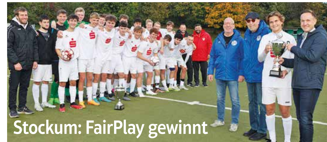
Das A-Junioren-Team von Tus Witten Stockum 1945 e.V., als Gewinner des FairPlay-Pokals „Junioren 2022/23“.

Seniorenhaus Witten-Stockum GmbH | Helfkamp 8 b | D-58454 Witten Telefon: 02302 9886100 | Fax: 02302 9886155 | E-Mail: info@seniorenhaus-witten-stockum.de