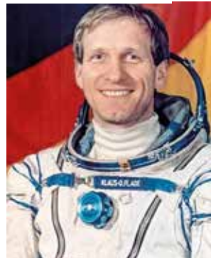
Astronaut Thomas Flade im Raumanzug.