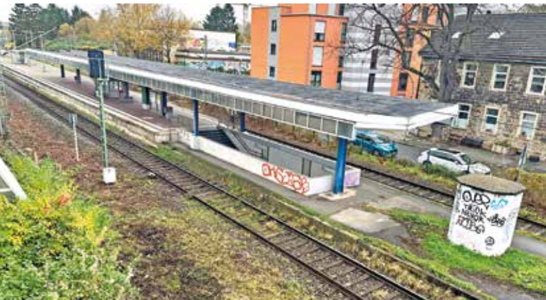
Der Bahnhof Witten-Annen Nord ist selbst frisch gereinigt keine Augenweide und nur über zwei steile Treppen zu erreichen.

Stadt, Land, DB oder VRR: Wer ist Zuständig für die schlechten Zustände am Bahnhof?