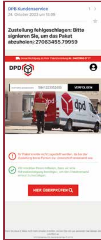
Diese Mail ist von Betrügern versendet worden. Der Absender, die auffällige Betreffzeile mit Sonderzeichen, das falsche Logo, drei verschiedene Sendungsnummern, die Aufforderung einen Link zu klicken und persönliche Daten herauszugeben sowie das eigenartige Impressum weisen darauf hin.

Tip: Wenn Sie in Mails zum Klicken eines Links aufgefordert werden, überprüfen Sie genau, ob die Mail für Sie bestimmt ist (Erwarten Sie überhaupt gerade ein Paket?) und wirklich von einem seriösen Anbieter stammt. Die Mailadresse ist ein guter Indikator. Generell gilt: Lieber einen Link ungeklickt lassen und beim Versanddienstleister direkt telefonisch oder per Mail erkundigen, was es damit auf sich hat. Dafür die Nummer bzw. Mailadresse der offiziellen Seite benutzen und niemals Angaben aus der verdächtigen Mail. nxs