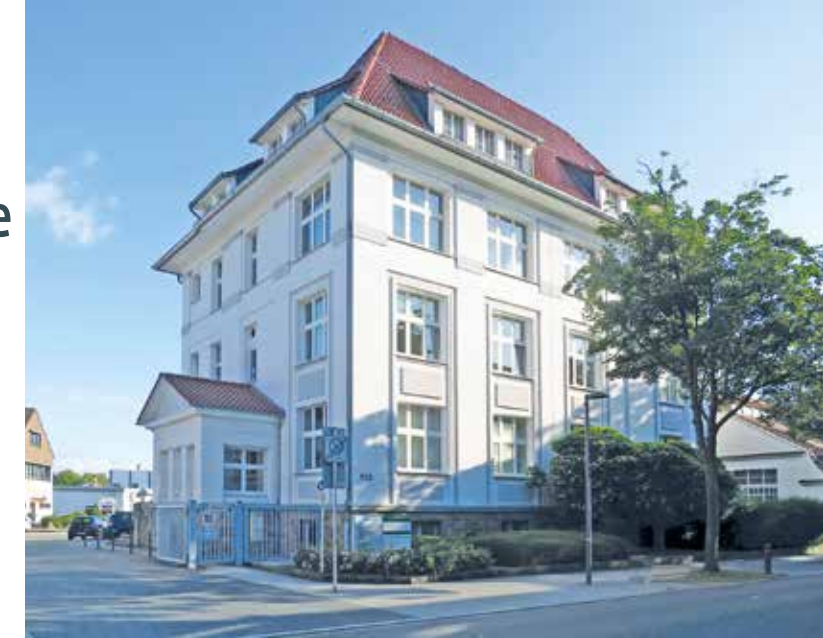
Eine denkmalgeschützte Immobilie zu erwerben kann durchaus überlegenswert sein, meint Magnus Terbahl von der Unteren Denkmalbehörde mit Sitz in der denkmalgeschützten Villa Wickmann.

Einige große Projekte laufen aktuell und lassen bereits erahnen, wie sich die Lebensqualität einer Stadt mit durchdachter Planung heben lässt. Das Bildungsquartier Annen und der Karl-Marx-Platz werden aufgewertet und sollen Orte werden, an denen sich Menschen treffen. Das denkmalgerecht sanierte Rathaus verbindet Gestern und Heute