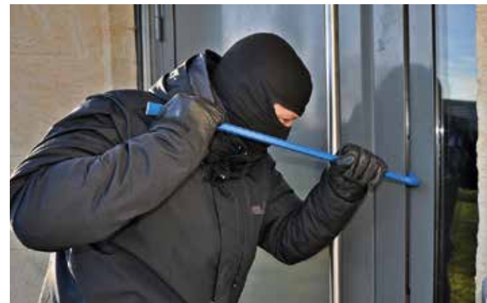
Mit der Kampagne „Riegel vor!“ macht die Polizei NRW auf das Thema Einbrecher und Einbrüche aufmerksam.

Für die Installation außen am Haus bietet das Gira Türkommunikations-System Türstationen im Design des Gira Schalterprogramms TX_44. Sie ermöglichen es zu klingeln, mit der Person an der Wohnungsstation zu sprechen und liefern ggf. mit einer Farbkamera Bilder vom Eingangsbereich an die Wohnungsstation. Bei Bedarf können diese Türstationen in die Gira Energiesäulen integriert und so als Türstationssäule am Eingangstor frei stehend installiert werden. Außerdem passen die Gira Türstationen in das Gira Panel mit Lichtelement und ermöglichen damit eine einheitliche Installation von Türkommunikation und Beleuchtung neben der Haustür.