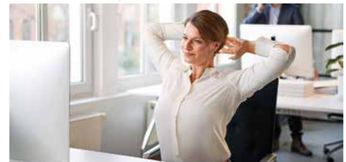
Damit wir unter Belastung fokussiert und entspannt bleiben, benötigen Muskeln und Nerven Unterstützung.

Um für den Jahresendspurt genügend Kraft zu finden und den Stress loszulassen, braucht es zudem Phasen der Erholung. Eine Joggingrunde um den Block, ein Kaffeeklatsch mit einer Freundin oder eine kurze private Taneinlage im Wohnzimmer zur Lieblingsmusik – das kann beispielsweise in akuten Stresssituationen dabei helfen, den Kopf freizubekommen. Noch besser ist es, ein Hobby oder einen Sporttermin fest in den Terminkalender zu übernehmen. So kann man im Alltag immer wieder Erholung finden. DJ