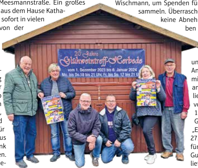
Ab dem 1. Dezember bricht in Herbede wieder die Glühweinzeit an. Plakate und ein Banner künden vom Herbeder Glühweintreff, der zwischen dem 1. Dezember und 6. Januar fast durchgängig geöffnet hat.

Bis zum 6. Januar schenkt eine Gruppe von ehrenamtlichen Mitarbeitern jeden Abend von Montag bis Donnerstag von 18 bis 21 Uhr und freitags bis sonntags bereits ab 17 Uhr Glühwein und Punsch, auch für Kinder, aus. Nur an Heiligabend, Weihnachten und auf Silvester und Neujahr bleibt der kleine Treff für Herbeder und viele Besucher aus dem Umfeld für ein warmes Getränk und nette Gespräche geschlossen. Alle Einnahmen werden anschließend wieder für wohltätige Zwecke gespendet. Im letzten Jahr umfasste die Spende rund 10.000 €. Ins Leben