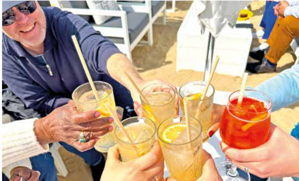
Hoch die Cocktailgläser! Strand und Urlaubsgefühl gibt es in Witten und Hattingen mitten in der Stadt.

Zum zweiten Mal findet das Stadtwerke-Open-Air-Kino im Freibad Annen statt. Noch bis zum 9. Juli, kann man unterm Sternenhimmel den Stars der Filmindustrie zuschauen. Täglich gibt es um 15 Uhr eine Kindervorstellung und donnerstags bis sonntags eine Abendvorstellung um 19 Uhr für Erwachsene Filmfans. Der Kinospaß kostet für Kinder 4