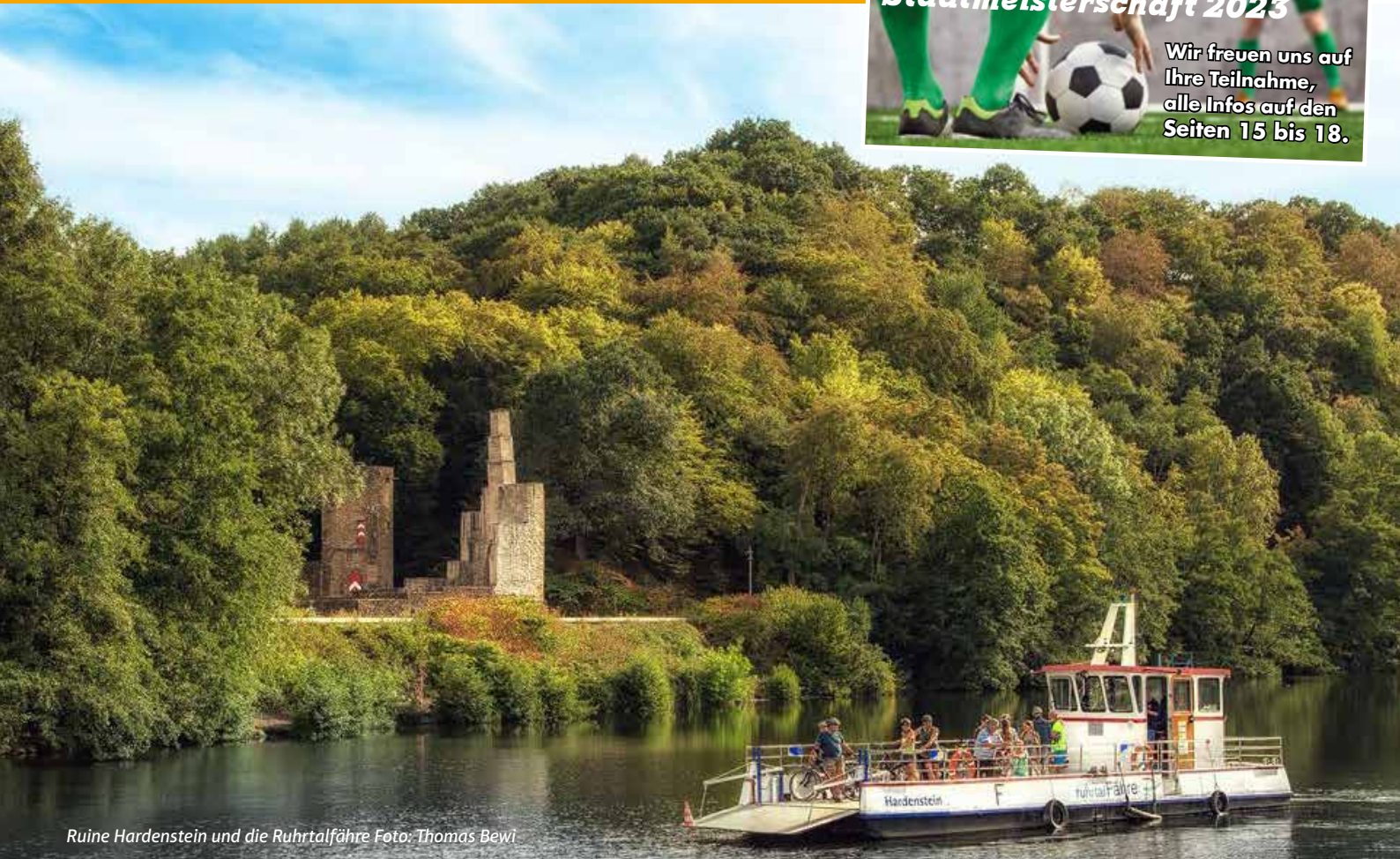
Ruine Hardenstein und die Ruhrtaifähre