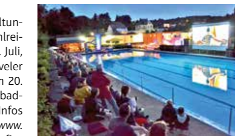
Das Freibad in Sprockhövel wird am 26. August zum Freiluftkino.

Doch auch weitere Veranstaltungen locken im Sommer zahlreiche Gäste ins Bad wie am 9. Juli, 10-17 Uhr, das 8. Sprockhöveler Badewannenrennen oder am 20. August, 10-12 Uhr, der Freibad-Taufgottesdienst. Weitere Infos und Termine sind unter www.sprockhoevelschwimmt.de zu finden.