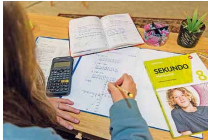
Schulmaterialien sind teuer. Wer Wohngeld bezieht, kann sie sich zum Teil aus den BuT-Leistungen erstatten lassen.

25 Prozent der Nachhilfekinder werden staatlich gefördert Die BuT-Gelder sollen dazu beitragen, dass alle Kinder in Deutschland die gleichen Bildungschancen haben – egal ob die Eltern viel Geld verdienen oder nicht. Durch diese Unterstützung haben auch Familien mit geringem Einkommen eine Chance, schnelle und professionelle Hilfe zu bekommen, falls die Noten der Kinder absacken und die Motivation für die Schule sinkt. Und das kommt gar nicht so selten vor: