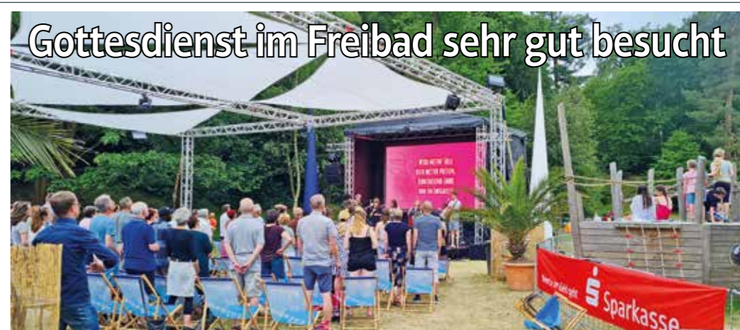
Auf großen Zuspruch stieß ein Gottesdienst der Creativen Kirche unter freiem Himmel im Freibad Annen.

In den Abendstunden von Donnerstag bis Sonntag richtet sich das Angebot ab 19 Uhr an die Erwachsenen mit Filmen wie „Einfach mal was Schönes“ (29.6.), „Shotgun Wedding“ (30.6.), „Spiderman: No Way Home“ (1.7.) oder „Elvis“ (7.7.). Das Open-Air-Kino endet am 9. Juli schließlich mit dem kultigen Ruhrgebietsklassiker „Bang Boom Bang“. Für die älteren Besucher stehen Getränke, Popcorn und Nachos zur Verfügung. Die Erlöse aus dem Popcorn-Verkauf werden komplett an den Kinderschutzbund gespendet, so Markus Borgiel. Einen Eisverkäufer, der durch die Zuschauerreihen geht, wird es jedoch nicht geben. dx