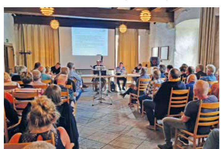
Großes Interesse zeigten viele Anwohner aus der Rüsbergstraße und Rehnocken an der Bürgerversammlung über den Neubau der Wittener Straße.

Das Fahrwerk ist Profisache Sicherheitsrelevante Teile wie Bremsen, Stoßdämpfer, Gelenke, Federn und Batterie können nur die Kfz-Profis in der Werkstatt verlässlich prüfen. Beim Auslesen des Kfz-Steuergeräts lassen sich demnächst anstehende Wartungsintervalle feststellen, die man noch vor Reiseantritt durchführen sollte.