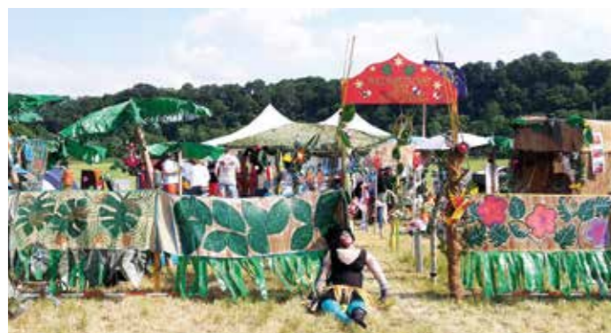
Gewinner des Performance-Preises: die Wattwürmer.