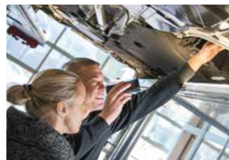
Nach einer gründlichen Fahrzeuginspektion ist das Auto gut gerüstet.

Funktionstüchtige Blinker, Brems- und Rückleuchten sowie Scheinwerfer sind wichtig für sichere Fahrt in jeder Situation. Zusätzlich muss