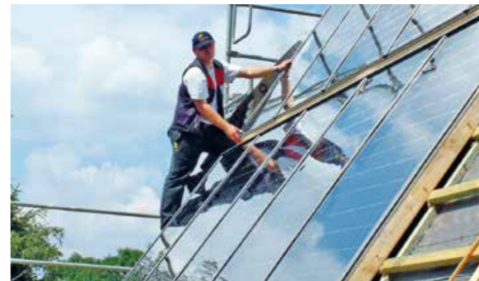
Mittlerweile haben über 1.000 Dachdeckerbetriebe an einer ZVDH-zertifizierten Weiterbildung zum Photovoltaik-Manager im Dachdeckerhandwerk teilgenommen.

Wer einen Innungs-Dachdeckerbetrieb sucht, wird hier fündig: www.dachdecker.de . Alle Infos zu neuen steuerlichen Regelungen sind auf der Website des Finanzministeriums abrufbar: www.bundesfinanzministerium.de . akz-o