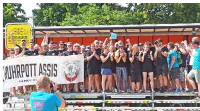
Die Siegerehrung „Fun-Teams“: links die Ruhrpott-Assis (2. Platz), rechts die Pottnieten 69 (1. Platz).