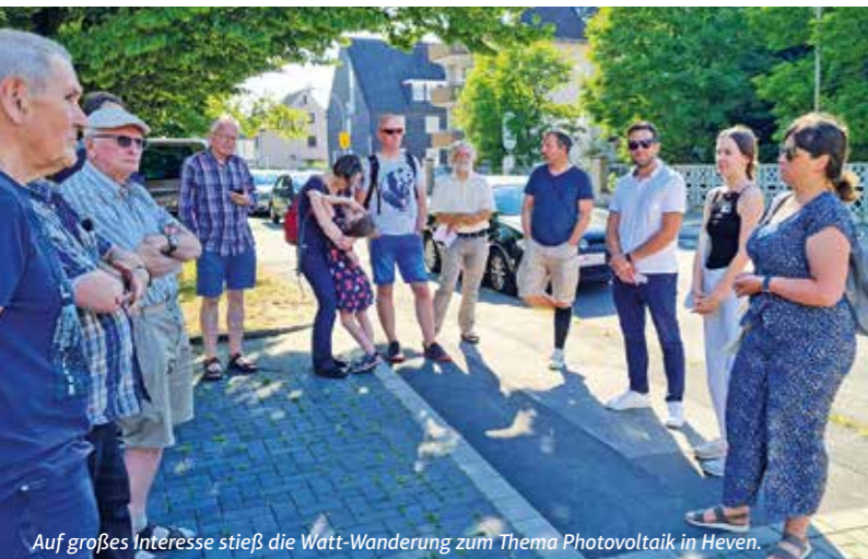
Auf großes Interesse stieß die Watt-Wanderung zum Thema Photovoltaik in Heven.

Nicht zuletzt aufgrund der Diskussionen über die hohen Energiepreise und das neue Heizungsgesetz überlegen jetzt viele Hauseigentümer und Mieter, sich ein Stück weit unabhängiger zu machen und eine eigene Photovoltaik-Anlage aufs Dach oder an den Balkon zu