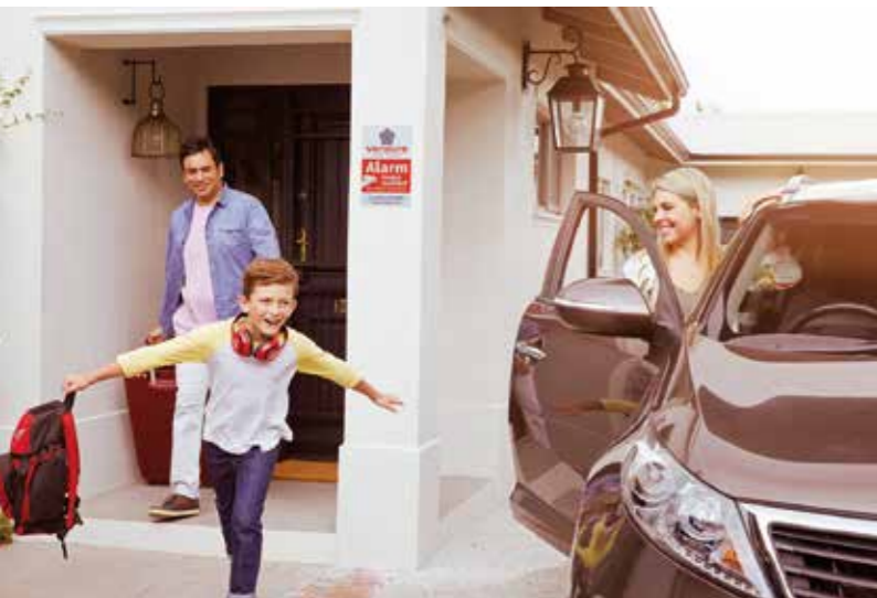
Die ganze Familie freut sich darauf, dass es endlich in die großen Ferien geht - das Zuhause sollte während der Abwesenheit gut geschützt sein.

Die sechs besten Tipps für ein sicheres Zuhause