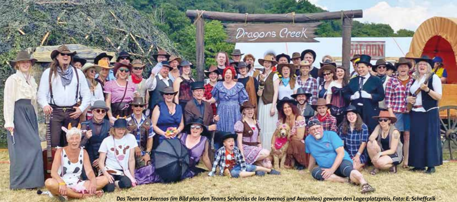
Das Team Los Avernos (im Bild plus den Teams Señoritas de los Avernos und Averninos) gewann den Lagerplatzpreis, Foto: E. Scheffczik