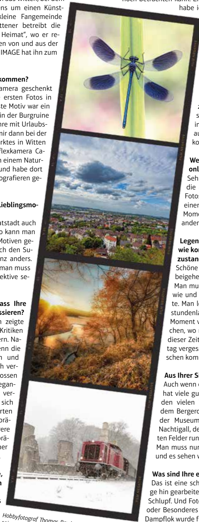
Hobbyfotograf Thomas Bewi aus Witten verzaubert mit seinen Fotos nicht nur seine Facebook-Fans, sondern hat schon einige Preise gewonnen.