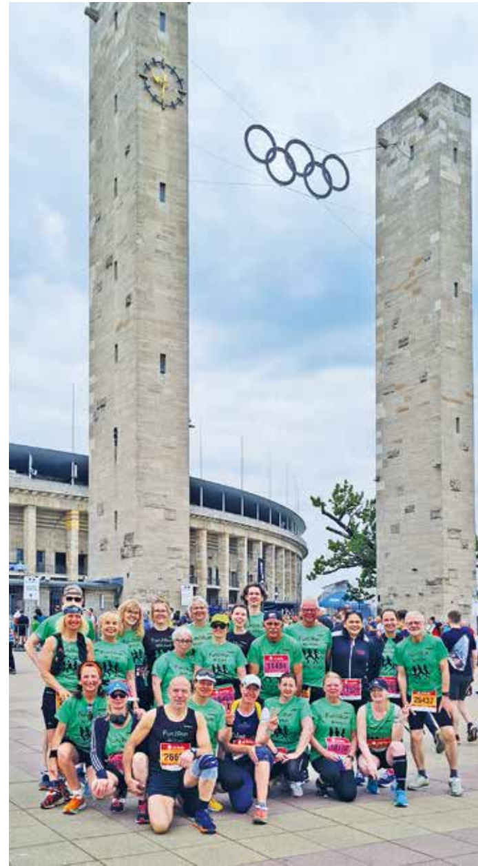
Trotz kurzfristig abgesagter Gruppenfahrt im ICE und überraschender Visite von Ministerpräsident Selenskyj wurde der „Berlin läuft“ für FunVorRun Witten ein großer Erfolg.

Vom 12. bis 14. Mai verlebte die Wittener Laufgruppe FunVorRun (FvR) ein tolles Wochenende in der Bundeshauptstadt Berlin. Auf dem Programm standen neben jeder Menge Sightseeing der Start beim großen Lauf-Event „Berlin läuft“. Mehrmals stand die Teilnahme auf der Kippe.