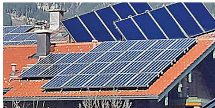
Erneuerbare Energien auch im Altbau nutzen? Unbedingt!

Der letzte Winter - die Unsicherheit bezüglich Gasversorgung und die enorm gestiegenen Heizkosten - steckt allen noch in den Knochen. Aber wie jetzt weiter? Schritt für Schritt in Richtung Unabhängigkeit! Die Energieeffizienz verbessern, nach und nach erneuerbare Energien ergänzen. So machen Sie Ihr Haus EE-ready.