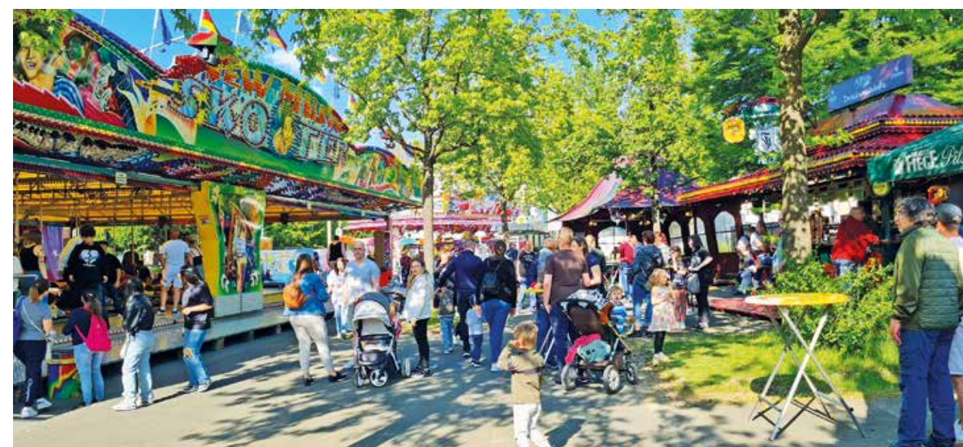
Bunt, bunter, am buntesten: auch die 328. Auflage der Himmelfahrtskirmes zog wieder viele Besucher an.