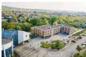
Blick auf das Campuszentrum der Uni Witten/Herdecke