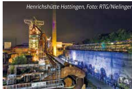
Henrichshütte Hattingen