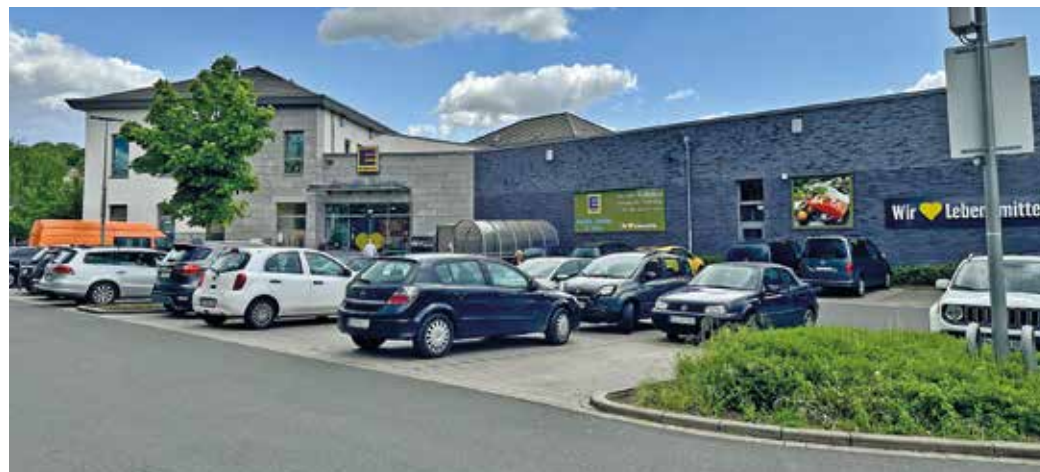
In Herbede steht bereits ein neuer Supermarkt mit Vollsortiment, der ähnlich dem geplanten Bau am Crengeldanz sein soll.

Wieder einmal hat sich ein Lastkraftwagen unter der Eisenbahnunterführung am Crengeldanz, Höhe Bochumer Straße, festgefahren. Der Rüstwagen-Trupp der Bogestra rückte aus und reparierte den entstandenen Schaden. Schon vor Jahren gab es Überlegungen, die Fahrbahn tiefer oder die Brücke höher zu setzen. Die Deutsche Bahn hat 2019 angekündigt, die Brücke durch einen Neubau ersetzen zu wollen - bis 2028.