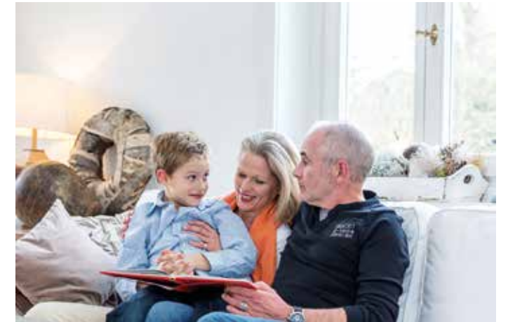
Wer gut hört, muss sich beim Verstehen von Sprache weniger anstrengen und hält seine Ohren und die kognitiven Fähigkeiten fit.

Abhilfe schaffen Hörakustiker mit der Anpassung moderner Hörsysteme, die gezielt und effektiv auf jeden persönlichen Hörbedarf eingestellt werden und das Wohlbefinden wieder herstellen können. Eine der wesentlichen Herausforderungen sind dabei die komplexen Hörsituationen mit vielen Gesprächspartnern und lebhafter Geräuschkulisse. Die aktuellen audiologischen Strategien nutzen dabei die Erkenntnisse über die Höranstrengung und die Auswertung des Gehörten im Gehirn. Die Schallverarbeitung berücksichtigt den gesamten auditiven Raum, der den Hörsystemträger umgibt. Im Mittelpunkt stehen dominierende Signale (wie zum Beispiel ein Sprecher in unmittelbarer Nähe), während gleichzeitig weitere akustische Einflüsse zugelassen werden. Dadurch ist die Konzentration auf ein Gespräch möglich, es kann aber jederzeit auf Geräusche oder andere Gesprächspartner