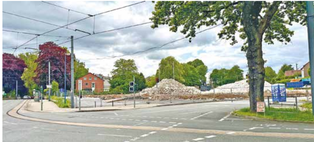
Vom ehemaligen Supermarkt am Crengeldanz sind nur noch einige Haufen Steine übrig.