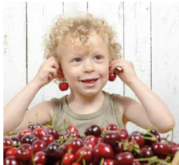
Hier ist gut Kirschen essen - doch was will man uns mit dem Spruch überhaupt sagen?

Nicht zu verwechseln ist der Eichenprozessionsspinner mit der Gespinstmotte. Sie ist zwar unschön, aber harmlos. Wenn Bäume oder Büsche von der Gespinstmotte befallen werden, sind sie von vielen Fäden oder Netzen durchzogen – manchmal sogar quasi vollständig. Die Raupen können die Pflanzen teils komplett kahlfressen. Diese erholen sich aber schnell und bilden einen zweiten Trieb, den sogenannten Johannistrieb. Für Menschen und auch Tiere ist die Gespinstmotte