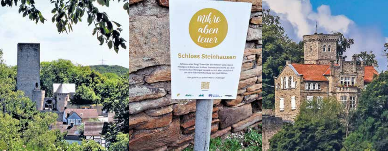
Auf zur Burgentour! Im Ennepe-Ruhr-Kreis gibt es viel zu entdecken. V.l.: Burg Blankenstein, Schloss Steinhausen, Burgruine Isenburg.