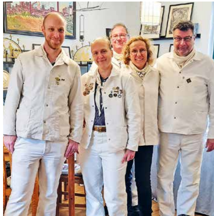
Zum Muttentalfest öffnete auch die Zeche Herberholz mit stilecht angezogenen Bergleuten ihre Türen für die Besucher.

Auch in diesem Jahr hatte das Stadtmarketing Witten wieder ein unterhaltsames Programm für das Muttentalfest auf die Beine gestellt. Allein der April machte wieder, was er will, und zeigte sich am zweiten Tag des eigenwilligen Monats von seiner regnerischen und kühlen Seite. Trotzdem: bei freiem Eintritt mehrerer Veranstaltungsorte, kostenloser Teilnahme an der Kinder-Osterolympiade und Nutzung der Stadtwerke-Elektro-Wegebahn fanden viele Gäste den Weg in die Wiege des Ruhr-Bergbaus.