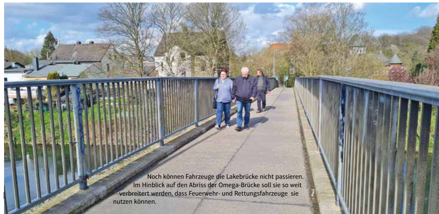
Noch können Fahrzeuge die Lakebrücke nicht passieren. Im Hinblick auf den Abriss der Omega-Brücke soll sie so weit verbreitert werden, dass Feuerwehr- und Rettungsfahrzeuge sie nutzen können.

rauscht, so breit sein, dass auch Feuerwehr- und Rettungsfahrzeuge sie dann für etwa ein Jahr im Bedarfsfall nutzen und sich lange Umwege sparen können. Planung und Bau der neuen Lakebrücke übernimmt die Stadt Witten. Einen großen Teil der Kosten wird aber voraussichtlich das Land NRW übernehmen. Die neue Lakebrücke soll bis zur IGA 2027 fertiggestellt und dem Rad- und Freizeitverkehr übergeben werden. Die große Omega-Brücke soll erst im Anschluss an die IGA abgerissen werden. dx