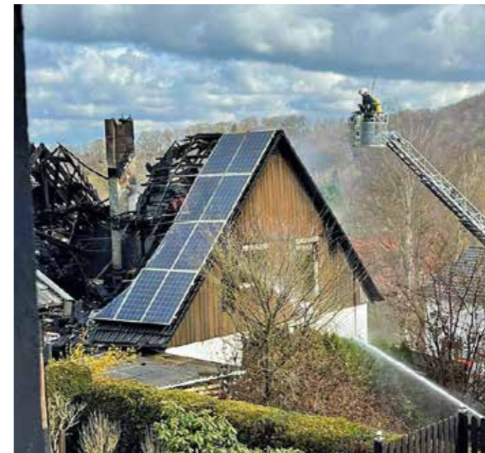
Ein schrecklicher Brand musste am 28. März in der Rauhe Egge gelöscht werden. Das Haus ist nicht mehr bewohnbar.

Der Tag wird seit 1999 begangen und ist zugleich Tag des Heiligen Florian, dem Schutzpatron