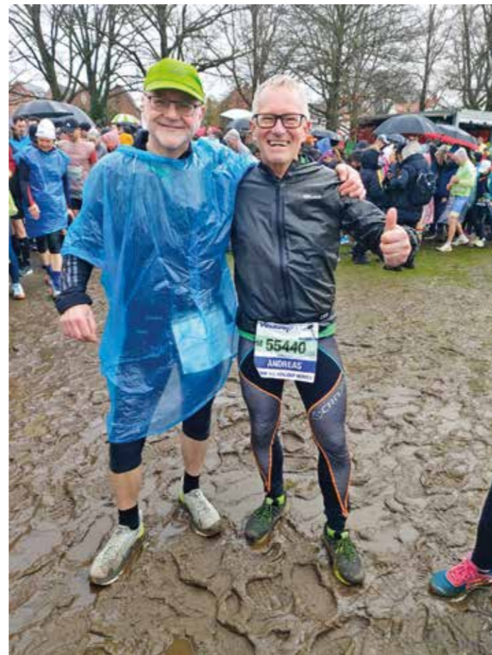
Gute Laune trotz Regens bei rd. 60 Läufern der FunVorRun-Gruppe Witten in Venlo/NL. 10 km oder ein Halbmarathon standen auf dem Programm.