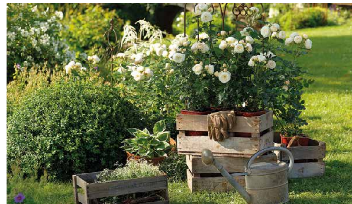
Containerrosen sind ideal für Rosenneulinge, denn sie kommen bereits blühend und mit festem Wurzelballen an und lassen sich leicht einpflanzen.