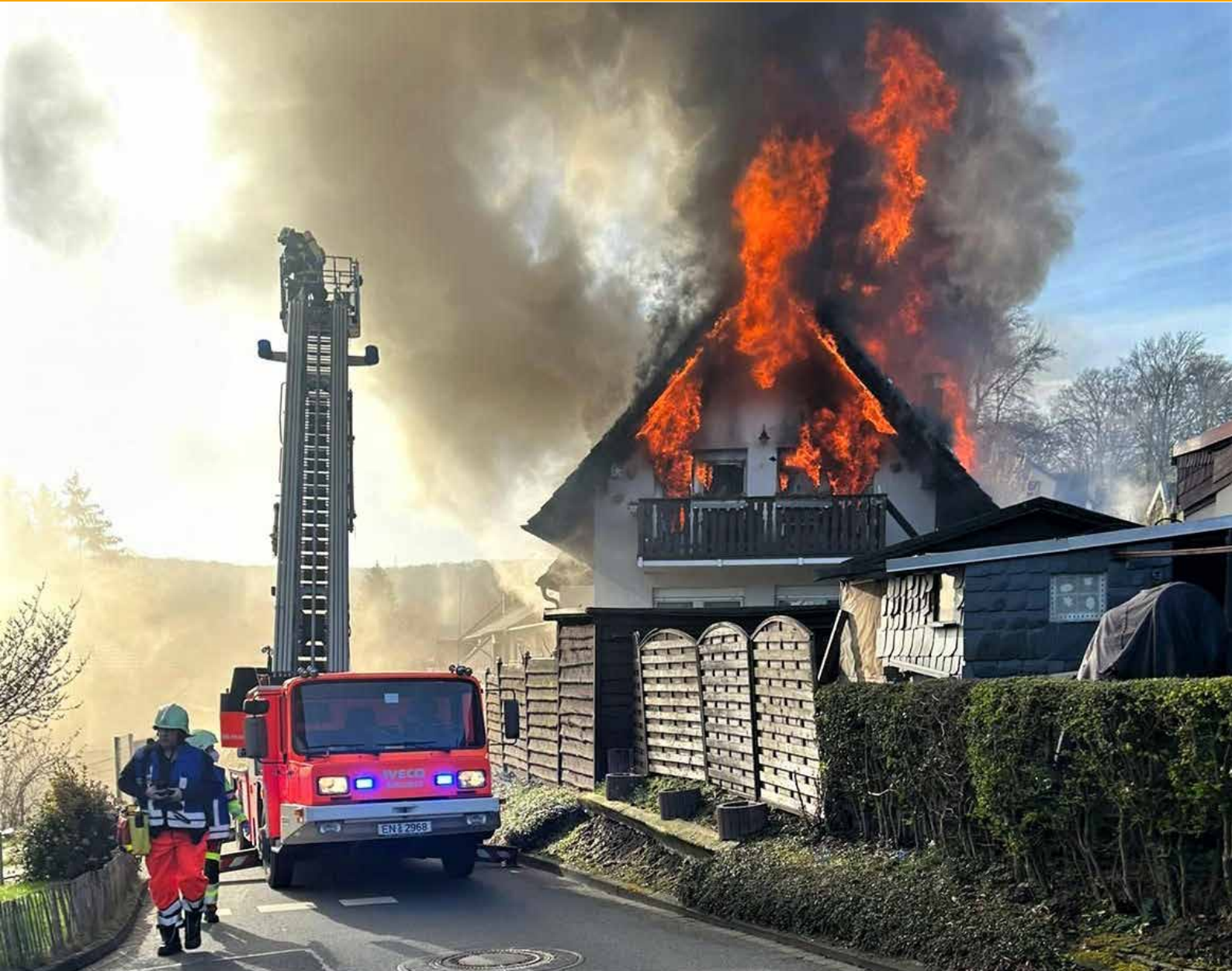
Höchstleistungen erbrachte die Feuerwehr bei diesem Brand in Herbede, Rauhe Egge. Am 4. Mai ist der Internationale Tag der Feuerwehr. Mehr dazu auf Seite 11.

+++ 4 MONATSMAGAZINE: GESAMTAUFLAGE CA. 90.000 EXEMPLARE +++ HAUSHALTSVERTEILUNG +++ ☎ 02302 9838980 +++ WWW.IMAGE-WITTEN.DE +++