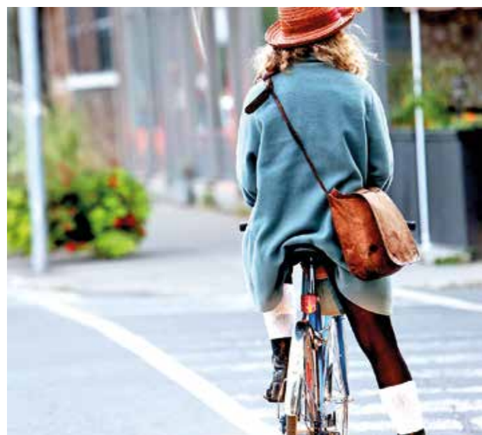
In Witten wird im Mai für das Stadtradeln in die Pedale getreten.

Die Anmeldung zum STADTRADELN ist ab sofort unter www.stadtradeln.de/witten möglich. Mehr Informationen unter: stadtradeln.de , facebook.com/stadtradeln , twitter.com/stadtradeln , instagram.com/stadtradeln .