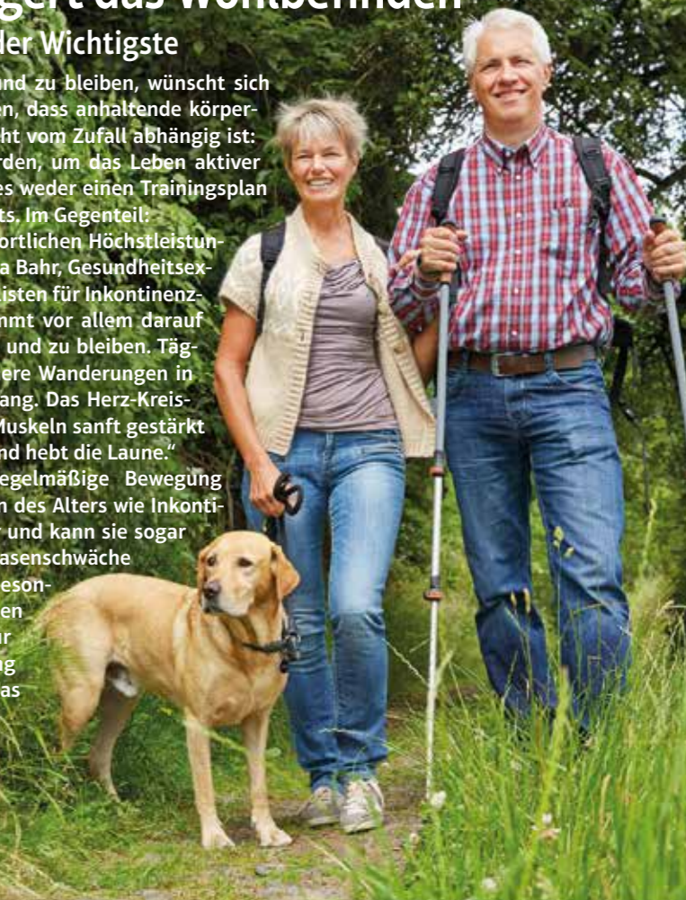
Den ersten Schritt zu mehr Wohlbefinden machen: Wer sich mit Freunden zu regelmäßigen Aktivitäten verabredet, bleibt länger motiviert. Beim Wandern beispielsweise verbessert sich die körperliche Fitness, während gesundheitliche Beschwerden gelindert werden können.

Konkrete Tipps finden sich online unter www.seni.de/wandern . txn