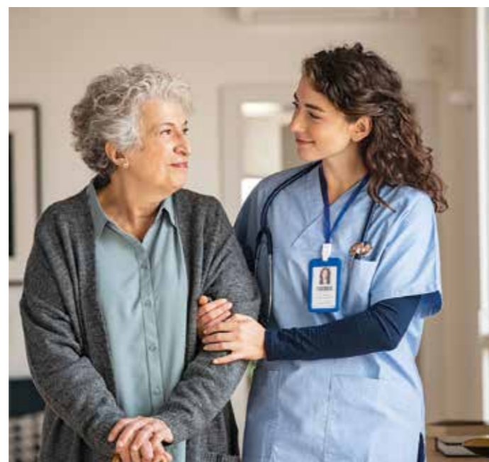
Die meisten Menschen werden zu Hause gepflegt. Für sie ist es besonders wichtig, dass ihre Pflegevorsorge möglichst viele Service- und Assistance-Leistungen enthält.

Verschiedene Gesellschaften bieten auch Unterstützung bei der schnellen Suche nach einer Tagespflege oder einem Pflegeheim und einem passenden Pflegeheimplatz vor Ort. Da die Pflegeheime oftmals sehr voll sind und auch qualitative Unterschiede aufweisen, kann diese Form der Hilfe schnell sehr nützlich sein. Mehr Infos gibt es unter www.allianz.de/pflegezusatzversicherung . Auch Pflegeschulungen und eine psychologische Betreuung werden vermittelt und der Kontakt zu Beratungseinrichtungen und Selbsthilfegruppen hergestellt. Und nicht zuletzt kann die Unterstützung bei einem Umzug, einer Wohnungsauflösung oder bei Umbaumaßnahmen im Wohnumfeld wichtig werden.