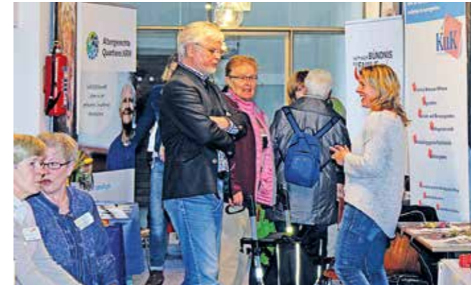
Auf den Fluren im Hattinger Rathaus ist immer viel los beim Gesundheitstag.