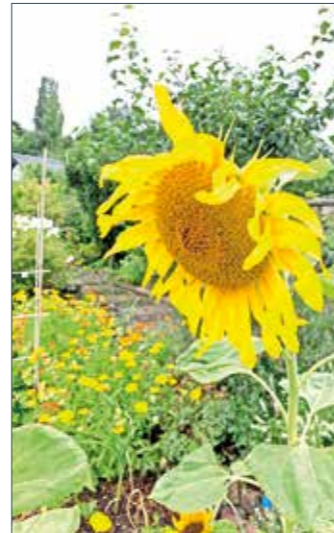
Schrebergärten haben in Deutschland eine lange Tradition.

Bei der Auswahl der Pflanzen ist es wichtig, auf die Bodenbeschaffenheit zu achten. Pflanzen, die einen sauren Boden bevorzugen, müssen anders behandelt werden als solche, die einen alkalischen Boden bevorzugen. Um ein konstantes Wachstum zu gewährleisten, sollten auch Pflanzen gewählt werden, die die gleiche Menge an Wasser und Nährstoffen benötigen. nxs