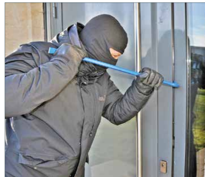
Es gibt wieder mehr Wohnungseinbrüche. Die Täter verschafften sich oft Zugang durch schlecht gesicherte Gebäudeöffnungen wie Haustüren, so die Polizei.

Wenn man der Corona-Pandemie etwas Positives abgewinnen wollen würde, dann wären da sicherlich die massiv gesunkenen Einbruchszahlen in der Zeit von Lockdowns, Kontakt- und Reiseverboten sowie Quarantäne. „Gelegenheit macht Diebe“ heißt es im Volksmund, und spätestens am 16. März 2020 fehlten Kriminellen die Gelegenheiten zum Einbruch, denn dort wurde der erste Lockdown beschlossen und plötzlich saßen wir alle fast ununterbrochen zu Hause in unseren eigenen vier Wänden. Mittlerweile ist die Pandemie so gut wie vorüber und das hat auch Einfluss auf die Kriminalität: „Volksfeste, Weihnachtsmärkte und andere Veranstaltungen haben in unseren Kommunen erfreulicher Weise wieder im vollen Umfang stattgefunden, erhöhen aber leider auch Möglichkeiten zur Begehung von Straftaten“, so die Kreispolizeibehörde Ennepe-Ruhr-Kreis.