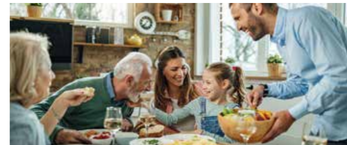
Familienfeste mit allen Sinnen genießen: Reden, lachen, schmecken und alles hören können gehören hier einfach dazu.

Was dann folgt, ist nicht selten ein Rückzug aus der allgemeinen Unterhaltung. Schlimmstenfalls nehmen Schwerhörige an geselligen Treffen von vornherein nicht mehr teil und vereinsamen zunehmend.