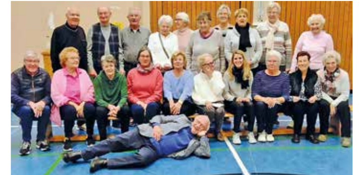
Wie so viele Vereine sucht auch der TV Hasslinghausen dringend Übungsleiter oder Übungsleiterinnen..

Kontaktmöglichkeiten gibt es unter der Rufnummer 0170 – 523 15 57 oder per E-Mail unter: info@tv-hasslinghausen.de