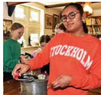
Rivethana mit der Flotten Lotte. Damit haben die Jugendlichen Apfelmus zubereitet.