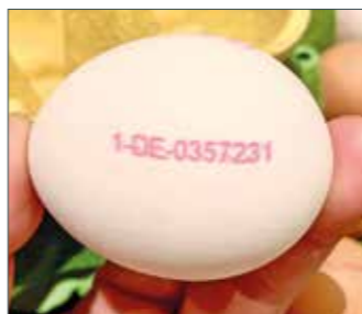
Sticht ins Auge, ist aber vielen noch ein Rätsel: der Code auf dem Ei.

Dass die Käfighaltung die schlechteste aller Haltungsformen für die Legehennen ist, sollte jedem bewusst sein. Aber was genau heißt ökologische Erzeugung, Freilandhaltung oder Bodenhaltung? Die Vorgaben sind klar geregelt und beispielsweise beim Bundesministerium für Ernährung und Landwirtschaft (BMEL) online nachzulesen: „In der konventionellen Legehennenhaltung sind nach der Tierschutz-Nutztierhaltungsverordnung bei der Boden- oder Freilandhaltung maximal neun Hennen pro Quadratmeter Stallfläche zulässig.“ Die Freilandhaltung unterscheidet sich von der Bodenhaltung dadurch, dass den Hennen zusätzlich pro Tier vier Quadratmeter Auslauffläche zur Verfügung stehen. Diese Flä-