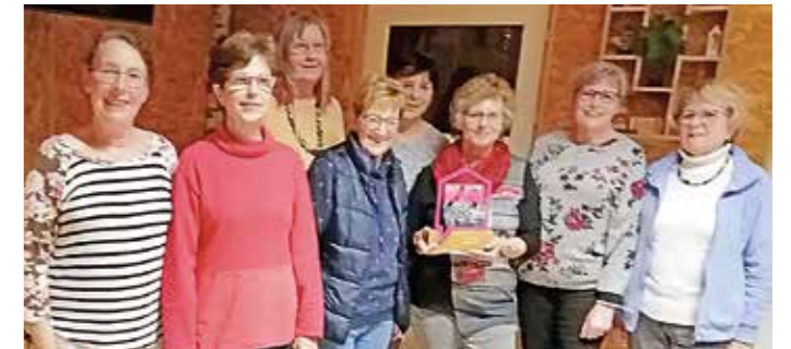
Die Gospelsisters proben mittwochs ab 19 Uhr im Vereinsheim des Kleingartens, Zechenstraße 24, in Sprockhövel. Interessierte informieren sich auf der Homepage unter www.gospelsisters-hasslinghausen.de.