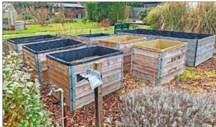
Im Frühjahr startet die Gartensaison. Auch die im Winter verwaisten Hochbeete können dann neu angelegt oder bepflanzt werden.

Hochbeete können schnell und einfach angelegt werden. Am besten wählt man einen Platz, der viel Sonne abbekommt, dann kann man bereits mit dem Anlegen des Beetes beginnen. Dafür benötigt man eine Folie, ein paar Holzplatten, Erde und Steine. Für die Folie sollte man ein wasserdichtes Material wählen und die Holzplatten sollten an den Seiten des Beetes befestigt werden, um das Eindringen von Wasser zu