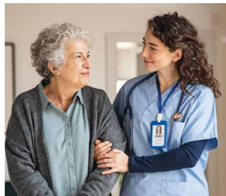
Die meisten Menschen werden zu Hause gepflegt. Für sie ist es besonders wichtig, dass ihre Pflegevorsorge möglichst viele Service- und Assistance-Leistungen enthält.