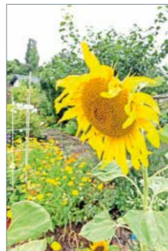
Schrebergärten haben in Deutschland eine lange Tradition.