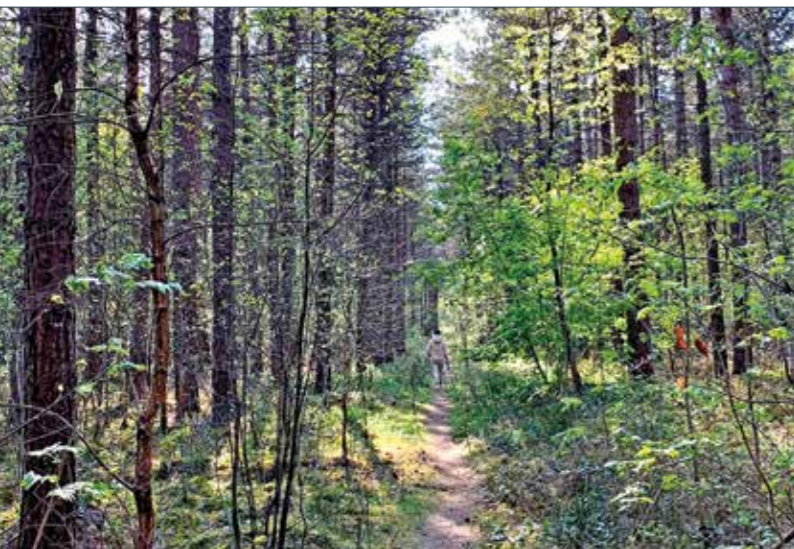
Den Bäumen in unseren heimischen Wäldern geht es nicht besonders gut. Besonders Buchen und Fichten haben mit dem Klimawandel und Schädlingen zu kämpfen.

Anlässlich des Tages des Baumes: Interview mit Förster Jansen über unseren heimischen Forst