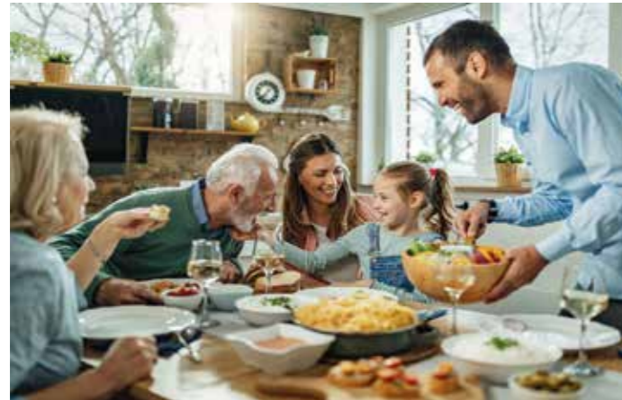
Familienfeste mit allen Sinnen genießen: Reden, lachen, schmecken und alles hören können gehören hier einfach dazu.