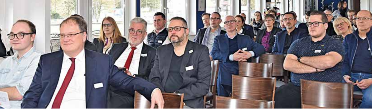
Das erste zeero-Fachforum beschäftigte sich mit dem Thema Wasserstoff. Neben Vertretern aus Unternehmen war Landrat Olaf Schade (2.v.l.) zu Gast. zeero ist das Kompetenz-Zentrum für Energie-, Effizienz- und Ressourcen-Optimierung im EN-Kreis. Zum Kernteam gehören AVU, Effizienz-Agentur NRW, EN-Agentur und Stadtwerke Witten.