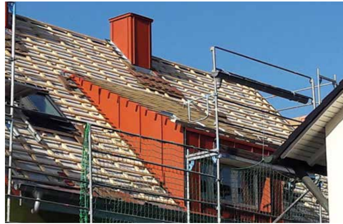
Ist der Dachboden bereits ausgebaut, ist die Aufsparrendämmung die beste Lösung für die Dachdämmung.

Vor- und Nachteile der verschiedenen Dämmmöglichkeiten