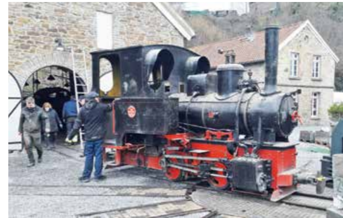
20 Jahre stand eine kleine Grubenlokomotive als Dauerleihgabe bei der Muttenthalbahn. Jetzt kehrt sie nach Gütersloh zurück.

Viele Jahre stand eine Grubenlokomotive aus Gütersloh als Dauerleihgabe friedlich auf dem Gelände der Muttenthalbahn. Bis, ja, bis das Jahrhundertunwetter Mitte Juli 2021 über das Ahrtal, Hagen und Witten hereinbrach, Überschwemmungen verursachte und auch den Hang unterhalb von Schloss Steinhausen abrutschen ließ.