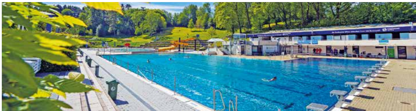
Saisonstart in Sprockhövel am 1. Mai, in Witten am 6. Mai. In Hattingen geht's Anfang Mai auch los.