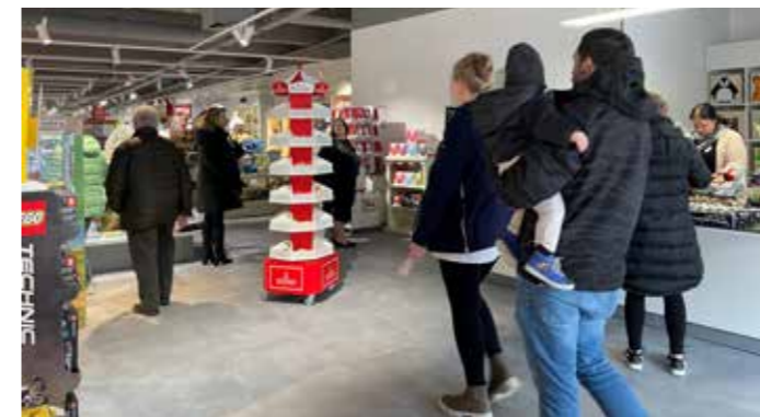
Großes Interesse bei Groß und Klein am Eröffnungstag der PHD Kinderwelt.

Endlich hat das Warten ein Ende! Die PHD Kinderwelt konnte im März eröffnen. Und das Warten hat sich gelohnt – die PHD Kinderwelt bietet auf rund 800qm Verkaufsfläche im alten Edeka-Markt alles, was das Kinderherz begehrt. Neben einer enormen Auswahl an Spielzeug für jegliche Altersgruppe und Babyartikeln wird hochwertige Kindermode der bekannten Marken Steiff, Sigikid, Belly Button, Salt and Pepper u. v. m. zu finden sein. Accessoires und Kleinmöbel für das Kinder- und Babyzimmer machen das Angebot komplett. Außergewöhnlich macht die PHD Kinderwelt nicht nur die große Auswahl der Waren, sondern die zusätzlichen Annehmlichkeiten für Kinder und Eltern. Ein besonderes und entspanntes Einkaufserlebnis für Groß und Klein stand bei den Planungen im Vordergrund: so wird es bald einen liebevoll ein-