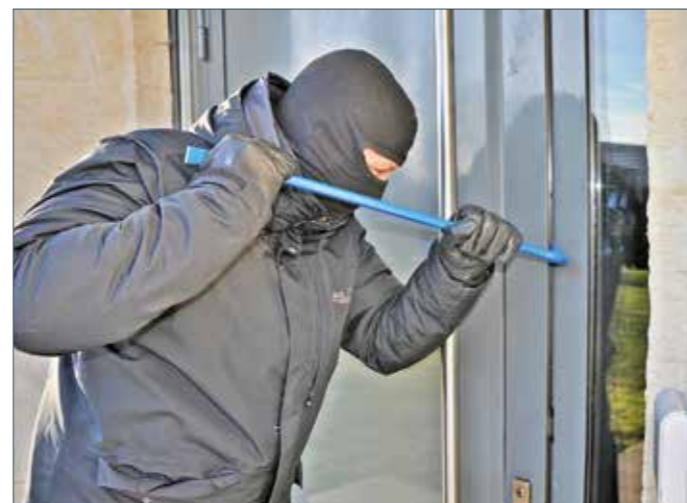
Es gibt wieder mehr Wohnungseinbrüche. Die Täter verschafften sich oft Zugang durch schlecht gesicherte Gebäudeöffnungen wie Haustüren, so die Polizei.

Zum Thema „Prävention“ äußern sich die Polizeibehörden wie folgt: „Beliebte Angriffspunkte für Einbrecher sind alle schlecht gesicherten Gebäudeöffnungen (Haustür, Wohnungseingangstür, Balkontüren, Terrassentüren, Fenster, Kellerzugänge usw.). Dass man sich vor einem Einbruch schützen kann, zeigt die Erfahrung der Polizei: Mehr als 40 % der Einbrüche bleiben im Versuch stecken, nicht zuletzt wegen sicherungstechnischer Einrichtungen.“ Wie sich die Einbruchszahlen im Laufe des Jahres noch entwickeln werden, lässt sich nur mutmaßen. Bis dahin ist es wohl das Beste auf Präventionsmaßnahmen zu setzen. nxs