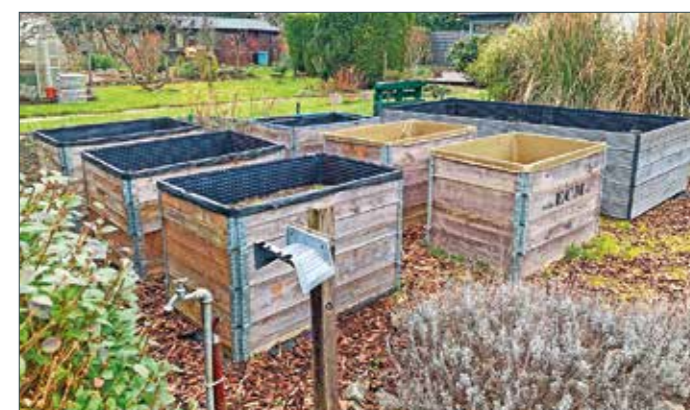
Im Frühjahr startet die Gartensaison. Auch die im Winter verwaisten Hochbeete können dann neu angelegt oder bepflanzt werden.

Hochbeete können schnell und einfach angelegt werden. Am besten wählt man einen Platz, der viel Sonne abbekommt, dann kann man bereits mit dem Anlegen des Beetes beginnen. Dafür benötigt man eine Folie, ein paar Holzplatten, Erde und Steine. Für die Folie sollte man ein wasserdichtes Material wählen und die Holzplatten sollten an den Seiten des Beetes befestigt werden, um das Eindringen von Wasser zu