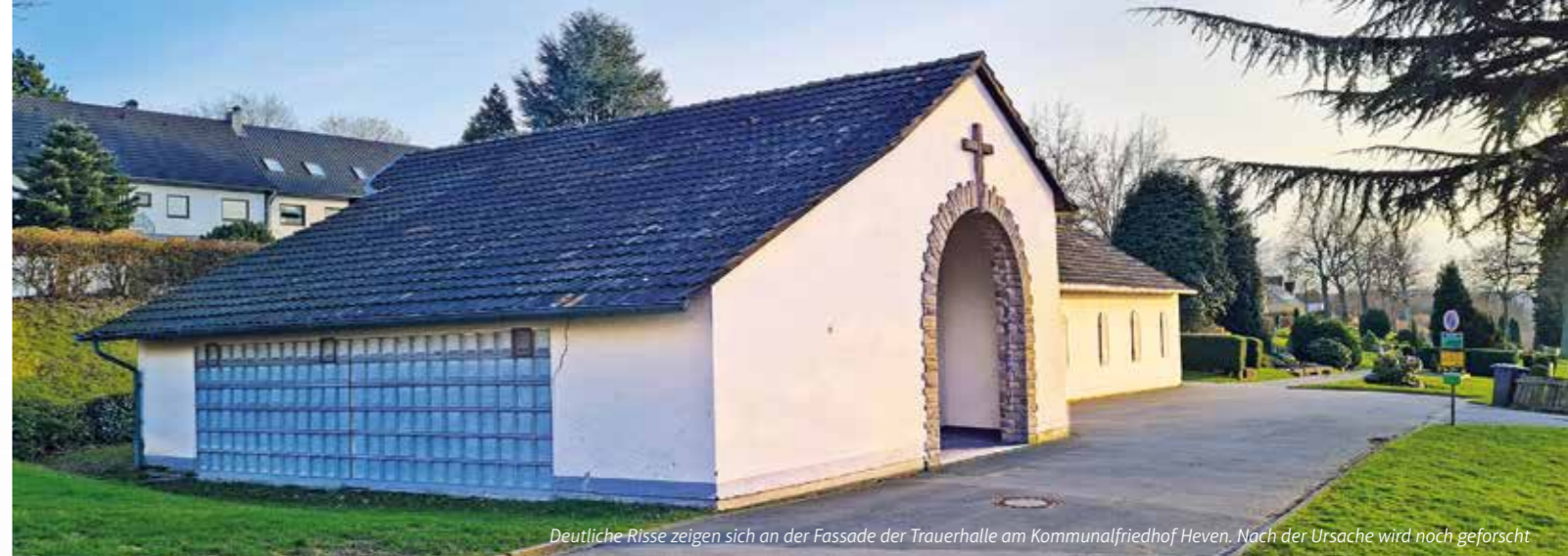
Deutliche Risse zeigen sich an der Fassade der Trauerhalle am Kommunalfriedhof Heven. Nach der Ursache wird noch geforscht

Inh.: Frau Maloku Meesmannstr. 58 • 58456 Witten Telefon: 0 23 02 / 7 32 89