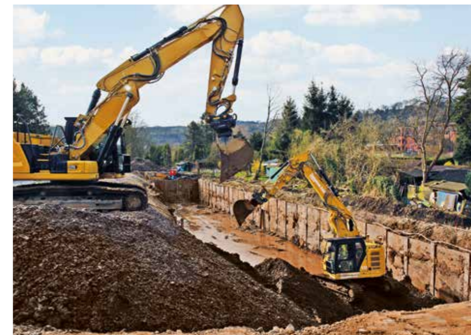
Zurzeit wird eine Baugrube ausgehoben, in die ein Regenrückhaltebecken gebaut wird.

Wie Andreas Berg von der Regionalniederlassung des Landesbetriebes Straßenbau NRW erklärt, wird das in offener Bauweise erstellte Becken keinen Deckel erhalten. Um unbefugten Zutritt von Dritten zu verhindern, wird die Beckenanlage nach der Fertigstellung eingezäunt. dx