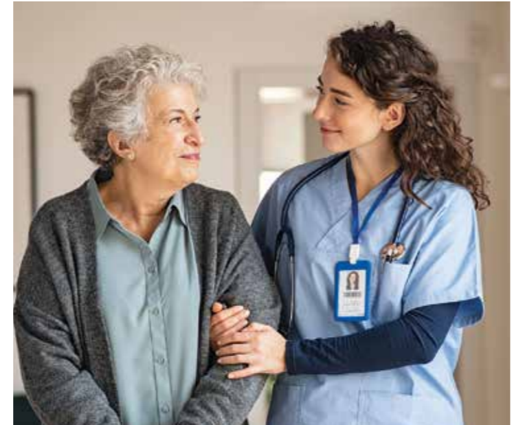
Die meisten Menschen werden zu Hause gepflegt. Für sie ist es besonders wichtig, dass ihre Pflegevorsorge möglichst viele Service- und Assistance-Leistungen enthält.

Eine Pflegebedürftigkeit kann jeden zu jeder Zeit treffen. Sie ist eine große emotionale, finanzielle und organisatorische Herausforderung - nicht nur für die Pflegebedürftigen selbst, sondern vor allem auch für die Angehörigen. Vor den finanziellen Belastungen bei häuslicher oder stationärer Pflege kann man sich und seine Angehörigen mit einer privaten Pflegevorsorge schützen. Denn von der gesetzlichen Pflegeversicherung werden die entsprechenden Kosten nur zum Teil abgedeckt, die sogenannte Pflegelücke wird tendenziell größer, insbesondere bei der stationären