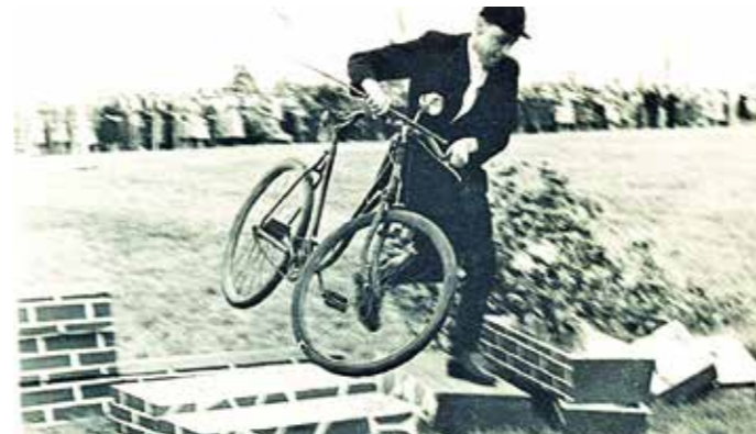
Hindernissenrennen mit dem Fahrrad.