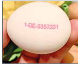
Sticht ins Auge, ist aber vielen noch ein Rätsel: der Code auf dem Ei.

Was der Code auf den Eiern über ihre Entstehung verrät