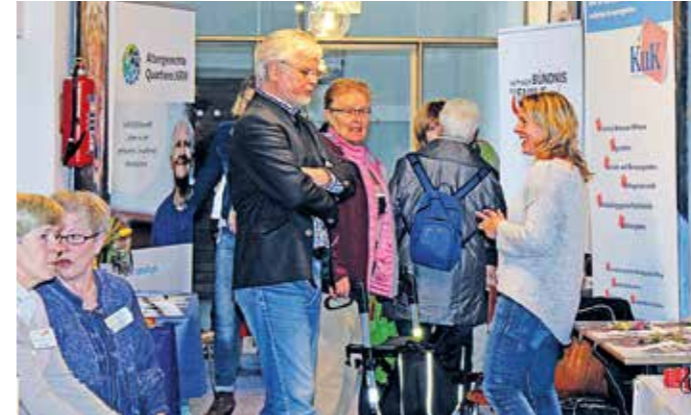
Auf den Fluren im Hattinger Rathaus ist immer viel los beim Gesundheitstag.