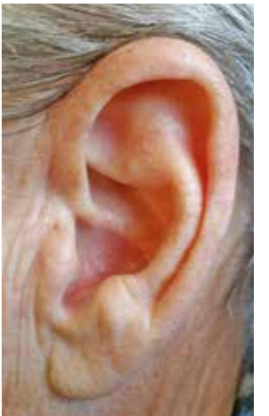
Das Ohr muss sich an ein neues Hörgerät erst gewöhnen.

Beratung durch ausgesuchte Experten gibt es in jedem Fachgeschäft vor Ort. Hier findet sich auch eine Auswahl modernster Hörgeräte. Diese sind heutzutage so klein und diskret, dass sie kaum auffallen. Auch kostenloses Probetragen ist möglich. Wichtig zu wissen für alle Betroffenen: Es ist ein wenig Geduld gefragt, da es einige Zeit dauert, bis man sich an Hörgeräte gewöhnt hat. Oft ist es sinnvoll, sie zuerst nur stundenweise zu tragen und das Hören gezielt zu üben und zu trainieren. Bei Unsicherheiten oder Nachbesserungsbedarf unbedingt den Akustiker immer wieder um Hilfe bitten, bis alles bestmöglich eingestellt ist. So ist das Hörvermögen hoffentlich schon beim nächsten Familientreffen wieder in Topform.