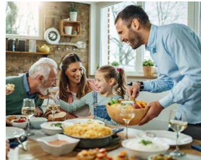
Familienfeste mit allen Sinnen genießen: Reden, lachen, schmecken und alles hören können gehören hier einfach dazu.