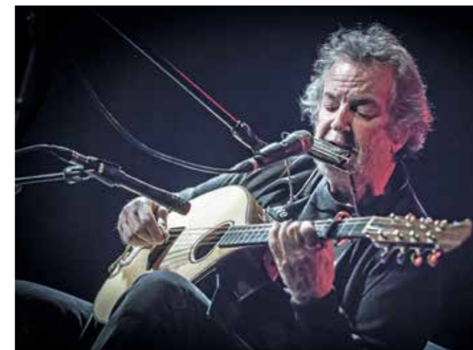
Andy Irvine kommt am 20. April nach Hattingen.

Der legendäre irische Folk-Musiker Andy Irvine startet seine Solo-Tour 2023 in Hattingen! Am Donnerstag, 20. April, 19 Uhr, findet das Konzert Andy Irvine „Irish Folk and Beyond“ in der St. Johannes Baptist Kirche, Marktplatz 8 in Blankenstein statt. Veranstalter ist ArteMedis e.V. im Forstmanns. Die Eintrittskarten kosten 18 Euro. Es gibt sie im Vorverkauf per E-Mail unter info@artemedis.ruhr oder telefonisch unter +49 175 5904459. Seit gut 60 Jahren ist Andy Irvine unterwegs auf seiner „never ending tour“. Er ist einer der bedeutendsten Sänger, Songschreiber und Instrumentalisten Irlands. 1942 wurde er als Sohn irischer Eltern in London geboren, seit seiner Jugend lebt er in Irland.