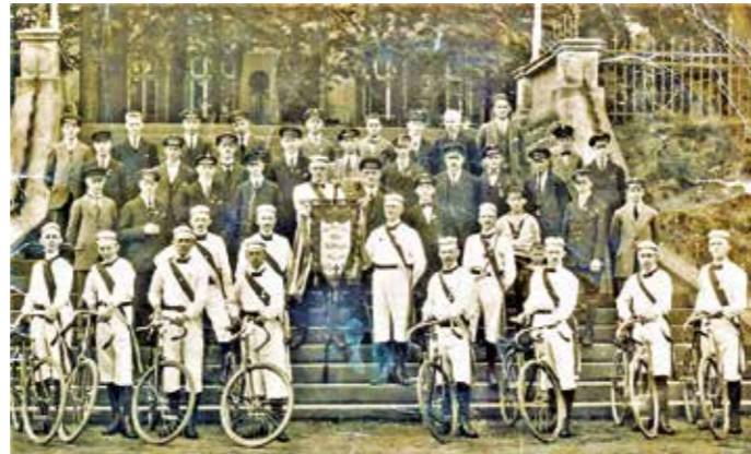
Der Rad-Touristenclub Hattingen 1898 vor der Schulenburg.

In den letzten zwanzig Jahren gewann das Fahrrad wieder an Bedeutung. Alte Bahntrassen wurden zu Fahrradwegen. In Städten entstanden - wie jüngst auch in Hattingen - markierte Fahrradstraßen, die dem Drahtesel mehr Vorrang einräumen. Im Zusammenhang mit der