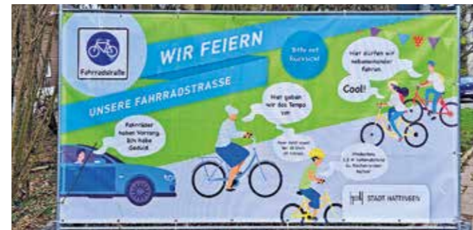
Hattingen hat jetzt die ersten Fahrradstraßen bekommen.