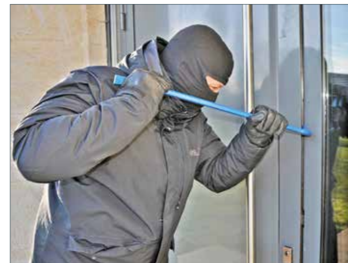
Es gibt wieder mehr Wohnungseinbrüche. Die Täter verschafften sich oft Zugang durch schlecht gesicherte Gebäudeöffnungen wie Haustüren, so die Polizei.

Wenn man der Corona-Pandemie etwas Positives abgewinnen wollen würde, dann wären da sicherlich die massiv gesunkenen Einbruchszahlen in der Zeit von Lockdowns, Kontakt- und Reiseverboten sowie Quarantäne. „Gelegenheit macht Diebe“ heißt es im Volksmund, und spätestens am 16. März 2020 fehlten Kriminellen die Gelegenheiten zum Einbruch, denn dort wurde der erste Lockdown beschlossen und plötzlich saßen wir alle fast ununterbrochen zu Hause in unseren eigenen vier Wänden. Mittlerweile ist die Pandemie so gut wie vorüber und das hat auch Einfluss auf die Kriminalität: „Volksfeste, Weihnachtsmärkte und andere Veranstaltungen haben in unseren Kommunen erfreulicher Weise wieder im vollen Umfang stattgefunden, erhöhen aber leider auch Möglichkeiten zur Begehung von Straftaten“, so die Kreispolizeibehörde Ennepe-Ruhr-Kreis.