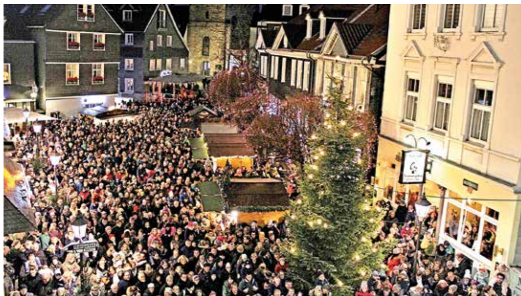
So sieht das aus, wenn auf dem Hattinger Weihnachtsmarkt im Alten Rathaus ein Adventsfenster geöffnet wird. Wollen Sie in diesem Jahr ein Fenster öffnen?

Um dieser märchenhaften Idee Realität einzuhauchen, braucht es aber passende Akteure. Gesucht werden drei bis vier Erwachsene, die gut bei Stimme sind und gerne mit Menschen kommunizieren. „Idealerweise bringen sie Freude an Texten und Märchen mit und haben Spaß an kleinen Verkleidungen“, so Glomb. Pünktlichkeit und Zuverlässigkeit sind ein Muss und Höhenangst sollte man auch nicht haben, denn man muss sich aus dem Fenster am Alten Rathaus herauslehnen. „Die Akteure werden ein wichtiger Teil vom Nostalgischen Weihnachtsmarkt 2023 und erleben die Vorweihnachtszeit in Hattingen einmal aus einer ganz anderen Perspektive. Ein märchenhaftes Gehalt können wir zwar nicht bieten, aber mehr als Brot und Wasser wird es auch sein. Es ist nicht nur ein ehrenamtlicher Job“, macht Georg Hartmann klar. „Uns ist Qualität wichtig. Wir könnten uns alles Mögliche vorstellen – jemanden aus einer Theater AG oder jemanden als Laiendarsteller. Denkbar wäre auch ein Student oder eine Studentin oder einfach jemand, der Spaß an einem solchen Projekt hat. Wer sich bewerben möchte, kann dies am besten per Mail tun unter info@hattingen-marketing.de unter Angabe von Name, Anschrift und Kontaktmöglichkeiten sowie ein paar Sätzen zum Lebenslauf und zur Motivation. Auch ein Foto wäre schön. Wir sind gespannt und warten auf märchenhafte Akteure“, so Hartmann. anja