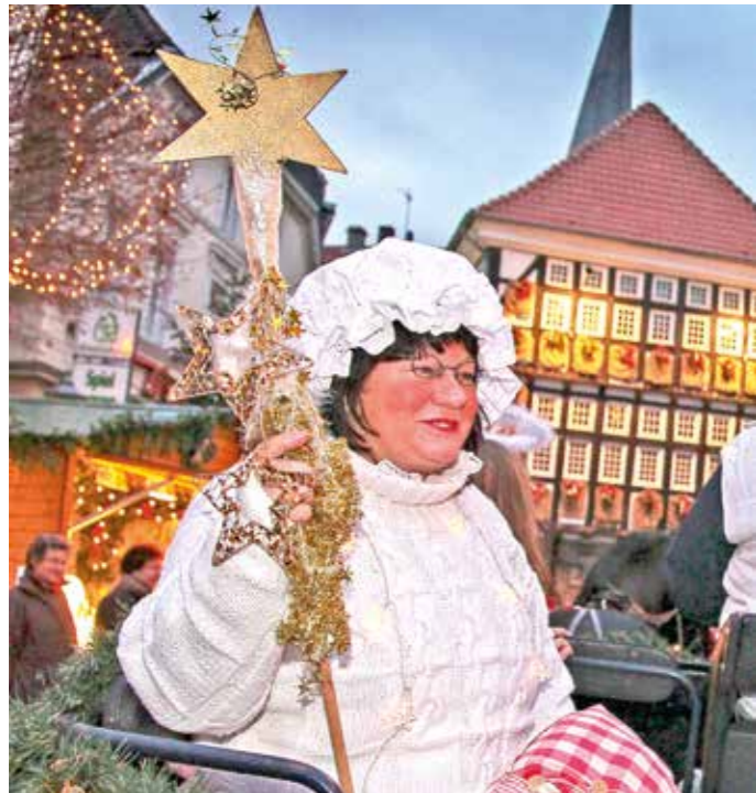
Frau Holle bei ihrem Einzug in das Alte Rathaus.