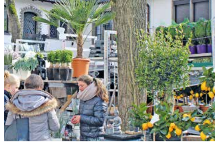
Hattingen lockt wieder mit dem Frühlingsfest in der Innenstadt.

Verkauffoffener Sonntag lockt die Besucher am 16. April von 13 bis 18 Uhr in die Innenstadt