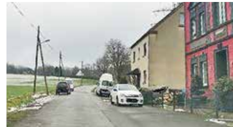
Dreerholz in beide Richtungen fotografiert.