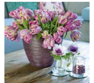
Besonders Gefüllte Tulpen lassen schnell den Kopf hängen.

Arrangiert man Tulpen mit anderen Schnittblumen, sollte man bedenken, dass sie ihren Kollegen schon bald über den Kopf wachsen. Was in einem fest gebundenen Bukett zumeist nicht so schön ist, kann in einem lockeren Frühlingsstrauß sehr reizvoll sein. Besonders hübsch ist es, wenn Tulpen mit Zweigen frühlingsblühender Sträucher – wie Scheinquitte oder Zierkirsche – kombiniert werden. Mit ihren interessanten Blütenformen bilden auch Narzissen und Hyazinthen einen schönen Kontrapunkt zu den Kelchen der Tulpen. Aber aufgepasst: Frisch angeschnitten geben diese beiden Frühlingsblüher ein Sekret ab, welches anderen Pflanzen nicht bekommt. Daher sollte man sie immer erst einen Tag separat ins Wasser stellen, bevor man sie ohne erneuten Anschnitt mit den Tulpen mischt.