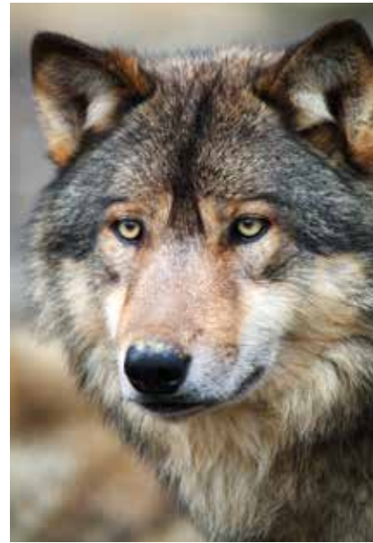
Wer einen Wolf sieht, muss vorsichtig sein und sich ruhig und respektvoll verhalten.

43 Paare und 21 sesshafte Einzeltiere nachgewiesen. Der Schwerpunkt der Verbreitung umfasst die Bundesländer Brandenburg (47 Rudel), gefolgt von Niedersachsen (34 Rudel) und Sachsen (31 Rudel). Sollte Ihnen beim Spaziergang durch Wald und Feld tatsächlich ein Wolf begegnen, verhalten Sie sich respektvoll, ruhig und halten Sie vor allem Abstand, damit der Wolf einen Raum für den Rückzug behält. Wenn der Wolf wider Erwarten nicht wegläuft, sprechen Sie ihn laut an oder klatschen Sie in die Hände, damit Sie sich bemerkbar machen. In keinem Fall sollten Sie versuchen, den Wolf sogar anzulocken. Auch vor dem Wolf wegzulaufen, könnte ein Verfolgungsverhalten des Tieres mit ungutem Ende auslösen. Sollte der Wolf sich jedoch von sich aus nähern, ruhig stehen bleiben, sich groß machen, um den Wolf einzuschüchtern. „Ein Wolf ist kein Kuscheltier“, mahnt Simon Nowack weiter, „Auch wenn der Haushund vom Wolf abstammt, so ist das Verhalten grundsätzlich anders. Wölfe müssen sich von anderen Tieren ernähren.“ dx