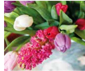
Mit ihrer Blütenform bilden Hyazinthen einen interessanten Kontrapunkt zu den Kelchen der Tulpen. Aber aufgepasst: Frisch angeschnitten geben sie ein Sekret ins Vasenwasser ab, welches anderen Pflanzen nicht bekommt.

Der Kinderschutzbund besteht seit 1981 und hat sich als gemeinnütziger Verein das Recht auf größtmögliche Entwicklung der Persönlichkeit jedes Kindes zum Ziel gesetzt. Neben Einzelgesprächen bietet der rührige Verein auch vielerlei Kurse und Projekte an, die beispielsweise Ferienspiele, Eltern-Kind-Gruppen und Nähkurse für Mütter und Kinder beinhalten. Beim Kinderschutzbund finden die Kinder immer einen geschützten Raum. Zu erreichen ist der Kinderschutzbund über Tel. 02302/22525, info@kinderschutzbund-witten.de und www.kinderschutzbund-witten.de.