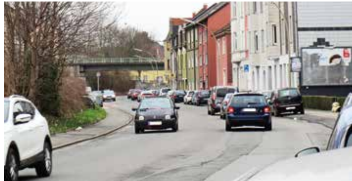
Sprockhöveler Straße fotografiert in Richtung Crengeldanz.