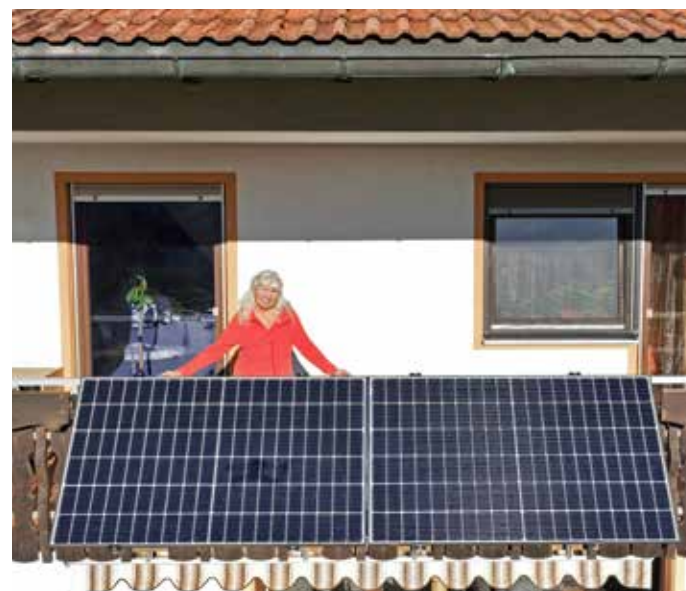
Ein neuer Trend: Photovoltaik-Anlagen werden nicht nur auf Dächern, sondern auch auf Balkonen gebaut.

Aufgrund der hohen Nachfrage, der maßgeschneiderten Planung und langen Verzögerungen in der Lieferkette brauchen Interessierte allerdings etwas Geduld, bis die eigene Anlage auf Dach oder Balkon Strom produziert. Auch für die Beantwortung von Anfragen sowie die Erstellung eines Angebots brauchen die Wittener Stadtwerke etwas Zeit, um die große Zahl der Fragen stemmen zu können. Die Aufwandskosten betragen 50 Euro, die bei Beauftragung natürlich verrechnet werden. Ob sich die Sonnenenergie vom eigenen Dach auch finanziell lohnt, können Interessierte auf der Stadtwerke-Website mit ein paar Klicks selbst herausfinden: www.stadtwerke-witten.de/solar .