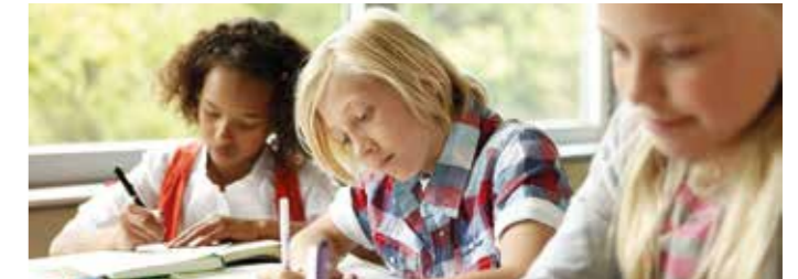
Wer gut sein will in Mathe, muss üben, üben, üben.

Doch trotz aller Tricks will es manchmal einfach nicht klappen mit der