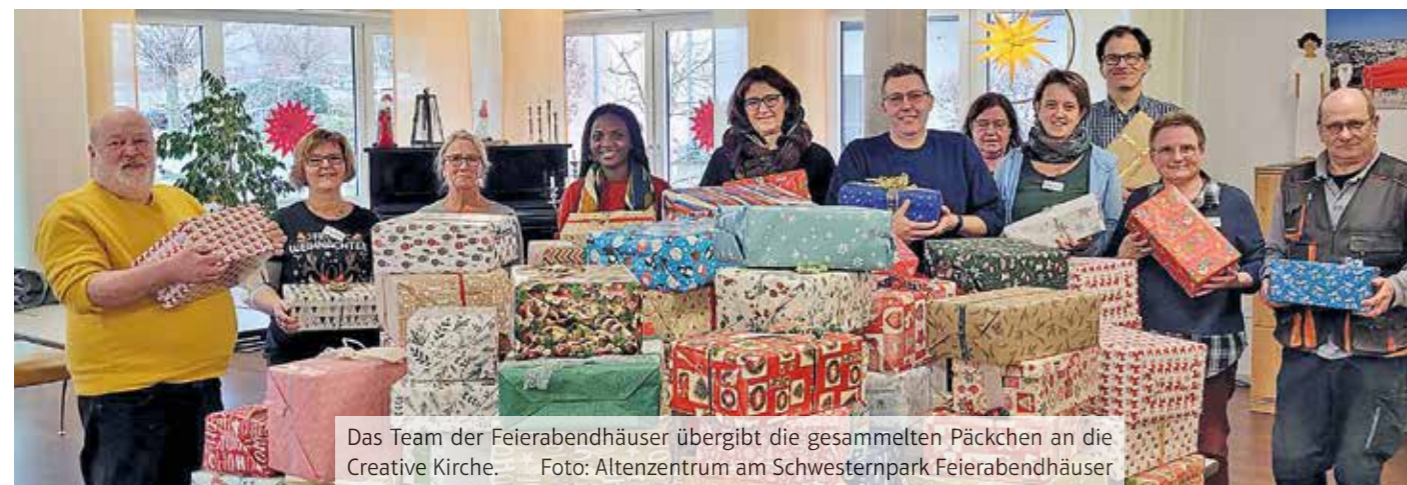
Das Team der Feierabendhäuser übergibt die gesammelten Päckchen an die Creative Kirche.