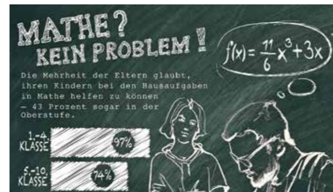
In der Grundschule können die meisten Eltern ihren Kindern bei den Mathehausaufgaben noch helfen. In den höheren Klassen sieht das schon anders aus.