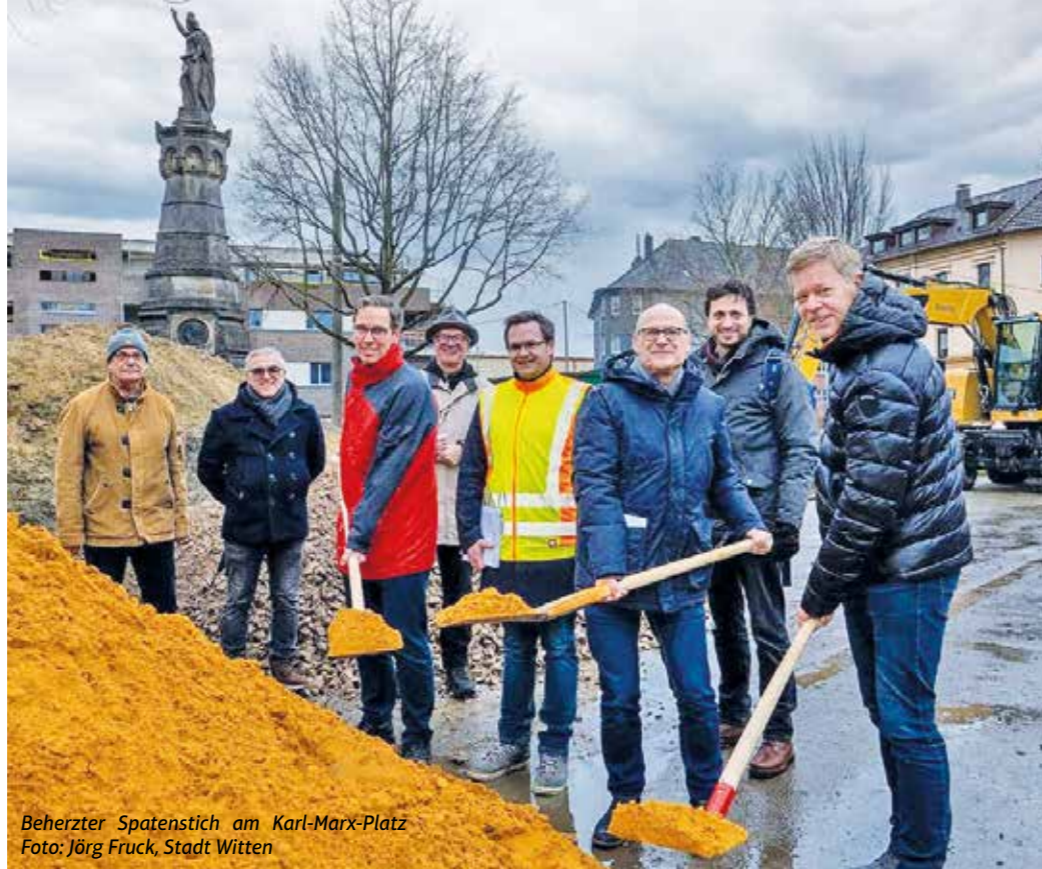
Beherzter Spatenstich am Karl-Marx-Platz

660 Brautleute –darunter zehn schwule und elf lesbische Paare– haben sich in der Ruhrstadt das Ja-Wort gegeben. 261 Vermählte kamen eigens von außerhalb. 572 Paare führen im gemeinsamen Eheleben auch einen gemeinsamen Nachnamen, 88 Eheleute haben sich für „jeder behält den eigenen Namen“ entschieden.