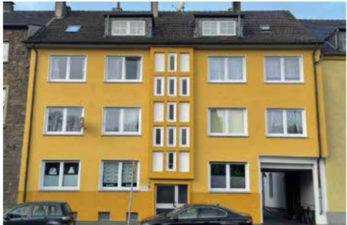
In neuem Glanz erstrahlt die Fassade Sprockhöveler Str. 144 in Heven. Fenster und Farbansicht wurden im Rahmen des Projekts „Stadterneuerungsgebiet Heven-Ost/Crengeldanz“ erneuert.