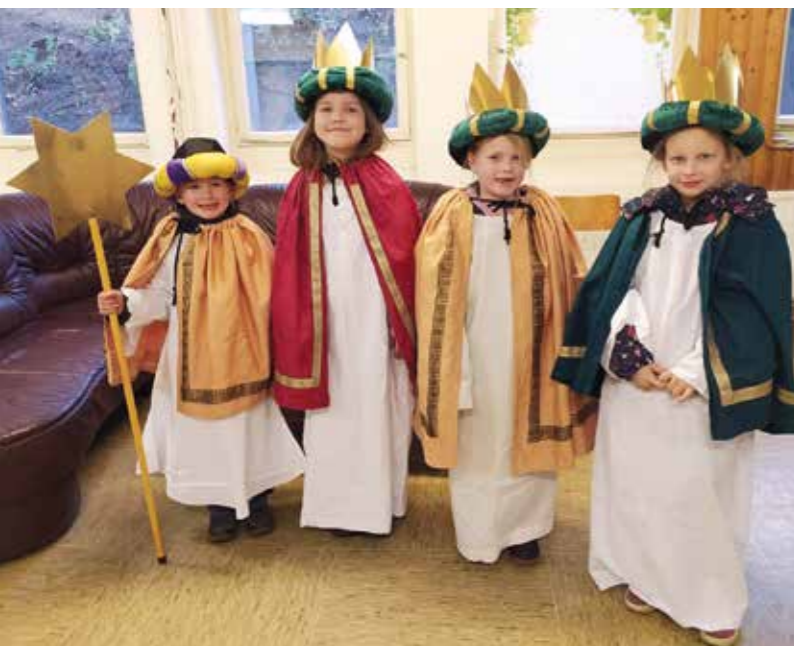
Sternsinger St. Peter und Paul Witten-Herbede.