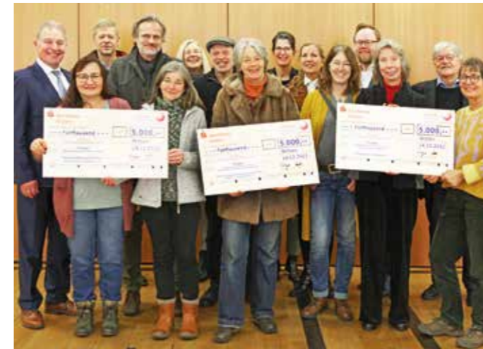
Gruppenbild aller Preisträger bei der Übergabe der symbolischen Schecks durch die Wittener Sparkassen- und Bürgerstiftung (WSuBS).

Wittener Sparkassen- u. Bürgerstiftung fördert drei Umweltprojekte