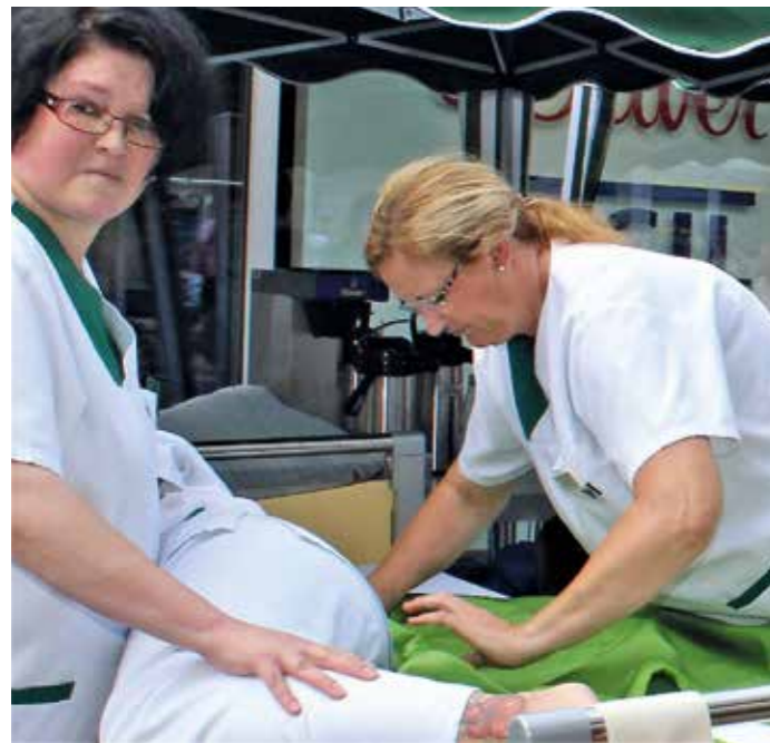
Wie hier auf einer Seniorenmesse Pflegerinnen zeigen, müssen auch junge Pflegebedürftige regelmäßig gelagert und umgebettet werden.

Rund 500.000 Menschen in Deutschland brauchen Pflege und sind noch jünger als 65 Jahre