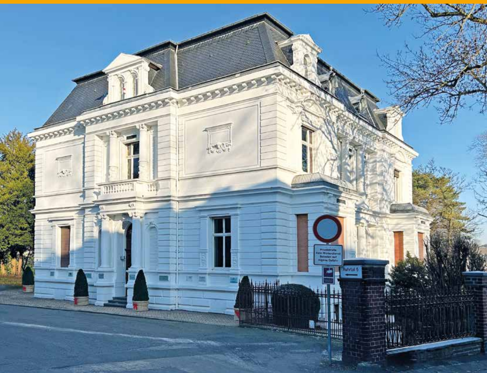
Villa Ruhrtal, Ruhrtal. 5. Sie wurde 1895 im Stile des Historismus bzw. der Neorenaissance von Friedrich Brinkmann gebaut.

+++ 4 MONATSMAGAZINE: GESAMTAUFLAGE CA. 90.000 EXEMPLARE +++ HAUSHALTSVERTEILUNG +++ ☎ 02302 9838980 +++ WWW.IMAGE-WITTEN.DE +++