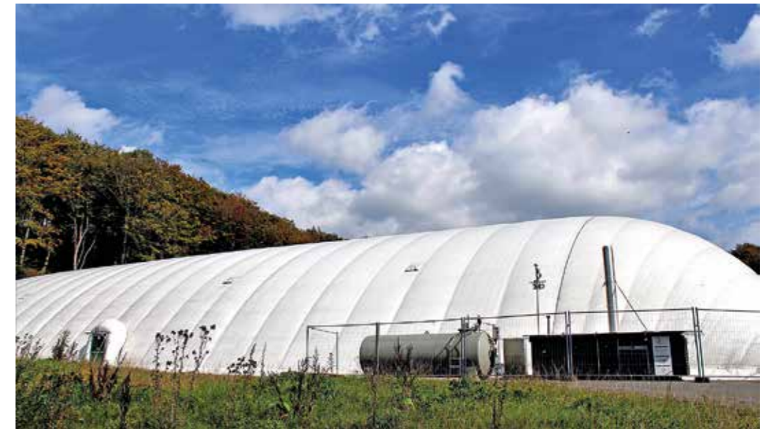
Die Traglufthalle - ein optisch und auch in ihrer Funktion eher unrühmliches Kapitel Sprockhöveler Flüchtlingsgeschichte.

Sie war strahlend weiß, 72 Meter lang und 36 Meter breit. Schon ziemlich groß, was sich da wie ein UFO in den blau-weißen Himmel von Sprockhövel wölbte. Die Hallenfläche von rund 1500 Quadratmetern sollte ab Ende 2016 Flüchtlinge aufnehmen und stand an der Hiddinghauser Straße, wo heute die neue Feuerwache Nord sowie der Bauhof stehen. Der Bau und die Halle kosteten die Stadt Sprockhövel damals satte 2,8 Millionen Euro. Die Lebenserwartung der weißen Halle wurde auf 20 bis 25 Jahre geschätzt. Sie war nicht schön, aber zumindest solide - das war die Expertenmeinung.