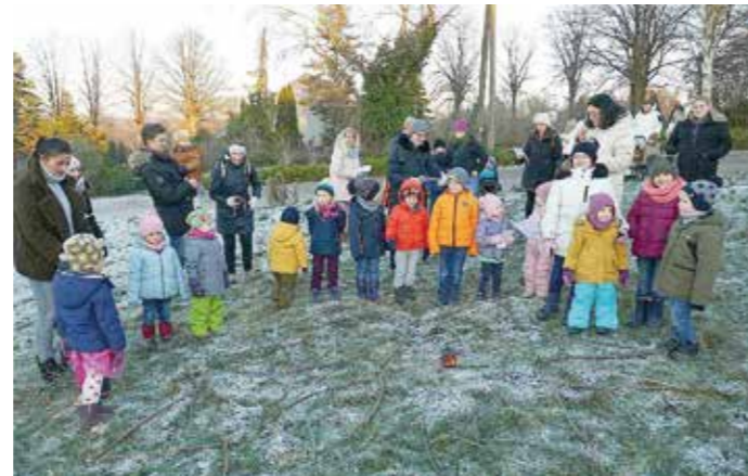
Kinder und ihre Eltern hinter dem ev. Friedhof.