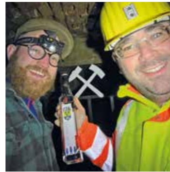
Die Einweihung erfolgte mit dem Sprockhöveler Jubiläums-Gin der Firma Habel.

Im Sommer, wenn es wärmer ist, haben wir noch ein paar weitere Ideen, wie wir es noch besser machen bzw. noch mehr aus Sprockhövel abstimmen können. Der Kunstschmied wird dann noch einmal seiner Kreativität für unsere Heimat freien Lauf geben. Knährich weiter: „Jetzt haben wir erst einmal ein neues Eingangstor mit Schlägel und Eisen, auch bekannt als Gezähe. Es geht bei uns stetig weiter. Aber dieses neue Besucherbergwerk, welches aus den Kinderschuhen nun erwachsen ist, ist kein Projekt, was mal eben entsteht. Nur dank der vielen selbstlosen Unterstützungen der Vereinsmitglieder, der umliegenden Unternehmen und natürlich der vielen Stiftungen, kann so etwas gelingen. DANKE für die Unterstützung. Auch für 2023 haben wir noch einige Pläne. Es wird nicht langweilig.“