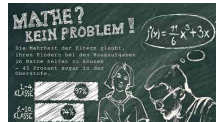
In der Grundschule können die meisten Eltern ihren Kindern bei den Mathehausaufgaben noch helfen. In den höheren Klassen sieht das schon anders aus.