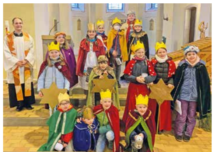
In St. Janarius Niedersprockhövel besuchten am 7. und 8. Januar 15 Kinder plus begleitende Erwachsene die Menschen und hinterließen ihren Segen „Christus mansionem benedicat“ (Christus segne dieses Haus) an den Türen. Aktueller Stand hier bei der Spendensumme: 6400 Euro.

Tagespflege am Perthes Ring - Öffnungszeiten: Mo.-Fr.: 8-16 Uhr - Infos und Beratung : 02324/906460