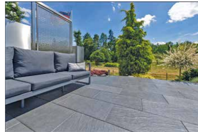
Mediterraner Charme dank der rustikalen Terrassenplatte Andalusia: Die Schieferoptik der Oberfläche ist mit einer speziellen Versiegelung geschützt und die Elemente lassen sich einfach reinigen.

Spezieller Oberflächenschutz für Terrassenplatten