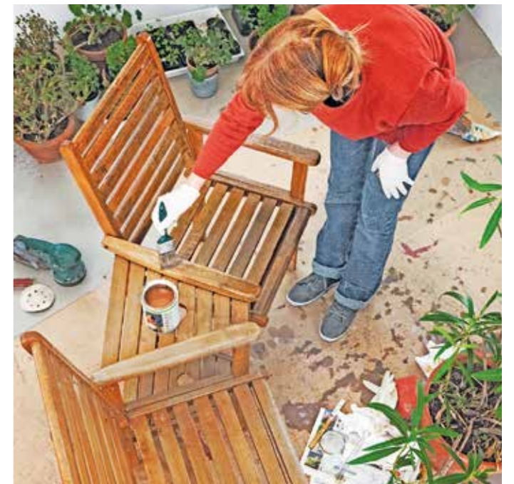
Für das natürliche Material Holz ist es eine große Belastung, das ganze Jahr über der Witterung ausgesetzt zu sein. Deswegen sollten Gartenmöbel und Terrassendielen aus Holz regelmäßig mit einem speziellen Holzöl vor Witterungseinflüssen geschützt werden.