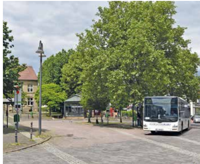
Der Busbahnhof in Niedersprockhövel bleibt an seinem alten Standort. Ausschuss und Rat haben unter großem Interesse der Sprockhöveler Bürgerschaft ihre Entscheidung getroffen. Die SPD zog sich aufgrund einer anderen Meinung den deutlichen und teilweise unfair geäußerten Unmut einiger Zuhörer zu.