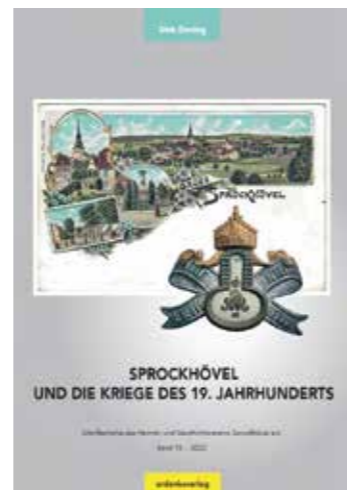
ISBN: 978-3-942184-76-2 Man kann das Buch im Buchladen in Niedersprockhövel und zu den Öffnungszeiten im Heimatverein erwerben. Über die ISBN Nummer kann es aber auch bestellt werden.