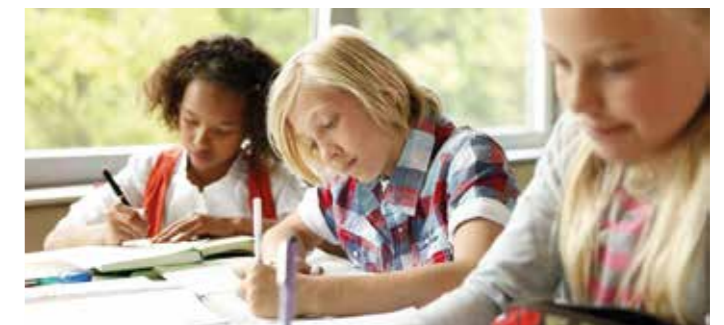
Wer gut sein will in Mathe, muss üben, üben, üben.

Doch trotz aller Tricks will es manchmal einfach nicht klappen mit der