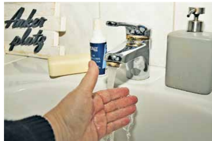
Einfach die Hände unter Wasser halten reicht nicht aus. Gründliches Waschen mit Seife ist angesagt, denn regelmäßiges Händewaschen gilt als eine der entscheidenden Maßnahmen zur Vermeidung von Infektionskrankheiten. Manchmal ist sogar der Griff zum Desinfektionsmittel sinnvoll.

Seife macht saubere Hände. Nicht immer ist das zusätzliche Desinfizieren sinnvoll.