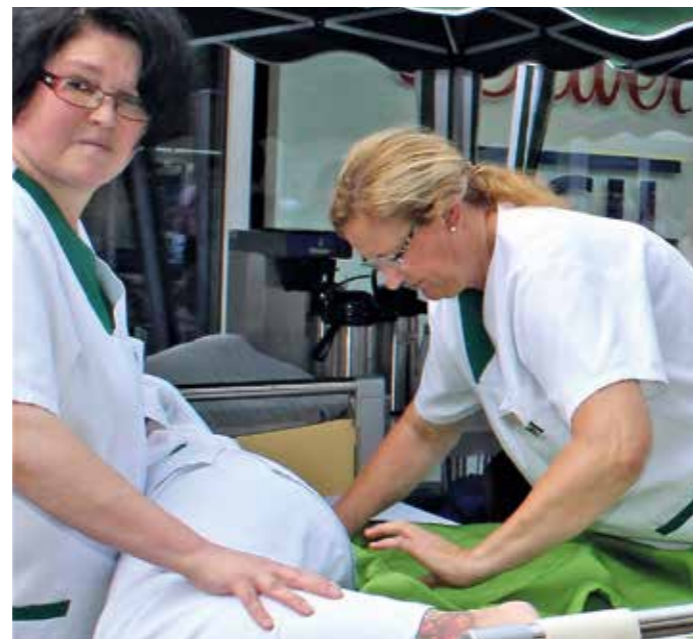
Wie hier auf einer Seniorenmesse Pflegerinnen zeigen, müssen auch junge Pflegebedürftige regelmäßig gelagert und umgebettet werden. Für Angehörige und Pflegekräfte keine leichte Aufgabe.