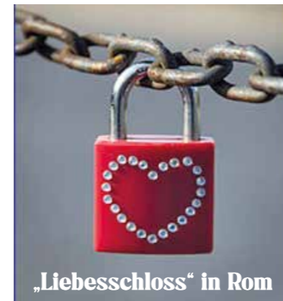
„Liebesschloss“ in Rom

Über die Jahrhunderte wurde das Fest des hl. Valentin in unterschiedlicher Ausprägung begangen. William Shakespeare lässt Ophelia in seinem Hamlet (1600 – 1601) singen: „Tomorrow is Saint Valentine’s day“. Ein britischer Verleger brachte im Jahre 1797 das Werk „The Young Man’s Valentine Writer“ heraus. Es enthielt viele Verse für junge Liebhaber, die nicht mit dem Talent des Dichtens gesegnet waren. Im England des 18. Jahrhunderts schenkten sich an diesem Festtag die Liebende Blumen, Süßigkeiten und „Valentinsschlüssel“, um die Herzen der Beschenkten aufzuschließen. In der heutigen Zeit haben herzförmige Gegenstände, aber auch Bilder und Figuren von Tauben und des geflügelten Liebesboten „Cupido“ die Schlüssel abgelöst.