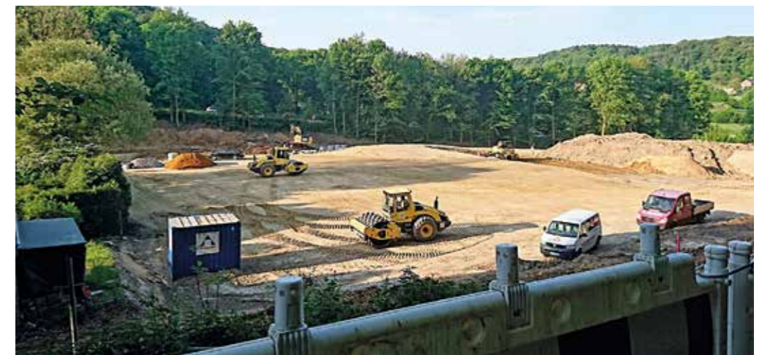
Baustelle Traglufthalle: Heute stehen hier die neue Feuerwache Niedersprockhövel und der Bauhof. Die teuren Reste der Halle liegen auf fünf Paletten.

Trotzdem kostete die Halle viel Geld. Jeden Monat schlug sie mit Kosten von rund 20.000 Euro zu Buche. Energie und Sicherheit waren die Hauptkostenträger - denn wie der Name sagt: eine TragLUFThalle muss zum Überleben dauerhaft im Betrieb sein. Manche Diskussionen kommen über heiße Luft nicht hinaus - doch die warme Gebläseluft war finanziell kein Pappenstil. Hinzu kam die Versorgung mit Essen durch ein Cateringunternehmen, gerechnet mit 280 Euro pro Person und Monat - wenn denn Menschen in der Halle waren. Doch schon 2018 war es mit der Halle wieder vorbei. Sie wurde abgebaut und von dem weißen Luftsack blieben nur noch fünf Paletten von je zwei mal zwei Meter übrig. Jetzt, im verfluchten siebten Jahr nach der Hallennut-