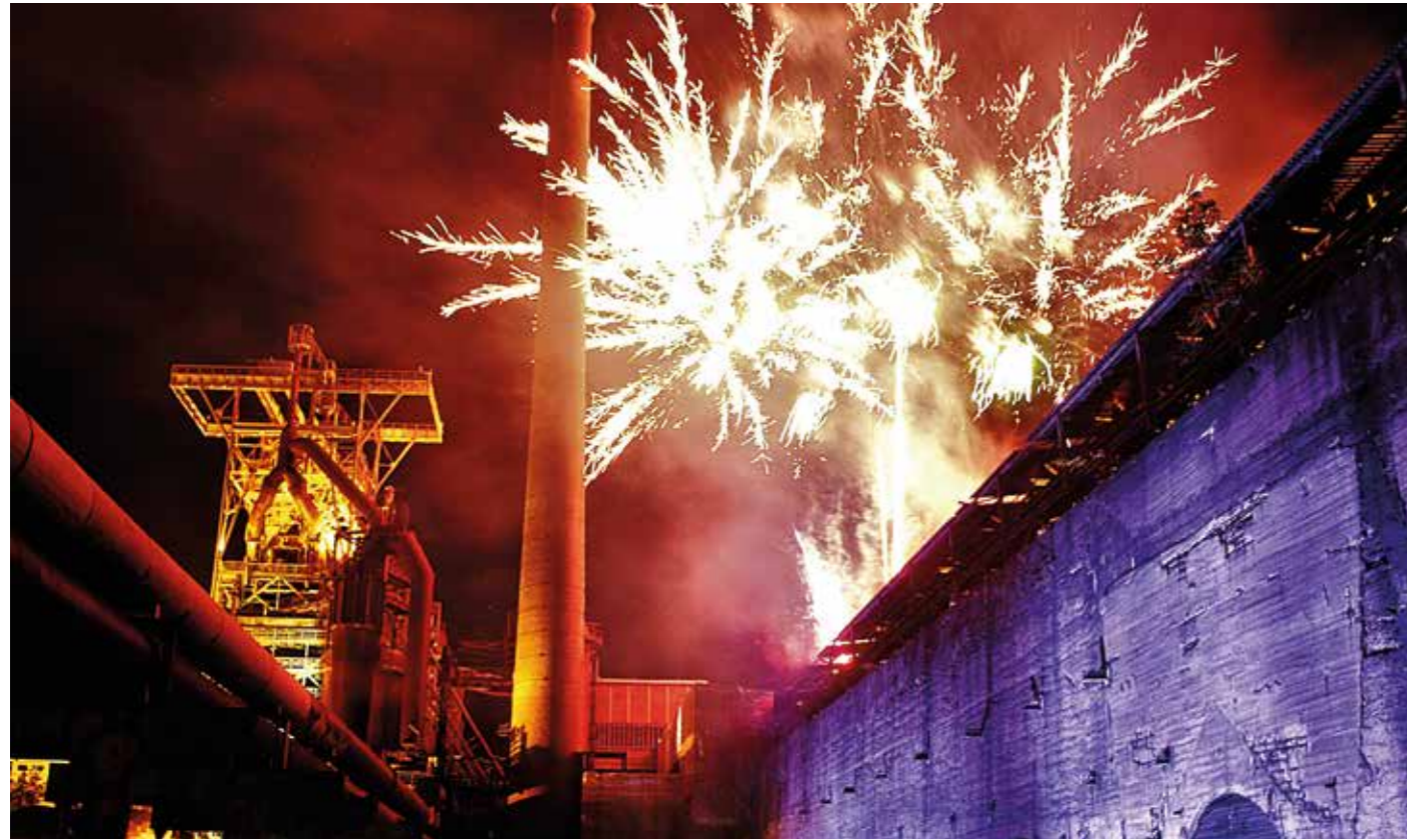
Ein Feuerwerk - wie hier auf dem LWL-Gelände der Henrichshütte bei der Extraschicht - sieht super aus. Für Umwelt und Nachhaltigkeit steht der bunte Böllerspaß allerdings nicht unbedingt.