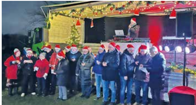
Groß und Klein leisteten ihren Beitrag.

Nach diesem tollen Programm durften die Kinder sich dann noch über den Nikolaus freuen, der auch für alle eine Kleinigkeit dabei hatte. Es war eine rundum gelungene Veranstaltung.