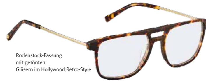
Rodenstock-Fassung mit getönten Gläsern im Hollywood Retro-Style

Glamour und Glanz wie im alten Hollywood, modern und sexy interpretiert: Das verkörpert das Design dieses Trends. Auffällig schön ist die Kombination aus ultrafeinem Metall mit marmoriertem Kunststoff. Die Farben: warme Brauntöne, Bernstein, dunkles Rot, Violett und Metallic. Immer dabei: ein Hauch 70er- und 80er-Jahre-Flair.