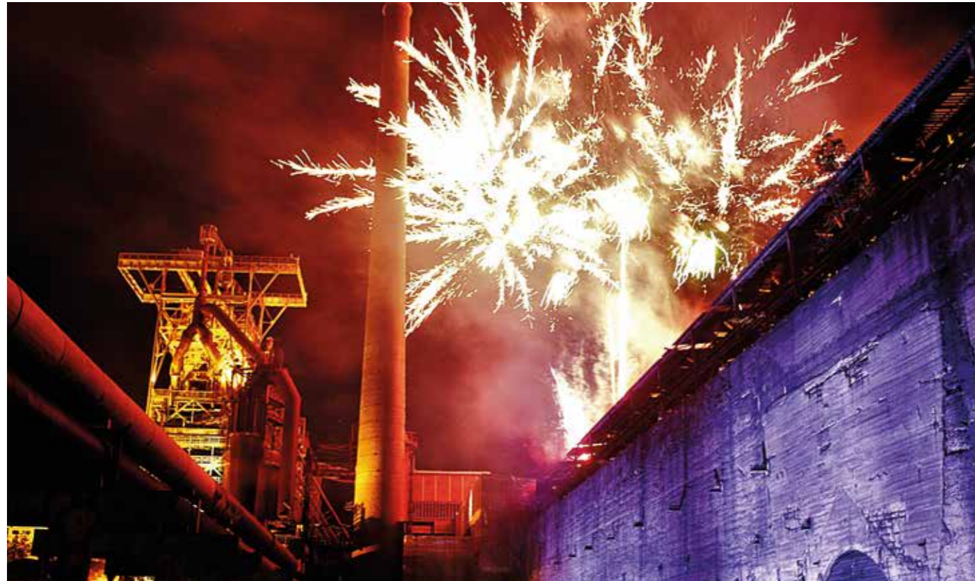
Ein Feuerwerk - wie hier auf dem LWL-Gelände der Henrichshütte bei der Extraschicht - sieht super aus. Für Umwelt und Nachhaltigkeit steht der bunte Böllerspaß allerdings nicht unbedingt.