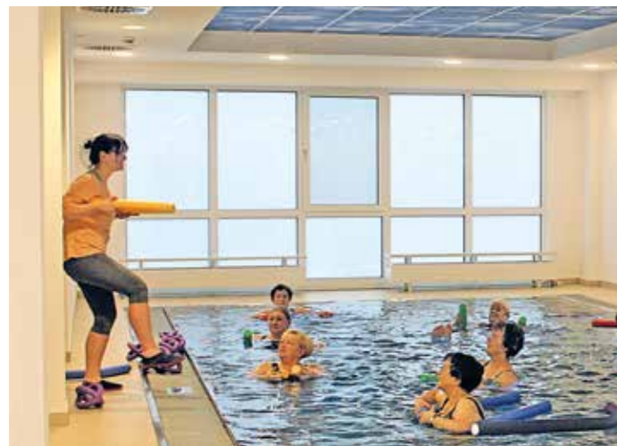
Im Bewegungsbad im Evangelischen Krankenhaus in Witten sorgen Übungen im warmen Wasser für körperliches Wohlbefinden und Linderung bei Erkrankungen.

PAELKE: Nicht immer. Denken Sie beispielsweise an das Wassertreten nach Kneipp - das geschieht in kaltem Wasser. Auch gibt es kalte Güsse oder kaltes Duschen zur Stärkung des Immunsystems oder einer besseren Durchblutung. Grundsätzlich tut Bewegung im Wasser gut.