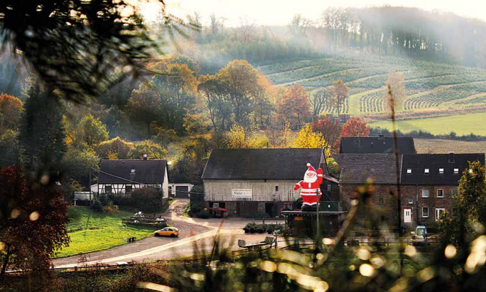
Der Hof der Familie Nüfer in der Elfringhauser Schweiz, In der Porbecke 10. An den Adventswochenenden kann man hier von 10 bis 16 Uhr Getränke und Speisen zum Mitnehmen einkaufen. Ein großer roter Nikolaus weist den Besuchern den richtigen Weg. Alle Schonungen sind ab dem Samstag, 3. Dezember, geöffnet und vom Hof fußläufig zu erreichen. Zum Selbersägen ist die Schonung „Am Wasserturm 88“ mit großer Auswahl ebenfalls ab 3. Dezember geöffnet.