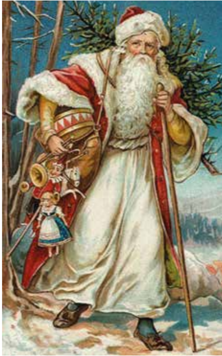
Historische Postkarte, USA