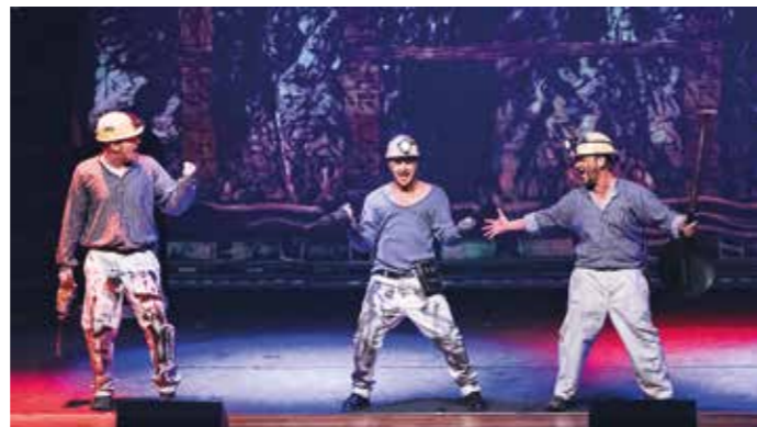
Unter-Tage-Welt: Mit rasanten Bühnenbildwechseln erleben die Zuschauer die Welt Unter Tage. Bergmänner vor Kohle mit Abbauhämmern zeigen die harte Wirklichkeit und bringen die Ruhri-Mentalität auf den Punkt. Zusammenhalt, Vertrauen in den Gegenüber und der Wille gemeinsam wieder ans Tageslicht zurückzukehren.

Mi. 14.12. 19 Uhr Hütten-Kino: „Casablanca“ (1942, 105 Min.) Ein weltbekannter Filmklassiker, dessen Handlung vor dem politischen Hintergrund des 2. Weltkrieges spielt. Mit H. Bogart und I. Bergmann. Eintritt frei.