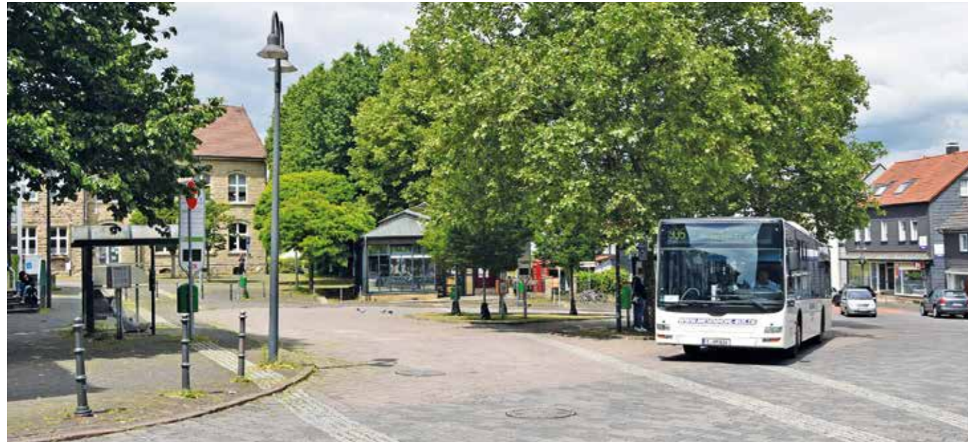
Der Busbahnhof in Niedersprockhövel - wird er an diesem Standort barrierefrei umgebaut?