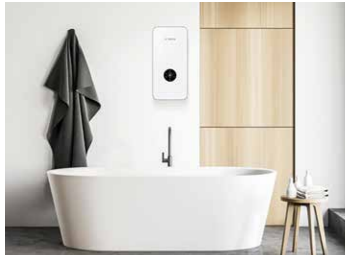
Durchlauferhitzer versorgen das Zuhause dezentral mit Warmwasser in der gewünschten Temperatur und Menge