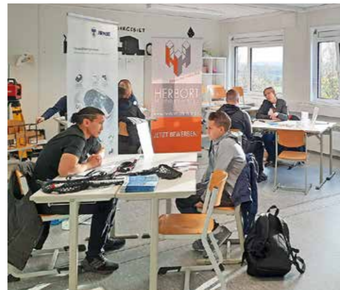
Praktikums-Speed-Dating an der Wilhelm-Kraft-Gesamtschule, Foto: Stadt Sprockhövel

Im Frühjahr ist eine weitere Veranstaltung für die Schülerinnen und Schüler der Mathilde-Anneke-Schule geplant. Zukünftig sollen die Veranstaltungen jährlich für beide Schulen weiter stattfinden.