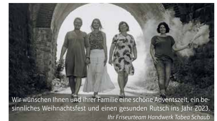
Wir wünschen Ihnen und ihrer Familie eine schöne Adventszeit, ein sinnliches Weihnachtsfest und einen gesunden Rutsch ins Jahr 2023.