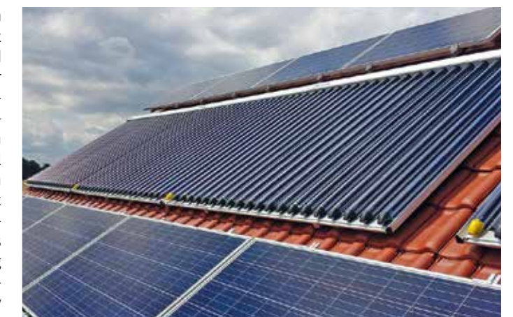
Wer die Energie der Sonne zum Heizen nutzt oder sein Duschwasser solar erwärmt, handelt konsequent ökologisch und macht sich unabhängiger von Energielieferanten. Moderne Solarthermie-Systeme können heute die Hälfte des Heizenergiebedarfs im Eigenheim abdecken.

Solarpumpe muss zudem seltener laufen, was Strom spart und die Kosten weiter senkt. Selbst im Winter steht auch bei diffusem Licht immer erwärmtes Wasser zum Duschen zur Verfügung. Die eigentliche Heizung springt dann nur noch selten an – das entlastet den Geldbeutel und trägt wesentlich zum Klimaschutz bei. Weitere Informationen online unter www.paradigma.de . txn