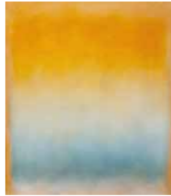
Landschaft mit Goldgelb, 2009

Schwerpunkt der Präsentation sind die zur Perfektion gereiften Gemälde, die von 2000 bis zu seinem Tode 2013 entstanden sind. Turks formauflösende und metaphysische Farberlebnisse werden gemeinsam mit anderen farbkompositorischen Werken aus der Sammlung des Hauses gezeigt. Die Auseinandersetzung mit der Farbe gewann für Turk ab 1975 mehr und mehr an Bedeutung, sodass er erste Farbfelder und Farbräume entwickelte. Seine Bilder verbreiten von der Mitte her einen einfarbigen Grundton, häufig Ocker mit Einsprengseln einer vorgetäuschten Dreidimensionalität von Schnüren und Wölbungen, die dann an den Rändern andersfarbig auslaufen. Aber auch ein Umschlag ab der Bildmitte oder ein Übergang der wechselnden Farbschichten von einem Rand zum anderen ist möglich. Die Kompositionen wirken meditativ und schaffen nach und nach beim Betrachtenden einen konzentrierten Blick, der sich auf die Farbwechsel einlässt.