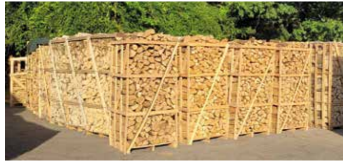
Wohlige Wärme in der dunklen Winterzeit verspricht Kaminholz als Alternative zu Strom und Gas. Die Nachfrage ist riesig und kann kaum befriedigt werden.