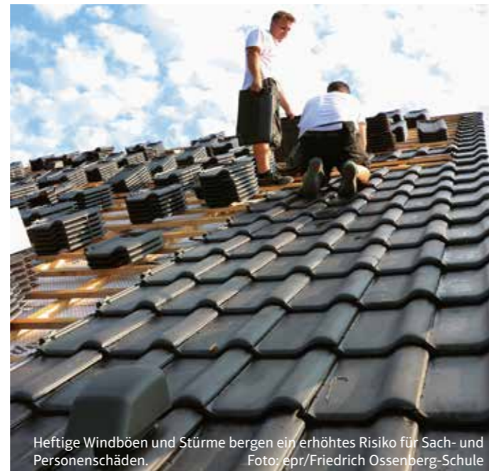
Heftige Windböen und Stürme bergen ein erhöhtes Risiko für Sach- und Personenschäden.

im Laufe von drei Jahren nach der Sanierung ein Förderbetrag von insgesamt 20 Prozent der Aufwendungen, höchstens jedoch 40.000 Euro, abgesetzt werden. Voraussetzung ist, dass die Sanierungen von einem Fachunternehmen durchgeführt werden und die Eigentümer nicht zusätzlich eine KfW-Förderung für das Projekt beantragt haben. Mehr Informationen zu den FOS-Produkten zur Sturmsicherung unter www.fos.de . epr