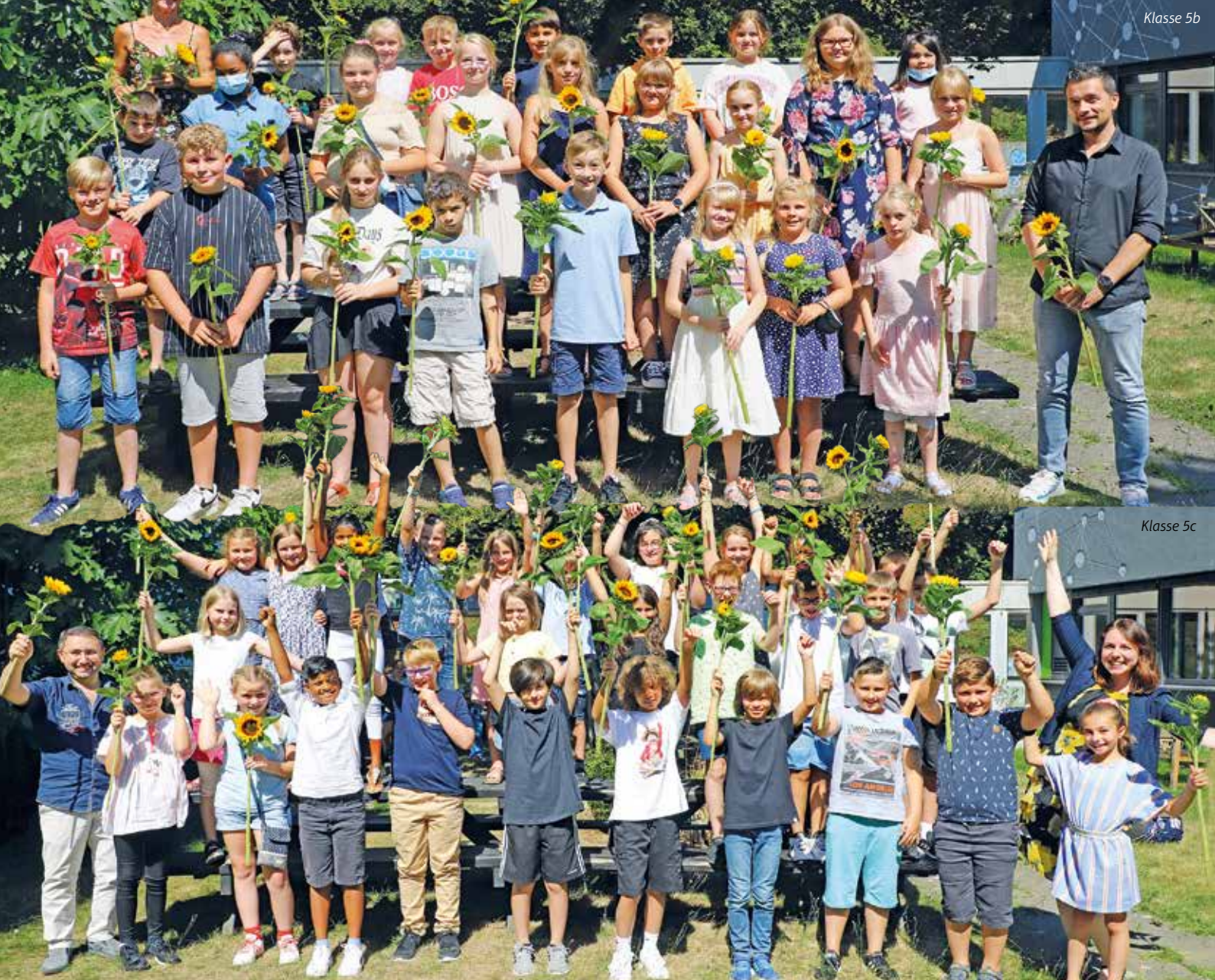
Sonne und Sonnenblumen beim Start für 103 Schülerinnen und Schüler in die 5. Klasse der Hardenstein-Gesamtschule, mehr lesen Sie auf Seite 6.

+++ 4 MONATSMAGAZIN +++ NE: GESAMTAUFLAGE CA. 90.000 EXEMPLARE +++ HAUSHALTSVERTEILUNG +++ ☎ 02302 9838980 +++ WWW.IMAGE-WITTEN.DE +++