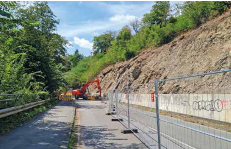
Drei Monate lang können Autos die Herbeder Straße nicht passieren, weil eine Erdgasleitung erneuert und die Hänge gesichert werden. SPD und Bündnis90/Die Grünen stellten dazu dem Bürgermeister nach Baubeginn einige Fragen zu den Auswirkungen.

Wie Straßen.NRW am 7. Juli unter „Informationen aus erster Hand“ ankündigte, sollten ab dem 12. Juli am Steilhang zwischen der L924 (Herbeder Straße) und der „Am Kleff“ in Witten Bauarbeiten durchgeführt werden. Anlass seien die Erneuerung einer Erdgasleitung und Hangsicherungsarbeiten. Nicht zur Freude der Autofahrer muss damit einhergehend die