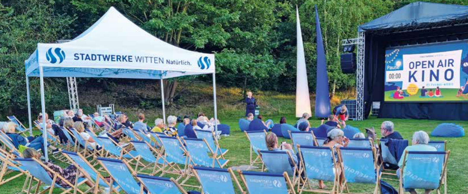
Versuch gelungen: das Freibad Annen wurde eine Woche lang zum open-air-Kino.

Laue Sommerabende, am Pool sitzen und sich einen Kinofilm anschauen... Möglich gemacht haben dies jetzt die Stadtwerke Witten im XXXL-Format: vom 29. Juli bis 6. August 2022 wurde der hintere Teil des Freibads zum Kinosaal. Eine Woche lang konnten bis zu 200 Besucher jeweils nachmittags und abends in einem der vielen Liegestühle, Stühle oder Sitzsäcke Platz nehmen und sich einen Kinofilm anschauen.