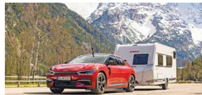
Kia EV6 mit Wohnwagen.