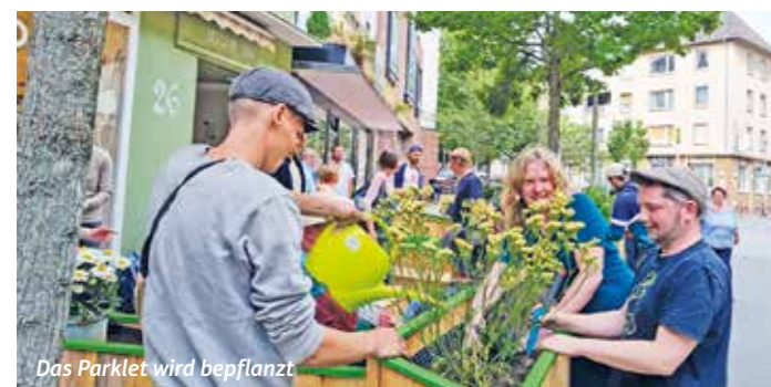
Das Parklet wird bepflanzt.

Trotz der Rekordzeit von nur einem halben Jahr zwischen Antrag und Umsetzung des Projektes gossen die in dieser Zeit stark gestiegenen Kosten reichlich Essig in den Wein. Waren die Planer von 7.700 € ausge-