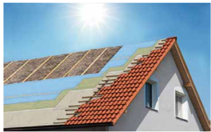
Wenn die Sonne den ganzen Tag auf die Dachflächen brennt, macht sich eine Dämmung im Dachgeschoss schnell positiv bemerkbar.