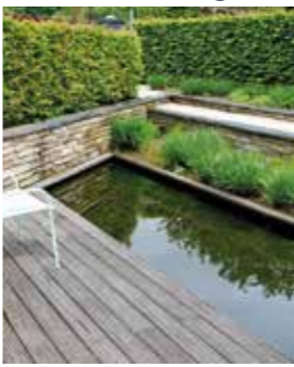
Wenn möglich, sollte Regenwasser im Garten aufgefangen und für die Klimatisierung und Bewässerung genutzt werden.

Eine gute Planung des Gartens kombiniert individuelle Nutzungsansprüche und die örtliche Lage optimal miteinander. Achim Kluge: „Heute fragen Gartenbesitzerinnen und -besitzer, welche Pflanzen gut mit Hitze und Trockenheit auskommen. Da kommen Fragen, wie es gelingt, eine starke Aufheizung der Wege und Terrassenflächen zu vermeiden oder wie man Wasser speichern und im eigenen Garten nutzen kann.“ Daher werden beim Neubau mittlerweile häufiger Brauchwassersysteme eingebaut, sodass Regenwasser nicht nur zur Gartenbewässerung, sondern auch für verschiedene Nutzungen im Haus zur Verfügung steht.