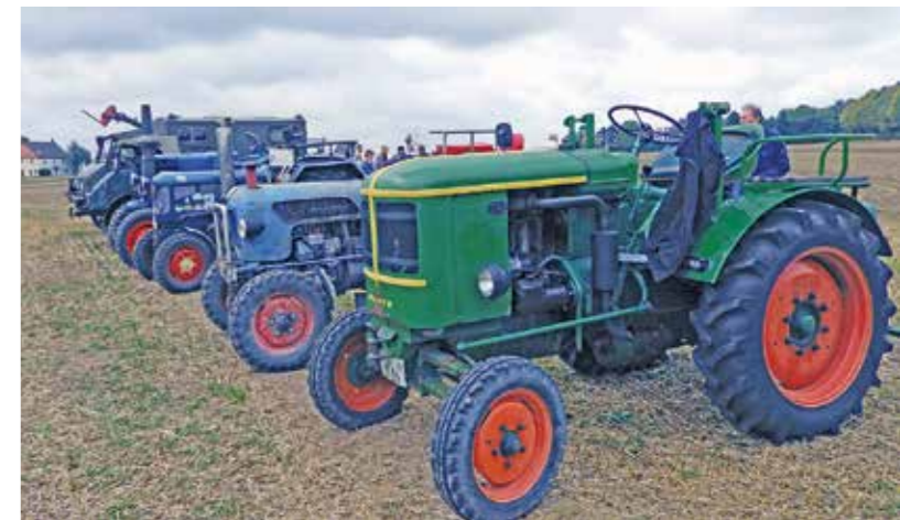
Parade: Viele Oldtimer-Traktoren werden auch diesmal wieder die Blicke der Besucher auf sich ziehen.