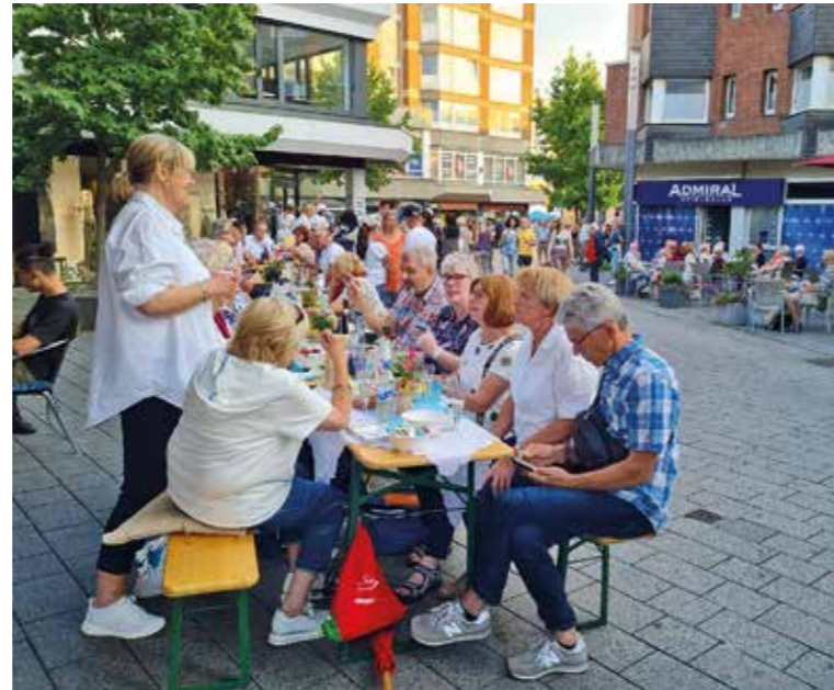
Fröhliche Stimmung herrschte bei der 15. Auflage der Wittener Tafelmusik in der Innenstadt.