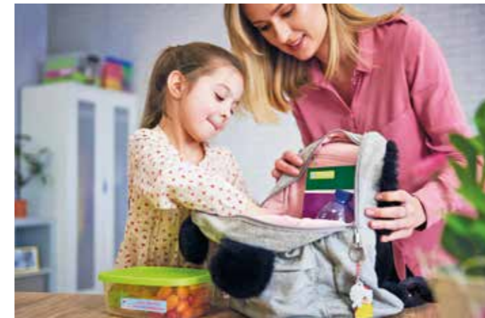
Konsequent eingehaltene Rituale helfen dabei, Routinen zu entwickeln. So können Eltern beispielsweise gemeinsam mit ihrem Kind die Schultasche packen.

Sechs Tipps, die kleinen Abc-Schützen den Schulstart erleichtern können