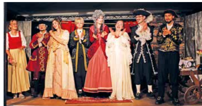
Das Ensemble von Das Fräulein von Scudéry.

Für dieses Stück wurde seit Februar mit acht Schauspielerinnen und Schauspielern (Regie: Florian Schmalstieg) geprobt. Davon sind fünf erst in diesem Jahr dem Theaterverein neu beigetreten. Mit der Aufführung dieses Stücks konnte sogar die Welturaufführung gefeiert werden.