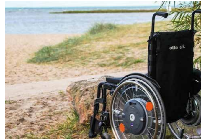
In vielen Städten, beispielsweise an Ost- oder Nordsee, können Menschen mit Handicap an den Strand gelangen. Es gibt sogar spezielle Baderollstühle.

Auch diese Möglichkeit gibt es. Es gibt immer mehr Anbieter von betreuten Reisen für Senioren oder Menschen mit Behinderung. Betreutes Reisen ist nicht nur für allein reisende Pflegebedürftige geeignet,