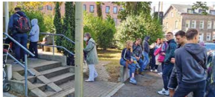
Die Wittener Tafel stellt eine zusätzliche Nachfrage durch Ukrainer und den Auswirkungen der Preissteigerungen für Energie und Lebensmittel fest.

Der russische Überfall auf die Ukraine wirkt sich auch auf die Wittener Tafel aus: seit dem 24. Februar versorgt die Tafel rund 80 Ukrainer – zusätzlich zu den 2.500 Menschen, die von der Herbeder Straße 22 aus regelmäßig unterstützt werden.