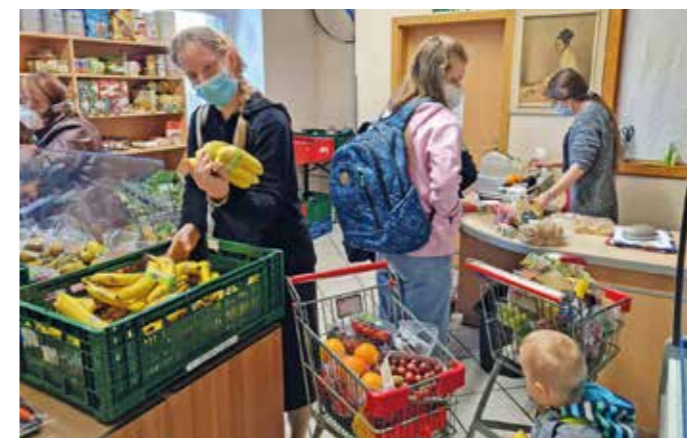
Die Wittener Tafel stellt eine zusätzliche Nachfrage durch Ukrainer und den Auswirkungen der Preissteigerungen für Energie und Lebensmittel fest.

Die Tafel selbst muss schon ab Oktober die Erhöhung des Mindestlohns um rund 20% verkraften, gleichbedeutend mit zusätzlichen Personalkosten von 2500 € im Monat. Gelder der Stadt Witten fließen nicht, die Kosten werden überwiegend aus Spenden und den Einnahmen des im Jahr 2000 eröffneten „Tafellädchens“ abgedeckt. dx