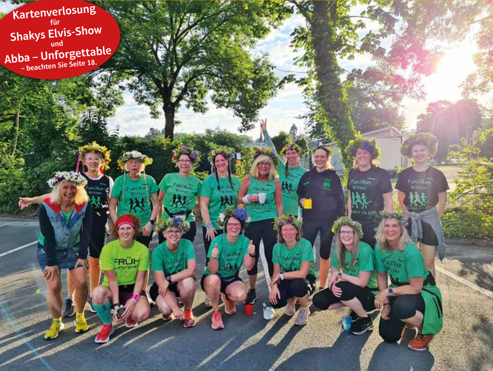
Mitsommernachtlauf in Herbede

Kartenverlosung für Shakys Elvis-Show und Abba – Unforgettable – beachten Sie Seite 18.