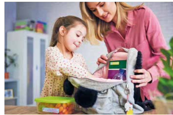
Konsequent eingehaltene Rituale helfen dabei, Routinen zu entwickeln. So können Eltern beispielsweise gemeinsam mit ihrem Kind die Schultasche packen.

Sechs Tipps, die kleinen Abc-Schützen den Schulstart erleichtern können