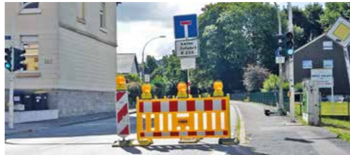
Sperrung Herbeder Straße

Die kurzfristige Lösung der Stadt sind Warnbaken und das Schild „Anlieger frei“. Diese Variante wird in einigen Nachbarstädten bereits erfolgreich angewendet.