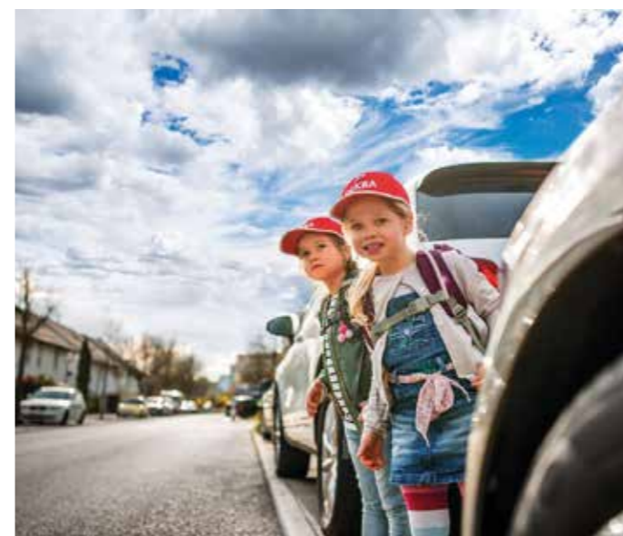
Grundschüler auf dem Schulweg.