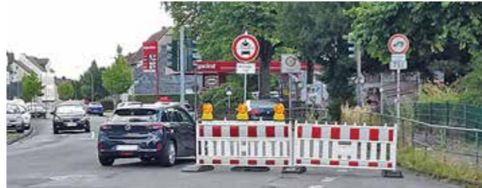
Durch Schrankenzone wird deutlich, dass der Wannen nicht Teil der offiziellen Umleitungsstrecke ist.

Baustellen sind ein anhaltendes Ärgernis. Man wird umgeleitet, abgebremst oder gar verwirrt. Doch meistens geht es eben nicht anders, wenn die Stadt einen Straßenverkehrsmissstand beheben will. Dann wird eine offizielle Umleitung ausgewiesen, die sich nach amtlichen Regeln richtet. Doch so manches Navi hält sich nicht daran, sondern sucht die kürzeste Strecke, die dann durch enge Nebenstraßen geht. Auch Ortskundige meinen oft den besseren (Schleich-)Weg zu kennen. Dass es sich dann in diesen Straßen „drubbelt“, ist nur folgerichtig. So wird es doch problematisch, wie jetzt in der Wannenstraße. Infolge der Baumaßnahmen Billerbeckstraße und Herbeder Straße wird der Verkehr über den Hellweg umgeleitet. Leider nehmen viele, auch LKW, den kürzeren Weg über die Wannenstraße. Aber die ist tonnagebeschränkt: maximal 7,5 Tonnen sind erlaubt, worauf ortsfeste Schilder hinweisen.