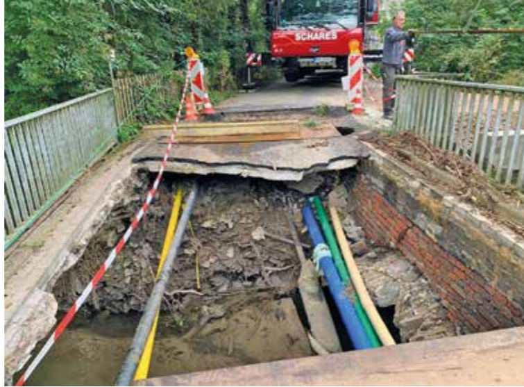
Die von der Flut zerstörte Brücke in Hattingen-Bredenscheid, An der Kratzmühle. Hier stehen mehrere Häuser in einem Tal vom Sprockhöveler Bach. Hier müssen die Anwohner ran, die aber finanzielle Unterstützung durch die Hochwasserhilfe bekommen haben.

In dieser Ausgabe berichten wir über das Altstadtfest, dass nach 2-jähriger Coronapause endlich wieder stattfinden kann und immer viele Besucher, auch aus Nachbarstädten, anzieht. Lesen Sie das interessante Interview von Duo- und Akustik-Böcker über Kurzsichtigkeit bei Kindern, welche ausgeprägter ist, als viele Eltern wissen. Hier gibt es neue Erkenntnisse. Der 1. Schultag, ein entscheidender Schritt im Leben eines Kindes, und in der Paasmühle Hattingen werden Eulen, Greifvögel und Wasservögel aufgenommen, versorgt und gepflegt. Nun wünschen wir allen Lesern eine schöne Sommerzeit und viel Spaß mit der aktuellen Image-Ausgabe! Ihre Image-Redaktion