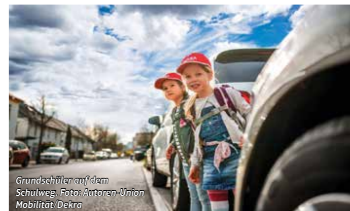
Grundschüler auf dem Schulweg.

Kaum haben die Sommerferien begonnen, sorgen sich nicht nur Eltern um den ersten Schulweg ihrer ABC-Schützen. Zwischen Anfang August und Mitte September beginnt für sie die Schule. Viele von ihnen werden ihren Schulweg im Straßenverkehr bald allein bewältigen müssen. Als die ungeschütztesten aller Verkehrsteilnehmer brauchen sie den bestmöglichen Schutz. Die Sachverständigenorganisation Dekra trägt dazu seit 2004 mit der Aktion „Sicherheit braucht Köpfchen“ bei. Sie läuft auch 2022 wieder bundesweit – mit auffälligen Kinderkappen für mehr Sichtbarkeit und den wichtigsten Tipps für das richtige Verhalten im Straßenverkehr.