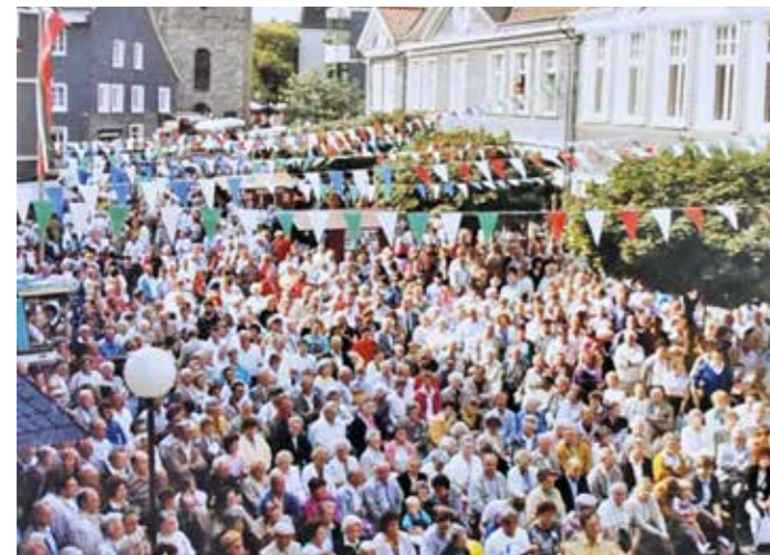
Bunte Wimpel über dem Untermarkt und sehr viele Menschen sorgten für Stimmung bei den Altstadtfesten. Beliebt war damals auch der „Affenfelsen“, der sich an der Stelle des heutigen Treidelbrunnens befand.

lerobjekten. Viele von ihnen entstanden aus beachteten Wettbewerben heraus. Die Finanzen wurden zunehmend ein Politikum. In den 90er Jahren reduzierte die Stadt die Zuschüsse. 1997 kostete das Fest 160.000 DM und schloss mit einem Minus von weiteren 15.000 DM ab. Sponsoren wurden gewonnen und versuchten, das beliebte Fest zu erhalten. 2002 wurde aus Rock an der Stadtmauer nun „Rock am Bunker“. 2004 wurde erneut darüber diskutiert, ob sich Hattingen ein Altstadtfest überhaupt noch leisten könne. Und das vor dem Hintergrund, dass im jahreszeitlichen Kalender andere Events wie Frühlings- und Herbstmarkt sowie der Weihnachtsmarkt zunehmend zum Publikumsmagneten wurden. 2011 übernimmt Hattingen Marketing das Altstadtfest – neben den Organisationen der anderen Feste zum Frühling und Herbst und vor allem zum Weihnachtsmarkt. 2019 kamen bei bestem Wetter etwa 40.000 Besucher. Während die einen froh darüber sind, endlich wieder etwas Platz in den Gassen zu haben, sagen andere, das Altstadtfest habe als Besuchermagnet ausgedient und sein Alleinstellungsmerkmal längst verloren. Die immer weiter gestiegenen Kosten machen solche Feste zunehmend zu einer Herausforderung. anja