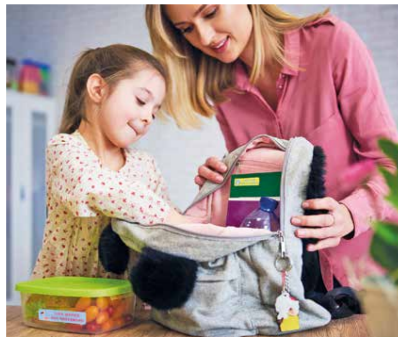
Konsequent eingehaltene Rituale helfen dabei, Routinen zu entwickeln. So können Eltern beispielsweise gemeinsam mit ihrem Kind die Schultasche packen.

4. Der kurze Blick zurück Bevor das Kind einen Raum oder die Schule verlässt oder von einer Freizeitaktivität nach Hause zurückkehrt, sollte es sich noch einmal umschauen und prüfen, ob vielleicht noch etwas von den eigenen Dingen herumliegt.