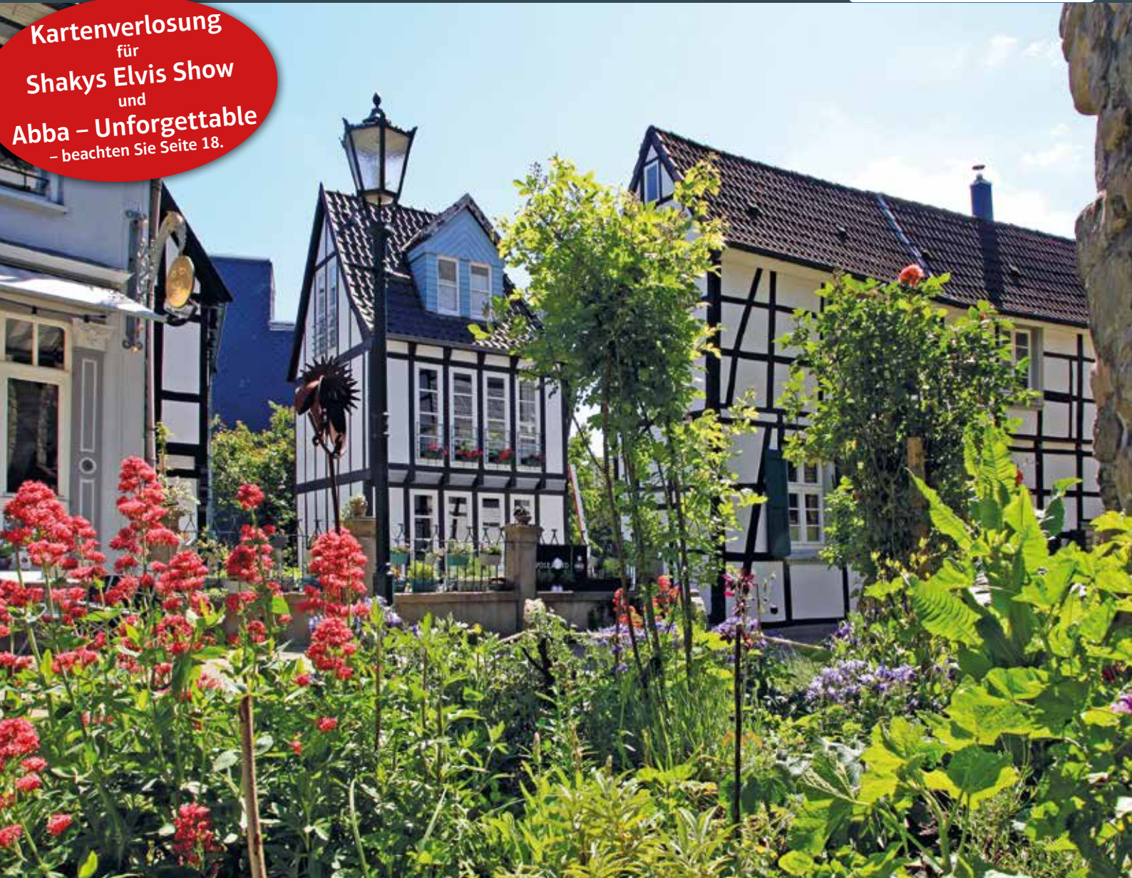
Hattinger Kirchplatz, Foto: Uli Auffermann

Kartenverlosung für Shakys Elvis Show und Abba – Unforgettable – beachten Sie Seite 18.