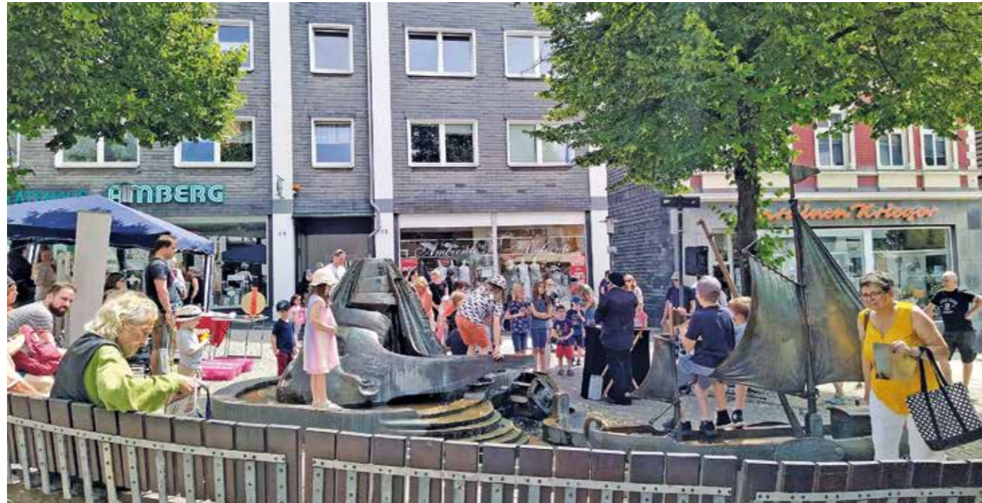
Der Treidelbrunnen sorgt seit über dreißig Jahren für Spiel und Wasserspaß in der Hattinger Innenstadt. Den Erwachsenen bietet die Sitzgruppe um den Brunnen Möglichkeiten zum Verweilen und Ausruhen - nicht nur an heißen Sommertagen.