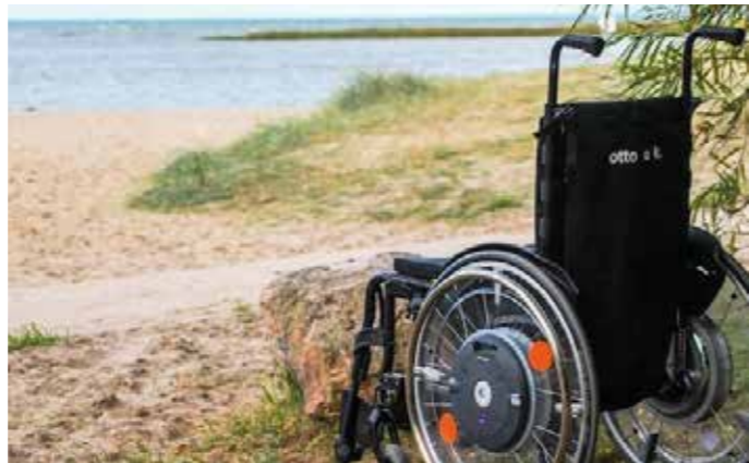
In vielen Städten, beispielsweise an Ost- oder Nordsee, können Menschen mit Handicap an den Strand gelangen. Es gibt sogar spezielle Baderollstühle.

Kann jemand anders die Pflege übernehmen? Gibt es Familienangehörige oder Freunde, die diese Aufgabe für die Zeit des Urlaubs verantwortungsvoll übernehmen können? In diesem Zusammenhang ist auch die sogenannte Verhinderungspflege zu klären, die ab Pflegegrad 2 infrage kommt. Auch eine zeitlich begrenzte Kurzzeitpflege als vollstationäre Heimunterbringung kann eine Lösung sein. Wer in der Pflege von einem ambulanten Pflegedienst unterstützt wird, kann im Falle des eigenen Urlaubs vielleicht auch eine Kombination mit der Tagespflege als Lösungsweg finden. Sicherzustellen muss auch die Medikamentengabe. Planen Sie Ihren Urlaub rechtzeitig und sprechen Sie früh mit ambulanten Pflegediensten oder anderen Einrichtungen, um einen Platz für den Angehörigen zu bekommen. Bevor Sie in Ruhe den wohlverdienten Urlaub antreten, sollten Sie wichtige In-