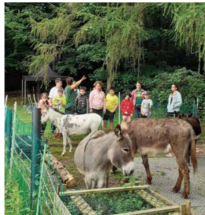
Bevor es mit den Eseln auf Wanderung geht, müssen die Vierbeiner ausgiebig gestriegelt werden.

Zwei Wochen lang haben insgesamt rund 60 Kinder an dem diesjährigen Förderprogramm der Förderschulen des Ennepe-Ruhr-Kreises teilgenommen. Eine Gruppe durfte täglich die Esel besuchen, während die anderen Gruppen an der Kämpenschule in Witten blieben und u.a. T-Shirts gestalten, Dinge aus Holz werkeln oder sich auf dem Airtramp in der Turnhalle austoben konnten. Bei den sommerlichen Temperaturen durften auch Wasserschlachten auf dem Schulhof nicht fehlen sowie das Märchenmobil, welches bereits im letzten Jahr für viele unterhaltsame und lehrreiche Momente bei den Kindern sorgte. Inklusionsassistenten beider Schulen haben die Kinder und Jugendlichen in Zusammenarbeit mit den Mitarbeitern der Lebenshilfe Ennepe-Ruhr/Hagen gefördert. Um das Ferienprogramm an den kreiseigenen Schulen anbieten zu können, hat der Ennepe-Ruhr-Kreis eine anteilige Förderung über das Landesprogramm „Extra-Zeit zum Lernen“ beantragt und bewilligt bekommen. pen