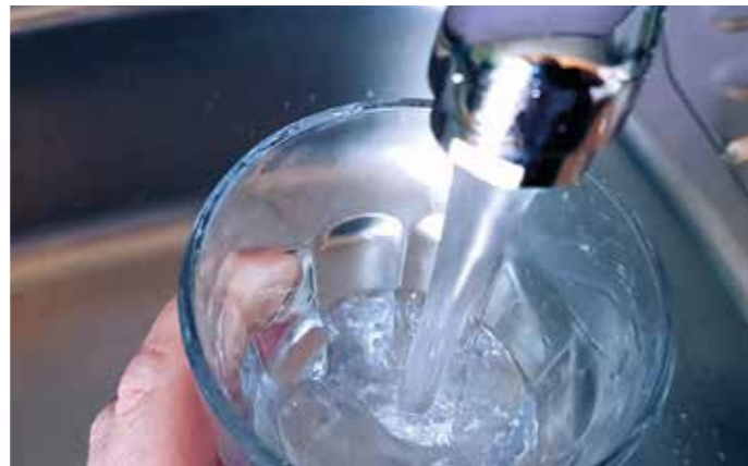
Lebenselixier Wasser: Ohne Wasser können wir nicht leben.

Zu viel Wasser im menschlichen Körper wird ganz einfach ausgeschieden. Der häufige Gang zur Toilette ist dann normal. „Wasser im Körper“ kann aber große Probleme verursachen, wenn Wasser