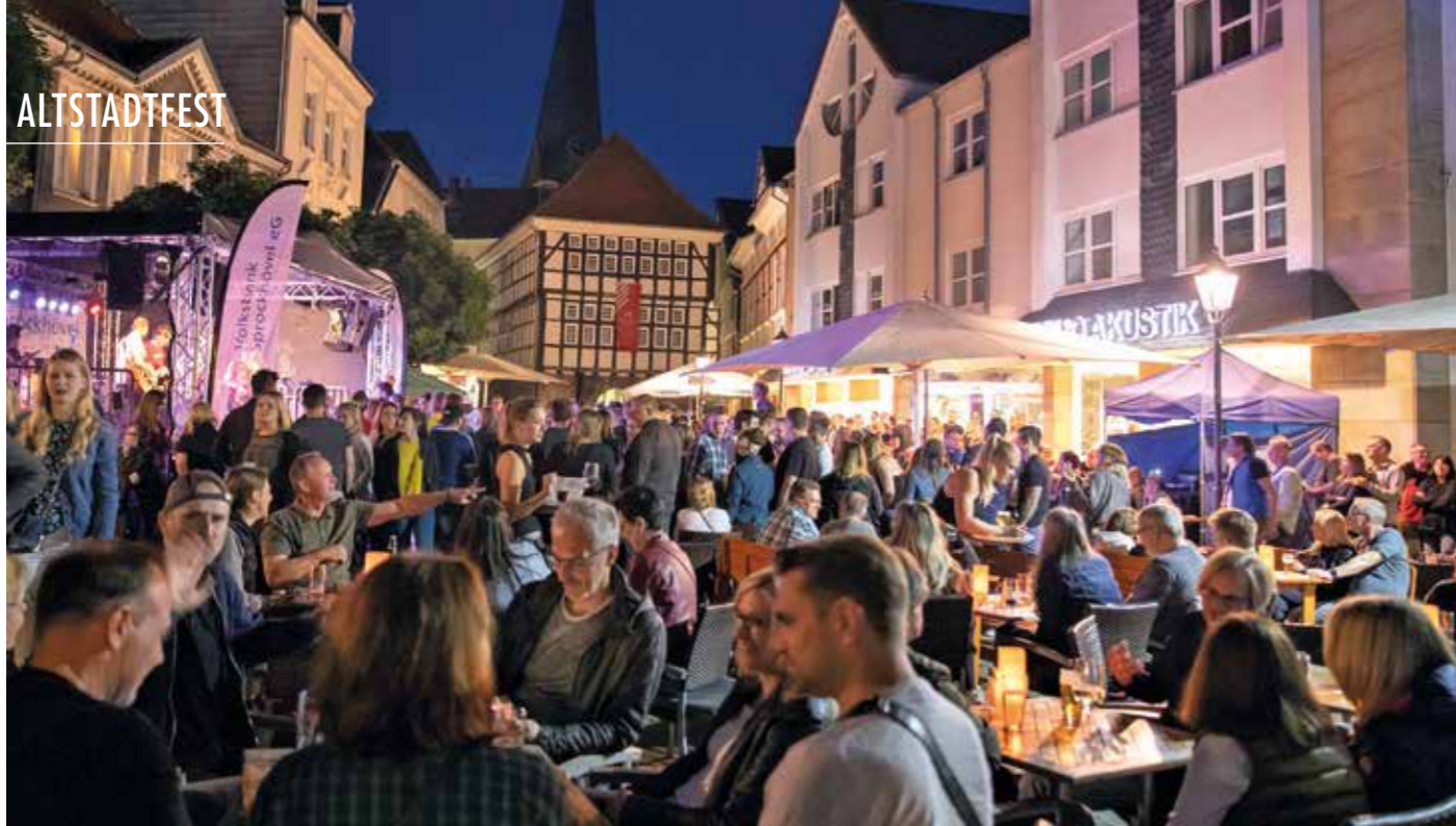
Vom 19. bis 21. August ist es wieder soweit. Dann läuft in der Hattinger Altstadt das Altstadtfest nach zwei Jahren Coronapause.