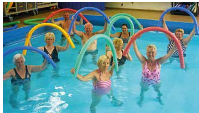
Auch Bewegung im Wasser tut dem Menschen gut.