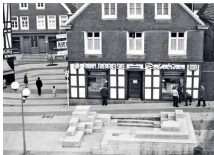
So sah der Platz am Obermarkt vor dem Treidelbrunnen aus: Der sogenannte „Affenfelsen“ war eine Betonsitzfläche, vor allem bei Jugendlichen beliebt.