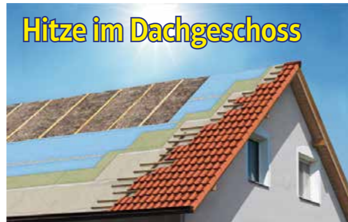
Wenn die Sonne den ganzen Tag auf die Dachflächen brennt, macht sich eine Dämmung im Dachgeschoss schnell positiv bemerkbar.

Kartenvorverkauf: Telefon (02324) 204 3522, -3555, -3511, -3513 oder per E-Mail unter eintrittskarten@hattingen.de