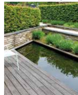
Wenn möglich, sollte Regenwasser im Garten aufgefangen und für die Klimatisierung und Bewässerung genutzt werden.

Eine gute Planung des Gartens kombiniert individuelle Nutzungsansprüche und die örtliche Lage optimal miteinander. Achim Kluge: „Heute fragen Gartenbesitzerinnen und -besitzer, welche Pflanzen gut mit Hitze und Trockenheit auskommen. Da kommen Fragen, wie es gelingt, eine starke Aufheizung der Wege und Terrassenflächen zu vermeiden oder wie man Wasser speichern und im eigenen Garten nutzen kann.“ Daher werden beim Neubau mittlerweile häufiger Brauchwassersysteme eingebaut, sodass Regenwasser nicht nur zur Gartenbewässerung, sondern auch für verschiedene Nutzungen im Haus zur Verfügung steht.