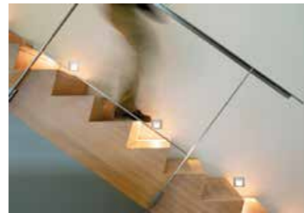
Steplights machen Treppen sicherer.

Auf Verkehrswegen wie Flur oder Treppe gibt Licht mehr Sicherheit. Schatten und Spiegelungen sind jedoch tabu, denn sie verunsichern