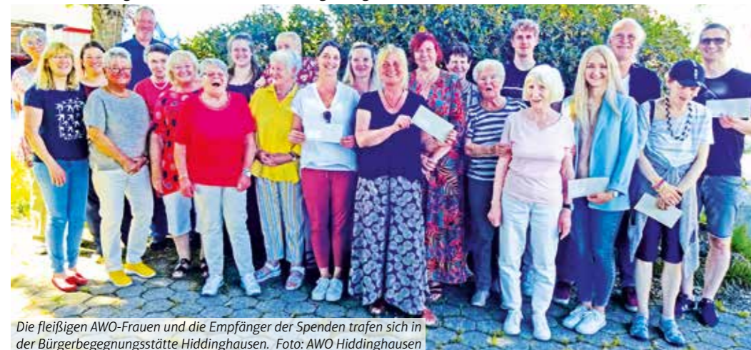
Die fleißigen AWO-Frauen und die Empfänger der Spenden trafen sich in der Bürgerbegegnungsstätte Hiddinghausen.