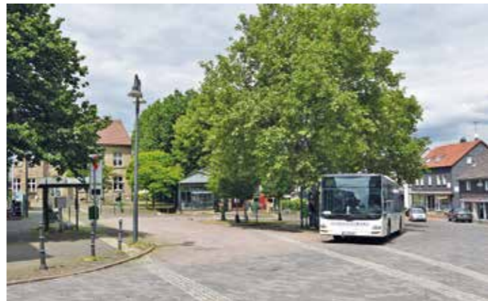
Der Busbahnhof heute.

Bis zu sieben Bahnsteige in der Sägezahnordnung sowie die Erschließung über einen Arm des neuen Kreisverkehrs anstatt der heutigen Signalanlage in Höhe der Bäckerei würden räumlich betrachtet passen. Am bisherigen Standort bliebe eine Haltestelle erhalten. Die Ergebnisse einer Voruntersuchung wurden der Politik im Juni 2018 vorgestellt. Im Oktober 2021 begann das Ingenieurbüro Planungsgruppe MWM aus Aachen mit der Planung. Seit November 2021 findet eine permanente Abstimmung zwischen der Verwaltung, dem Ingenieurbüro, den Verkehrsbetrieben (VER, BOGESTRA und WSW) sowie anderen Interessengruppen statt, um die unterschiedlichen Anforderungsprofile zu berücksichtigen. Bei einer