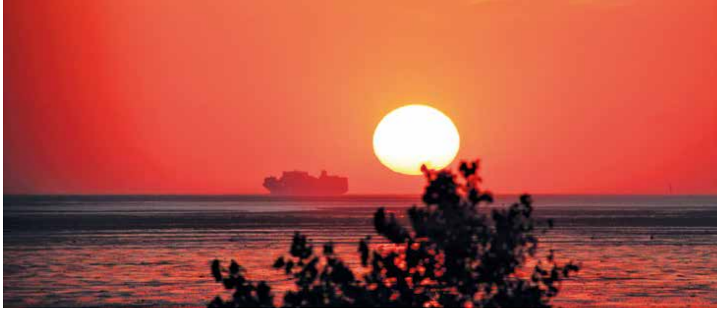
Bald beginnen wieder die heißesten Tage im Jahr – zumindest, wenn es nach dem Kalender geht.