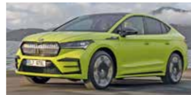
Skoda Enyaq Coupé RS iV.

Alle Jahre wieder ermitteln Schwacke und „Auto Bild“ die „Wertmeister“. Das sind die Fahrzeuge, die in den nächsten vier Jahren vermutlich am wenigsten Wert verlieren werden. Den prozentual höchsten Restwert hat die V-Klasse von Mercedes-Benz mit 68,3 Prozent. In der zugrunde gelegten Version kostet der Van 101.330 Euro und verliert in vier Jahren bei 20.000 Kilometer Jahresfahrleistung 32.081 Euro von seinem Neuwert. Beim realen Geldverlust die Nase vorn hat erneut der Dacia Sandero. In der Motorisierung TCe 90 verliert er 5200 Euro von seinem Neupreis von 15.500 Euro. Mit 66,5 Prozent ist er auch Restwertriese in der Kleinwagenklasse.