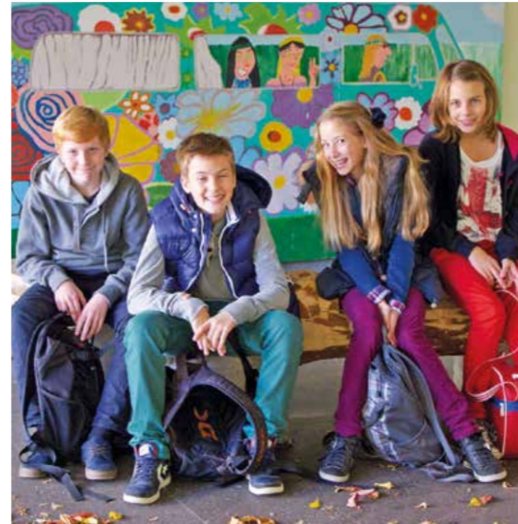
Die Freunde sind in der Pubertät sehr wichtig – da kann das Lernen schon mal in den Hintergrund rücken.