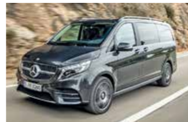
Mercedes-Benz V-Klasse.