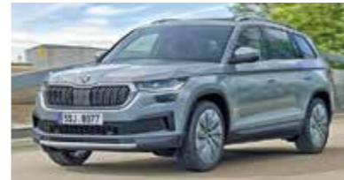
Skoda Kodiaq.