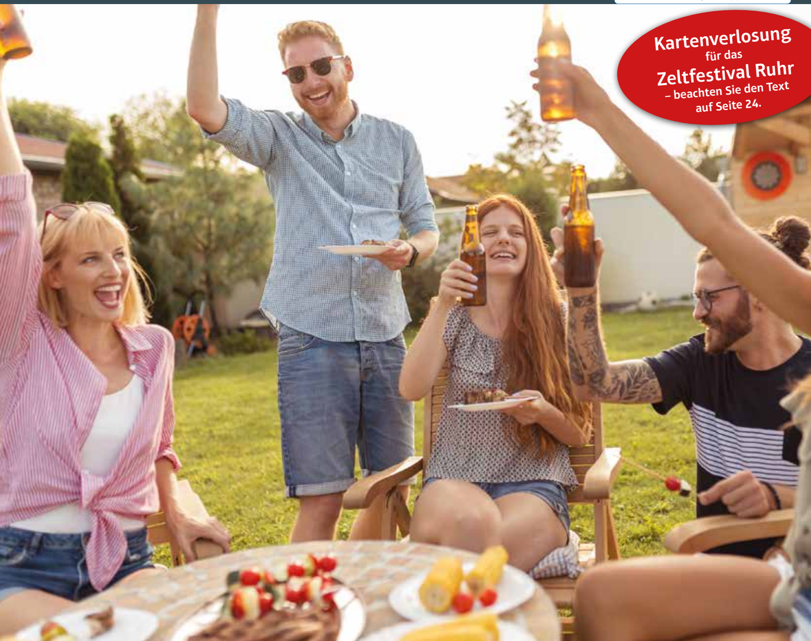
Sommerzeit ist Grillzeit.

Kartenverlosung für das Zeltfestival Ruhr – beachten Sie den Text auf Seite 24.