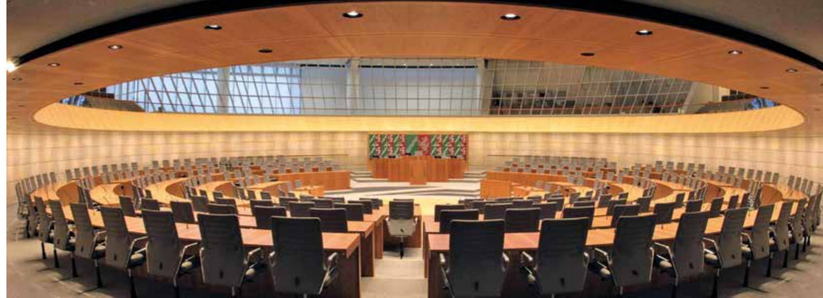
Der Landtag in NRW. Der Landtag hat seinen Sitz im Regierungsviertel in Düsseldorf. Neben der Bundes- und der Kommunalpolitik ist die Landespolitik die dritte große Säule der Demokratie. Hier sitzen bald auch die Landtagsabgeordneten.