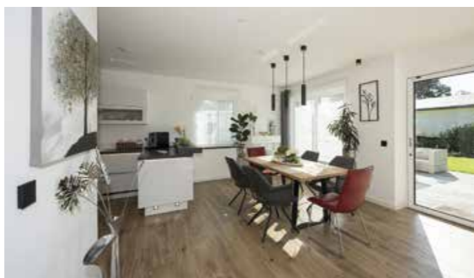
Die Touchpads an den Wänden für die Smarthome-Steuerung sind unauffällig ins Interieur integriert und fallen kaum auf.

Schutz vor Einbrechern und viele weitere Möglichkeiten Ist man länger unterwegs, hält eine Anwesenheitssimulation Einbrecher fern. Das Sicherheitssystem greift dabei auf die Komponenten Jalousien und Beleuchtung zurück. Werden Fenster oder Tür gewaltsam geöffnet, startet es die Alarmanlage und schickt eine Meldung an die Hausherren. Außerdem warnt das System vor Feuer- oder Wasserschäden und hält persönliche Daten privat. Mehr Informationen gibt es unter www.roth-massivhaus.de. Das individuell gestaltete Smarthome bietet zudem viele weitere Möglichkeiten: Mit der Multimediasteuerung lassen sich Musik und TV integrieren, Notruftaste und Sturzkontrolle erleichtern das selbstbestimmte Wohnen im Alter, das Grün im Garten freut sich über die automatisierte Bewässerung und auf Wunsch steuert der Miniserver Sauna und Pool. Viele Häuser lassen sich auch nachträglich nachrüsten und Schritt für Schritt in ein vollwertiges Smarthome verwandeln. djd