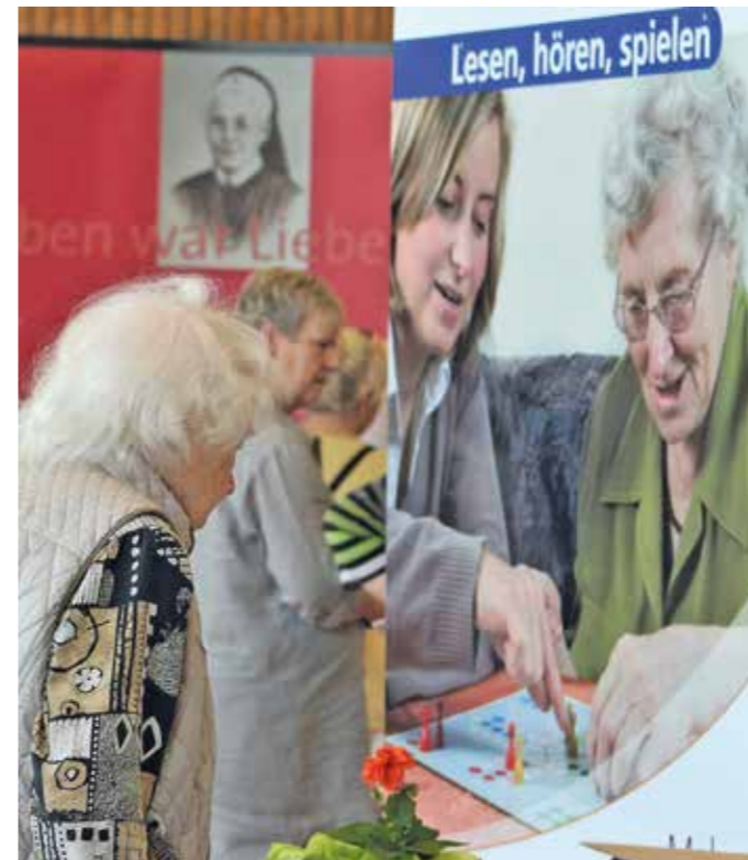
Dementielle Erkrankungen haben deutlich zugenommen. Aber man spricht zunehmend über diese Krankheit. Sie ist zwar nicht heilbar, kann aber zumindest im Verlauf verlangsamt werden.

Zu Beginn der Erkrankung ist es oft ein Mix zwischen den pflegenden Angehörigen, einem ambulanten Pflegedienst und Beschäftigungsangeboten in einer Tagespflege. Voraussetzung ist allerdings, dass sich der an Demenz erkrankte Mensch in eine Gruppe einbinden lässt. Viele Erkrankte sind körperlich mobil und entwickeln unter Umständen Weglauftendenzen. Das macht die Situation für alle Beteiligten noch schwieriger. Es ist eine große Herausforderung zu versuchen, immer noch wertschätzend miteinander umzugehen. Der demente Mensch drückt seine Gefühle oft anders aus, als dies vor seiner Erkrankung der Fall war. Manches hätte er vielleicht nie gewagt deutlich zu machen. Eine Demenz kann einen Menschen aber auch zum Positiven in seinem Verhalten verändern. Es gibt Fälle, in denen bisher die Mutter oder der Vater eher unzugänglich waren und durch die Erkrankung liebevoller wurden und die erwachsenen Kinder einen neuen Zugang zu ihren Eltern fanden. Jede Erkrankung ist verschieden. Experten, beispielsweise bei der Alzheimer Gesellschaft und bei den Pflegediensten, setzen ihr Wissen für die Betroffenen und die Angehörigen ein, um für den Erkrankten die optimale Versorgung zu erreichen. anja