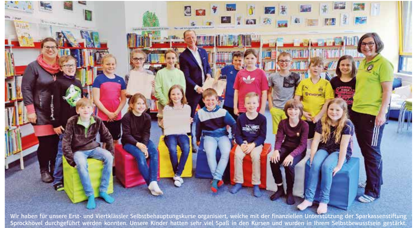
Wir haben für unsere Erst- und Viertklässler Selbstbehauptungskurse organisiert, welche mit der finanziellen Unterstützung der Sparkassenstiftung Sprockhövel durchgeführt werden konnten. Unsere Kinder hatten sehr viel Spaß in den Kursen und wurden in Ihrem Selbstbewusstsein gestärkt.

Der Eintritt beträgt 8 Euro im Vorverkauf und 10 Euro an der Abendkasse. Getränke und Speisen können vor Ort erworben werden.