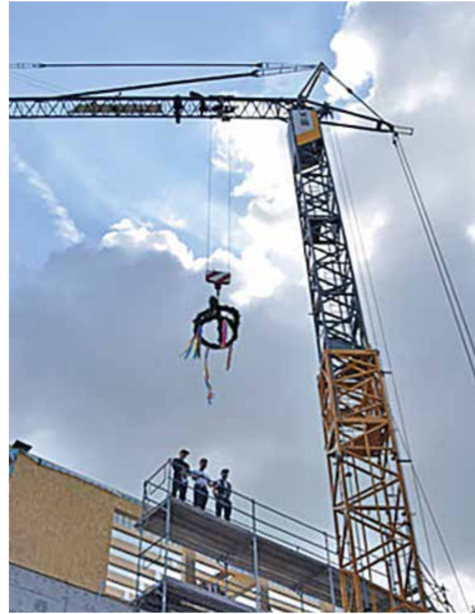
„Was nicht fehlen darf, ist Glück - und das geschieht durch dieses Glas, das mit seinen Scherben dieses Gebäude für immer glücklich halten darf!“ – Mit einem Richtspruch und dem zerbrochenen Glas wünschten die Zimmermänner dem Gebäude beim Richtfest auf traditionelle Weise Glück.

1.150 Quadratmeter zusätzliche Nutzfläche am Berufskolleg Witten