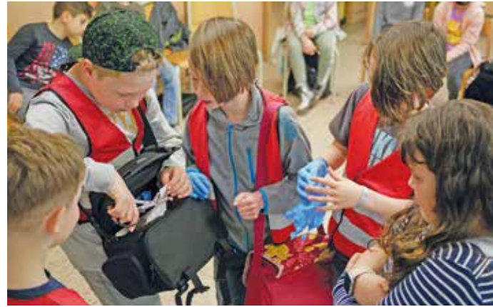
Erste Hilfe – was ist zu tun? Mit großem Interesse nahmen Kinder der Herbeder Grundschule an einem Erste-Hilfe-Kurs vom DRK Witten teil.

Wie schnell ist es passiert, ein kleiner Sturz und ein Kind trägt eine Platzwunde am Knie oder eine Verletzung am Finger davon. Oft helfen bei kleinen und großen Unfällen schon wenige Handgriffe und das richtige Verhalten, um wirksame Hilfe zu leisten – wenn man weiß, wie es geht. An dem Punkt setzte die Grundschule Herbede wieder an: Nach einer coronabedingten Pause machte das DRK Witten jetzt wieder kleine Helferinnen und Helfer der 4. Klasse der Herbeder Grundschule fit in Erster Hilfe.