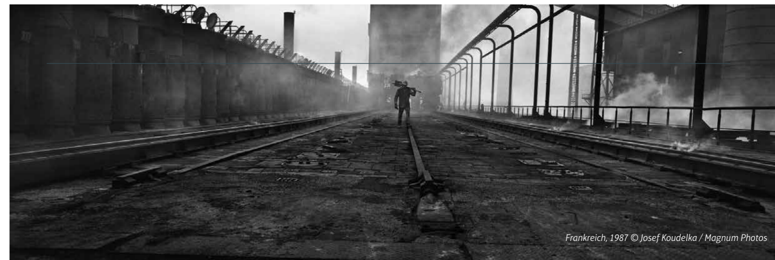
Frankreich, 1987

Weitere Informationen unter: http://www.zeche-nachtigall.lwl.org