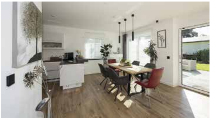
Die Touchpads an den Wänden für die Smarhome-Steuerung sind unauffällig ins Interior integriert und fallen kaum auf.

Komfort in allen Bereichen und einfache Handhabung Bauherren, die Smarhome-Lösungen einplanen, wünschen sich für ihr Eigenheim eine intelligente Steuerung von Heizung, Klimaanlage und Lüftung. So können beispielsweise Fenster, die sich je nach Luftqualität und Temperatur selbst öffnen und schließen, mit der Heizung gekoppelt werden. Einzelne Räume werden nur so warm, wie die Bewohner es zum Wohnen oder Schlafen wünschen. Brennt die Sonne, senken sich Jalousien und Markisen automatisch. Ebenso praktisch: Lichter schalten sich selbst aus, wenn niemand im Raum ist. Bewe-