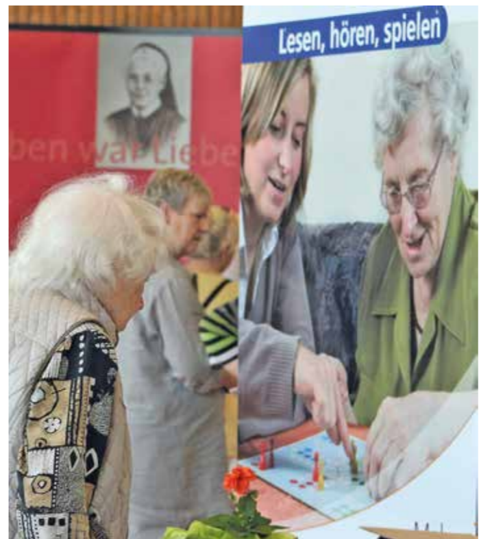
Dementielle Erkrankungen haben deutlich zugenommen. Aber man spricht zunehmend über diese Krankheit. Sie ist zwar nicht heilbar, kann aber zumindest im Verlauf verlangsamt werden.