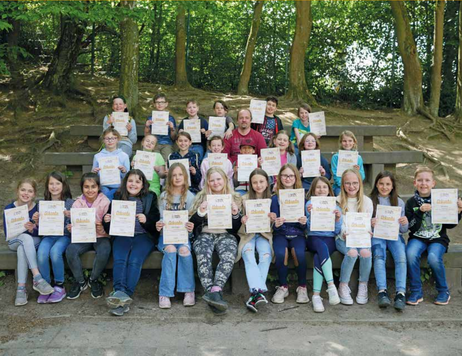
Herbeder Grundschüler lernen Erste Hilfe – stolz halten die Kinder ihre Urkunden nach ihrem Erste-Hilfe-Kurs hoch.

+++ 4 MONATSMAGAZINE: GESAMTAUFLAGE CA. 90.000 EXEMPLARE +++ HAUSHALTSVERTEILUNG +++ ☎ 02302 9838980 +++ WWW.IMAGE-WITTEN.DE +++