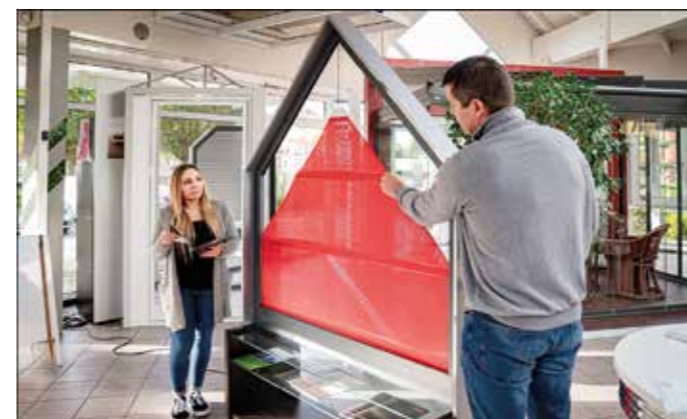
Ob Plissee, Rollläden, Jalousie, Sonnensegel oder Markise – ohne den passenden Sonnenschutz machen heiße Sommertage deutlich weniger Spaß. Wer mehr Wohnkomfort im Eigenheim möchte, sollte sich im Rollladen- und Sonnenschutz-Fachbetrieb vor Ort unverbindlich beraten lassen.

Um sich im Garten zu entspannen, braucht es nicht viel. Eine bequeme Liege auf der Terrasse und ein kühles Getränk reichen oft aus. In der Praxis funktioniert das jedoch nur so lange, bis die Sonne den Liegeplatz erreicht und es viel zu heiß und hell wird. Spätestens jetzt zeigt sich, dass es echtes Gartenglück ohne Sonnenschutz nicht gibt. Schattige Plätze lassen sich heute ganz einfach realisieren – mit individuell passenden Sonnenschutzprodukten. Dabei steht der Komfort an erster Stelle: Rollläden und Markisen können mit einem Motor und einer automatischen Steuerung ausgestattet werden. Dadurch lassen sich Licht und Schatten ganz individuell steuern – je nach System per App auf Smartphone oder Tablet, Fernbedienung, Wandschalter oder Zeitschaltuhr. Ausgestattet mit Wind-, Regen- und Lichtsensoren reagieren Markisen sogar selbständig auf Witterungsveränderungen. So fahren sie zum Beispiel bei einem Unwetter selbsttätig ein, um Schäden durch Wind oder Starkregen zu vermeiden. Die Nachrüstung moderner Steuerungstechnik an älteren Sonnenschutzprodukten übernehmen qualifizierte örtliche Rollladen- und Sonnenschutz-Fachbetriebe. Die Experten kümmern sich um die Fertigung, den Einbau sowie die Wartung und beraten individuell. Weitere Informationen dazu gibt es unter www.rollladen-sonnenschutz.de . txn