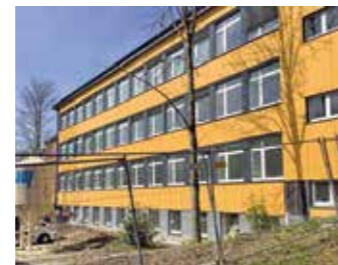
BK Witten Gebäude B: Das gelbe Gebäude B ist fast fertig. Nach den Sommerferien werden die Schülerinnen und Schüler aus den Containern in ihr frisch saniertes und modernisiertes Gebäude umziehen können.

Für die Innenarchitektur der Schule bedeutet das im Einzelnen: Bodenbeläge, Innentüren und Wandoberflächen sowie die Innenbeleuchtung werden erneuert, Unterdecken werden eingebaut. Ebenso werden die sanitären Einrichtungen inklusive der Fliesen erneuert und das Berufskolleg wird an das Glasfasernetz angeschlossen. pen