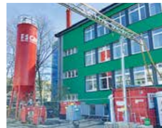
BK Witten Gebäude D: Fix und fertig ist das grüne Gebäude D. In dem roten Silo befand sich das Verfüllmaterial, mit dem die Hohlräume unter dem E-Gebäude geschlossen wurden.