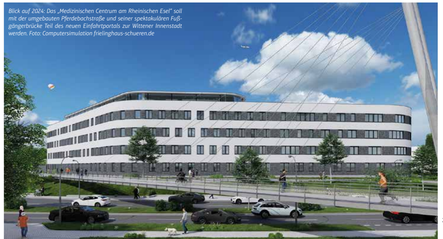
Blick auf 2024: Das „Medizinische Centrum am Rheinischen Esel“ soll mit der umgebauten Pferdebachstraße und seiner spektakulären Fußgängerbrücke Teil des neuen Einfahrtportals zur Wittener Innenstadt werden. Foto: Computersimulation frielinghaus-schueren.de

Wie Yeghishe-Armin Guetsoyan von Frielinghaus Schüren informierte, liegt die Baugenehmigung für einen zweiten Komplex mit einer nutzbaren Fläche von 4.809 m 2 vor. Jeweils acht Büros und Praxen von im Mittel je 250 m 2 sollen Platz finden. „Bis zum Februar soll auch der Keller des Güterbahnhofs entfernt werden. Darauf entsteht der Unterbau für das neue Gebäude“, so Yeghishe-Armin Guetsoyan im Gespräch mit Image. Einmal fertig, wird auf den ersten Blick nicht mehr zu erkennen sein, dass es sich um zwei Gebäudeeinheiten handelt. „Die Gespräche mit Interessenten laufen, der Zeitplan sieht vor, dass die geplante Fertigstellung des Gebäudes im 1. Quartal 2024 sein soll.“ dx