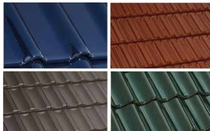
Dachziegel aus Ton gibt es in den verschiedensten Farben und Formaten. Wegen ihrer langen Lebensdauer gelten sie ohnehin schon als nachhaltiger Baustoff. Wieviel CO 2 bei der Produktion entsteht, ist aber von Hersteller zu Hersteller verschieden. Wer als Bauherr die Umwelt entlasten möchte, sollte nachfragen. txn Fotos: Laumans/txn

So wird es für Bauherren relativ einfach, den eigenen ökologischen Fußabdruck zu verringern und aktiv einen Beitrag zum Erhalt der Umwelt zu leisten. txn