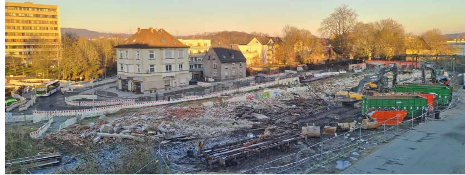
Widerstand war zwecklos: in nicht mal zwei Tagen machten Bagger den ehemaligen Güterbahnhof Witten-Ost dem Erdboden gleich. Foto: Dix

wikipedia.de/sz-magazin.sueddeutsche.de/dx