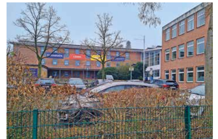
Die ehemalige Overbergschule wird vorübergehend zum Standort der neuen Otto-Schott-Gesamtschule.

über eine angemessene, zweckorientierte Ausstattung verfügen und vollständig digital vernetzt sein. Der Unterricht braucht deshalb nicht mehr in einer bestimmten Klasse stattzufinden, weil ein umfassendes schulisches WLAN und eine entsprechende Netzwerkstruktur einen raumunabhängigen Zugriff auf zentrale Medien und Internet-/Cloudangebote ermöglichen soll.