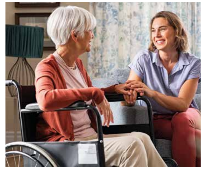
In der Tagespflege oder zuhause mit hauswirtschaftlichen Kräften können Senioren Gemeinschaft und Beschäftigung erleben. In der Demenz-WG finden Menschen mit demenzbedingten Funktionsstörungen einen erfüllten Lebensabend.

Ab 2022 werden die Leistungen für die Kurzzeitpflege erhöht. Bisher gab es maximal 1612 Euro im Kalenderjahr. Jetzt werden es zehn Prozent mehr sein - maximal 1774 Euro. Das Pflegegeld steigt allerdings nicht. Ziel des Gesetzgebers ist es, die Pflege zuhause besser auszustatten und die pflegenden Angehörigen zu entlasten. Eine solche Entlastung ist auch durch Angebote aus der Tagespflege zu erreichen. Dabei wird der pflegebedürftige Mensch mehrere Stunden pro Tag in