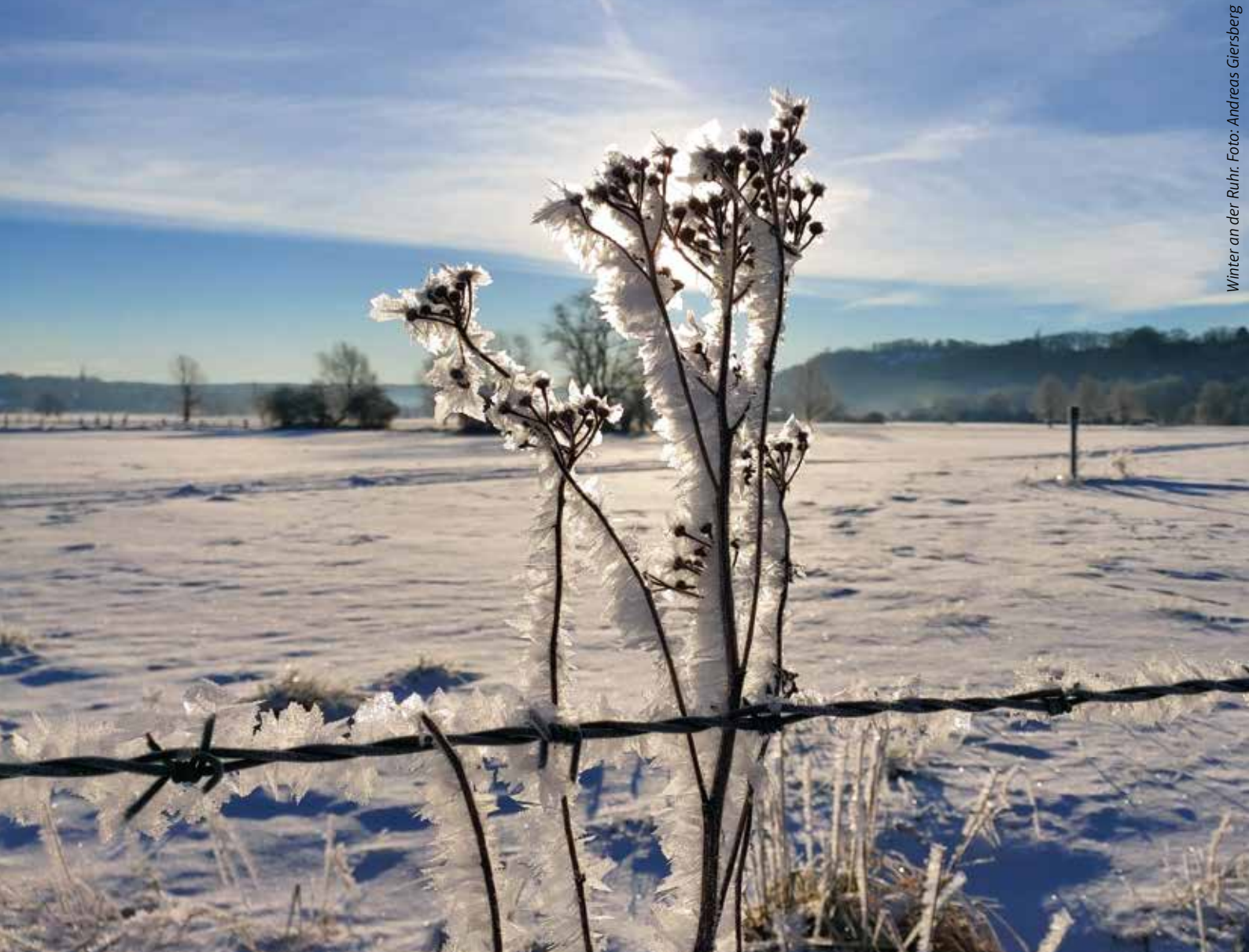
Winter an der Ruhr.

+++ 4 MONATSMAGAZINE: GESAMTAUFLAGE CA. 90.000 EXEMPLARE +++ HAUSHALTSVERTEILUNG +++ ☎ 02302 9838980 +++ WWW.IMAGE-WITTEN.DE +++