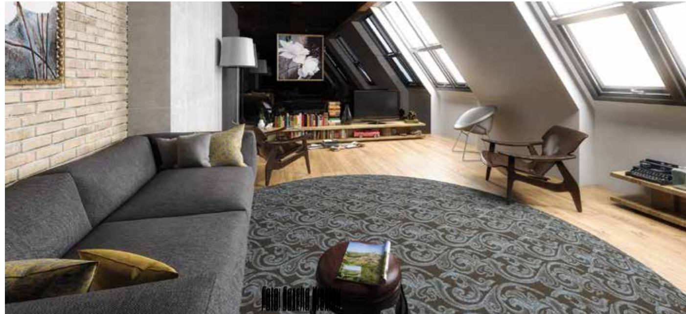
Eine ausreichend gute Wärmedämmung ist beim Dachausbau der erste Schritt. Nur so wird aus dem einstmaligen Steildachboden ein gut isolierter Wohnbereich mit Charme.