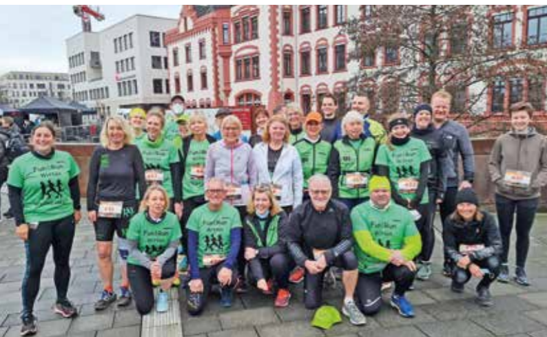
Silvester auf dem Hohenstein, am 2. Januar um den Dortmunder Phoenixsee – bei FunVorRun standen Spaß und Sport wieder ganz oben.

Bei regelmäßigen wöchentlichen Lauftreffs von Januar bis Dezember führten die Wege der vielen Freizeitsportler „ein Stündchen“ durch Wittens Natur. Zusätzlich würzten das erste Quartal drei Starts bei der Ruhrpott Winter-Challenge und nebenbei tanzten viele Aktive auf einem kleinen Video zum Song „Jerusalema“. Es folgten die Teilnahme beim 1. Wittener Kinder- und Familien-Ruhrlauf und dem eigenen Mittsommerlauf (Start um 5.16 Uhr) sowie die 16 km von der Jahrhunderthalle Bochum über die Erzbahntrasse zur Zeche Zollverein in Essen, die Starts beim Zwiebellauf in Witten und dem Sterntalerlauf in Herdecke bis zu Einzelstarts von Grönland über die Müritz bis Gran