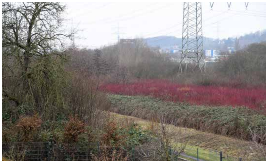
Der Grotenbach, Blick Richtung Rüdinghausen: Auch hier soll eine Neu- und Wiederansiedlung von Tier- und Pflanzenarten möglich gemacht werden.

Zum Emschersystem gehört auf Wittener Stadtgebiet unter anderem der Grotenbach. Für die Abwasserfreiheit wurde in Witten ein völlig neues unterirdisches Kanalsystem angelegt: sechs Kilometer lang, 7 Millionen Euro hat die Emscher Genossenschaft allein in den Kanalbau investiert. Insgesamt flossen in Witten rund 8 Millionen Euro in die Verbesserung der Lebens- und Aufenthaltsqualität durch den Emscherumbau. Pünktlich zum Jahresende 2021 erreichte die Emscher Genossenschaft die Abwasserfreiheit in der gesamten Emscher. Zum ersten Mal seit rund 170 Jahren fließt durch die Emscher kein Schmutzwasser mehr. Auch für