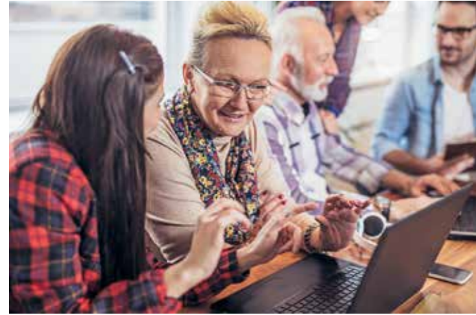
Wieder zurück auf die Schulbank: Senioren können sich noch für den „JuleA“-Kurs an der Holzkamp-Gesamtschule anmelden.

JuleA-Kurs an der Gesamtschule startet wieder