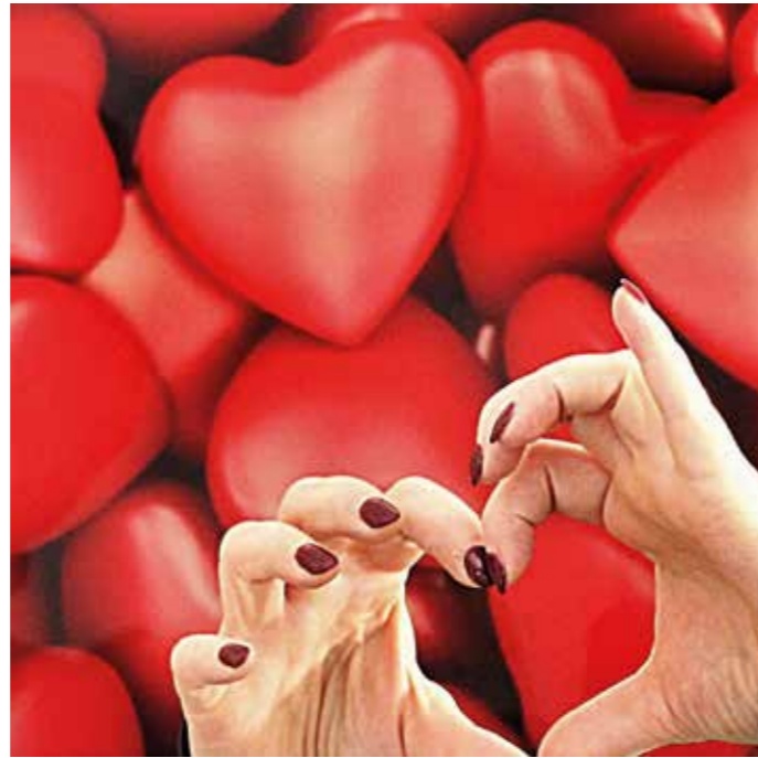
Der Valentinstag wird jedes Jahr am 14. Februar gefeiert und gilt als der Tag der Liebenden.

Neben Freundschaftskarten stehen auch Stofftiere oder Dessous hoch im Kurs. Und es gibt noch viel mehr Ideen: zum Beispiel ein schönes Abendessen in einem schicken Restaurant. Oder ein Ausflug an einen besonderen Ort. Der Brauch zum Schenken ist übrigens auch schon ziemlich alt und in vielen Kulturen zu finden. Schenken macht glücklich und ist ein Versuch, sich Freude und Freunde zu verschaffen. Wissenschaftler haben herausgefunden, dass Menschen mit einem Geschenk Freude und Akzeptanz beim Beschenken auslösen möchten. Die Forscher Yang & Urminsky (Psychological Science 29/2018) zeigen, dass Menschen bei der Geschenkauswahl auf eine starke Gefühlsreaktion des Beschenkten hoffen, diesen also überraschen möchten. Und bevor man jetzt auf den Gedanken kommt, Gutscheine oder Geldgeschenke könne man dann als Geschenk vergessen – so einfach ist das nicht. Denn wenn diese Geschenke witzig oder liebevoll präsentiert