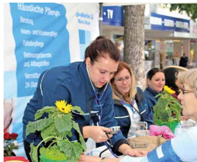
Auf Messen im Kreisgebiet sind die Anbieter der häuslichen Pflege gern zur Vorstellung unterwegs.