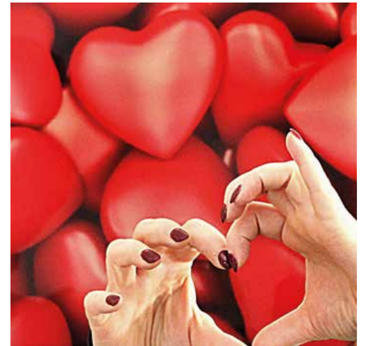
Der Valentinstag wird jedes Jahr am 14. Februar gefeiert und gilt als der Tag der Liebenden.

2017 gab es eine Studie an der Uni Lübeck. Im MRT konnte man bei