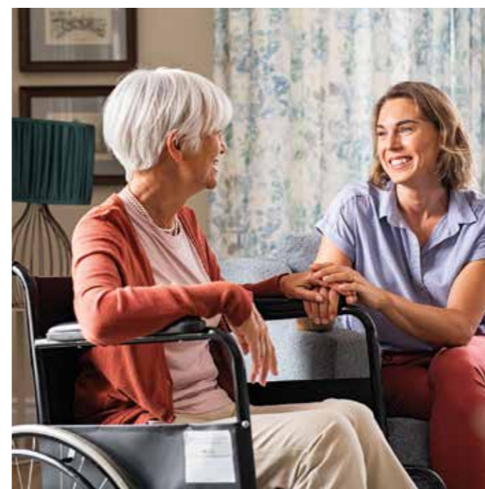
In der Tagespflege oder zuhause mit hauswirtschaftlichen Kräften können Senioren Gemeinschaft und Beschäftigung erleben. In der Demenz-WG finden Menschen mit demenzbedingten Funktionsstörungen einen erfüllten Lebensabend.

klassischen stationären Unterbringung ist eine Demenz-Wohngemeinschaft. Diese Einrichtungen gibt es mittlerweile in vielen Städten. Jeder Bewohner hat ein eigenes Zimmer, oft mit einem eigenen Badezimmer. Wohnküche und Gemeinschaftsräume stellen in einer familiären Atmosphäre das Herzstück einer solchen Wohngemeinschaft dar. Der Personalschlüssel garantiert eine Rundum-Betreuung, ermöglicht aber eben auch ein weitgehend selbstbestimmtes Leben für die Betroffenen. Nach der Demenz-WG in der Hattinger Südstadt hat die hwg beispielsweise in diesem Jahr im Stadtteil Holthausen zwei weitere Demenz-Wohngemeinschaften und acht Service-Wohnungen realisiert. Die Prognose für die Zukunft ist unstrittig: Immer mehr Menschen werden auf Hilfe im Alter angewiesen sein. anja