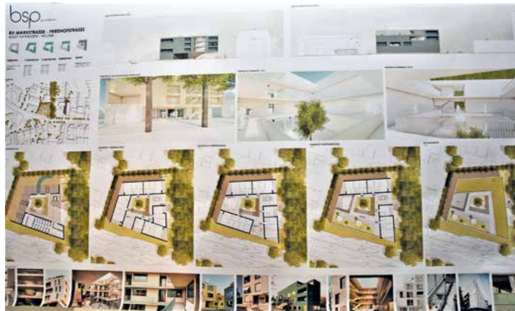
Wenn sich die Stadt Hattingen und die Politik für eine Bebauung am Friedhofsweg entscheiden, hat die Gartenstadt Hüttenau Interesse an dem Gelände bekundet. Würde sie Eigentümer des Grundstücks, könnte dort ein neuer sozialpflegerischer Standort für den Ortsteil Welper entstehen mit Demenzwohneinheiten und einer Tagespflege. Vor dem Hintergrund von bezahlbarem Wohnraum soll das Wohnprojekt dann als geförderter Wohnungsbau entstehen. Erste Pläne gibt es.

An der Ecke Marxstraße/Friedhofsweg in Welper befindet sich eine private Grünfläche mit einem Silberhorn darauf. Geht es nach dem Eigentümer und der Stadt Hattingen, soll diese Fläche im Rahmen einer Nachverdichtung bebaut werden. Entstehen soll hier bezahlbarer Wohnraum. Die Gartenstadt Hüttenau hat ihr Interesse bekundet, im Falle einer positiven Entscheidung von Stadt und Politik das Grundstück zu erwerben und auf der Basis von gefördertem Wohnungsbau hier einen neuen sozialpflegerischen Standort mit Demenzwohneinheiten und Tagespflege errichten zu wollen. Während die angrenzende und unter Denkmalschutz stehende Platanenallee in jedem Fall erhalten bleibt,