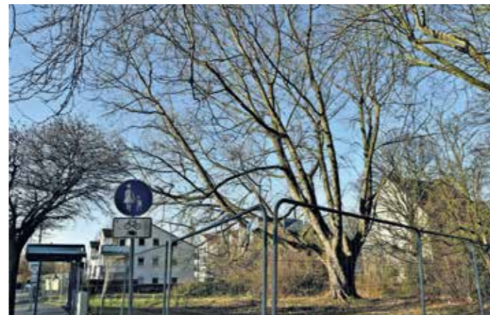
Entsteht hier Wohnraum, kann der Silberhorn nicht erhalten werden. Laut Gutachterlage sieht man akuten Handlungsbedarf, weil der Baum auseinanderbrechen könnte. Vor dem Hintergrund der Verkehrssicherheit wurde die Fläche eingezäunt.

insbesondere für im Stadtteil an Demenz erkrankte Menschen. Wenn sich das Projekt realisiert, haben wir bei der Bebauung einen Innenhof, ein Atrium, vorgesehen, welches natürlich begrünt werden soll. Und auch ein Baum wird hier seinen Platz finden.“ Das Engagement für Natur, Bäume und alte Gebäude, findet Roland Himmel aber gut. „Es zeigt doch, dass sich die Menschen um ihren Stadtteil kümmern und sich mit ihm identifizieren. Dieses bürgerschaftliche Engagement sollte wertgeschätzt und ernstgenommen werden. Dann werden Entscheidungen auch nachvollziehbar.“ anja