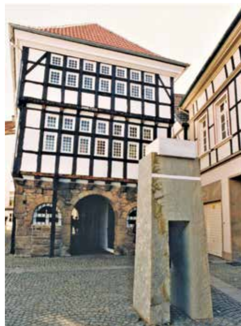
Das Hattinger Heggertor, eines der fünf Stadttore, wurde „Wächter“ genannt. Drei Jahre stand er am Alten Rathaus, bevor er 1996 zur Heggerstraße an den Ort des mittelalterlichen Nordtores, umgesetzt wurde. Nach 25 Jahren ramnte ihn am 27. April 2021 ein Lastwagen und zerstörte ihn. Jetzt soll eine Kopie entstehen.

Fünf feste Stadttore - Bruchtor, Weiltor, Heggertor, Holschentor und Steinhagentor - schützten im 16. Jahrhundert die Stadt Hattingen. Im 19. Jahrhundert wurden die baufälligen Tore abgebrochen und mit ihren Steinen die städtischen Wege gepflastert. In der Neuzeit entstand die Idee, die alten Stadttore durch moderne Kunst neu abzubilden. Es sind dies für das Heggertor „Der Wächter“ (1996, Jan Koblasa), das Steinhagentor (Voré, 2003), das Holschentor „Engel ante Portas“ (2010, Urs Dickerhof), das Bruchtor „Tor des Glücks“ (Marcello Morandini, 2010) und das Weiltor (2015, Augusti Roqué).