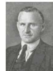
Carl F. Goerdeler (1884-1945)