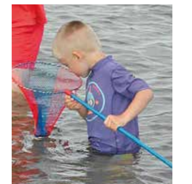
Wer in Nordrhein-Westfalen fischen möchte, muss Inhaber eines Fischereischeins sein.

ist 13 Jahre. Im schriftlichen Teil müssen die Prüflinge jeweils zehn Fragen aus sechs Prüfungsgebieten beantworten. Hierzu zählen beispielsweise allgemeine Fischkunde, Natur- und Tierenschutz sowie Gesetzeskunde. Im praktischen Teil gilt es, die Angelgeräte waidgerecht zusammenzustellen. Nachzuweisen sind ausreichende Kenntnisse über die heimischen Fische, Neunaugen und Krebse. Weitere Infos im Schwelmer Kreishaus. Tel.: 02336/93 2428. pen