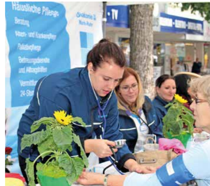
Auf Messen im Kreisgebiet sind die Anbieter der häuslichen Pflege gern zur Vorstellung unterwegs.

klassischen stationären Unterbringung ist eine Demenz-Wohngemeinschaft. Diese Einrichtungen gibt es mittlerweile in vielen Städten. Jeder Bewohner hat ein eigenes Zimmer, oft mit einem eigenen Badezimmer. Wohnküche und Gemeinschaftsräume stellen in einer familiären Atmosphäre das Herzstück einer solchen Wohngemeinschaft dar. Der Personalschlüssel garantiert eine Rundum-Betreuung, ermöglicht aber eben auch ein weitgehend selbstbestimmtes Leben für die Betroffenen. Nach der Demenz-WG in der Hattinger Südstadt hat die hwg beispielsweise in diesem Jahr im Stadtteil Holthausen zwei weitere Demenz-Wohngemeinschaften und acht Service-Wohnungen realisiert. Die Prognose für die Zukunft ist unstrittig: Immer mehr Menschen werden auf Hilfe im Alter angewiesen sein. anja