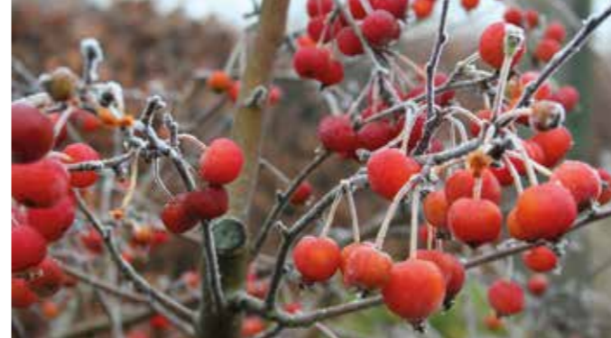
Schön und nützlich zugleich: Beerensträucher bieten Vögeln dann Nahrung, wenn diese im Winter knapp wird.