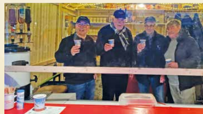
Hinter Plexiglas wartet das Team des Herbderer Glühweintreffs auf Gäste.

Am 27. November war es wieder soweit: Eingangs der Meesmannstraße floss endlich wieder der erste Glühwein in die Tassen des Herbderer Glühweintreffs. Mit der Eröffnung wurde auch die Weihnachtsbeleuchtung eingeschaltet und erneut zwanzig kleine Tannenbäume aufgestellt. Damit die Tannenbäume auch nach „Weihnachtsbaum“ aussehen, konnten sie nicht nur von Schulen und Kindergärten, sondern auch von „bastelbegeisterten“ Privatleuten mit Christbaumkugeln, Lametta und selbstgefertigtem Weihnachtsschmuck nach