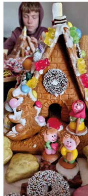
Hänsel und Gretel stehen im Vorgarten des Hexenhauses.

„Ich bin bald fertig“, kommt es von allen Seiten. Genau betrachtet sind aber noch einige Lücken, die ruhig noch mit mehr Leckereien aufgefüllt werden sollten. Schließlich soll doch der Rest der Familie auch etwas davon haben. tas