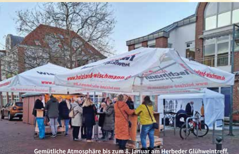
Gemütliche Atmosphäre bis zum 8. Januar am Herbderer Glühweintreff.

eigenen Vorstellungen behängt werden. Ein großer ausgewachsener Weihnachtsbaum bekam seinen Platz vor der Sparkasse. Das ehrenamtlich tätige „Glühweinteam“ sorgt seitdem in zwei Schichten dafür, dass das weihnachtliche Kultgetränk täglich von 18 bis 21 Uhr getrunken werden kann. Sonntags wird der Schankhahn sogar schon um 17 Uhr aufgedreht. Kleine Attraktionen, wie die Auftritte der „Nachtwächter“ am Eröffnung- und Schlußtag und der „Echten Freunde“ am 18. Dezember, lockerten das Angebot zusätzlich auf.