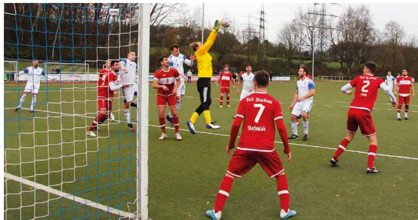
Das Spitzenspiel zwischen Tabellenführer TuS Stockum II und dem Tabellendritten TuS Heven 09 II in der Kreisliga B am 5.12.2021 endete 1:1.