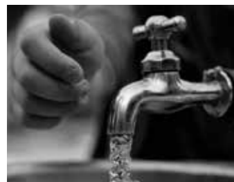
Zukünftig berechnen die Stadtwerke keine Kosten mehr für den Wasserzähler. Ein sparsamer Wasserverbrauch zahlt sich aus.

Die Berechnung der Wassergebühren hing bisher an der Menge der verbrauchten Kubikmeter und dem Grundpreis für den Wasserzähler. Letzterem lag ein maximaler Verbrauch von 2,5 Kubikmeter Wasser in der Stunde zugrunde – und an der reinen Kapazität knüpfte sich auch der Preis. Egal also, ob der Stadtwerke-Kunde sparsam oder verschwenderisch mit seinem Wasser umging, die Kosten für den Wasserzähler blieben fix, also unabhängig vom Verbrauch. Zukünftig stellen die