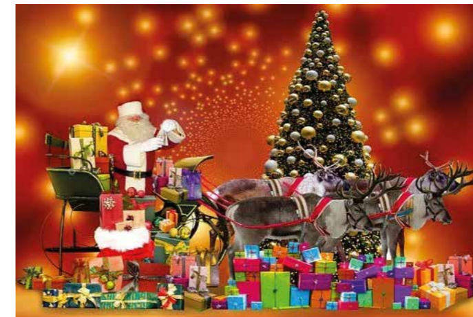
So kann das Weihnachtsfest harmonisch verlaufen.

Weihnachten, das Fest der Liebe, ist statistisch gesehen leider nicht selten ein Fest des Streites. Da hilft es auch nichts, wenn die zweite Strophe von „Leise rieselt der Schnee“ vorgibt „...still schweigt Kummer und Harm...“ Die stressauslösenden Gründe überraschen nicht: Hektik und Stress gerade an den Tagen vor den besinnlichen Tagen machen die Menschen nicht selten nervös und gereizt. Stellt sich dann nicht die ersehnte Romantik an den Festtagen ein, folgen Frust und Enttäuschung. Auch die ungewohnte Nähe auf engem Raum mit der Familie und der vielleicht nicht so geliebten Verwandtschaft legt da schon mal die Nerven blank.