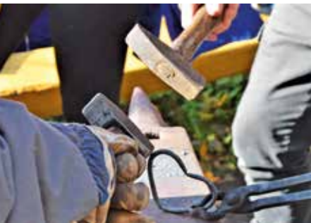
Die meisten Jugendlichen wollten ein Herz schmieden.

In der historischen Sehenswürdigkeit mit Zechenschmiede legten die Jugendlichen selbst Hand an und schmiedeten sich zur Erinnerung ein Herz. „Wir finden, es ist ein tolles Projekt zwischen Alt und Jung. Uns ist der Kontakt gerade zu jungen Leuten besonders wichtig, um ihnen einen Einblick in die Geschichte ihrer Heimat zu vermitteln.“ Für die Jugendlichen ein ganz besonderer Schultag bei herrlichstem Herbstwetter. anja