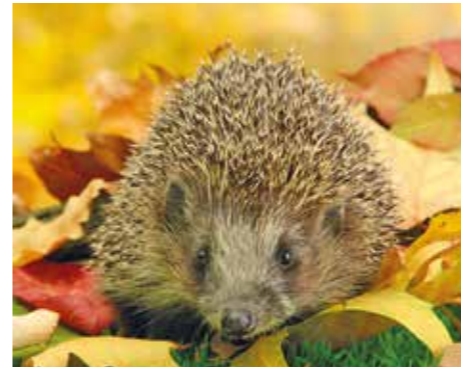
Ein Igelhaus hilft dem stacheligen Nützling beim Überwintern. Da der Igel sehr gern Schnecken und andere Schädlinge frisst, ist das kleine Holzhaus ein aktiver Beitrag zum biologischen Pflanzenschutz.

Igel sehen nicht nur niedlich aus, sondern sind echte Nützlinge im Garten. Auf ihrem Speiseplan stehen neben Fallobst diverse schädliche Insekten und Schnecken, auch junge Mäuse sind vor ihnen nicht sicher. Sobald die Temperaturen bis zum Nullpunkt sinken, gehen Igel in den Winterschlaf. Als Unterkunft nutzen sie am liebsten geschützte Laub- oder Reisighaufen – ein naturnaher Garten ist der ideale Lebensraum. Wer es im Garten gern aufgeräumt mag, kann die stacheligen Insektenfresser dennoch zum Überwintern anlocken – mit einem Igelhaus. Das sinnvolle Winterquartier gibt es als Bausatz in Bau- und Gartenmärkten. Das WildgärtnerFreude Igelhaus von Neudorff lässt sich einfach mit dem mitgelieferten Werkzeug aufbauen. Es hat ein abnehmbares Dach und wird aus zertifiziertem Holz aus nachhaltiger Forstwirtschaft hergestellt. Der verwinkelte Eingang verhindert, dass