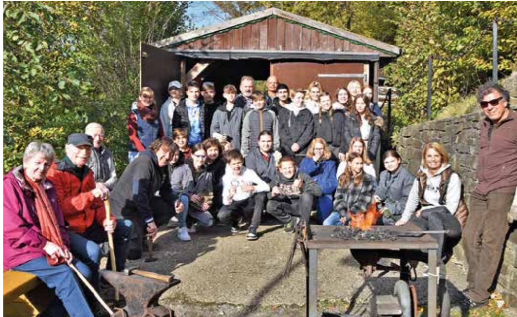
Die Schüler und Schülerinnen der Klasse 8c der Wilhelm-Kraft-Gesamtschule mit Mitgliedern des Heimatvereines Sprockhövel und den helfenden Händen an der Schmiede am Bethaus.

„Die damalige 7c, heute die 8c, und wir als Heimatverein haben kurz vor Ausbruch der Corona-Pandemie eine Aktion mit unseren historischen Küchen- und Werkzeugen gemacht. Gemeinsam haben wir geschaut,