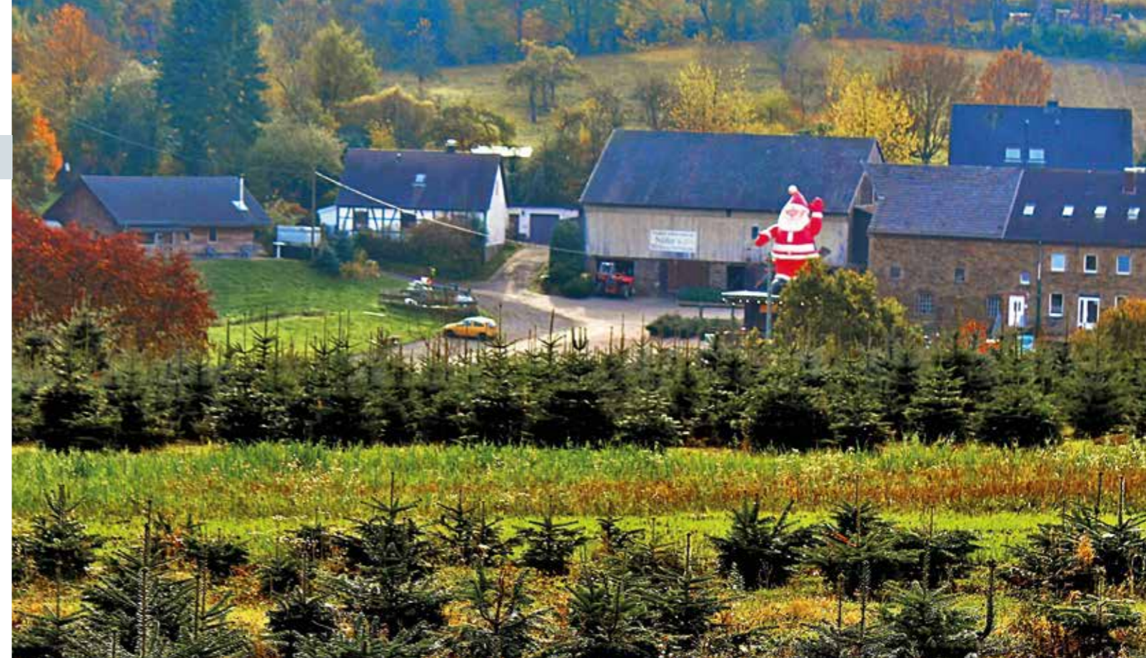
Der Hof der Familie Nüfer in der Elfringhauser Schweiz, in der Porbecke 10. An den Adventswochenenden kann man hier von 10 bis 16 Uhr Getränke und Speisen zum Mitnehmen einkaufen. Ein großer roter Nikolaus weist den Besuchern den richtigen Weg. Alle Schonungen sind ab dem 4. Dezember geöffnet und vom Hof fußläufig zu erreichen.