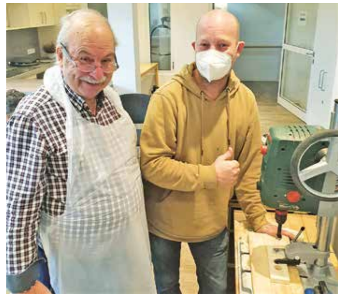
Die Mobile Werkbank kommt bei den Senioren gut an - wie hier im Mathias-Claudius-Haus in Sprockhövel. Die Volksbank und der Förderverein machen das Projekt für die Senioren möglich.