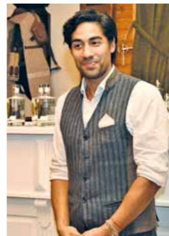
Gemixt wurde der Gin in verschiedenen Varianten von Barkeeper Nic Shanker, bekannt aus der Vox-Fernsehserie „First Dates“.

gen dem Genießer die fruchtigen Geschmacksnerven Afrikas auf der Zunge. anja