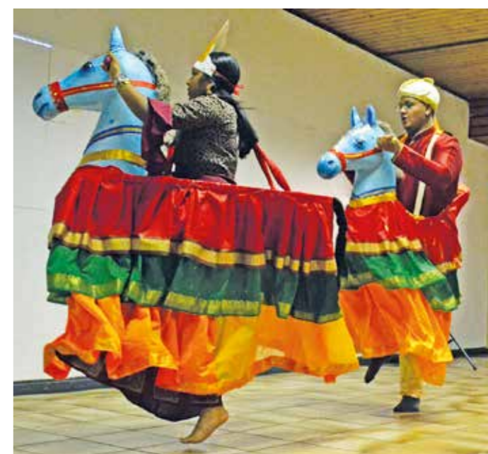
Pferdetanz Sri Lanka

Mittelstraße 29 • 45549 Sprockhövel • ☎ 0 23 39/12 12 30 Öffnungszeiten: Montag–Freitag 10.00–18.30 Uhr, Samstag 10.00–13.00 Uhr