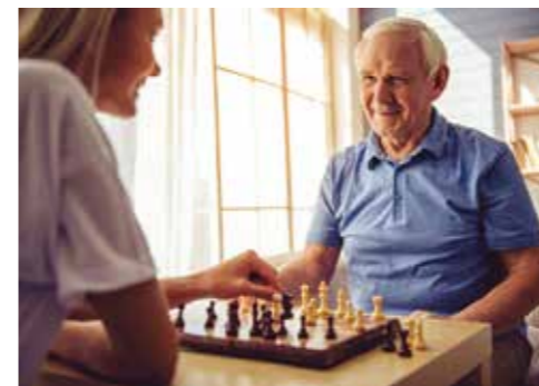
Eine gesunde Lebensweise kann helfen, auch im hohen Alter noch geistig fit und konzentriert zu sein.

Demenz ist nicht immer gleich Alzheimer. So ist die sogenannte vaskuläre Demenz mit einem Anteil von etwa 15 Prozent die zweithäufigste Demenzform in Deutschland. Sie entsteht durch Durchblutungsstörungen im Gehirn, deren Ursache oft eine Arteriosklerose ist, die zur Prävention vermieden werden sollte. Sie wird durch Bewegungsmangel, Übergewicht, hohe Blutfettwerte, Diabetes, Rauchen und Bluthochdruck begünstigt. Eine gesunde Lebensweise mit viel Bewegung, gesunder Ernährung und Nikotinverzicht ist ratsam. Auch eine gezielte Einnahme der Aminosäure Arginin, etwa in „Telcor Arginin plus“,