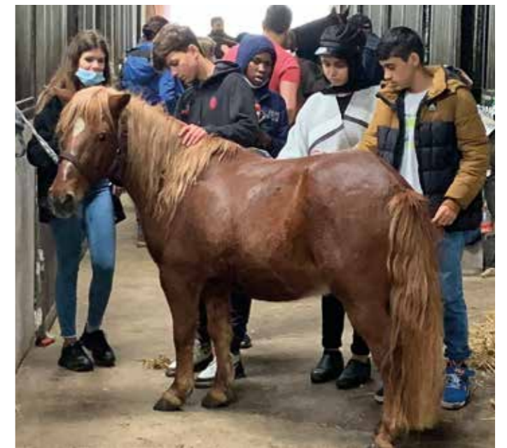
Pferde reiten und auch pflegen konnten die Kinder im Reiterhof.

und konzentriert die Möglichkeit, sich beim Klettern auszuprobieren. Alle Ausflüge fanden mit dem Linienbus statt, eine praktische Übung zum Thema öffentlicher Nahverkehr.