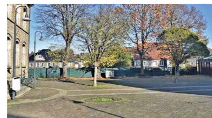
Hier auf dem Vorplatz vom Bürgerbüro in Niedersprockhövel soll der Markt für vorweihnachtliche Stimmung sorgen.