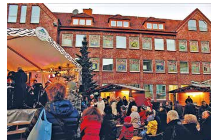
Bunte Bilder von Sprockhöveler Kindern schmücken im Advent die Fenster der Sparkasse. In vielen Jahren gab es an manchen Tagen auch ein kleines Bühnenprogramm auf dem Vorplatz, organisiert vom Stadtmarketing Sprockhövel.