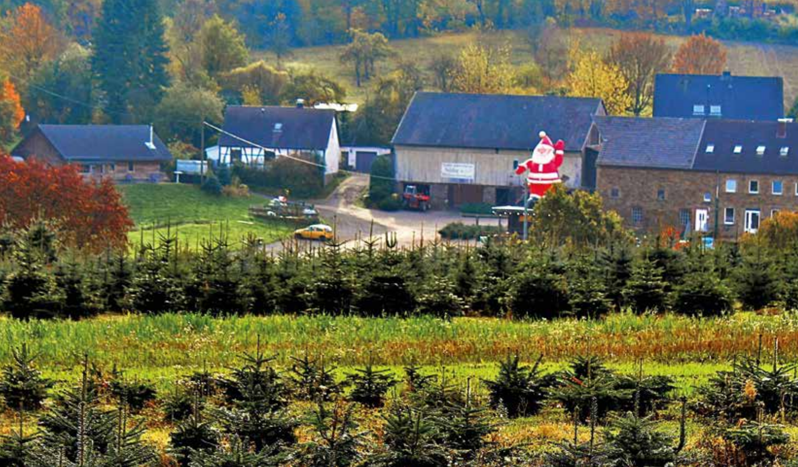
Der Hof der Familie Nüfer in der Elfringhauser Schweiz, In der Porbecke 10. An den Adventswochenenden kann man hier von 10 bis 16 Uhr Getränke und Speisen zum Mitnehmen einkaufen. Ein großer roter Nikolaus weist den Besuchern den richtigen Weg. Alle Schonungen sind ab dem 4. Dezember geöffnet und vom Hof fußläufig zu erreichen.