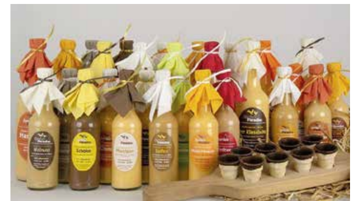
Regale voller regionaler Köstlichkeiten.

In den vergangenen 5 Jahren fanden immer wieder Erneuerungen und Umstrukturierungen statt. Leider musste der langjährige leckere Party-Service im März des Jahres 2020 eingestellt werden, es war arbeitstechnisch und auch gesundheitlich nicht mehr zu schaffen. Die Obst- und Gemüseetheke mit dem Biobereich hat ein neues Erscheinungsbild bekommen. Regelmäßige Verkostungen unterschiedlicher Produkte sowie Aktionen (zuletzt das große Kürbisschnitzen) finden immer wieder statt.