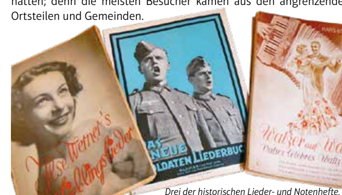
Drei der historischen Lieder- und Notenhefte.