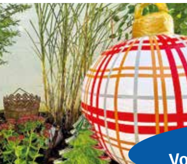
Dezembermotiv aus dem Bildkalender 2022 „Die Ruhr – unser Fluss bei Witten, Bochum und Hattingen“ von Uli Auffermann

Gewinnen Sie Ihren Weihnachtsbaum, s. Seite 34!