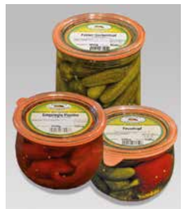
Ob bio, vegan oder Spezialitäten, Sie finden es im Edeka Markt Grütter.