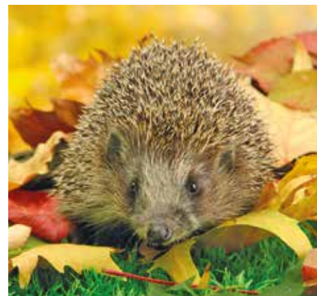
Ein Igelhaus hilft dem stacheligen Nützling beim Überwintern. Da der Igel sehr gern Schnecken und andere Schädlinge frisst, ist das kleine Holzhaus ein aktiver Beitrag zum biologischen Pflanzenschutz.

Igel sehen nicht nur niedlich aus, sondern sind echte Nützlinge im Garten. Auf ihrem Speiseplan stehen neben Fallobst diverse schädliche Insekten und Schnecken, auch junge Mäuse sind vor ihnen nicht sicher. Sobald die Temperaturen bis zum Nullpunkt sinken, gehen Igel in den Winterschlaf. Als Unterkunft nutzen sie am liebsten geschützte Laub- oder Reisighaufen - ein naturnaher Garten ist der ideale Lebensraum. Wer es im Garten gern aufgeräumt mag, kann die stacheligen Insektenfresser dennoch zum Überwintern anlocken - mit einem Igelhaus. Das sinnvolle Winterquartier gibt es als Bausatz in Bau- und Gartenmärkten. Das WildgärtnerFreude Igelhaus von Neudorff lässt sich einfach mit dem mitgelieferten Werkzeug aufbauen. Es hat ein abnehmbares Dach und wird aus zertifiziertem Holz aus nachhaltiger Forstwirtschaft hergestellt. Der verwinkelte Eingang verhindert, dass beispielsweise Katzen den Igel im Winterschlaf stören. Optimaler Standort für das vom NABU (Naturschutzbund Deutschland) empfohlene Igelhaus ist ein ruhiger, schattiger Platz unter einer Hecke oder einem Strauch. Das Haus dann noch mit etwas Laub befüllen und während des Winters weder öffnen noch umstellen.