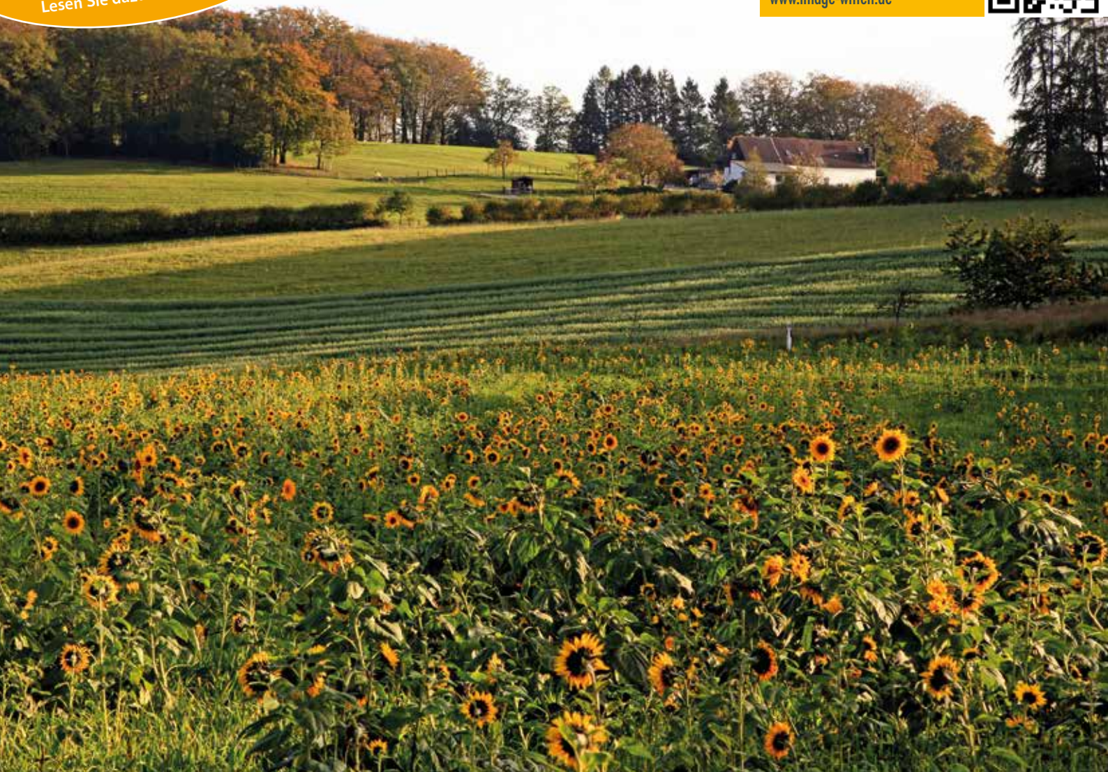
Herbstlandschaft zwischen Laaker Weg und Höhenweg, Kalender 2022 Elfringhauser Schweiz