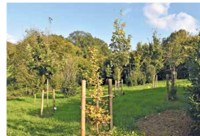
Gerade in den letzten sechs Jahren haben viele Menschen den Wunsch, unter einem Baum bestattet zu werden. Auf dem Elfringhauser Friedhof gibt es für Urnenbestattungen diese Möglichkeit - in der Regel drei Urnen pro Baum.