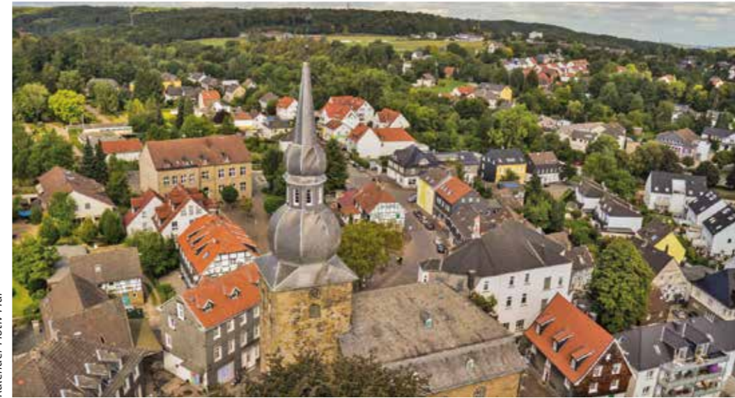
Kalender Motiv Mai

Die Sanierung der denkmalgeschützten Zwiebelturmkirche bleibt Aufgabe und Sorgenkind der Evangelischen Kirchengemeinde Bredenscheid-Sprockhövel. Der Kirchturm wurde bereits restauriert und neu verschiefert, im Jahr 2022 folgt das Kirchenschiff mit Dach und Dachstuhl. Diese beiden Maßnahmen kosten bereits über 1,2 Millionen Euro.