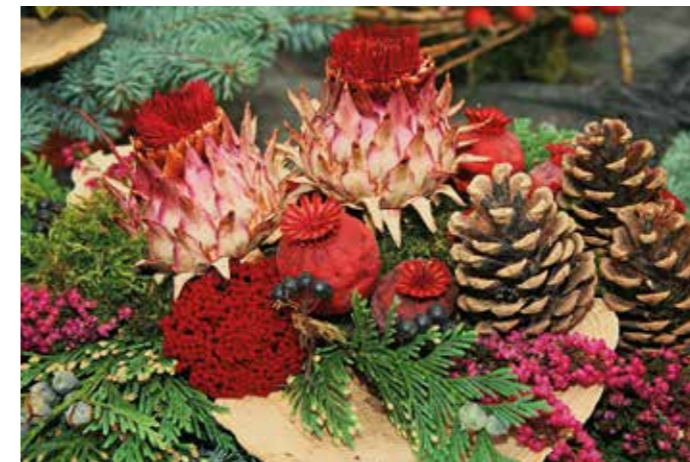
Blumen als Symbol der Trauer. Saisonal bedingt wird zu Allerheiligen, zum Volkstrauertag und Totensonntag Florales oft mit Tanne, Zapfen und Trockenblumen gestaltet. Auf diese Weise können zugleich Gräber abgedeckt und über die Wintermonate geschützt werden. Welche Formen und Farben man auch immer wählt – auf jeden Fall sind Trauer und das Gedenken an geliebte Menschen eng mit Blumen verbunden.

Viele Weihnachtsmärkte entzünden gerade aus Rücksicht auf den Totensonntag erst nach diesem Tag ihre Lichter.