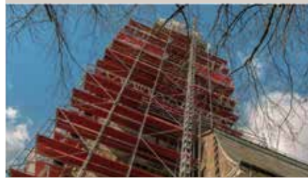
Kalender Motiv März