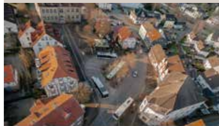
Kalender Motiv Titelblatt