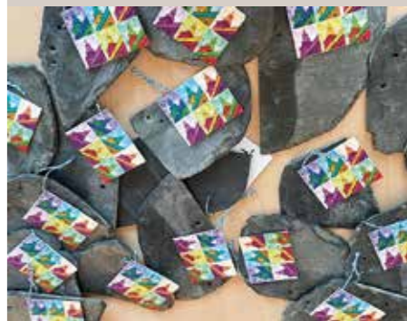
Dachschindel mit Zertifikat