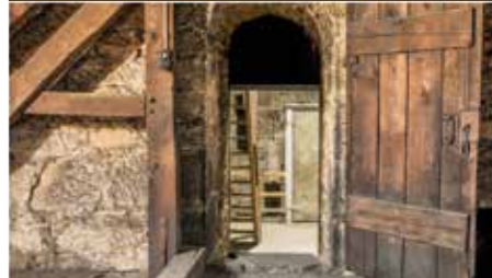
Kalender Motiv April

Ebenfalls ein besonders Geschenk sind alte gereinigte Dachschindeln vom Zwiebelturm mit Echtheitszertifikat, die sich je nach Größe sogar als Frühstücksbrettchen eignen. Diese können für je 15 Euro über das Gemeindebüro oder die Kreativothek bezogen werden. Die Kreativothek bietet außerdem gegen Aufpreis eine individuelle Gravur an. Wie wäre es etwa mit dem Taufvers oder Konfirmationspruch des oder der Beschenkten?