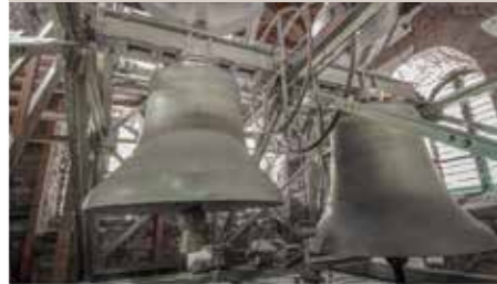
Kalender Motiv Januar