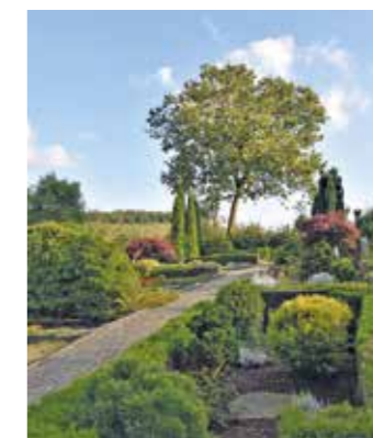
Idylle pur: die will der Verein unbedingt erhalten.

ebenfalls in die Erde, ein Kolumbarium gibt es nicht. Bestattet werden kann man auch unter einem der dreißig Bäume - ein beliebter Trend der letzten Jahre.