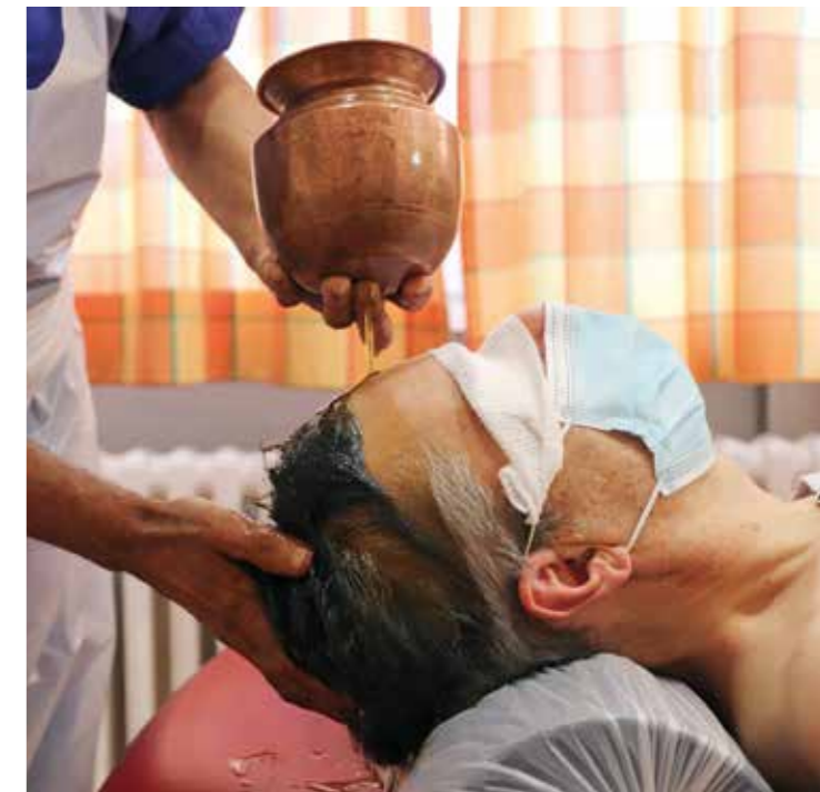
Der traditionelle Stirnölguss (Shirodhara) ist eine Maßnahme einer medizinischen Ayurveda-Therapie.