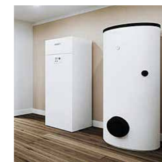
Eine moderne Wärmepumpe lässt sich für Heizung, Warmwasser und sogar für die Lüftung und Kühlung des Hauses nutzen.