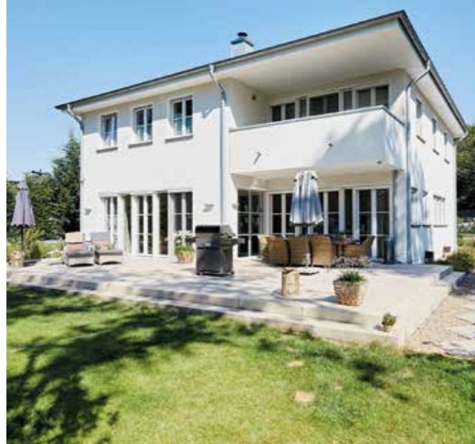
Die Fassade als Visitenkarte des Eigenheims hat zahlreiche Anforderungen zu erfüllen, ästhetisch ebenso wie in Sachen Energieeffizienz. Für die energetische Sanierung von Fassaden stellt der Staat großzügige Fördermittel bereit.