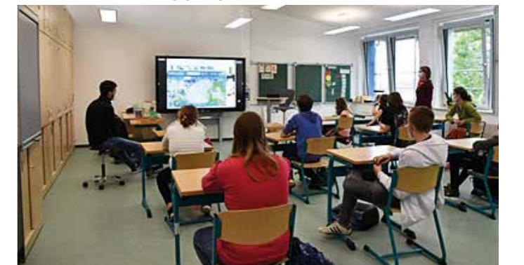
Alle Klassenzimmer sind mit interaktiven Displays ausgestattet. Magnetische Kreidetafeln werden ergänzend eingesetzt.

Für die weiteren Bauarbeiten wird keine Aufteilung auf zwei Standorte mehr nötig sein. Dass nun wieder alle in Witten lernen können, sei eine große Erleichterung, „sowohl für die Personalplanung als auch für das Gemeinschaftsgefühl“, so Luther. Fast zwei Jahre lang mit weniger Raum und weniger Material die sonderpädagogische Förderung aufrechtzuerhalten, sei sehr herausfordernd gewesen. Aber: „Kollegium, Lehrer, Eltern, Schüler und die Architekten der Kreisverwaltung – alle haben an einem Strang gezogen.“ Quelle: pen