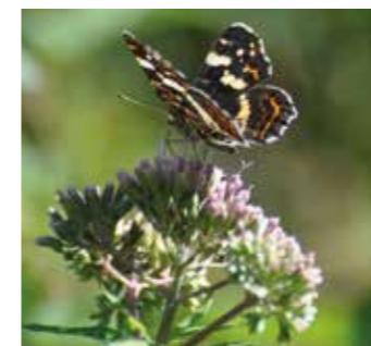
Schmetterlinge, wie dieses Landkärtchen, sind in diesem Jahr 2021 Mangelware und so selten wie noch nie.