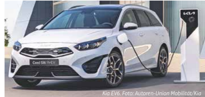
Kia EV6.