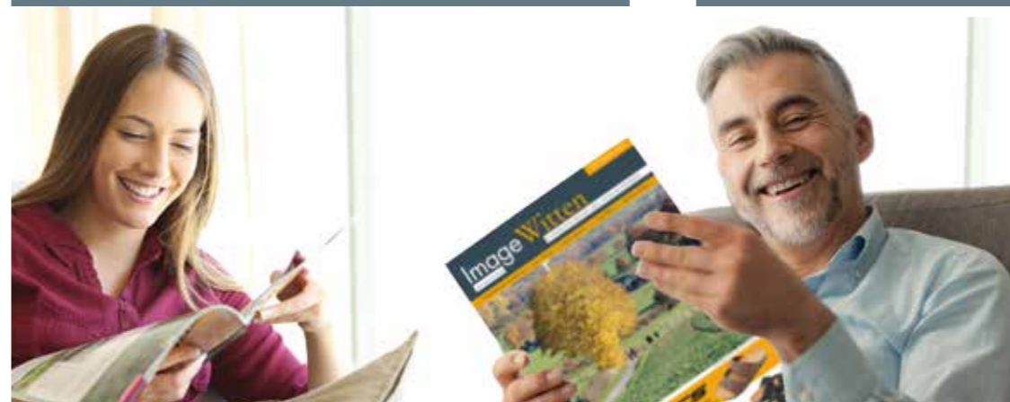
Image Aktuelle Termine finden Sie unter www.image-witten.de ☎ 02302 9838980