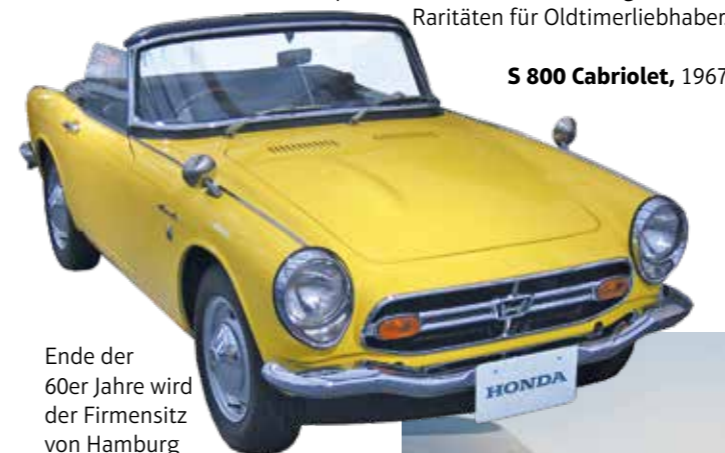
S 800 Cabriolet, 1967

1961 wird in Hamburg die European Honda Motor Trading Co. gegründet. Der erste japanische Importeur beginnt damit seine Aktivitäten in Deutschland. Kein anderer Fahrzeughersteller aus dem „Land der aufgehenden Sonne“ hatte sich bis dahin auf dem Kontinent niedergelassen. Der Vertriebsstart von Automobilen begann im Jahr 1967. Klein und clever. Mit dem Kleinwagen N360 beginnt die Erfolgsgeschichte von Honda im Automobilssektor. Dazu gehören auch die Modelle S 800 Cabriolet und Coupé. Heute sind die S-Modelle gesuchte Raritäten für Oldtimerliebhaber.