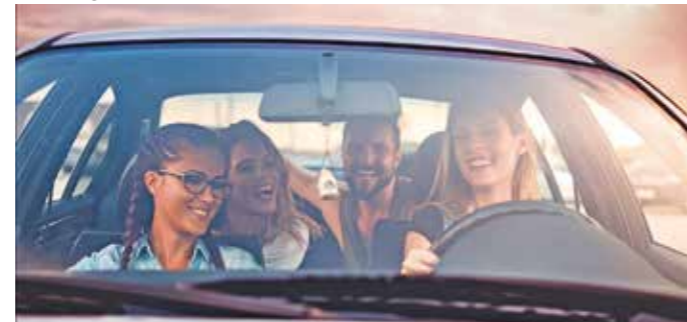
Werden Insassen verletzt, ist es gut, wenn der Fahrzeughalter eine Insassen-Schutzversicherung hat. Denn diese zahlt unabhängig von der Schuldfrage schnell die vereinbarten Leistungen - und zwar auch an die Person hinter dem Lenkrad.