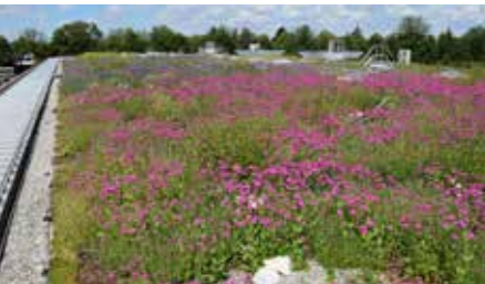
Im Jahr 2019 sind in Deutschland 7,2 Millionen Quadratmeter Dachbegrünung neu hinzugekommen.

Der Klimawandel ist da und damit immer häufiger auch sintflutartige Regenfälle und lokal begrenzte Unwetter. Werden die Dächer von Häusern begrünt, können sie wie ein Schwamm einen Großteil des Niederschlages zumindest temporär speichern. So gelangen die Wassermengen, die bei lang andauerndem Regen das Fassungsvermögen überschreiten, nur zu einem Teil und vor allem erst mit einer zeitlichen Verzögerung in das