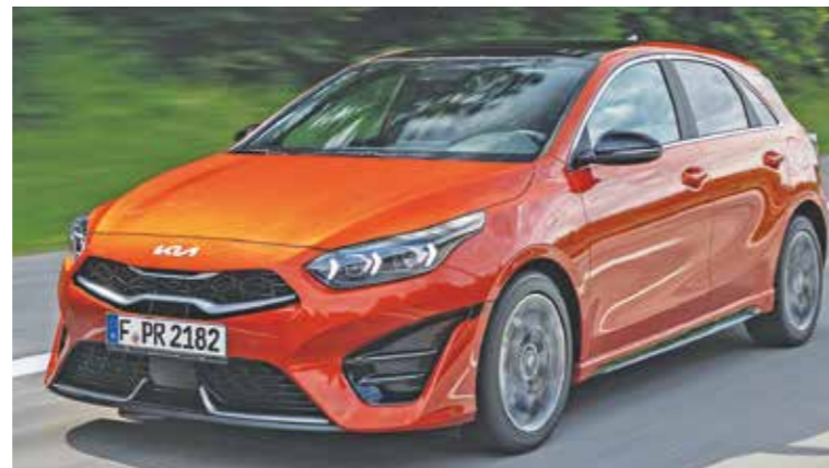
Kia Ceed GT Line.

Zu den Neuerungen im Interieur gehören schwarze Velourslederbezüge mit Nähten in Kontrastfarbe, die für die Versionen GT und GT Line angeboten werden. Insgesamt sind je nach Modellvariante und Ausführung acht verschiedene Sitzbezüge erhältlich, vier davon sind mit der Überarbeitung hinzugekommen. Bei den Sportversionen wurde zudem der Schaltknopf neu gestaltet, und der Wählhebel der Auto-