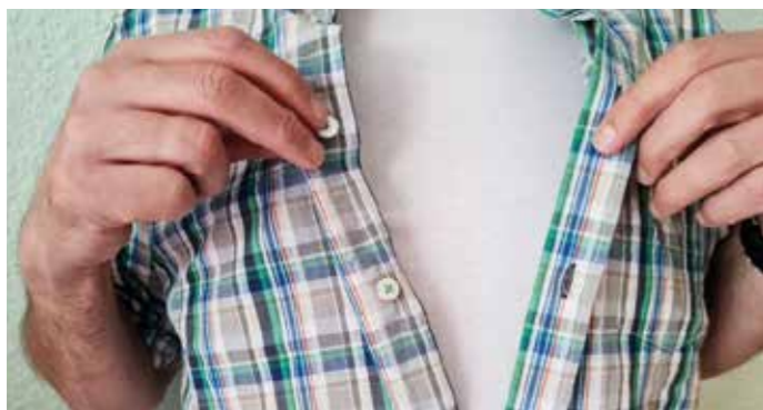
Die Knopfleiste bei Männer- und Frauen-Oberteilen unterscheidet sich – warum, lesen Sie in diesem Artikel.

Tief lässt auch eine weitere Knopf-Theorie blicken: üblicherweise führte der Herr die Dame seines Herzens an seiner rechten Seite. Klaffte nun ihre Bluse zwischen den Knöpfen ein Stückchen, blieb es nur ihm vorbehalten, den reizenden Einblick zu genießen. Was auch immer dazu beigetragen haben sollte, die Knopfzeilen unterschiedlich anzubringen, die Tradition hält sich bis heute. dx