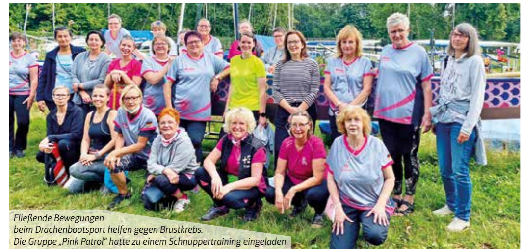
Fließende Bewegungen beim Drachenbootsport helfen gegen Brustkrebs. Die Gruppe „Pink Patrol“ hatte zu einem Schnuppertraining eingeladen.