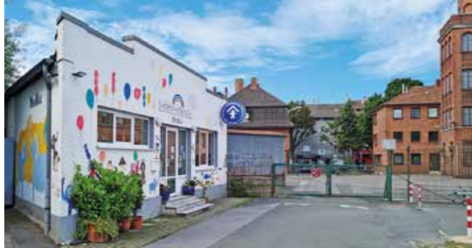
Seit 20 Jahren ist der Kinderschutzbund an der Konrad-Adenauer-Str. 17c zu finden. Jetzt wurde der Verein 40 Jahre alt.

Liebe Leser, die Sommerferien sind zu Ende! Das Sommerwetter war – na ja – mal so und mal so! Vier Monate noch bis Weihnachten – Starkregen und Überschwemmungen in einigen Teilen des Landes, die 4. Welle Corona – wie wird es uns im Herbst wohl ergehen? Fragen wir doch unsere Politiker! Am 26. September wählt Deutschland den neuen Kanzler oder vielleicht die neue Kanzlerin. Nach 16 Jahren tritt Angela Merkel nicht mehr an und geht in ihren wohlverdienten Ruhestand. Was erwarten die Bürger von ihrer neuen Regierung? Das Rennen wird knapp werden, gibt es eine große Koalition? Lesen Sie hierzu mehr im vorliegenden Image-Magazin, vielleicht bei einem Gläschen Wein mit der richtigen Temperatur – ein interessanter Text, in dem Sie Dinge erfahren, die Sie vielleicht noch nicht wussten. Die Kämpfenschule hat ihr modernisiertes Gebäude bezogen und die neue Tragfluthalle in Vormholz gleich einem riesigen Ufo, mehr dazu im Innenteil. Auf den Autoseiten präsentieren wir Ihnen Neuwagen von KIA und SKODA sowie 60 Jahre Honda mit großer Jubiläumsaktion. Naturfreundliches Gärtnern – lesen Sie hierzu aktuelle Tipps zur Gartengestaltung. Diese Themen und vieles mehr finden Sie im aktuellen Image-Magazin. Hoffen wir nun noch auf ein paar schöne Sommertage! Ihre Image-Redaktion