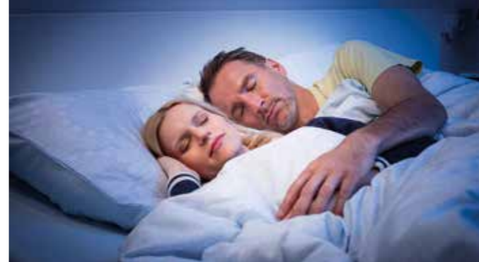
Smart-Home-Anlagen mit Gefahrenmeldefunktion senken die Erfolgsquote von Einbrechern und lassen Haus- und Wohnungsbesitzer ruhiger schlafen.