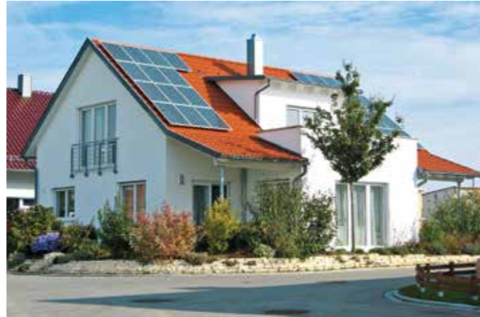
Solarstrom frei Haus: Immer mehr Hausbesitzer entscheiden sich für eine Fotovoltaikanlage.