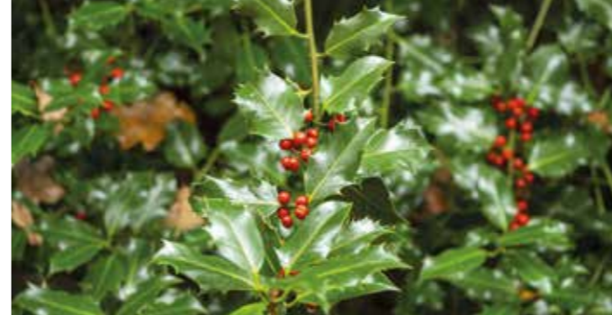
Die Stechpalme Ilex lässt sich am Hohenstein, aber auch in Hollywood finden.