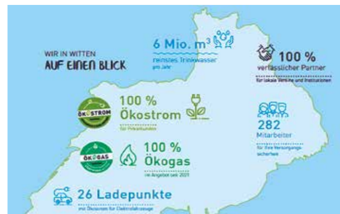
Die Grafiken im Bericht zeigen übersichtlich die Eckdaten der Stadtwerke-Nachhaltigkeit. Unterstützt durch Förderprogramme der Bundesregierung, wurden in Witten im Jahr 2020 mehr als doppelt so viele reine Elektrofahrzeuge angemeldet wie im Jahr davor.