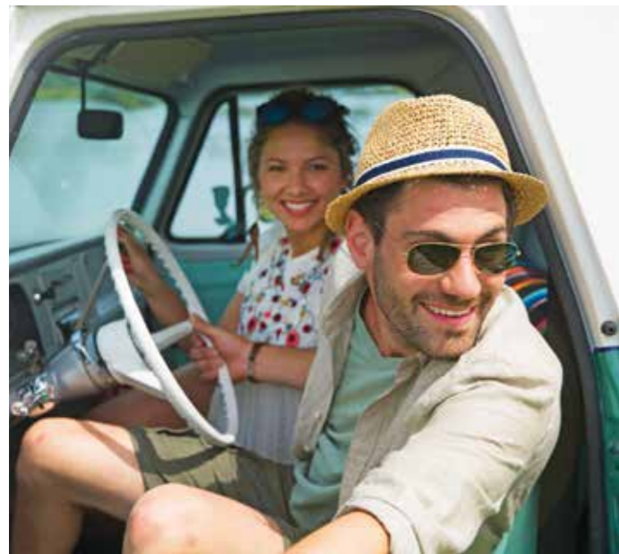
Mit dem eigenen Auto in den Urlaub starten: Dieser Trend dürfte sich auch 2021 fortsetzen. Ein gründlicher Fahrzeugcheck vor Abfahrt schützt vor Pannen.