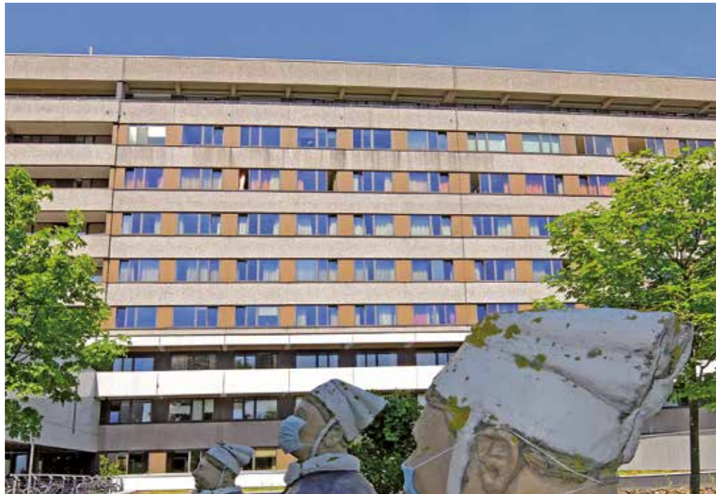
Während die Evangelische Krankenhausgemeinschaft Herne und Castrop-Rauxel, zu der auch das evangelische Krankenhaus an der Pferdebachstraße (Bild) gehört, auf dem Klinikgelände in Witten eine Psychiatrie errichten möchte, will ungeachtet dessen das Gemeinschaftskrankenhaus Herdecke in der ersten Julihälfte dieses Jahres die Versorgung der Wittener Psychiatriepatienten übernehmen.

Während das Vorhaben in der Bevölkerung auf Zustimmung trifft, lehnen das Land Nordrhein-Westfalen, der EN-Kreis und die Bezirksregierung Arnsberg die Pläne ab. Dabei hatte das Gesundheitsministerium eindeutig einen Bedarf für Witten in der psychiatrischen Grundversor-