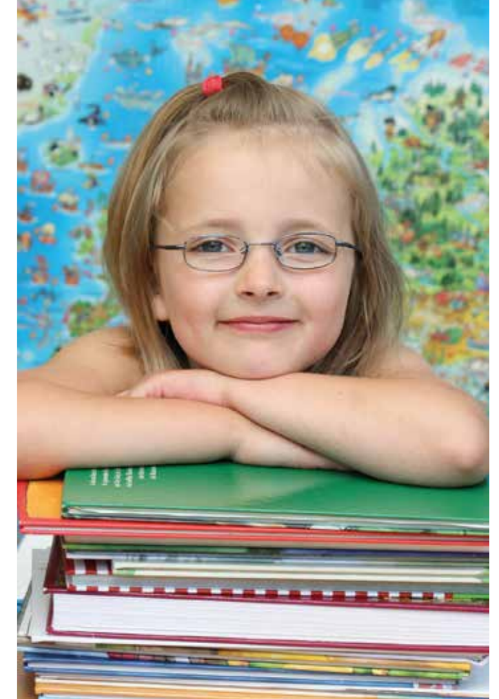
Gutes Sehen ist wichtig für die Informationsaufnahme in der Schule. Ob beispielsweise eine Brille erforderlich ist, können der Augenarzt oder der Orthoptist feststellen.