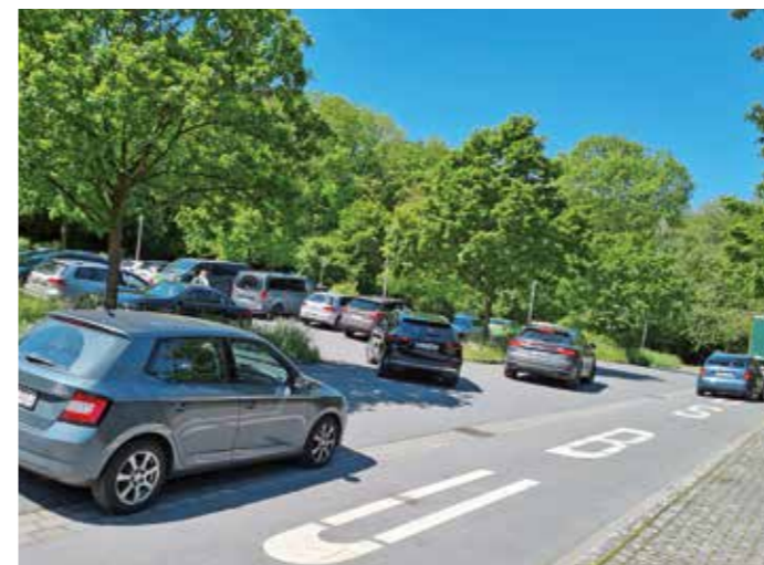
Nur mit Glück können Autofahrer ihr Fahrzeug sonntags von 12 Uhr an auf dem Besucherparkplatz an der Nachtigallstraße abstellen.