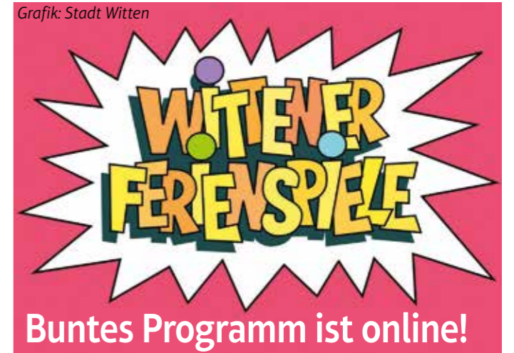
Grafik: Stadt Witten

Weil im vergangenen Schuljahr der Unterricht und damit die JeKits-Kinder unter der Pandemie leiden mussten, blieben die Gebühren für die „Weitermacher“, also die Kinder im 3. Schuljahr, auf dem Niveau wie im 2. Schuljahr. Das bedeutet 24 Euro monatlich für den Instrumentalunterricht und das Instrument, Tanzen kostet monatlich 17 Euro und Singen 12 Euro. Wenn Eltern staatliche Transferleistungen erhalten, ist der Unterricht kostenlos. Eltern können ihre Kinder ganz unkompliziert online anmelden. Das Musikschulteam hat auf seiner Internetseite www.musik-schule-witten.de schulbezogene Informationen anschaulich mit vielen Videos hinterlegt. Grenzen werden überwunden, wenn Kinder auf der türkischen Baglama mit Geigen oder Gitarren zusammen musizieren. Es werden Brücken über die verschiedensten Stilrichtungen von der Folklore über Jazz und Klassik bis zu den Hip-Hop-Tänzern geschlagen. Denn die Integration ist bei JeKits ein wichtiges Element. Das Programm läuft über die gesamte Grundschulzeit. Das Instrument ist immer eine kostenlose Leihgabe der Musikschule.