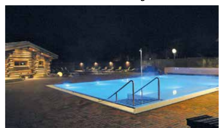
Das Solebecken lädt Sie zum entspannten Kurzurlaub ein!

Image bedankt sich für das interessante Gespräch und wünscht Ihnen für die Zukunft weiterhin viel Erfolg. UK