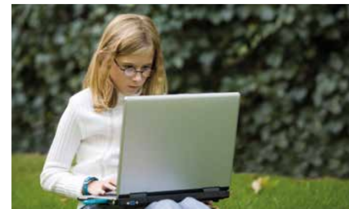
Die Anforderungen in der Schule sind hoch – und gerade jetzt verbringen Kinder beim Lernen viel Zeit am Laptop oder PC. Gutes Sehvermögen ist dabei besonders wichtig, um die Augen nicht zu überlasten.

Weitere Informationen finden Sie unter www.orthoptik.de im Patientenratgeber. akz-o