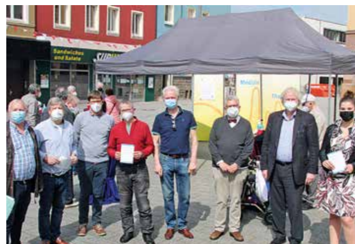
Die Unterstützer der Online-Petition „Psychiatrie in Witten für Witten“ sind erfreut, dass bei der Aktion mehr als 350 Unterschriften zusammengekommen sind.

Wer die Pläne einer eigenen „Psychiatrie in Witten für Witten“ befürwortet, kann die Online-Petition ( www.open-petition.de Stichwort Psychiatrie Witten) unterstützen. Handschriftlich ausgefüllte Unterschriftenzettel können zudem in allen Wittener Apotheken und Arztpraxen abgegeben werden.