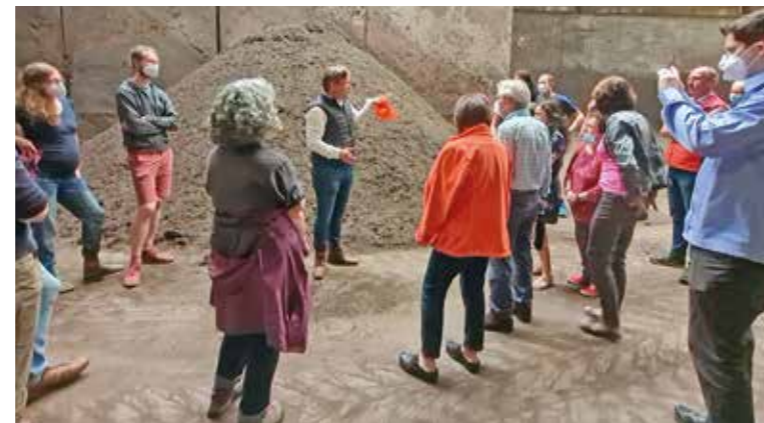
Beileibe kein Biomüll – der Anteil von gedankenlosen „Fehlwürfen“ im Biomüll ist viel zu hoch