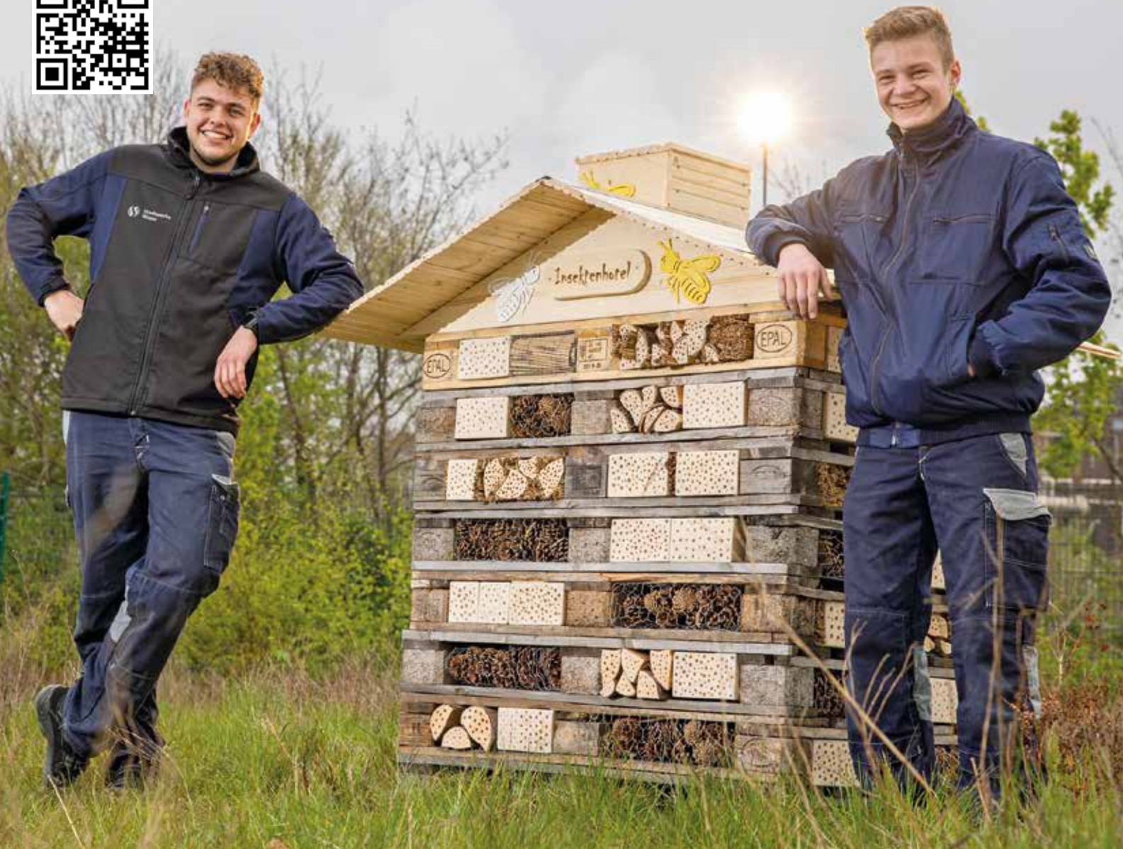
Das Insektenhotel wurde auf der bereits vorhandenen Blumenwiese der Stadtwerke platziert. Da diese sich neben einem Teil des Rheinischen Esels befindet, können auch Radfahrer, Fußgänger & Co. das Insektenhotel besichtigen. Lesen Sie auch den Kurztext auf Seite 2.

WIR SIND DIE EXPERTEN FÜR ALLES, WAS GEKÜHLT WERDEN MUSS