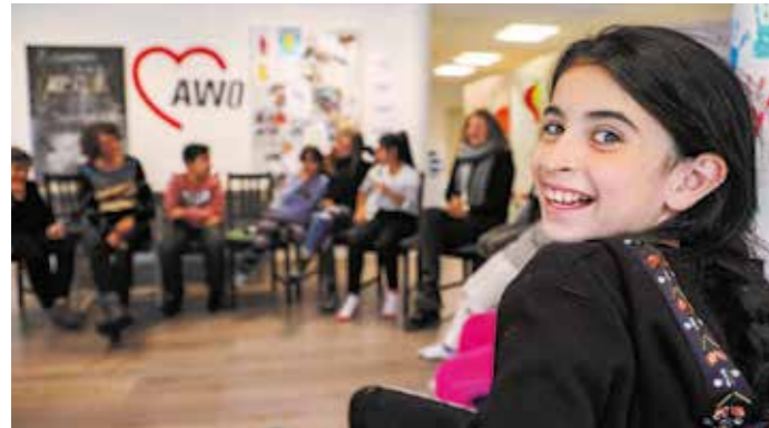
Spiel und Spaß, Hausaufgabenhilfe sowie ein Mittagssnack erwarten die Kinder nach Schulschluss im Gripsclub am Crengeldanz, der so bald wie möglich nach dem Lockdown wieder geöffnet wird.