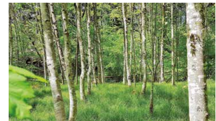
Wachsen soll der Steinzeitwald aus Linden, Eschen, Ulmen, Ahorn, Flaumeichen, Haseln und Hainbuchen im alten Steinbruch Rauen in Witten-Annen. Dort ist Platz für 100 Bäume. Sie sollen als Jungbäume gepflanzt werden mit Schutz gegen Wildverbiss.

Wer für den Jungsteinzeitwald in Witten spenden möchte, findet alle Informationen auf der Internetseite von „Zeero“ unter „www.zeero.ruhr“ im Bereich „Blog“. Von dort führt ein Link zur Crowdfunding-Kampagne. Durch Spenden von Unternehmen und Privatleuten aus dem Kreisgebiet bereits finanziert sind 1500 weitere Bäume, die auf einer Fläche am Oberberger Weg in Wetter gepflanzt werden sollen. Zahlreiche Spender-Firmen haben auch ihre Bereitschaft signalisiert, die Bäume selbst zu pflanzen. „Dieser Zuspruch freut uns sehr. Angesichts der Pandemie haben wir aber leider noch nicht entscheiden können, in welcher Form und mit wie vielen Beteiligten die Pflanzaktion laufen wird“, bedauert Kathrin Peters. Fest steht aber schon: Sobald die Lage es zulässt, werden Exkursionen zu beiden Flächen angeboten, sodass Interessierte die jungen Bäume besuchen können. pen