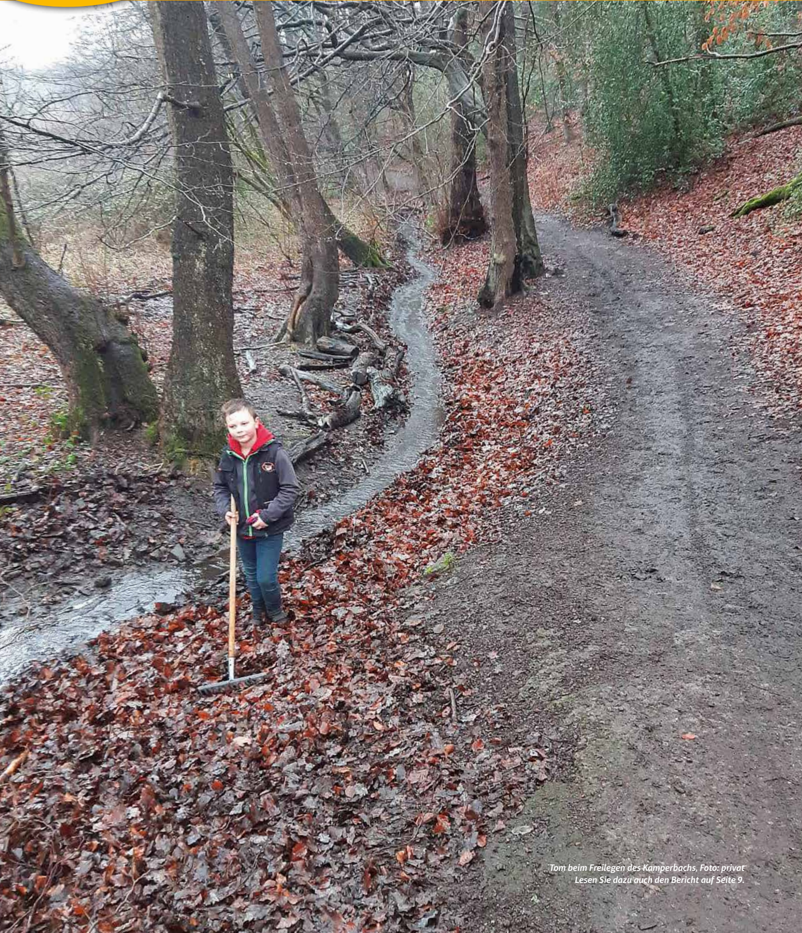
Tom beim Freilegen des Kamperbachs, Foto: privat Lesen Sie dazu auch den Bericht auf Seite 9.

GESAMTAUFLAGE CA. 90.000 EXEMPLARE +++ HAUSHALTSVERTEILUNG +++ ☎ 02302 9838980 +++ WWW.IMAGE-WITTEN.DE +++