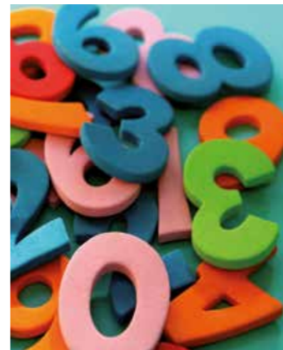
Sprache und Logik: Bei Zahlen passt das oft nicht zusammen.