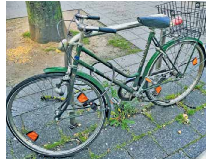
In einem Antrag für den Fachausschuss des Rates fordern die Christdemokraten, eine Kategorie im Mängelmelder einzurichten, unter der die Bürger vermutete Schrotträder melden können, die dann von der Stadt überprüft werden sollen.