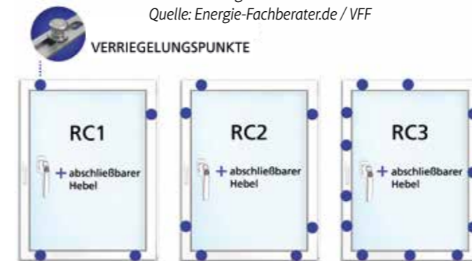
Einbruchhemmende Fenster: Verriegelungspunkte bei Fenstern der verschiedenen Resistance Class-Stufen