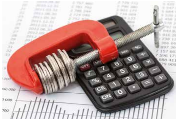
Wer von Schulden erdrückt wird, muss genau nachrechnen, was er sich noch leisten kann und wie der Schuldenfall – oft leichtfertig vergebene Darlehen – zu entgegen ist. Beratungsstellen helfen und erlauben, ob private Insolvenz unumgänglich ist.

Mangelnde Finanzkompetenz Die Hauptgründe, weshalb Menschen in die Überschuldung geraten, sind Arbeitslosigkeit, die Trennung vom Partner, der Tod des Partners und Krankheiten. „Neben diesen Gründen spielen aber auch eine mangelnde Finanzkompetenz und eine teilweise leichtfertige Darlehensvergabe eine wichtige Rolle. Trotzdem sind die Fälle der Ratsuchenden alle individuell“, ergänzt Gundula Beckmann. Aktuell ist