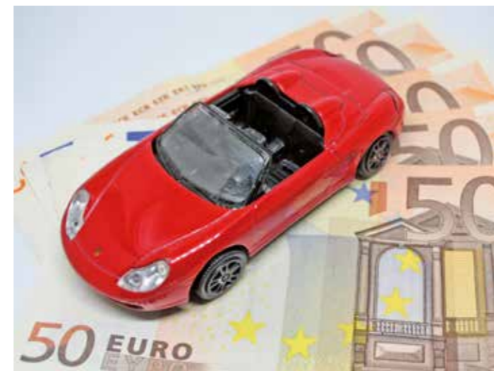
Von Januar an ist die anrechenbare Pendlerpauschale gestiegen und stellt damit das Gegenstück zu den verteuerten Kraftstoffen dar. Ab dem 21. Kilometer für die einfache Fahrt zur Arbeit dürfen nun 35 Cent statt der bisher üblichen 30 Cent je Kilometer angesetzt werden.

Und noch ein Fallstrick: Wer mit vereisten Scheiben unterwegs ist und auf einen Autofahrer trifft, der die Vorfahrt nimmt, kommt um eine Mithaftung oft nicht herum, wenn sich herausstellen sollte, dass die schlechte Sicht verantwortlich für den Unfall war. Das Unfallopfer wird also nicht voll entschädigt, sondern muss einen Teil seines Schadens selbst tragen.