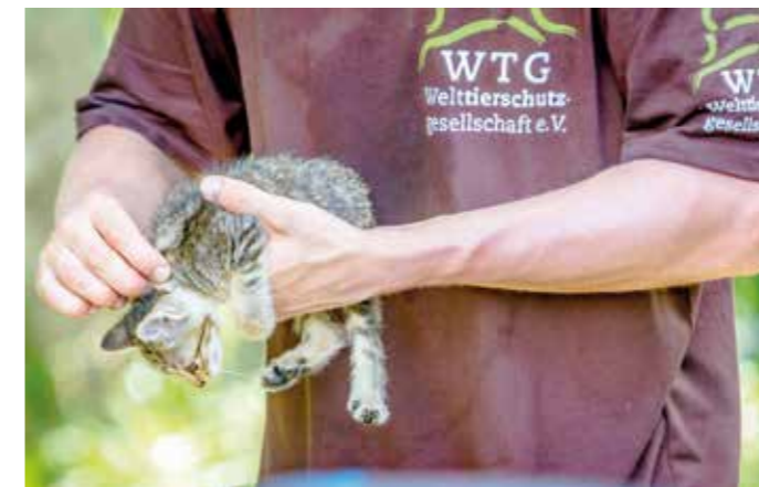
Die Welttierschutzgesellschaft empfiehlt einen Notfallplan für die Coronazeit.

Bei Kaninchen, Vögeln oder anderen Kleintieren hängt es vom Einzelfall ab, ob eine Betreuung notwendig ist. „Bei einer präventiven Quarantäne oder mildem Krankheitsverlauf können sie in der Wohnung bleiben – in vertrauter Umgebung und als Stütze für die Betroffenen“, sagt Schrudde.