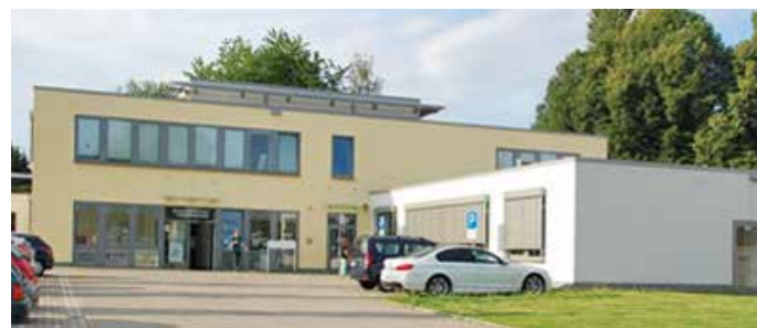
Straßenverkehrsamt – Die Führerscheinstelle der Kreisverwaltung ist Teil des Straßenverkehrsamtes und in der Hattinger Str. 2a in Schwelm zu finden.