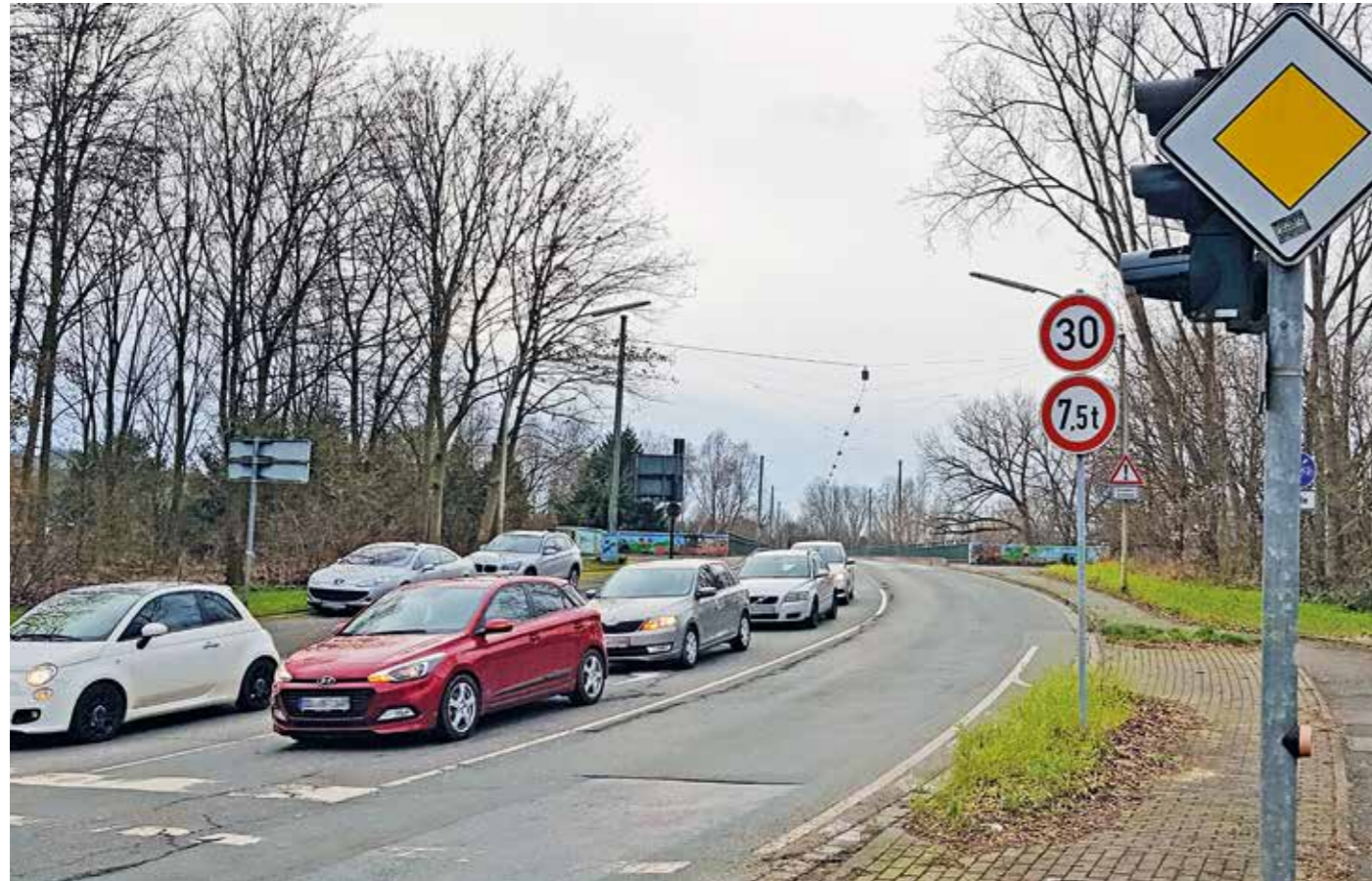
Die Ruhrbrücke nach Herbeder soll 2024 abgerissen und neu gebaut werden. Um über die Zeit zu kommen, ist die Fahrbahn für Lkw und Busse gesperrt. Jetzt sind die Fahrbahnschäden so groß geworden, dass der Verkehr die Ruhrbrücke nur mit maximal Tempo 30 überqueren darf. Erst bei höheren Temperaturen können die Schäden mit Asphalt ausgebessert werden.