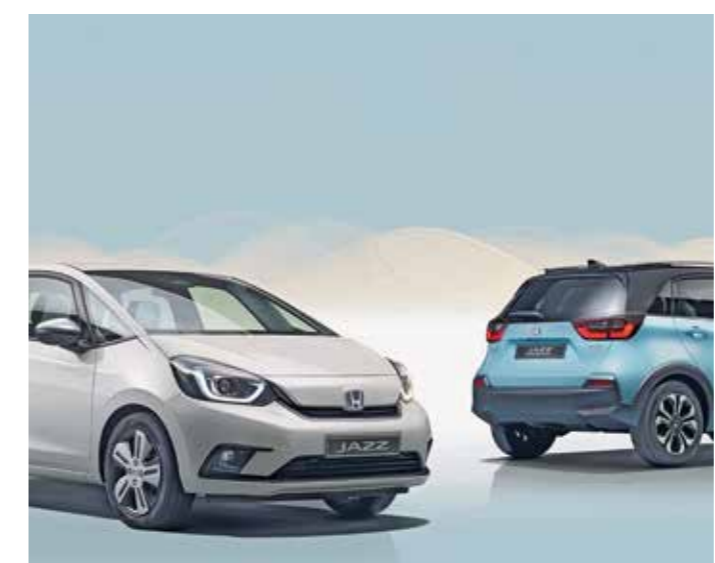
Das „e:HEV“-Hybridsystem im Honda Jazz besteht aus zwei kompakten Elektromotoren, einem 1,5-Liter DOHC-i-VTEC-Benzinmotor, einer Lithium-Ionen-Batterie und einem Direktantrieb mit intelligenter Steuereinheit. Das bedeutet ein sanftes und zugleich direktes Ansprechverhalten.

Verbrauch nach „1999/94/EG“ Der Kraftstoffverbrauch des „Jazz e:HEV“ in Liter je 100 Kilometer: innerorts 2,5 bis 2,4; außerorts 4,3; kombiniert 3,7 bis 3,6. CO 2 -Emission in Gramm pro Kilometer: 84 bis 82. Kraftstoffverbrauch des „Jazz e:HEV Crosstar Executive“: innerorts 2,7; außerorts 4,6; kombiniert 3,9. CO 2 -Emission: 89. Alle Werte richten sich nach „1999/94/EG“. Weitere Informationen zum offiziellen Kraftstoffverbrauch und zur offiziellen spezifischen CO 2 -Emission neuer Personenkraftwagen können dem „Leitfaden über den Kraftstoffverbrauch, die CO 2 -Emissionen und den Stromverbrauch neuer Personenkraftwagen“ entnommen werden, der an allen Honda-Verkaufsstellen und bei „DAT Deutsche Automobil Treuhand GmbH“, Hellmuth-Hirth-Straße 1, 73760 Ostfildern, unentgeltlich erhältlich ist.