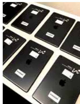
iPads, in Reih und Glied bereit für die Schule.

Die Pestalozzi-Schule bildete den Abschluss: Alle 2 350 iPads sind nun an die Wittener Schulen verteilt. Für die Beschaffung und gegebenenfalls nötige Unterstützung der Schulen war die Stadt zuständig. Die Geräte wurden inventarisiert, mit einem Logo der Stadt Witten sowie Förderaufklebern versehen. Das Land Nordrhein-Westfalen sowie die Bundesregierung förderten die Geräte größtenteils. Die Geräte für die Lehrkräfte finanzierte das Land komplett. Die Geräte für die Schüler wurden zu 90 Prozent aus einem Sonderprogramm zum Digitalpakt bezahlt, also von Bund und Land. Den 10-Prozent-Eigenanteil bestreift die Stadt Witten aus dem Förderprogramm „Gute Schule“.