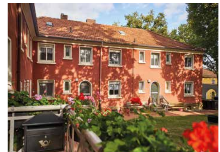
Overbergstraße 12 + 14