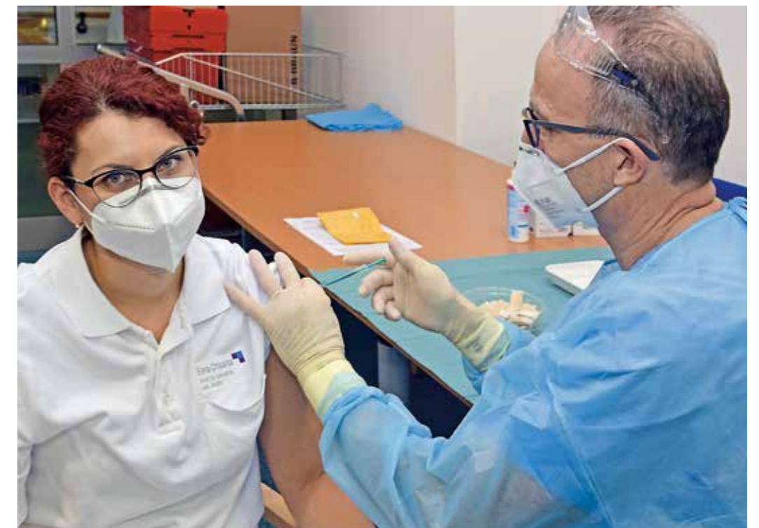
Das Interesse an der Corona-Schutzimpfung ist groß im Evangelischen Krankenhaus in Witten an der Pferdebachstraße: Hatten zu Beginn fast 70 Prozent der Mitarbeiter ihre Impfbereitschaft signalisiert, sind es nach dem Beginn der Impfkation noch mehr geworden.

Gleichwohl wollte sich das EvK diese einmalige Gelegenheit nicht entgehen lassen. Und so gelang es den engagierten Mitarbeitern, innerhalb kürzester Zeit eine hauseigene Impfstraße einzurichten, Prioritätenlisten zu