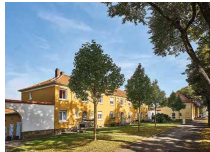
Denkmalgeschützte Siedlung in der Rüdinghauser Straße 89-93