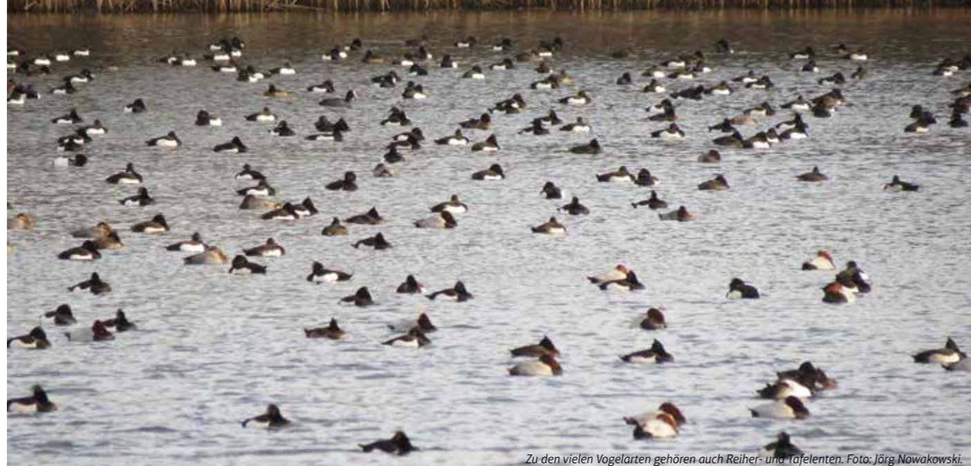
Zu den vielen Vogelarten gehören auch Reiher- und Tafelenten.

Durch den Bau des Kemnader Stausees Ende der 1970er Jahre entstand nicht nur ein Naherholungsparadies für viele Menschen, sondern auch ein wertvoller Rastplatz für Wasservögel. Wieviele Wasservögel es in etwa sind und zu welchen Arten sie zählen, weiß Jörg Nowakowski. Der Vogelkundler der Naturschutzgruppe Witten (NaWit) führt genau Buch, um die Entwicklung der Rastbestände genau verfolgen zu können. „Mittlerweile wird rund ums Jahr alle zehn Tage ge-