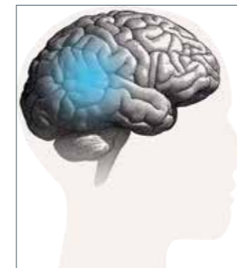
Das Gehirn braucht für seine Arbeit Zugang zu allen Klängen – nicht nur zur Sprache.

Wie bitte? Hörprobleme begleiten viele Menschen durch den Alltag. Nun ist die Hörforschung zu neuen bahnbrechenden Erkenntnissen gekommen: Das Gehirn braucht Zugang zur gesamten Klangumgebung, damit es auf natürliche Weise arbeiten kann, nicht nur zur Sprache. Die Erkenntnisse haben auch große Auswirkungen auf die Hörsystem-Branche.