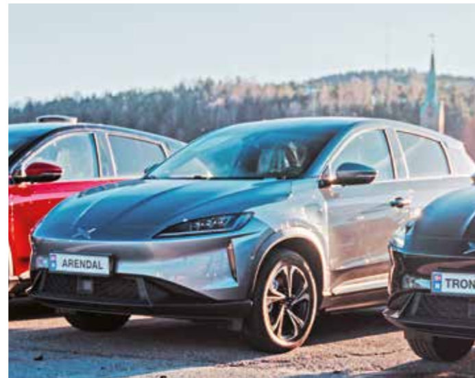
Der chinesische Autobauer „Xpeng“ kommt nach Europa. Die ersten Einheiten des kompakten Elektro-SUVs G3 wurden per Schiff in Norwegen angeliefert. Das Fahrzeug hat – nach „Worldwide Harmonized Light-Duty Vehicles Test Procedure“ (WLTP) – eine Reichweite von rund 450 Kilometern. Das Unternehmen verkaufte 2020 rund 27 000 Einheiten von G3 und der Sportlimousine P7, ein Plus von 112 Prozent gegenüber dem Vorjahr. Seit August 2020 ist „Xpeng“ an der Börse. Der G3 kostet in Norwegen 33 700 Euro aufwärts.

Bei den batterieelektrisch angetriebenen Pkw liegen die privaten Neuzulassungen vorn und machten mit einem Anteil von 48,8 Prozent beinahe die Hälfte aller Neuzulassungen aus. Bei den alternativen Antrieben erreichte VW mit 17,4 Prozent den höchsten Anteil (+608,6 im Vergleich zum Vorjahr), gefolgt von Mercedes-Benz (14,9 /+ 499,8) und Audi (9,0 /+607,9 Prozent). Bei den insgesamt 194 163 batterieelektrisch angetriebenen Pkw entfiel der größte Neuzulassungsanteil mit 23,8 Prozent ebenfalls auf die Marke VW, gefolgt von Renault (16,2 /+233,8) und Tesla (8,6 Prozent/+55,9 Prozent).