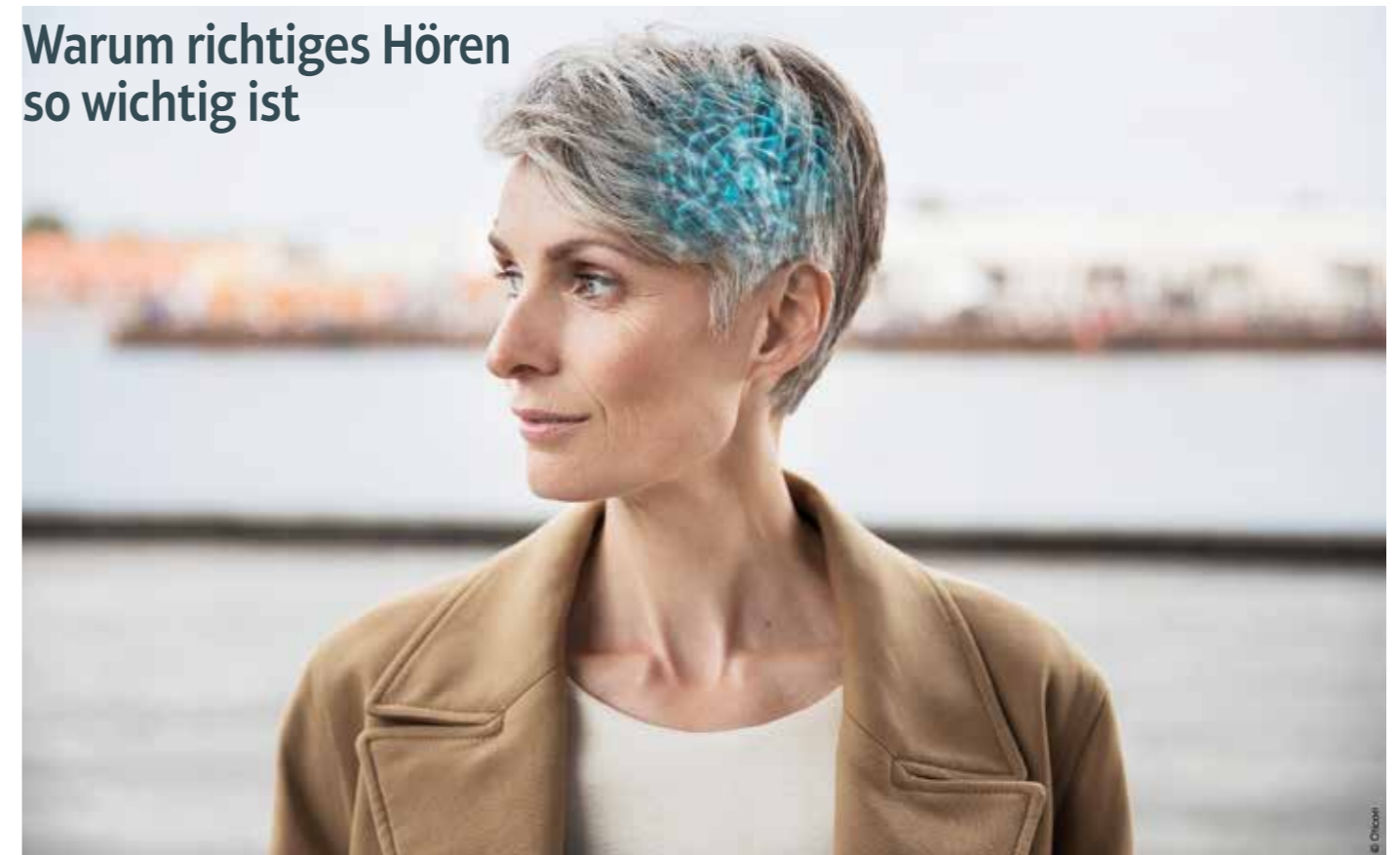
Neueste Erkenntnisse der Hörforschung: Für gutes Hören braucht das Gehirn Zugang zur gesamten Klangumgebung.

Wie bitte? Hörprobleme begleiten viele Menschen durch den Alltag. Nun ist die Hörforschung zu neuen bahnbrechenden Erkenntnissen gekommen: Das Gehirn braucht Zugang zur gesamten Klangumgebung, damit es auf natürliche Weise arbeiten kann, nicht nur zur Sprache. Die Erkenntnisse haben auch große Auswirkungen auf die Hörsystem-Branche.