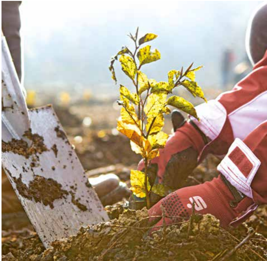
Je mehr die Privatkunden der Sparkasse Witten bis Ende September zum E-Postfach gewechselt haben, desto mehr Baumsetzlinge werden in Zusammenarbeit mit Stadtförster Klaus Peter in Witten gepflanzt.

Doch auch die vielen Sparkassenkunden können ebenfalls zusätzliche Verantwortung in Sachen Nachhaltigkeit übernehmen – und die ressourcenschonenden Angebote der Sparkasse nutzen. Und genau hier setzt die diesjährige Baumpflanzaktion der Sparkasse Witten an. Je mehr Privatkunden der Sparkasse Witten bis Ende September auf das bequeme und trotzdem sichere elektronische Postfach (E-Postfach) umsteigen – und so beispielsweise auch den digitalen Konto-, Depot- und Darlehensauszug sowie die papierlose Kreditkartenabrechnung nutzen, desto mehr