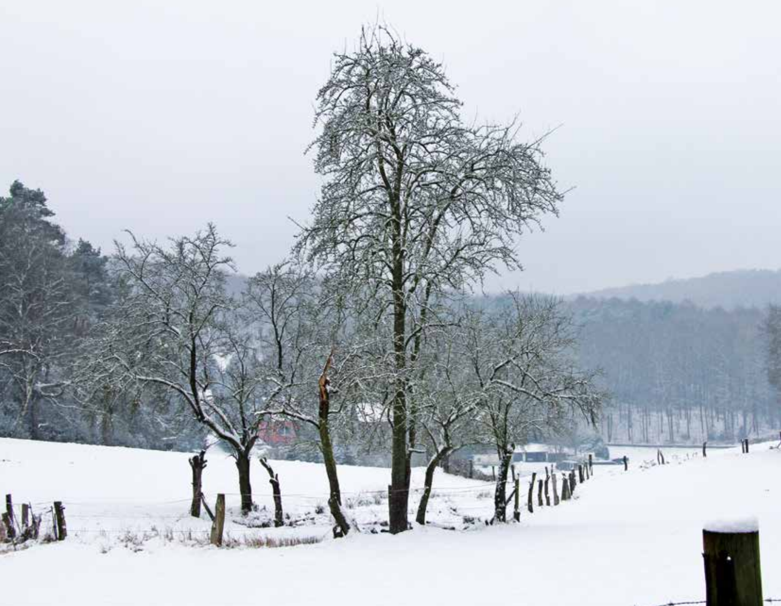
Neuschnee in Rüdinghausen, Foto: Ulf Kathagen

GESAMTAUFLAGE CA. 90.000 EXEMPLARE +++ HAUSHALTSVERTEILUNG +++ ☎ 02302 9838980 +++ WWW.IMAGE-WITTEN.DE +++