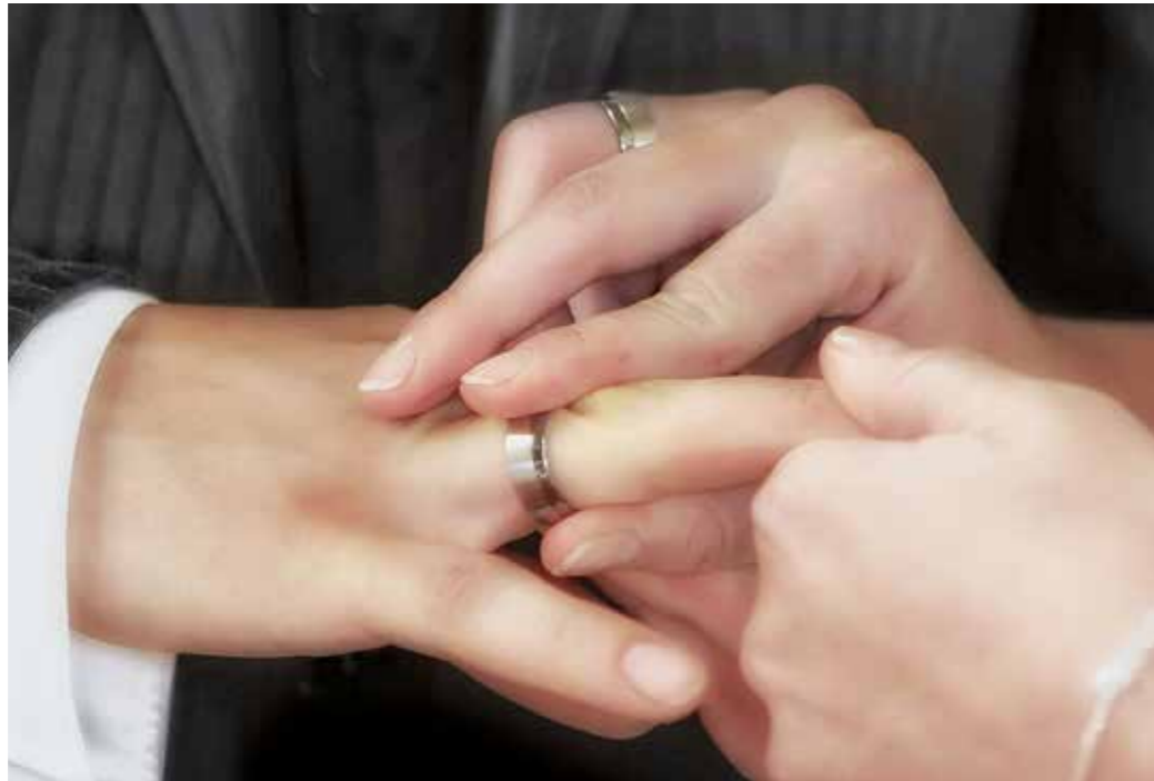
Corona sorgt derzeit eher für negative Rekorde, aber es gibt noch positive Nachrichten: Die Zahl der Trauungen steigt seit Jahren, die pandemiebedingten Absagen haben diese Entwicklung lediglich auf hohem Niveau eingetrübt. Ein möglicher Spitzenwert wurde verpasst. Seit 2013 liegt die Zahl der Eheschließungen in Witten über 700, auch in dem wenig hochzeitsfreundlichen Jahr 2020 lag sie mit 709 knapp darüber, darunter 15 gleichgeschlechtliche Ehen. Die ursprünglichen Anmeldezahlen deuten aber auf einen klar steigenden Trend hin. Waren es im Jahr 2017 noch 781 Trauungen, stieg die Zahl im Folgejahr auf 838, im Jahr 2019 dann auf 850. Der Anstieg liegt einerseits im Bundestrend, ist gleichzeitig aber auch ein Indiz für das attraktive Angebot in Witten.

Mit der letzten Frage sei die Erwartung verbunden, dass im Falle einer negativen Antwort entsprechende Schritte eingeleitet werden. Die Senioren könnten das Impfzentrum von der Zusatz-Haltestelle aus nach einem Fußweg von 210 Metern erreichen. Wittener Senioren müssten allerdings nach dem aktuellen Kenntnisstand in einer anderen Stadt zusteigen, wenn sie die Linie 37 ebenfalls nutzen wollen.