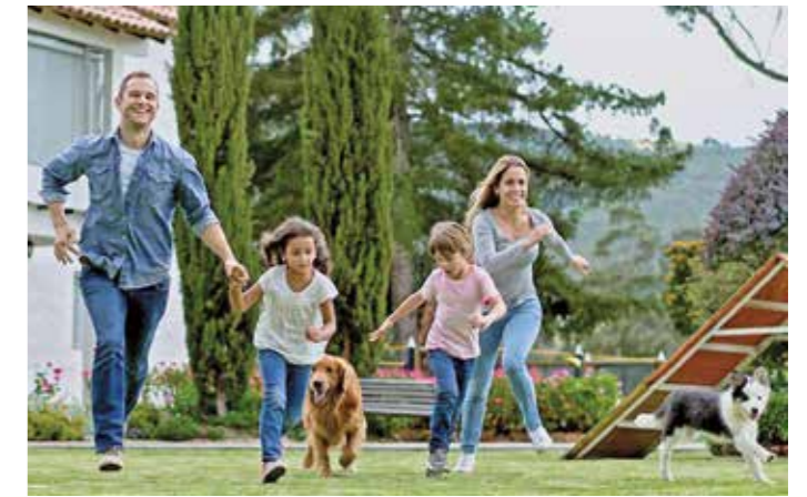
Wegen Verzögerungen durch die Coronakrise verlängert sich die Frist fürs Baukindergeld bis einschließlich Mittwoch, 31. März. Gestellt werden können die Anträge bis Ende 2023. Eine weitere Verlängerung ist von der Bundesregierung bislang nicht vorgesehen. Von der Förderung profitieren Familien mit mindestens einem Kind, das jünger als 18 ist. Gehaltsobergrenze je Haushalt: 75 000 Euro plus 15 000 Freibetrag je Kind.

Alle Solaranlagen müssen, sofern sie mit dem Stromnetz verbunden sind, bis 31. Januar im sogenannten Marktstammdatenregister eingetragen werden. Sonst droht den Besitzern, keine EEG-Vergütung zu erhalten und ein Bußgeld bis zu 50000 Euro. Auch Batteriespeicher, Blockheizkraftwerke, Windenergieanlagen oder Notstromaggregate müssen demnach gemeldet werden. Nach Recherchen des Bayerischen Energie- und Wasserwirtschaft (VBW) sind allein in Bayern etwa 200000 Fotovoltaikanlagen nicht gemeldet. Die Anmeldung funktioniert unter anderem über die Bundesnetzagentur. Die Meldepflicht gilt auch für Anlagen, die seit vielen Jahren in Betrieb sind.