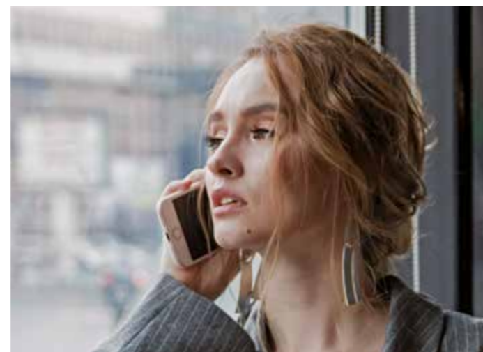
Schnell rutscht einem am Telefon mal ein „Ja“ über die Lippen, wenn der Anrufer geschickt nachfragt. Das kann fatale Folgen haben.

Damit es aber erst gar nicht so weit kommt, legen Sie sich schon mal in Ruhe zurecht, wie Sie bei dubiosen Anrufen antworten könnten – ein „Ja“ rutscht nämlich schneller raus als Sie eigentlich wollten. Eine Möglichkeit: Wiederholen Sie die Frage als Antwort. Zum Beispiel: auf „Hören Sie mich?“, können Sie mit „Ich höre Sie“ antworten. Oder: „Bin ich mit Herrn XY verbunden?“ antworten Sie – wenn Sie überhaupt noch wollen – mit „Sie sind mit XY verbunden“ oder „am Apparat.“ Noch besser: Sie gehen gar nicht auf die Frage ein und beenden das Gespräch konsequent per Tastendruck. dx