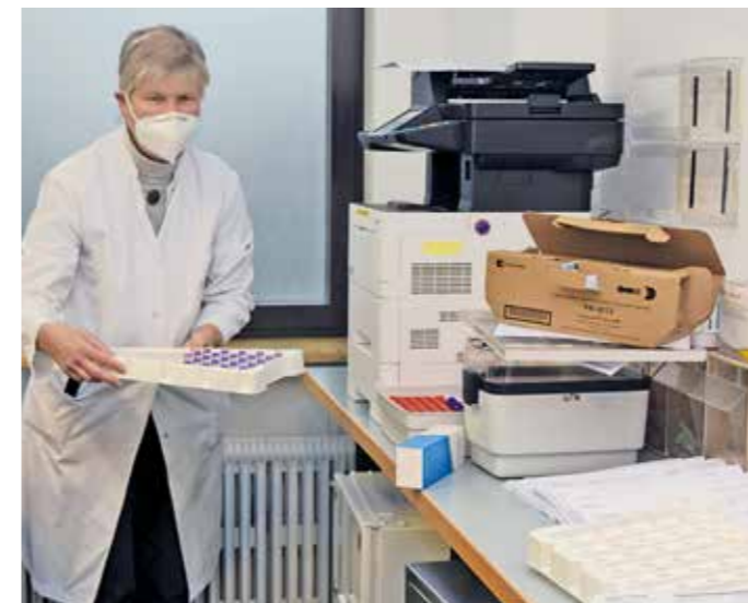
Ankunft die Impfstoffdosen: Nur wenige Stunden nach dem überraschenden Anruf konnte im Evangelischen Krankenhaus (EvK) der erste Impfstoff geimpft werden. Es folgten gleich mehrere Anrufe dieser Art – und jedes Mal stand das Team des EvK bereit.

Insgesamt vier Impfteams waren jeweils in Vier-Stunden-Schichten im Einsatz. Am Ende haben alle impfwilligen Mitarbeiter die Corona-Schutzimpfung erhalten. Das Interesse daran ist im EvK groß: Hatten zu Beginn fast 70 Prozent der Mitarbeiter ihre Impfbereitschaft signalisiert, sind es nach dem Start der Impfkation noch mehr geworden.