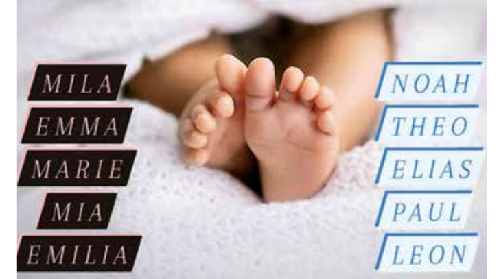
Die Zeiten, als Kevin noch alleine zu Hause sein Namensschicksal tragen musste oder Janine auf „Komma bei die Omma“ hörte, sind schon lange vorbei. Klassiker waren wie die Jahre zuvor auch 2020 gefragt. Der Vorteil: Sie sind (fast) überall üblich und klingen auch noch nach Jahrzehnten so zeitlos wie in den vielen Jahren zuvor.