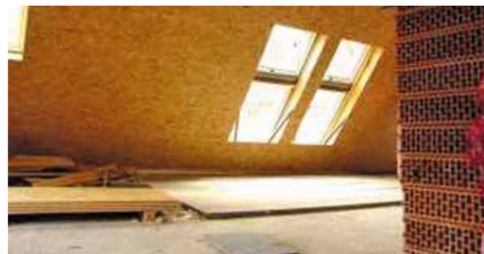
Die Dämmung muss beim Dachausbau mit Fenster unbedingt bedacht werden.