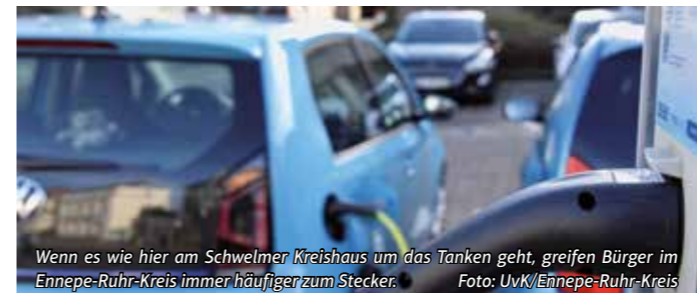
Wenn es wie hier am Schwelmer Kreishaus um das Tanken geht, greifen Bürger im Ennepe-Ruhr-Kreis immer häufiger zum Stecker.

Dazu kommen 3 817 Hybrid-Fahrzeuge. Insgesamt „stromern“ damit im EN-Kreis 5 084 Fahrzeuge. Von diesen tragen 1 931 ein „E“ im Kennzeichen.