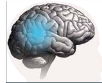
Das Gehirn braucht für seine Arbeit Zugang zu allen Klängen – nicht nur zur Sprache.

Wie bitte? Hörprobleme begleiten viele Menschen durch den Alltag. Nun ist die Hörforschung zu neuen bahnbrechenden Erkenntnissen gekommen: Das Gehirn braucht Zugang zur gesamten Klangumgebung, damit es auf natürliche Weise arbeiten kann, nicht nur zur Sprache. Die Erkenntnisse haben auch große Auswirkungen auf die Hörsystem-Branche.