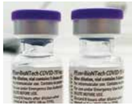
Der Stoff, aus dem der Schutz fürs Klinikpersonal vor Covid-19 kommt, stammt von „Pfizer-BioNTech“.