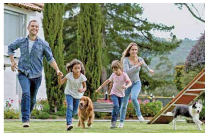
Wegen Verzögerungen durch die Coronakrise verlängert sich die Frist fürs Baukindergeld bis einschließlich Mittwoch, 31. März. Gestellt werden können die Anträge bis Ende 2023. Eine weitere Verlängerung ist von der Bundesregierung bislang nicht vorgesehen. Von der Förderung profitieren Familien mit mindestens einem Kind, das jünger als 18 ist. Gehaltsobergrenze je Haushalt: 75 000 Euro plus 15 000 Freibetrag je Kind.

Alle Solaranlagen müssen, sofern sie mit dem Stromnetz verbunden sind, bis 31. Januar im sogenannten Marktstammdatenregister eingetragen werden. Sonst droht den Besitzern, keine EEG-Vergütung zu erhalten und ein Bußgeld bis zu 50000 Euro. Auch Batteriespeicher, Blockheizkraftwerke, Windenergieanlagen oder Notstromaggregate müssen demnach gemeldet werden. Nach Recherchen des Bayerischen Energie- und Wasserwirtschaft (VBEW) sind allein in Bayern etwa 200000 Fotovoltaikanlagen nicht gemeldet. Die Anmeldung funktioniert unter anderem über die Bundesnetzagentur. Die Meldepflicht gilt auch für Anlagen, die seit vielen Jahren in Betrieb sind.