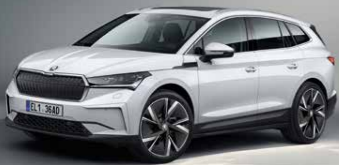
Skoda Enyaq iV

Skodas erstes Elektroauto neuer Zeitrechnung kommt zu den Händlern. Das erste batterieelektrische Serienmodell bedeutet für die Marke den nächsten Schritt bei der Umsetzung ihrer Elektromobilitätsstrategie. Im Stammwerk Mladá Boleslav rollen bis zu 350 Stück täglich vom Band. Den Enyaq iV gibt es mit drei Batteriegrößen und in gleich fünf Leistungsvarianten. In den beiden stärksten Ausführungen kommt zusätzlich zum Heckmotor ein zweiter Elektromotor an der Vorderachse zum Einsatz. Je nach Batteriegröße liegt die Reichweite bei bis zu 536 Kilometern im WLTP-Zyklus. Als erster Skoda nutzt der Enyaq ein Head-up-Display mit Augmented Reality, das auf zwei Anzeigefeldern Informationen liefert. Beim Interieur will sich Skoda von modernen Wohnwelten inspiriert wissen und setzt auf Materialien wie Wolle oder mit pflanzlichen Extrakten gerabtes Leder.