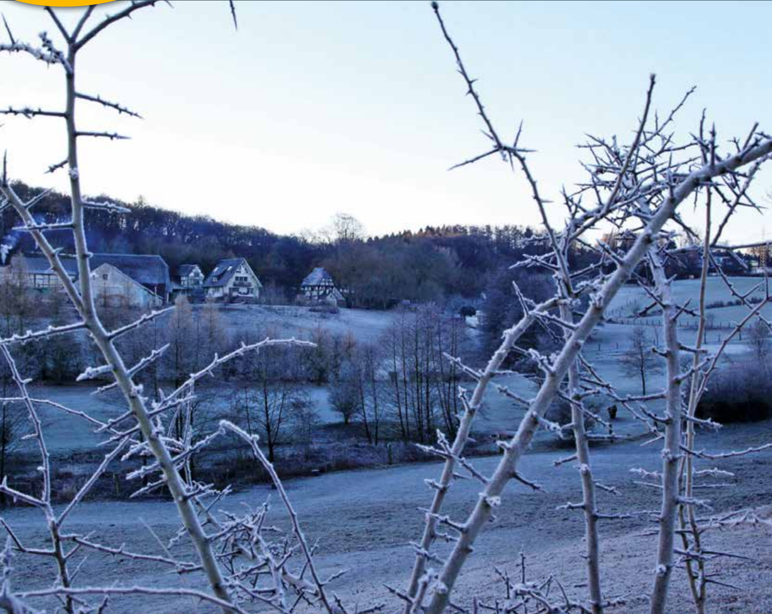
„Bei Großer Siepen nach eisigkalter Nacht“ aus dem Jahreskalender 2021 „Sprockhövel – natürlich schön!“ von Uli Auffermann

GESAMTAUFLAGE CA. 90.000 EXEMPLARE +++ HAUSHALTSVERTEILUNG +++ ☎ 02302 9838980 +++ WWW.IMAGE-WITTEN.DE +++