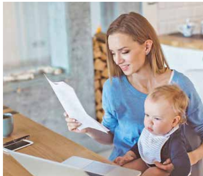
Ist das Einkommen niedrig, sind aber die Wohnkosten sehr hoch, kommen viele Bürger an ihre finanziellen Grenzen. Doch der Staat unterstützt unter Umständen Haushalte mit Wohngeld. Vermögende haben keinen Anspruch, die Grenze liegt bei 60000 Euro.