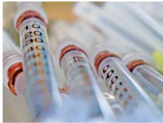
Für die ersten drei Wochen des Betriebs der Impfzentren sind NRW-weit jeweils 171.000 Biontech-Impfdosen angekündigt, wovon die Hälfte für die zweite Impfung zurückgelegt wird. „Noch ist nicht klar, auf wieviel Impfstoff wir im Ennepe-Ruhr-Kreis zurückgreifen können“, sagt Astrid Hinterthür, Leiter des Krisenstabes im Schwelmer Kreishaus.

Um diese Gruppe über das Impfangebot und den Ablauf sowie die Anfahrt nach Ennepetal zu informieren, gehen im Kreis im Laufe der nächsten Wochen rund 24.000 Schreiben auf den Postweg. Die Zahl der zu vergebenen Termine hängt vom vorhandenen Impfstoff ab. Für die ersten drei Wochen des Betriebs der Impfzentren sind NRW-weit jeweils 171.000 Biontech-Impfdosen angekündigt. Unabhängig von dem, was rechtlich geboten ist, lautet der Appell angesichts der derzeitigen Lage, die Kontakte zu reduzieren. Arbeitgeber sind aufgerufen, wo immer möglich Homeoffice zu ermöglichen, auf Dienstreisen zu verzichten und auf Telefon- und Videokonferenzen zu setzen.