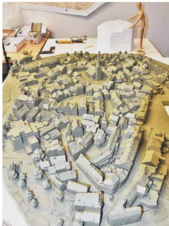
Links schauen wir aus der Perspektive Große Weilstraße in Richtung Krämersdorf und Kirchplatz im Hintergrund. Das rechte Bild zeigt ein Detail vom Krämersdorf.