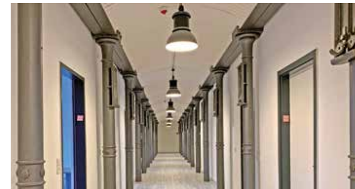
Neue Räumlichkeiten: Dieser Bürotrakt in der zweiten Etage des Schwelmer Ibach-Hauses bietet der Schulberatungsstelle ausreichend Platz.

Je nach Lage wird dann zum Beispiel gemeinsam mit Lehrern und einigen Schülern eine Unterstützungsgruppe für das betroffene Kind eingerichtet. Die Nachfrage ist in den vergangenen Jahren deutlich gestiegen. Deshalb soll das Personal im Laufe des kommenden Jahres weiter aufgestockt werden. Zu Lehrkraft und sechs Schulpsychologen kommen dann noch zwei weitere Psychologen hinzu. Termine: Ruf 023 36/93 27 90, E-Mail: schulberatung@en-kreis.de ; im Internet unter www.en-kreis.de . pen