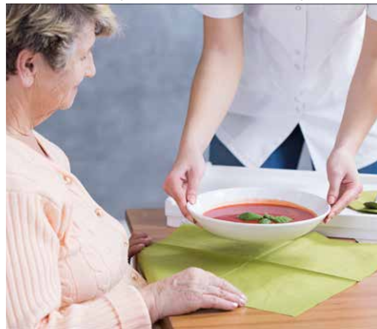
Viele Menschen leiden im Alter und bei chronischen Krankheiten an Appetitlosigkeit und werden dann nicht ausreichend mit Vitaminen und anderen wichtigen Nährstoffen versorgt. Das wirkt sich ungünstig auf das Immunsystem aus. Mit Trinknahrung aus der Apotheke können Defizite recht einfach ausgeglichen werden.