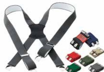
Breite Hosenträger nur 15€