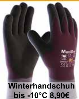
Winterhandschuh bis -10°C 8,90€