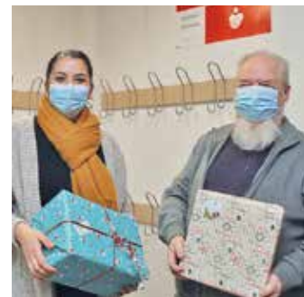
Studenten und Mitarbeiter der Uni Witten/Herdecke (UW/H) hatten 70 Geschenkpakete gepackt, die im Advent an den Verein „Ruhrtal Engel“ übergeben wurden. „Wir bedanken uns bei allen, die mitgemacht haben, und hoffen, dass wir weiterhin unterstützt werden“, sagten die Mitarbeiterinnen der Info- und Poststelle an der UW/H.

25 Luftreinhaltegeräte sind in den Schulen der Stadt aufgestellt. Ausgestattet wurden Räume, die besonders schlecht zu lüften sind. Das Gebäudemanagement und die Abteilung Schule sowie die Schulen selbst hatten die Räume bestimmt. Insgesamt ist die Förderung von 47 Geräten beantragt. Die Kosten für die bislang angeschafften Luftreinhaltegeräte konnte die Stadt vorstrecken. Um die übrigen Geräte bestellen zu können, ist die Stadt aber auf die Förderzusage der Landesregierung angewiesen. Die Geräte werden teils in Klassenzimmern, teils in anderen Räumen der Schulen sowie in Turnhallen installiert.