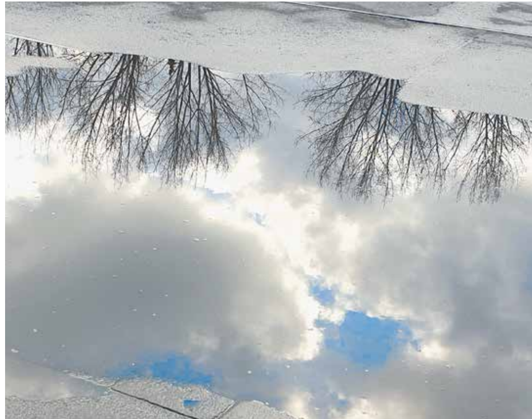
Was bringt das neue Jahr 2021? Man könnte ins Glas schauen, nicht in das eines Jägermeisters, sondern ins kuglige der meist weiblichen Wahrsager – oder in unterschiedliche Spiegel, die ja nach Märchenart einen Blick in die Zukunft ermöglichen sollten: Spieglein, Spieglein an der Wand... Wer beispielsweise ins Wasser dieser Pfütze blickt, sieht schon ganz deutlich was von der Zukunft: Sie wird heiter bis wolkig.