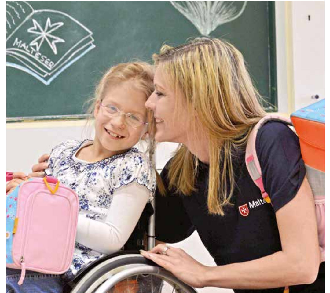
Schulbegleitung – Inklusion vom Kindergarten bis zur Hochschule: Der Begleitdienst des Malteser Hilfsdienstes ermöglicht Kindern und Jugendlichen mit Handicap eine Regel- und Fördereinrichtungen erfolgreich zu besuchen.