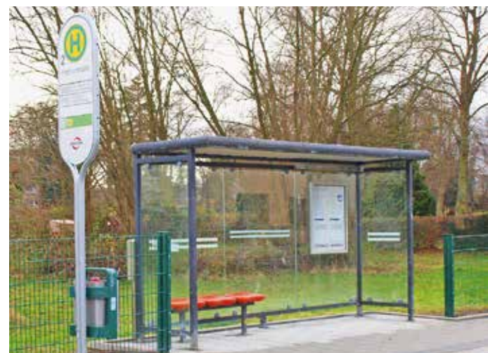
Die Bushaltestellen „Potthofstraße“ sind barrierefrei in beiden Fahrtrichtungen. Die Arbeiten wurden abgeschlossen und die Bereiche freigegeben. Die Straße kann nun wieder von Bussen angefahren werden. Für alle Verkehrsteilnehmer sind die Beschränkungen auch aufgehoben.

Auf Antrag der SPD-Fraktion im Rat der Stadt Witten gibt es im Interesse des Herbeder Schul- und Vereinssports ein Sporthallen-Provisorium als Ersatz für die marode Horst-Schwartz-Halle. Spätestens zu Beginn des Schuljahres 2021/22 soll eine Traglufthalle in Vormholz zur Verfügung stehen. Der Ersatzneubau kann vermutlich 2024 in Betrieb gehen. Bis zu seiner Fertigstellung können die Herbeder Schulen und Sportvereine das Provisorium nutzen.