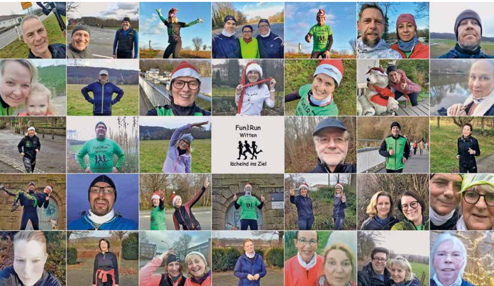
Getrennt laufen, dabei im Herzen bei der Laufgruppe sein: Einen gemeinsamen Weihnachtslauf gab es coronabedingt zwar nicht, aber die Mentoren der Wittener Laufgruppe „FunVorRun“ hatten dazu aufgerufen, über die Festtage einzeln zu laufen, ein Foto davon zu