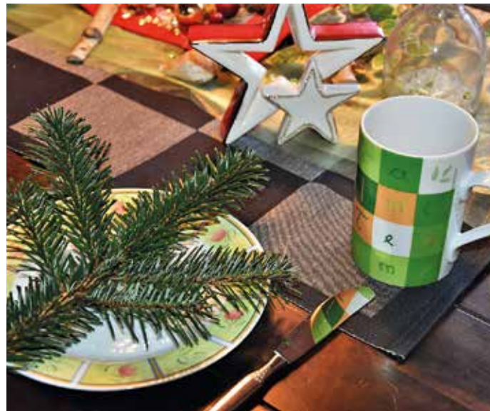
Viel zu schade zum Entsorgen ist der Weihnachtsbaum. Zumindest mit Tannen- oder Kiefernadeln kann man viel mehr machen. Natürlich sollte man darauf achten, dass der Baum aus ökologischem Anbau kommt. Aber es gibt viele Rezepte, die auf die Nadeln der Bäume zurückgreifen. Das wäre doch einmal eine Idee für ein nachweihnachtliches Essen...

1 TL Nadeln klein schneiden und anquetschen, mit heißem Wasser übergießen und maximal zwei Minuten ziehen lassen. Am besten den Tee mit Honig süßen und wer ihn zu Hause hat, der sollte unbedingt echten Tannenhonig verwenden. Der Tee sieht an sich recht unspektakulär aus, da