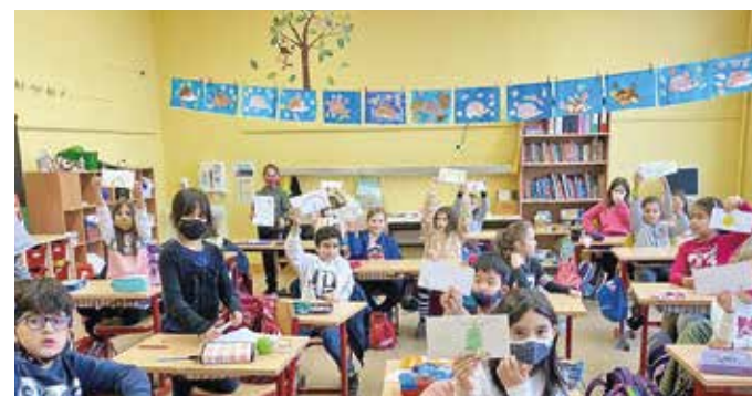
Auch in der Klasse 3c der Hellwegschule in Heven gab es etliche Briefeschreiber.