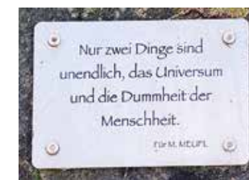
Jeder Spender erhielt vor 10 Jahren zu seinem Baum auch eine Stahltafel, eingraviert mit einem eigenen Spruch.