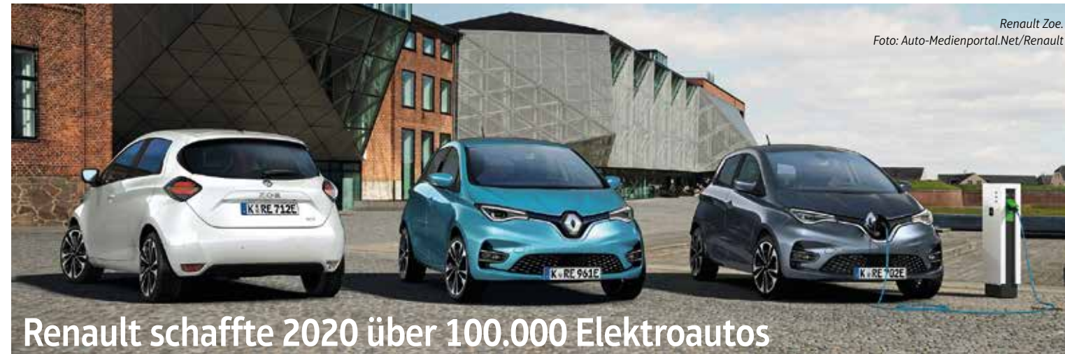
Renault Zoe.