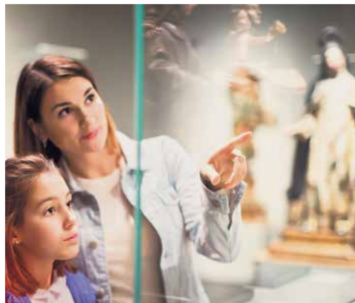
Das Foto zeigt das Kampagnenmotiv für den Schwerpunkt 2020: „Kultur geht uns alle an“.