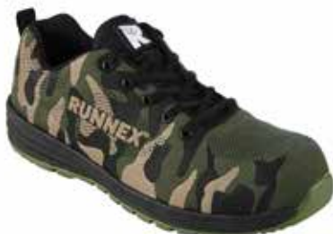
S3 camouflagé Arbeitsschuh 59,90€