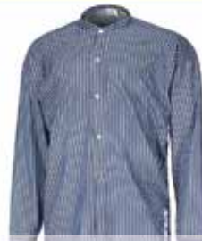
RAG Pütthemd Schlosserhemd 24,95€