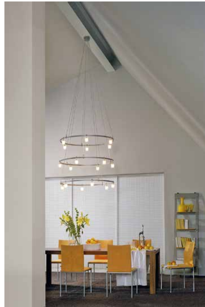
OLI Pendelleuchte Kronleuchterring.

Die Farbwiedereigenschaft einer Lichtquelle gibt an, wie natürlich die Farben unserer Umgebung unter ihrem Licht wirken. Eine gute Farbwiedergabe ist z. B. beim Make-up im Bad, bei der Arbeit am Schreibtisch oder beim Kochen zur Beurteilung der Speisen wichtig. In Wohnräumen sollten es mindestens Ra 80 sein, besser mehr. licht.de