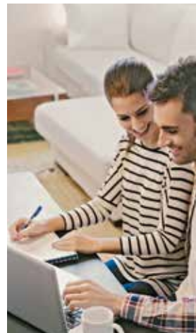
Wer vorab wichtige Dinge bedenkt, hat gut lachen.

Häuser liegen oft am Stadtrand und verfügen über einen Garten – allerdings muss der Eigentümer sich um die Instandhaltung kümmern. Deshalb besser vor dem Kauf überlegen, welche Punkte besonders wichtig sind. Sich Zeit nehmen – und zwar sowohl bei der Auswahl des Traumhauses, als auch beim Unterschreiben des Kaufvertrags. Nur wer die Immobilie ausreichend kennt (Gebäudezustand, Energieausweis, Nebenkosten, Erschließung), erlebt nach dem Kauf keine bösen Überraschungen. txn-p