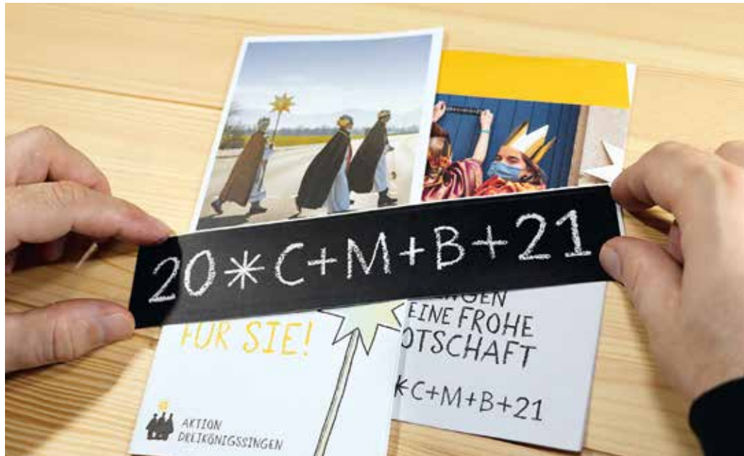
Außer im Video haben sich die Sternsinger mit Briefen, Flyern, E-Mails sowie dem Facebook- und Instagram-Account der Pfarrei bemerkbar gemacht. Die Segensaufkleber, die sonst von den Kindergruppen in die Haushalte gebracht wurden, liegen in der Kirche St. Peter und Paul aus.

Angesichts der verschärften Entwicklung der Coronafallzahlen sind die Sternsinger der katholischen Gemeinde St. Peter und Paul in Witten-Herbede nicht wie geplant von Haus zu Haus und von Tür zu Tür gezogen, um ihren Segen persönlich zu verteilen und für weltweite Projekte des Sternsinger Kindermissionswerks zu sammeln. Direkt nach Weihnachten hatte das Vorbereitungsteam ein Video gedreht. So möchten die Verantwortlichen auf die Aktion unter dem Titel „Kindern Halt geben – in der Ukraine und weltweit“ aufmerksam machen und die Menschen um Spenden für Kinder in Not per Überweisung statt wie sonst an der Haustür bitten. Ohne Kontakt zu anderen haben im Video einzelne Mädchen und Jungen Sternsinger-Lieder und Texte präsentiert.