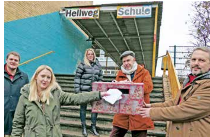
Der Caritas-Pflegedienst überbrachte bunte Bilder und Kinderbriefe an Seniorenheime.

Mit einem Buch auf dem Sofa lässt sich die Winterzeit genießen. Wer dafür keinen Lesestoff hat, dem empfiehlt sich ein Besuch auf dem Bücherflohmarkt: Samstag, 6. Februar, 14 bis 17 Uhr, und Sonntag, 7. Februar, 12 bis 17 Uhr, kann man stöbern. Die Coronavorschriften werden eingehalten. Daher könnte es eventuell auch mal kurze Wartezeiten geben. Gut erhaltene Bücher können vom 1. bis 5. Februar jeweils von 9 bis 12 Uhr im Markus-Zentrum abgegeben werden.