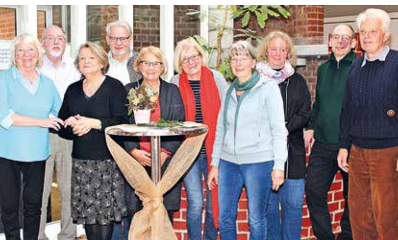
Aktive „Deutschförderer“: Sie helfen vor allem Kindern und Jugendlichen mit Migrationshintergrund. Sprache ist für sie der Schlüssel zum Wohlfühlen und Ankommen in einem fremden Land.

Deutschförderer vermitteln deutsche Sprache und Kultur - damit ein Land zur Heimat wird