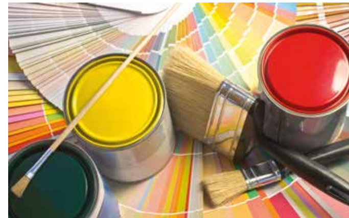
Gesunder Anstrich für ein besseres Wohnklima: Versierte Fachbetriebe haben das nötige Know-how, um bei Renovierungsarbeiten ökologisch einwandfreie Materialien einzusetzen. Der Vermittlungsservice der Gelben Seiten hilft, den richtigen Maler zu finden.