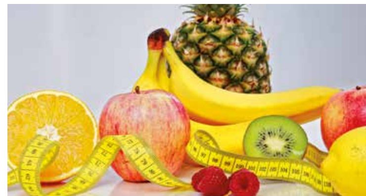
Bei allem Training: Richtiges Essen trägt wesentlich zur Fitness bei. Obst und Gemüse helfen.

Neben Figur und Fitness gibt's noch weitere Möglichkeiten, nämlich Stressprävention und das Stärken von Rücken und Kreislauf durch ein Aufbautraining, das den individuellen Bedürfnissen angepasst ist. Alles in allem: Gut für Körper und Geist.