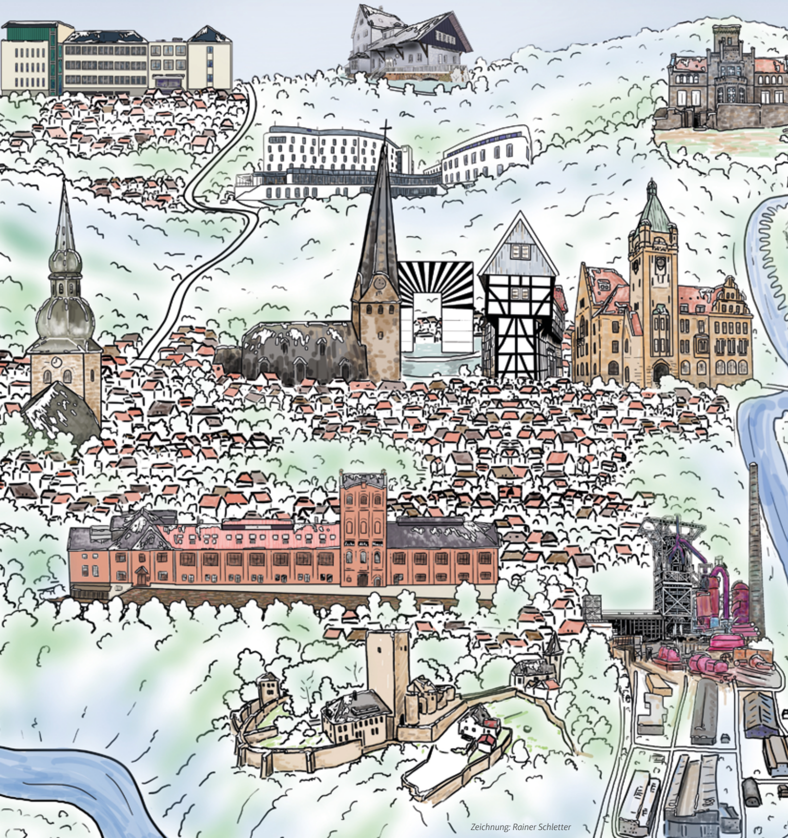
Zeichnung: Rainer Schletter

+++ MONATSMAGAZINE: GESAMTAUFLAGE CA. 90.000 EXEMPLARE +++ HAUSHALTSVERTEILUNG +++ ☎ 02302 9838980 +++ WWW.IMAGE-WITTEN.DE +++