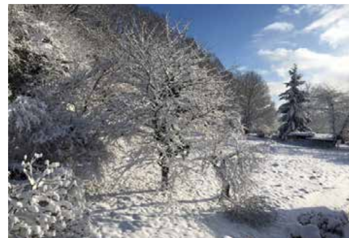
Jetzt das Fenster öffnen und lüften? Unbedingt!

Übrigens: Kalte und trockene Winterluft ist auch ideal, um einen feuchten Keller zu lüften! Quelle: Energie-Fachberater.de