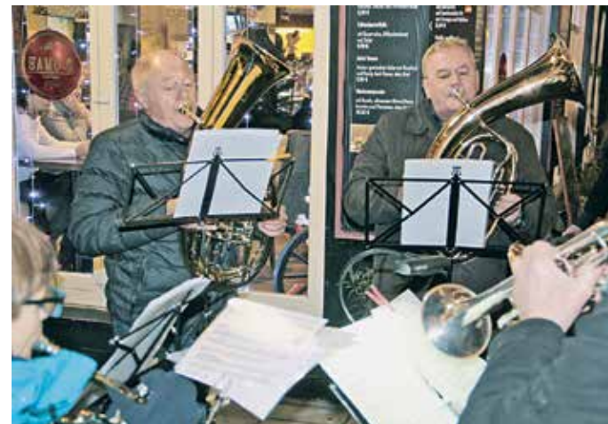
Die Hattinger Altstadtmusikanten, die sich vor zwei Jahren gegründet haben, sind bekannt für zünftige Blasmusik. Doch am letzten Adventswochenende erfreuten sie die Passanten in der Hattinger Altstadt mit klassischer Weihnachtsmusik. Altbekannte Weihnachtslieder wurden an verschiedenen Stellen gefühlvoll vorgetragen. So wurde viel Weihnachtsstimmung verbreitet, sowohl für die Zuhörer als auch für die Musiker.