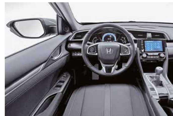
Die Verkleidungen haben eine anmutigere Oberfläche erhalten.

Seit 1979 ist das Autohaus Drössiger in Bochum an der Hattinger Straße 983 ansässig. Im traditionsreichen Honda-Stützpunkt finden Kunden Kompetenz und persönliche Beratung, die man von einem familiengeführten Betrieb erwartet. Das Unternehmen wurde 1965 gegründet. Als Vertragshändler liegt der Schwerpunkt auf der Marke Honda, aber auch im Bezug auf andere Fabrikate verfügen das Autohaus über umfassende Kenntnisse. Die moderne Werkstatt sowie das 8-köpfige Serviceteam bieten beste Voraussetzungen für erstklassige Serviceleistungen.