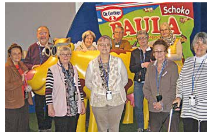
Die Seniorenunion Sprockhövel veranstaltet regelmäßige Ausflüge. Der letzte Ausflug in 2019 führte nach Bielefeld zum Unternehmen Dr. Oetker. Hier stand ein Werksrundgang auf dem Programm sowie eine Verkostung von Köstlichkeiten. Selbstverständlich konnten auch einige Leckereien für zuhause in die Tüte gepackt werden.

Reichlich bekappt mit Dr. Oetker-Tüten verließen die Seniorinnen und Senioren das Unternehmen mit vielen guten Eindrücken und zahlreichen Tipps zum Backen.