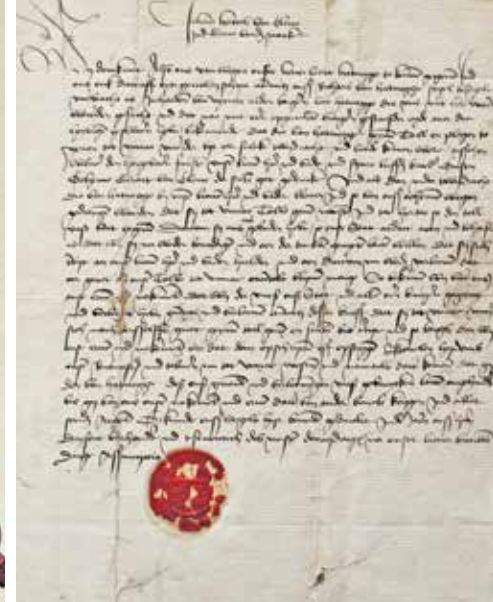
Dokumente aus dem Hattinger Stadtarchiv: Rechts die Abschrift der Urkunde von 1470, in der Hattingen erstmalig im Zusammenhang mit der Hanse erwähnt wird, und links die Gründungsurkunde der Westfälischen Hanse 1983. Dreizehn Jahre später trat Hattingen dem Bund bei.