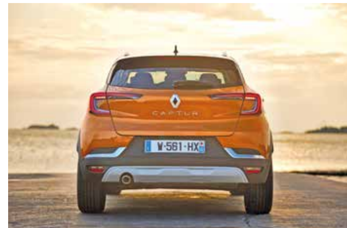
Der Autobahn- und Stauassistent kann über die Funktionen des adaptiven Tempopilots hinaus das Fahrzeug selbstständig lenken und sich dabei an den Fahrbahnmarkierungen orientieren. Der Fahrer muss jedoch ständig seine Hände am Lenkrad behalten.

Alle verteilen ihre Kraft auf die Vorderräder. Der Dreizylinder ist mit einem Fünf-Gang-Schaltgetriebe, die 131-PS- und die Diesel-Version entweder mit einem Sechs-Gang-Schalt- oder einem Sieben-Stufen-Doppelkupplungsgetriebe zu haben. In der Exklusiv-Variante „Intens“ gehört die Automatik zur Serie. Unterwegs auf Landstraßen beweist der Captur, dass typisch französische Fahrkultur in seinen Genen erhalten geblieben ist. Schlaglöcher und Unebenheiten der Fahrbahn müssen ihre Existenz schon dem Zorn der Götter zu verdanken haben, wenn sie ernsthaft die Hinterteile der Passagiere belästigen. Fahrwerk und Federung lassen so etwas ungern zu, obwohl sie relativ straff abgestimmt sind. Allerdings leidet darunter auch das Gespür der Fahrer für die Fahrbahnbeschaffenheit ein wenig. Dennoch lässt sich das Fahrzeug im Rahmen physikalischer Gesetze und dem Talent des Menschen am Steuer bei Bedarf auch einmal forschen um enge Kurven gefahrlos dirigieren.