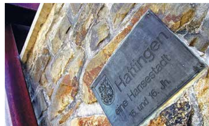
Die Aufschrift am Steinhagentor, die Hattingen als alte Hansestadt ausweist. Mitte August richtet die Stadt den 37. Westfälischen Hansetag aus.