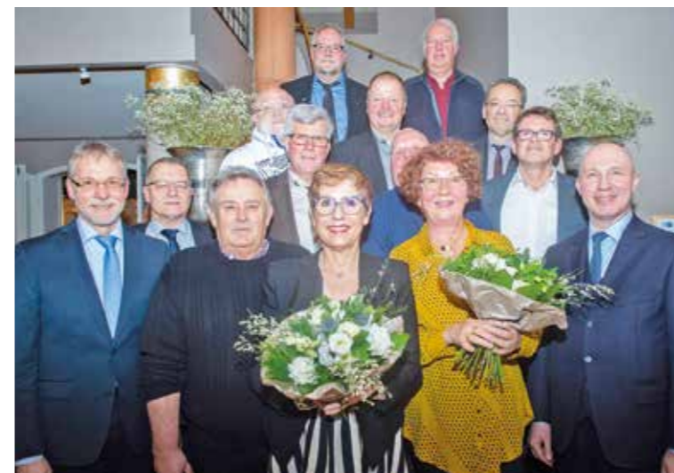
Noch „vor Corona“ hatte die Unternehmensleitung der AVU-Gruppe Arbeitsjubilare und Ruheständler des Jahres 2019 eingeladen.

Natürlich war die Zeitreise auch ein schöner Impuls für die geehrten Jubilare und Ruheständler, der Erinnerungen an das Arbeitsleben weckte. Für alle Ruheständler war es ein gelungener Abschluss ihres Berufslebens und für alle stand fest, dass sie weiterhin der AVU verbunden bleiben möchten.