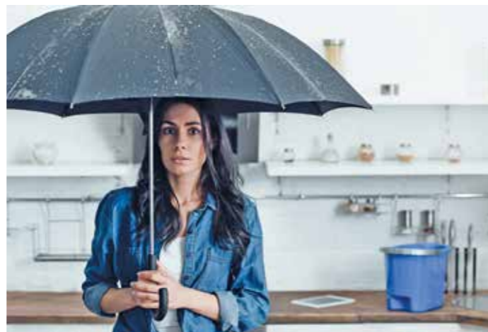
Wenn Wasser aus der Decke in die Wohnräume läuft, ist das scheinbar ein klarer Versicherungsfall. Aber nicht immer sind Versicherungen bereit, Schäden schnell auszugleichen. Wer in einer derartigen Situation kompetenten Rat braucht, kann sich an die Verbraucherzentrale wenden. Da die Wege zu den unabhängigen Beratern im ländlichen Raum mitunter sehr weit sind, helfen LandFrauenGuides vor Ort mit Erstinformationen zum Thema.

enGuide des Deutschen LandFrauenverbands: „Wenn die Versicherung den Schaden begutachtet und auf einen anderen Betrag kommt, bleibt man in der Regel auf einem Teil der Kosten sitzen.“ Während die Schadensregulierung bei kleineren Beträgen in der Regel schnell erledigt wird, kann sich der Vorgang bei höheren Summen oder dauerhaften Zahlungen, beispielsweise im Rahmen einer Erwerbsunfähigkeit, länger hinziehen. Hier sollten Betroffene dann auf Expertenrat setzen. Neutrale Ansprechpartner finden sich beispielsweise in den Verbraucherzentralen. Wer auf dem Land lebt, kann sich auch an LandFrauenGuides vor Ort wenden, die sich mit dem Thema ebenfalls gut auskennen. txn