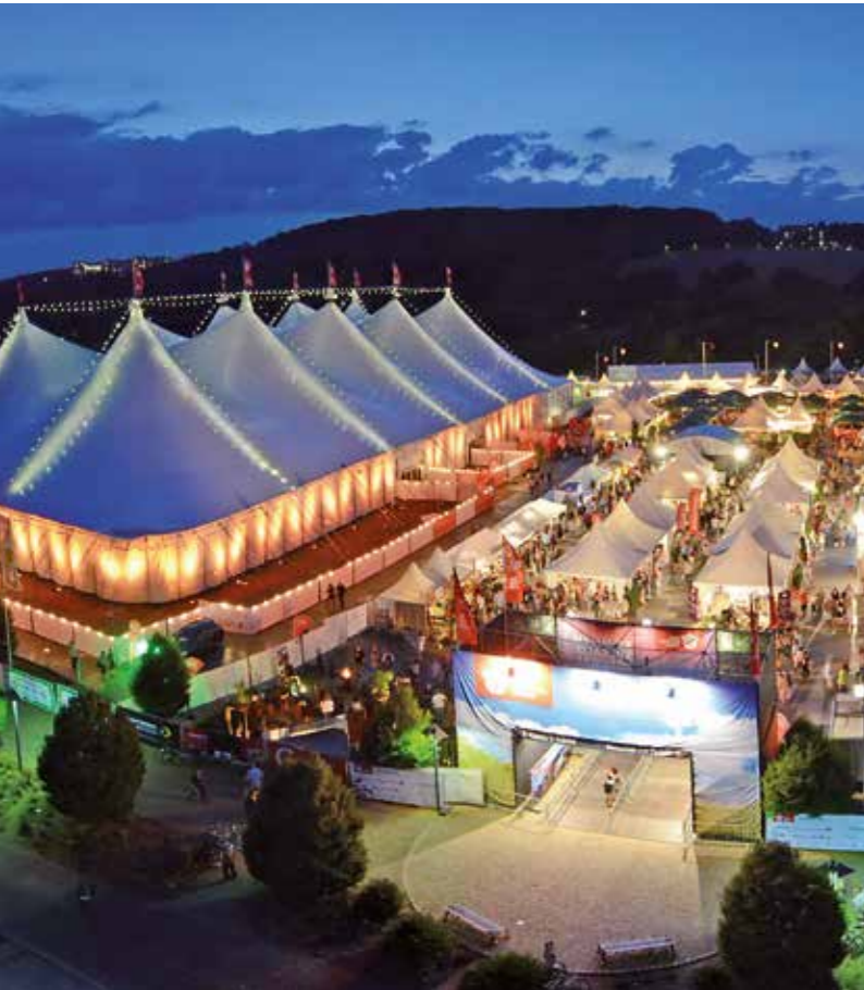
Die Veranstalter sind zuversichtlich, die imposanten Veranstaltungszelte im Spätsommer des nächsten Jahres ein dreizehntes Mal zu hissen.