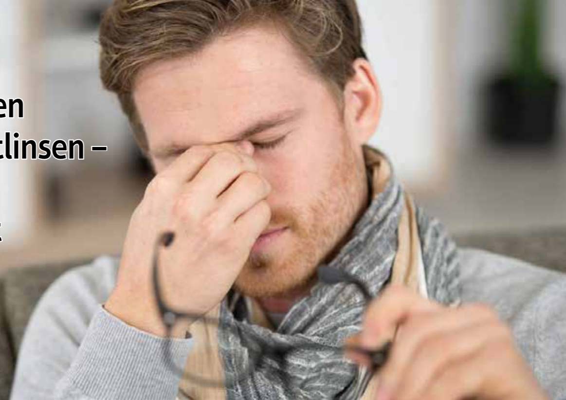
Coronavirus: Das sollten Sie nun unbedingt beachten

Bisher sind dem Bundesinstitut für Risikobewertung (BfR) keine Fälle bekannt, „dass sich Menschen auf anderem Weg, etwa ... durch Kontakt zu kontaminierten Gegenständen mit dem neuartigen Coronavirus infiziert haben.“ Denkbar sind aber Übertragungen über Oberflächen per Schmierinfektion. Regelmäßiges Reinigen von Brillenglas und -fassung ist daher, wie bisher auch, zu empfehlen.