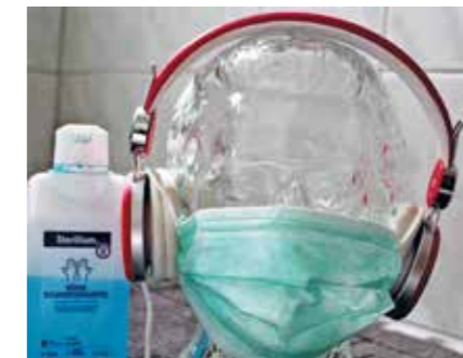
Desinfektionsmittel und Atemmaske: In der Coronakrise sehr begehrte Produkte.

So erfordert der Umgang mit infizierten Menschen in der Arztpraxis immer Schutzmaßnahmen. Schließlich können meist erst Laborbefunde nachweisen, woran genau ein Mensch erkrankt ist. Die wichtigste Schutzmaßnahme ist das Händewaschen. Das Robert-Koch-Institut erklärt dazu: „Die Händehygiene dient der Vermeidung der Kontamination der Hand durch geplantes Vorgehen bzw. Tragen von Schutzhandschuhen, wann immer ein Kontakt mit Blut, Sekreten oder Exkreten bzw. Schleimhaut, nicht-intakter Haut oder entsprechend kontaminierten Oberflächen zu erwarten ist. Sie umfasst zudem die Händedesinfektion mit alkoholischen Präparaten vor und nach dem direkten Patientenkontakt sowie nach dem Ausziehen von Schutzhandschuhen.“