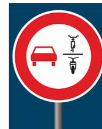
▲ Überholverbot von einspurigen Fahrzeugen