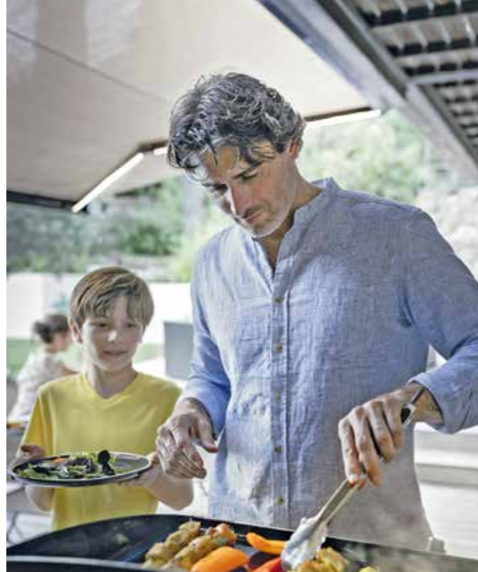
Ob Balkon oder Terrasse: Zeit für die angenehmen Dinge des Lebens sollte genügend bleiben – fürs Grillen beispielsweise.

Man hat zusätzlich zum Catering die Möglichkeit, Workshops zu buchen, um von den Profis zu lernen – sowohl im eigenen Garten als auch in den Örtlichkeiten des Ladenlokals am Glashüttenplatz. Vom Grill, über Grillzubehör und Outdoor-Cooking-Geräten bis hin zu Lebensmitteln und Gewürzen für auf den Grill gibt es hier alles zu kaufen, was leidenschaftliche Griller oder solche, die es noch werden möchten, brauchen. Dabei ist das Team um Axel Kähne und Markus Mizgalski stets im Dienste des guten Geschmacks unterwegs. Egal, ob sie bei jemandem grillen, eigene Produkte entwickeln, Tipps und Tricks verraten oder aber nach neuen Grillgeräten und Zubehör für den Laden am Glashüttenplatz suchen. Beim Thema Fleisch verfolgen die beiden Geschäftsführer eine nachhaltige „Fleischphilosophie“: Mit der eigens entwickelten Marke Ruhr-Rind verwendet das Team von pottfeuer Fleisch aus regionaler und artgerechter Haltung. Sollte Fleisch dennoch importiert werden müssen, wird auf Weidehaltung und ein schonendes Schlachtverfahren geachtet. Volker Hoven betont: „Mit pottfeuer haben wir einen wahren Fund am Glashüttenplatz. Das Team sprüht vor tollen Ideen und steckt viel Arbeit in die Weiterentwicklung ihres Geschäfts. Das ist wirklich bemerkenswert.“