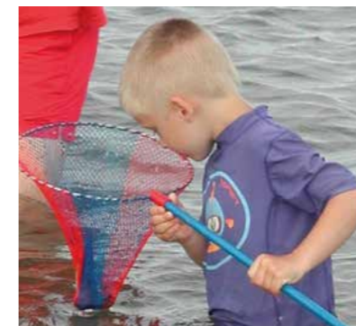
Wer in Nordrhein-Westfalen fischen möchte, muss Inhaber eines Fischereischeins sein. Dieser kann nur Personen erteilt werden, die das 14. Lebensjahr vollendet und die Fischerprüfung erfolgreich abgelegt haben.

Naturverbundenheit, Erholung, Entspannung und die Möglichkeit, einen leckeren Fisch auf dem Teller zu haben sind Gründe eine Angel auszuwerfen. Wer dies machen möchte, muss vorher allerdings die Fischerprüfung bestanden haben. 2019 stellten sich insgesamt 158 Bürger den Aufgaben und Anforderungen, 142 erfolgreich. Im schriftlichen Prüfungsteil müssen jeweils zehn Fragen aus sechs Prüfungsgebieten beantworten. Hierzu zählen beispielsweise allgemeine Fischkunde, Natur- und Tierschutz sowie Gesetzkunde. Im praktischen Teil gilt es, die Angelgeräte waidgerecht zusammenzustellen, nachzuweisen sind ausreichende Kenntnisse über die heimischen Fische, Neunaugen und Krebse.