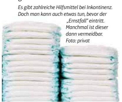
Es gibt zahlreiche Hilfsmittel bei Inkontinenz. Doch man kann auch etwas tun, bevor der „Ernstfall“ eintritt. Manchmal ist dieser dann vermeidbar.

Mögliche Ursachen können Nervenschäden oder -reizungen infolge einer Operation sein. Aber auch neurologische Erkrankungen wie Multiple Sklerose, Parkinson, Alzheimer, ein Hirntumor oder Schlaganfall oder Nervenschäden infolge eines langjährigen Diabetes gehören zu den Ursachen. Ständige Reizungen der Blase, zum Beispiel durch Blasensteine oder Harnwegsinfekte, können auch eine Rolle spielen. Die Urologie beschäftigt sich mit den harnbildenden und harnableitenden Organen bei Männern und Frauen. Dies sind Nieren, Harnblase, Harnleiter und Harnröhre. Ärzte unterscheiden verschiedene Arten der Inkontinenz: Belastungsinkontinenz / Stressinkontinenz, Dranginkontinenz, Mischinkontinenz, Reflexinkontinenz, Überlaufinkontinenz, Enuresis nocturna (nächtliches Einnässen), Funktionelle Inkontinenz und Stuhlinkontinenz. Es gibt auch verschiedene Medikamente und Wirkstoffe, die