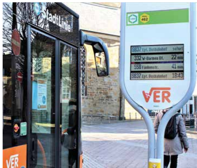
In der Coronakrise ist das Einsteigen vorne beim Busfahrer nicht möglich. Damit soll eine Möglichkeit der Kontaktaufnahme und somit der möglichen Ansteckung vermieden werden.

Gute Beschreibungen sind wichtig, um zu leiten und Informationen zu liefern. Haptik, schnelle Lesbarkeit, Kontraststärke und prägnante Informationen sind von besonderer Bedeutung. Individuelle Schilder, auf unterschiedlichen Systemen und für verschiedene Anwendungen sind informative und klassische Hilfsmittel zur Besucherführung. Barrierefreie Schilder mit taktilen Elementen ermöglichen - wie in diesem Fall - auch Blinden und Menschen mit Sehbehinderung die Mög-