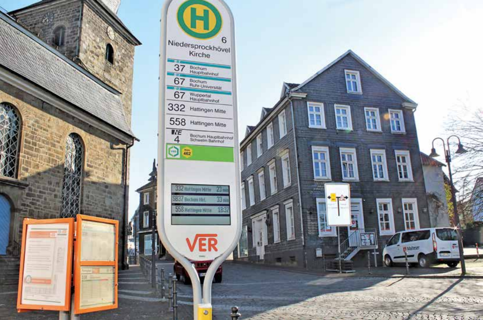
Intelligente Schilder helfen am Busbahnhof in Niedersprockhövel. Für Sehbehinderte und Blinde gibt es deutliche Erleichterungen. An einem gelben Kasten mit der Aufschrift „Info“, zu lesen sowohl in regulären Buchstaben als auch in Blindenschrift, befindet sich ein Knopf. Wird er gedrückt, meldet sich eine Stimme. „332 Richtung Wuppertal-Barmen Bahnhof, in drei Minuten“, sagt die Stimme aus dem Computer dann beispielsweise. Auch die nachfolgenden Fahrten werden vorgelesen.