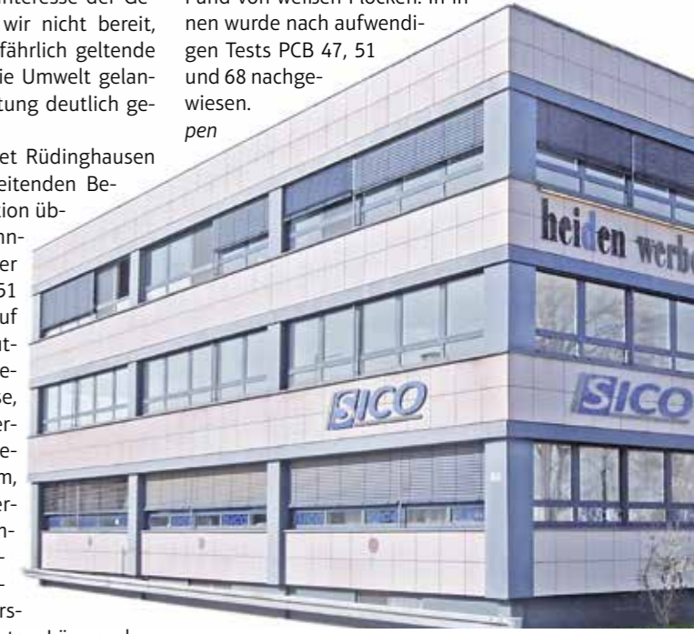
Sico versichert, künftig nur noch chlorfreie Vernetzer bei der Produktion zu benutzen.

Insgesamt gibt es 209 „polychlorierte Biphenyle“. Ihre Produktion ist seit 1989 verboten, seit 2013 gelten sie als krebserregend. Dem Austritt der PCB-Varianten 47, 51 und 68 aus silikonverarbeitenden Betrieben ist das Landesamt für Natur, Umwelt und Verbraucherschutz Nordrhein-Westfalen in Ennepetal auf die Spur gekommen. Ausgangspunkt war der Fund von weißen Flocken. In ihnen wurde nach aufwendigen Tests PCB 47, 51 und 68 nachgewiesen.