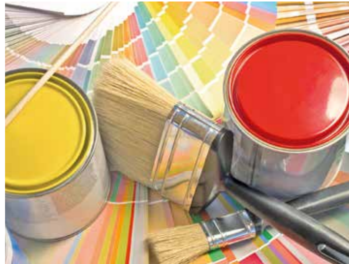
Mit „Blauem Engel“, „Emicode“ oder „Natureplus“ zertifizierte Materialien stellen sicher, dass mit dem Baustoff keine bedenklichen Chemikalien ins Haus kommen.