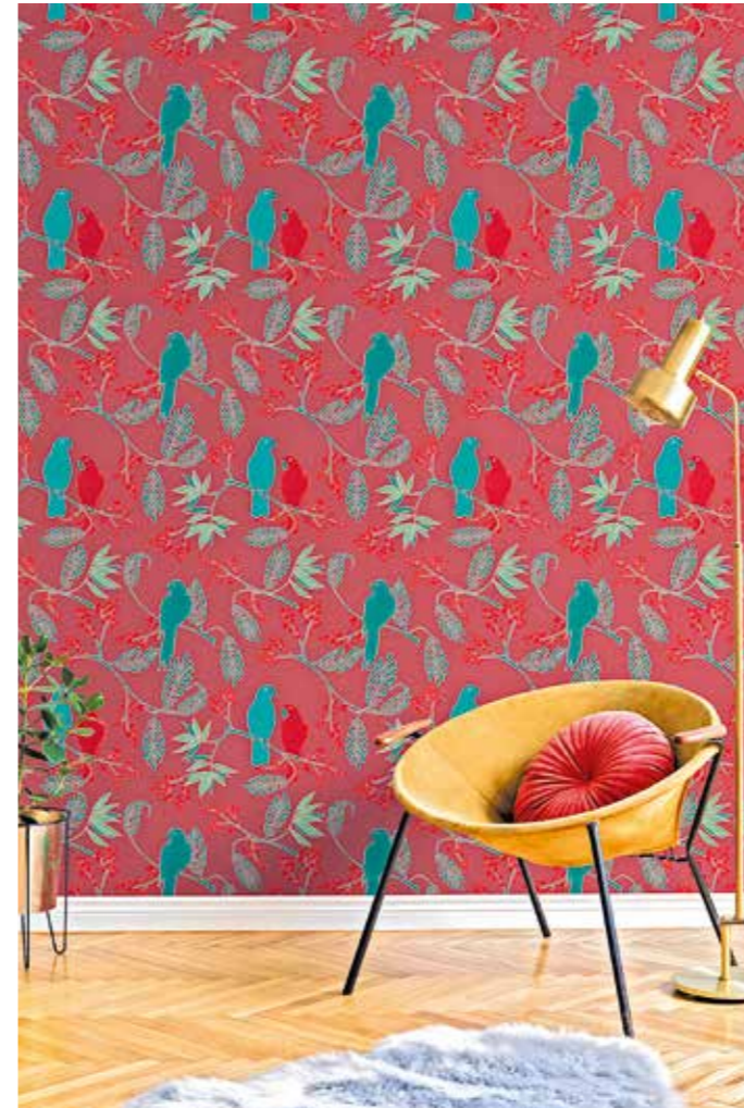
Tiere fühlen sich auch an der Wand wohl: Papageien in reduziertem Dschungel-Look.

An sogenannten Mobilitätsstationen können Verkehrsteilnehmer mühelos das von ihnen genutzte Verkehrsmittel wechseln, zum Beispiel von der Bahn aufs Leihrad oder zum „CarSharing“-Standort. Hat die Stadtverwaltung bereits angedacht, mit Fördermitteln aus dem NKI den Aufbau solcher Mobilitätsstationen anzuschließen?“