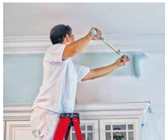
Gesunder Anstrich für ein besseres Wohnklima: Versierte Fachbetriebe haben das nötige Know-how, um bei Renovierungsarbeiten ökologisch einwandfreie Materialien einzusetzen. Der Vermittlungsservice der „Gelben Seiten“ hilft, den richtigen Maler zu finden.

Wer seinen Wohnräumen einen neuen Look verpassen und dabei keine Kompromisse in puncto Gesundheit eingehen möchte, findet auf Gelbseiten.de Unternehmen mit dem nötigen Expertenwissen. Geht es speziell um die Renovierung von Innenwänden, bieten die „Gelben Seiten“ aber noch mehr: Mit dem Maler Vermittlungsservice erhalten Nutzer auch in Zeiten überbuchter Handwerksbetriebe schnell und unkompliziert Hilfe. Dazu einfach auf Gelbseiten.de gehen und eine Anfrage erstellen. Anhand der Angaben werden Fachbetriebe ermittelt und informiert. Anschließend erhält der Nutzer eine Übersicht aller Profis, die Interesse an dem Auftrag haben und diesen zeitnah bearbeiten können. Die eigenen Adressdaten werden erst übermittelt, nachdem man sich für einen Anbieter entschieden hat. txn