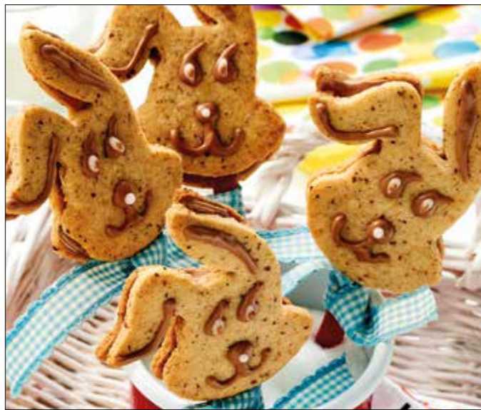
Die leckeren Hasenlollis aus Keksteig bringen Abwechslung auf den Ostertisch.

2. Hasen auf einem mit Backpapier ausgelegten Back-