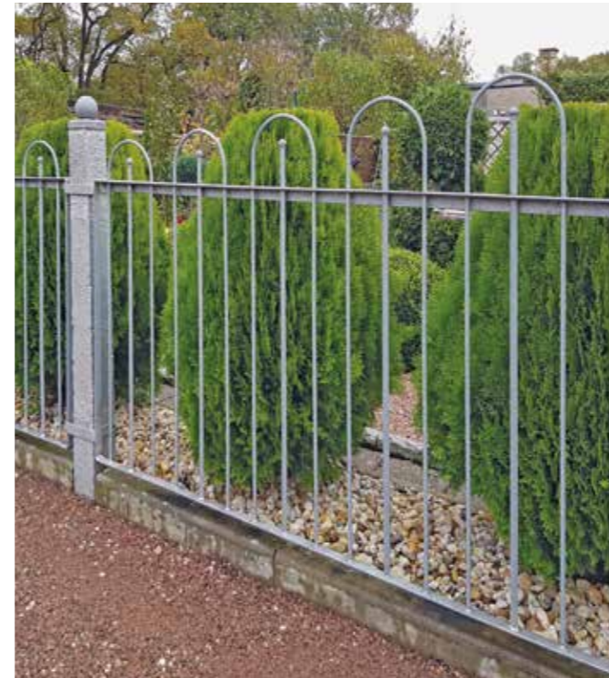
Es geht nicht nur um die optische Wirkung, sondern auch um die Wertsteigerung des Eigenheims: Das edle Erscheinungsbild feuerverzinkter Grundstücksbegrenzungen sichert das Eigentum und punktet zugleich als gestalterisches Highlight mit nahezu unverwüsllichem Charme.

Travertin, seit Jahrhunderten als hochwertiger Naturstein geschätzt, ist der ideale Kalkstein für Zuhause. Böden oder Wände aus Travertin verströmen sowohl im Innenbereich als auch auf der Terrasse und im Garten ein warmes mediterranes Flair. Durch sein breites Farbspektrum bietet Travertin etwas für jeden Geschmack: Dezentere Beige bringt die Einrichtung richtig zum Vorschein, dunkles Gelb oder Braun harmonieren mit den Grüntönen der Pflanzen im Garten und grau-blaues Travertin verleiht einer Inneneinrichtung das gewisse Etwas. mc-stone.de