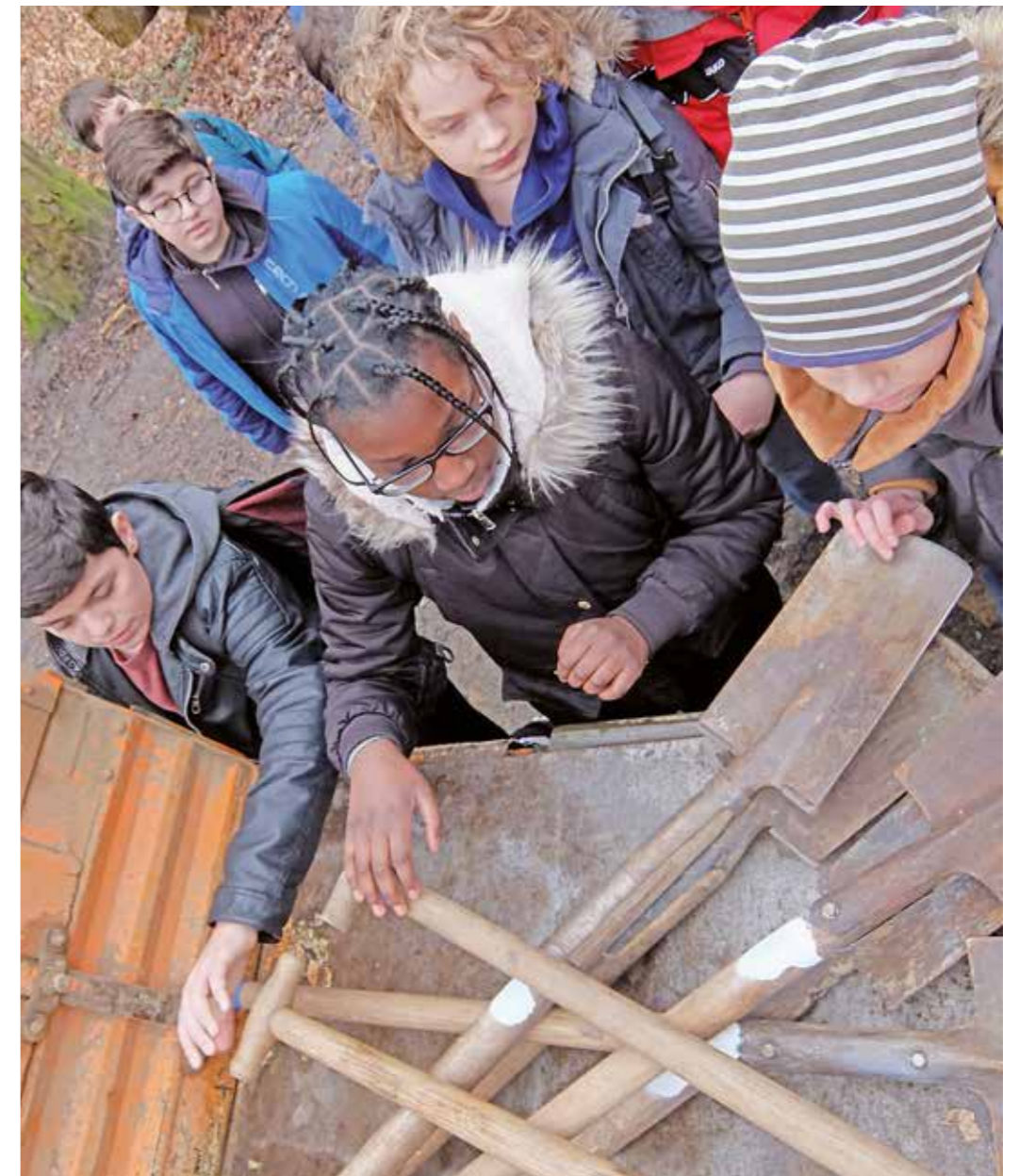
An die Spaten, fertig, los! Die Teilnehmer der Arbeitsgemeinschaft „Plant for the Planet“ am Ruhrgymnasium gingen mit Lehrern, einigen Eltern und Forstbeamten ins Herrenholz an der Ardeystraße und pflanzten Setzlinge zur Aufforstung des Stadtwaldes.

„Plant for the planet“ ist ein weltweites Bündnis mit lokalen Teilnehmern. Das Ziel der Schülerinitiative ist, bei Kindern und Erwachsenen ein Bewusstsein für globale Gerechtigkeit und den Klimawandel zu schaffen und letzteren aktiv durch Baumpflanzaktionen zu bekämpfen. Jeder gepflanzte Baum wird von den Schülern zum Symbol für Klimagerechtigkeit ernannt. Auf der Internetseite der Bewegung ( plant-for-the-planet.org ) steht unter anderem: „Anfangen hat alles mit einem Schulreferat – heute ist Plant-for-the-Planet eine globale Bewegung mit einem großen Ziel: die Menschheit motivieren, 1000 Milliarden Bäume zu pflanzen. Als Zeitjoker im Kampf gegen die Klimakrise. An uns wurden schon mehr als 13,6 Milliarden Bäume gemeldet.“