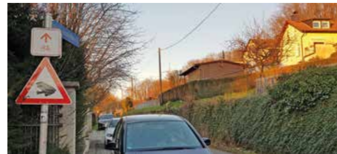
Wie an vielen Stellen in Witten so sollen auch die Autofahrer an der Straße "Im Hummelbeck" daran erinnert werden, auf querende Amphibien zu achten und nur mit vermindertem Tempo zu fahren. Die Amphibien kehren jedes Jahr in die Gewässer zurück, in die sie selbst eine Entwicklung vom Ei über die Kaulquappe zum Frosch oder zur Kröte mitgemacht haben. Dabei legen die Tiere zwischen Überwinterungsort, Laichgewässer und Sommerquartier Wege von einigen Metern bis zu einigen Kilometern zurück.