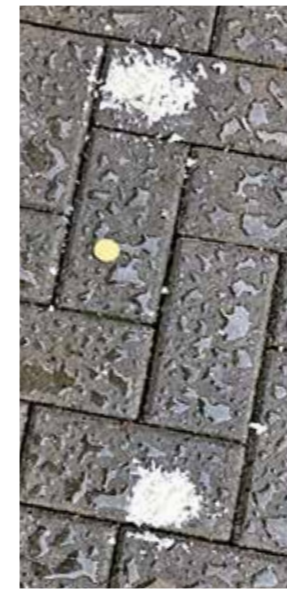
Flocken wie diese waren im Umfeld des Unternehmens gefunden worden.

Anders als bei der chlorhaltigen Version ist damit ausgeschlossen, dass hochgradig mit PCB 47, 51 und 68 belastete weiße Flocken entstehen und in die Umwelt gelangen. Dem gleichen Ziel dient die Installation eines zweiten Abluftsystems. Da sich in den vorhandenen Kaminen verkrustete Flocken befinden, die bei der Produktion freigesetzt werden könnten, setzt das Unternehmen auf eine