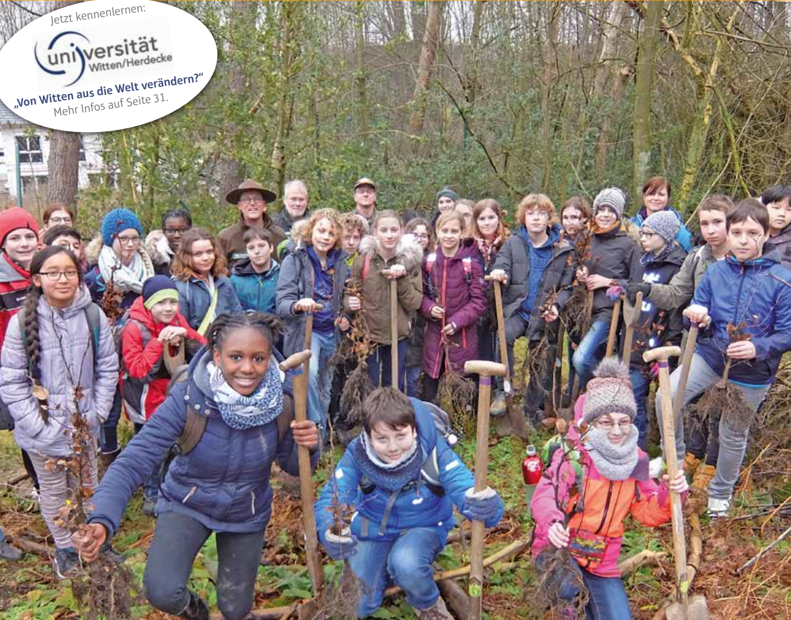
Jeder gepflanzte Baum wurde von den Schülern des Ruhr-Gymnasiums zum Symbol für mehr Klimagerechtigkeit ernannt. Lesen Sie auch den Bericht auf Seite 13.

„Von Witten aus die Welt verändern?“ Mehr Infos auf Seite 31.