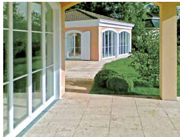
Wer sich nicht ganz sicher ist, welcher Stein es sein soll, hat auch die Möglichkeit, beim Fachhandel Muster zu bestellen.

Die Wirkung des Travertins kann je nach Wunsch unterschiedlich eingesetzt werden. Nicht nur die Farbe des Steins, die von Beige über Gelb und Braun bis hin zu Grau-Blau reicht, lässt Raum für individuelle Gestaltungsmöglichkeiten.