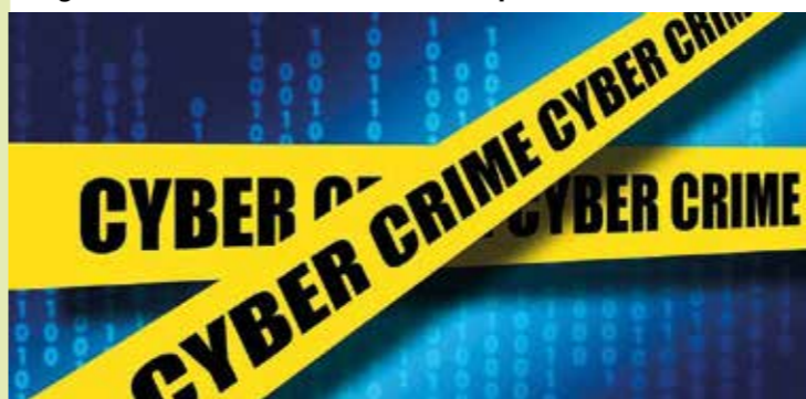
Image-Serie: Wie tickt der Mensch?

„Cyberattacken, Datenschutzverstöße und Datendiebstahl gehören zu den negativen Begleiterscheinungen einer zunehmend digitalisierten Welt. Für Unternehmen können sie gefährlich und teuer werden: Ein Angriff auf die Kommunikations- und Informationstechnologie der Firma, Praxis oder Kanzlei birgt nicht nur die Gefahr einer Betriebsunterbrechung. Es gilt auch, sich vor Schadenersatzansprüchen zu schützen.“